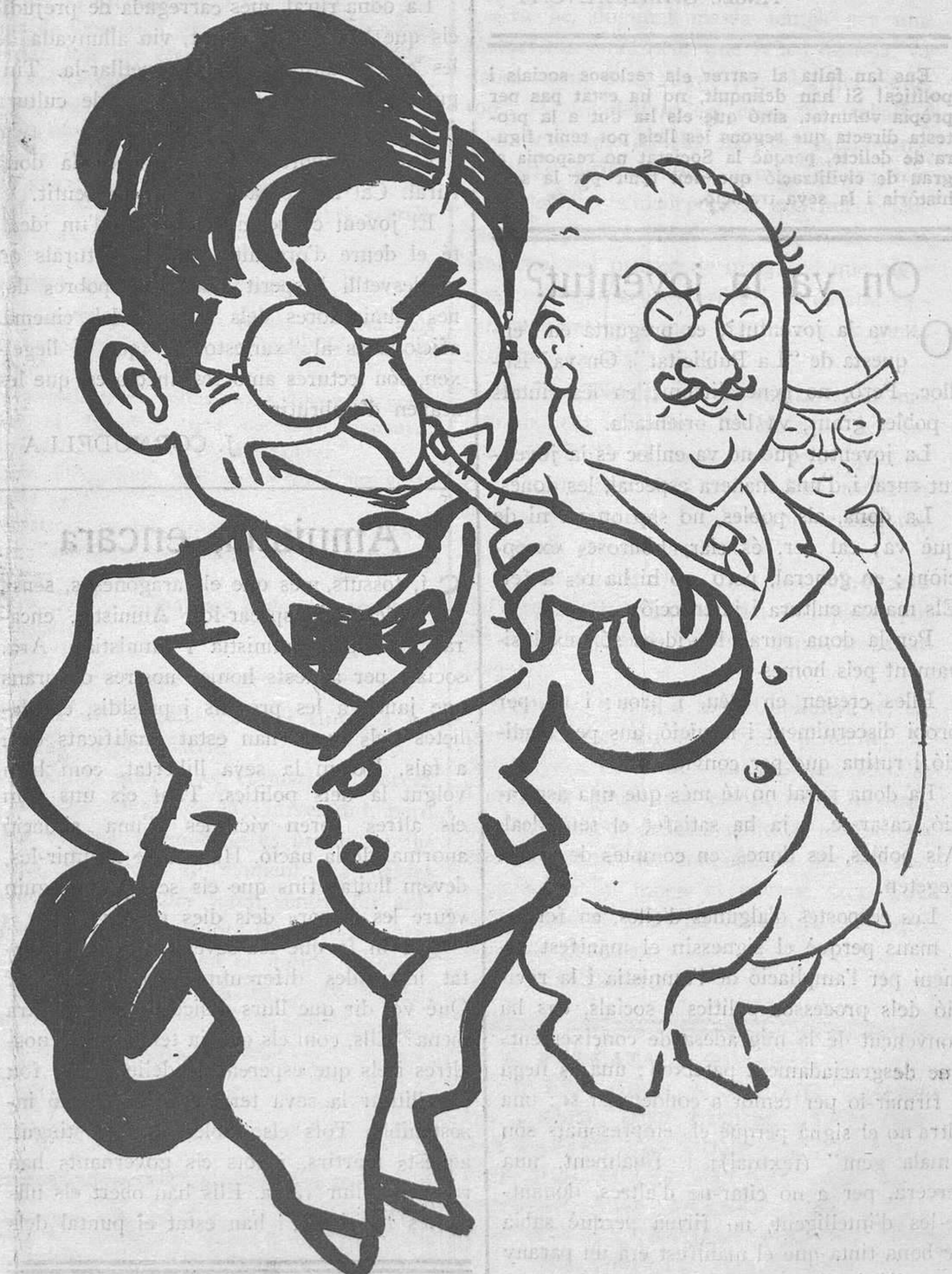
S'propa la lluita

Acció, acció, acció. Clam universal i unànime, que sembla una obsessió de l'hora intensa que passa. Que ho sembla, però que no ho és. Això és quelcom més important que una mania. Es l'expressió d'un sentiment pregon, d'una convicció arrelada, d'una necessitat que no té espera.