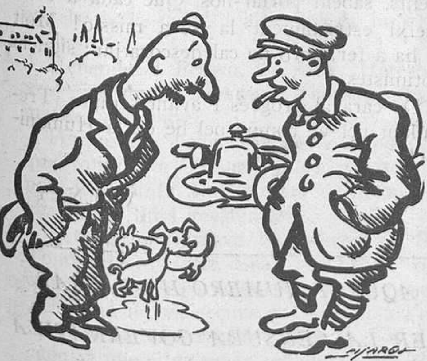
—Noi, hi ha una humitat... —Es que hi ha molt de mullader, i no ho sembla.