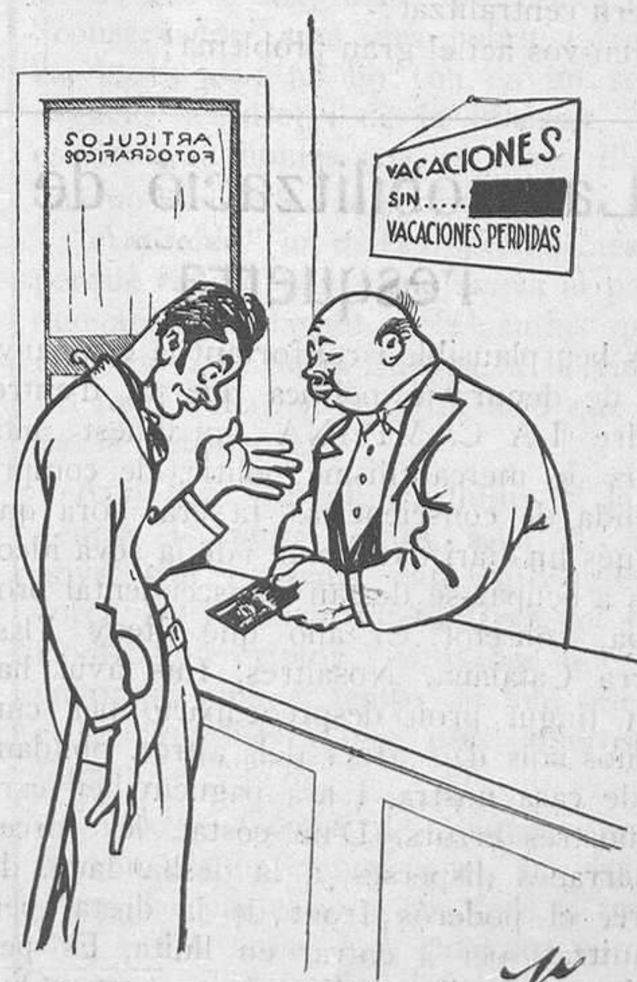
—Em sembla que no he quedat gaire bé. —Es que no devia estar gaire tranquil.