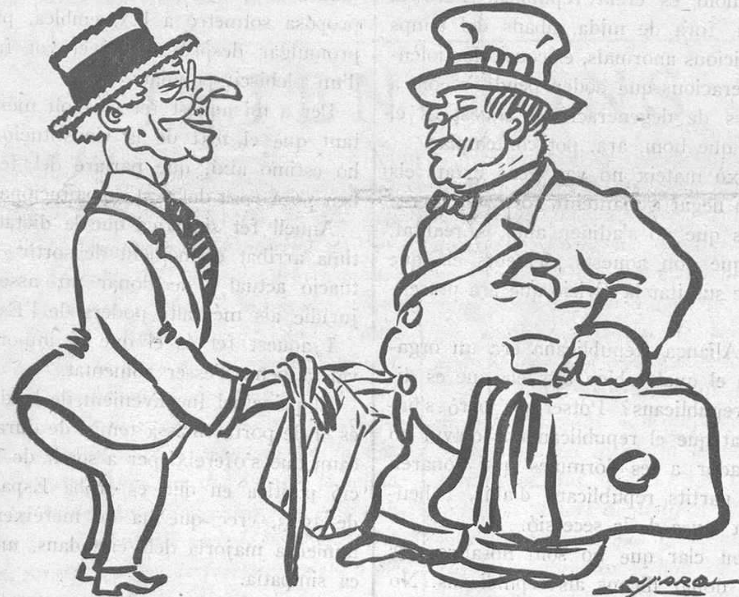
EL SEGUR DE VIDA DELS VIATGERS

—Fa dies que no em diu res ningú. —Veuràs: tenen por d'anar a la "sombra".