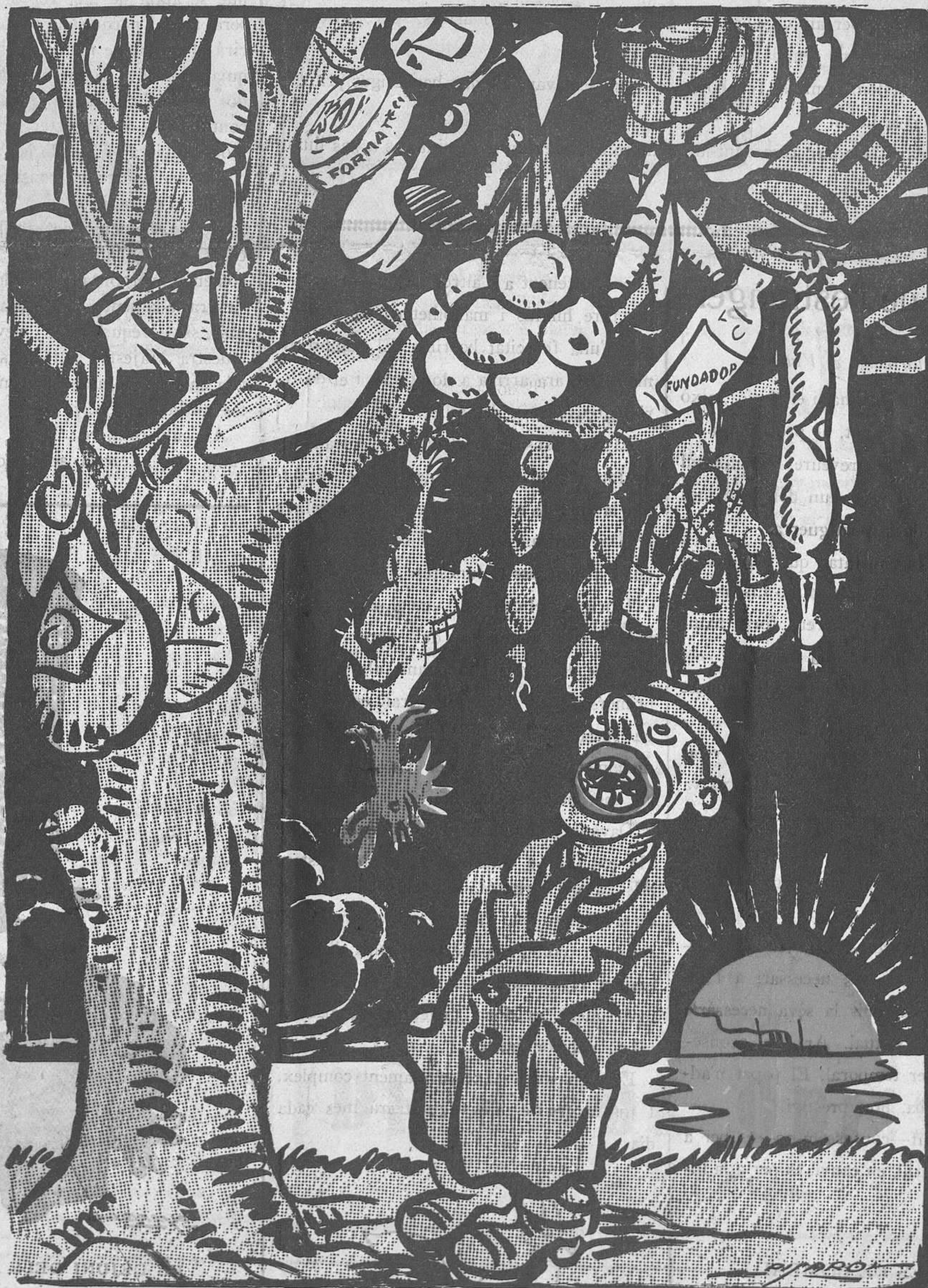
LES PRIMERES FULLES

Posada la dona en aquest pendent, és molt difícil que conservi el seu seny, la se-