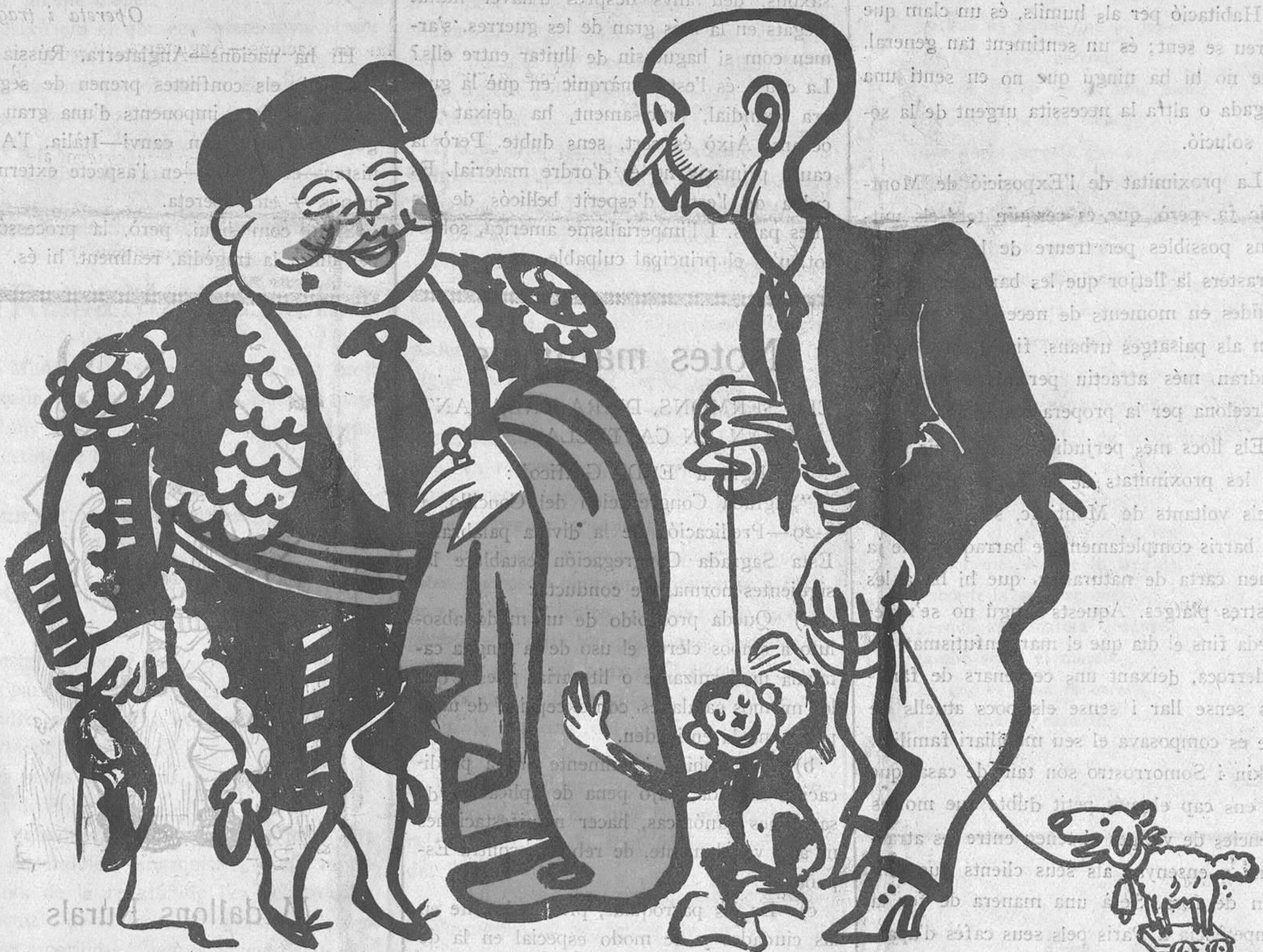
EL CAÇADOR MASCAROTS

PREUS DE SUBSCRIPCIÓ: Fora de Barcelona cada trimestre: ESPANYA, pessetes 1'50. — ESTRANGER, 2'50