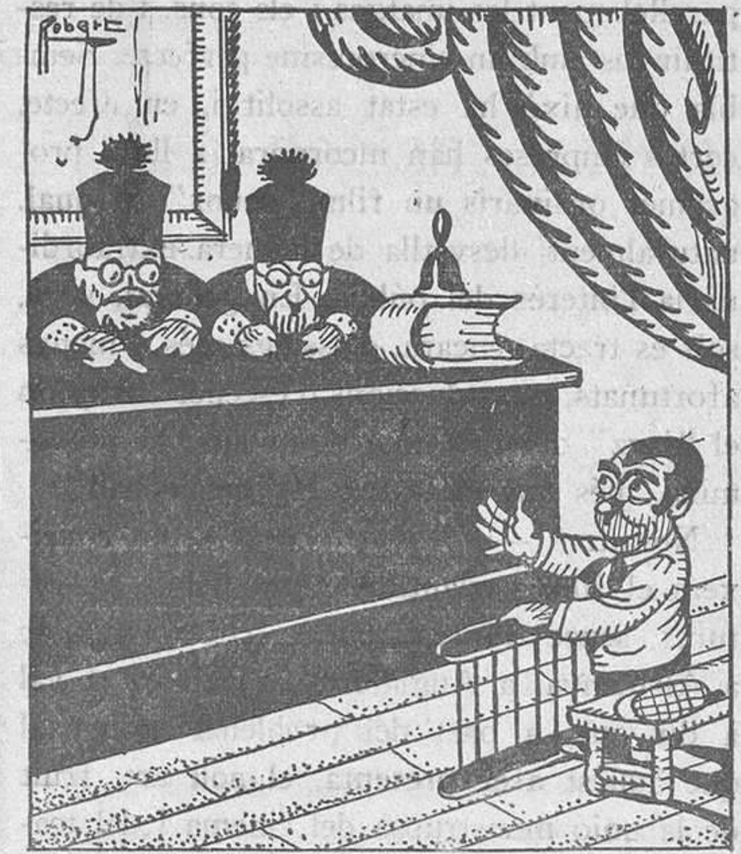
ATACS A L'IDIOMA

—Ca!, això no és veritat. Si ho fos, també li grinyolaria la levita.