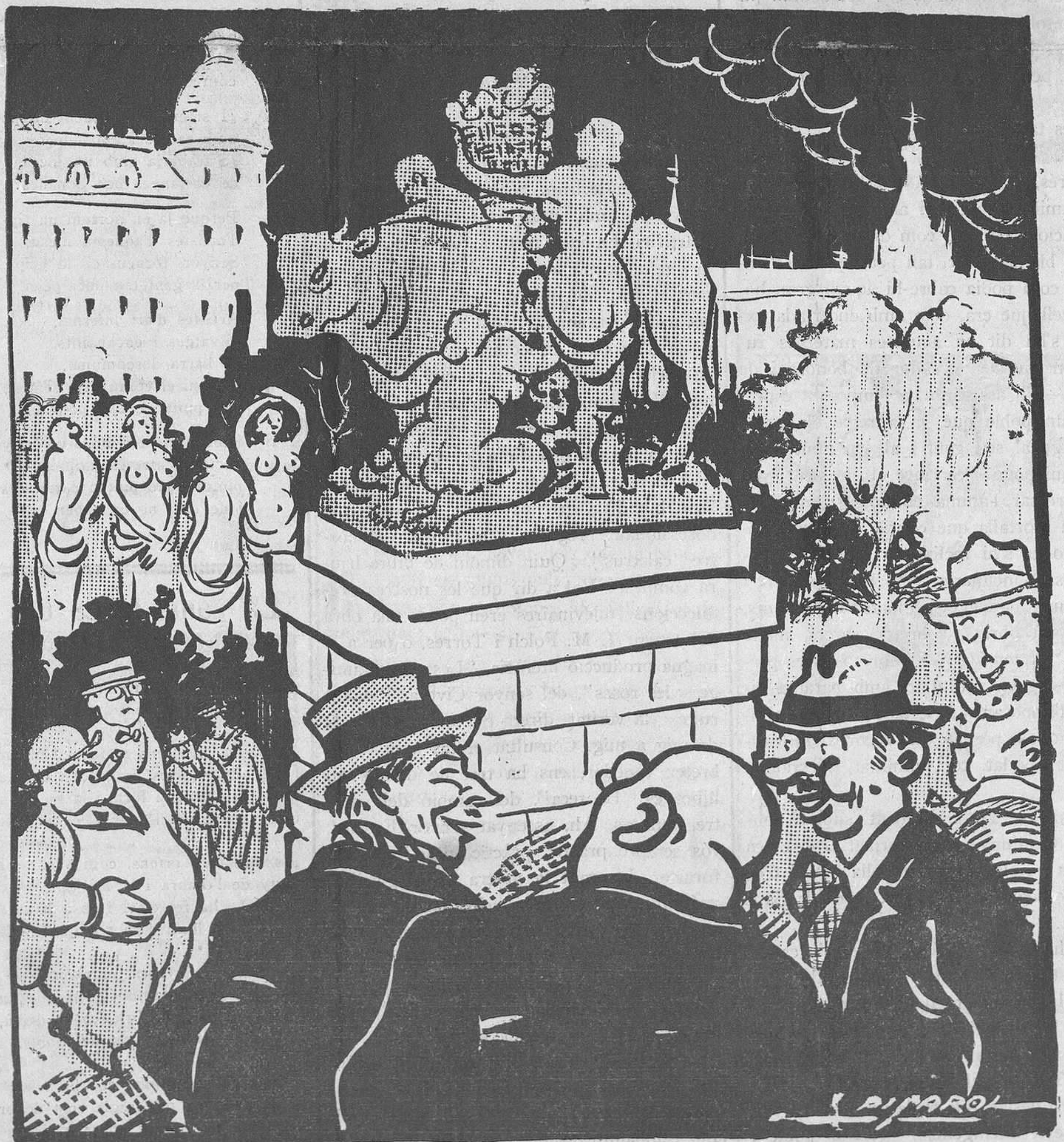
COMENTARI DEL POBLE