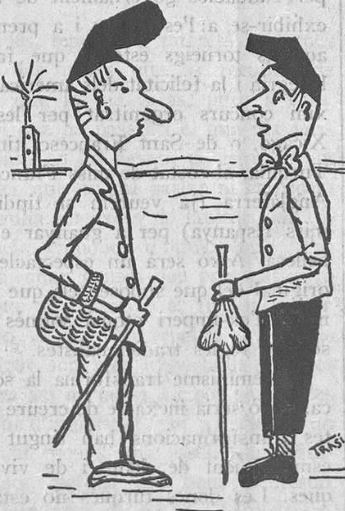
LA PARLA IDILLICA

P. A.: Anirà.—J. A. i M.: Procurarem fer-li cabre, malgrat la seva excessiva llargada; però cal que us advertim que la majoria dels articles no podem publicar-los per la seva extensió. Es cosa comprovada—encara que a molts els estranyi—que és més difícil de fer articles curts que llargs.—M. S.: Anirà... si podem.—J.: Va bé.—J. J.: Id. Id.—J. S. P.: Ho farem anar amb molt gust.—S. M.: Anirà.—"Un que no hi era": Està ben escrit, però és allargassat i poc vibrant. Imp. La Campana i L'Esquella. Olm, 8.—Barna.