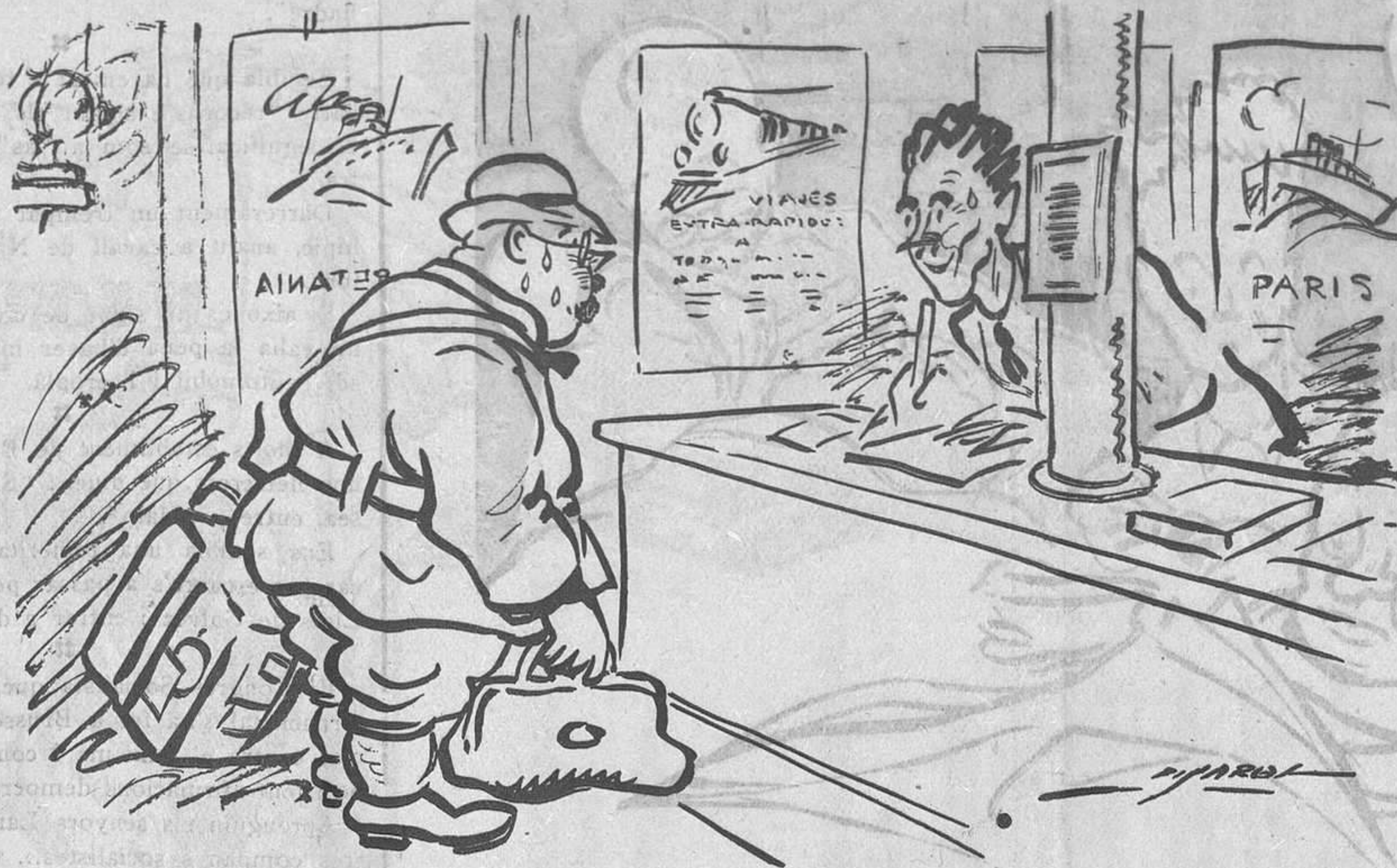
FUGINT DE LA CALOR

—Per a on vol el bitllet? —Per a La Terra del Foc, a veure si estaré més fresc.