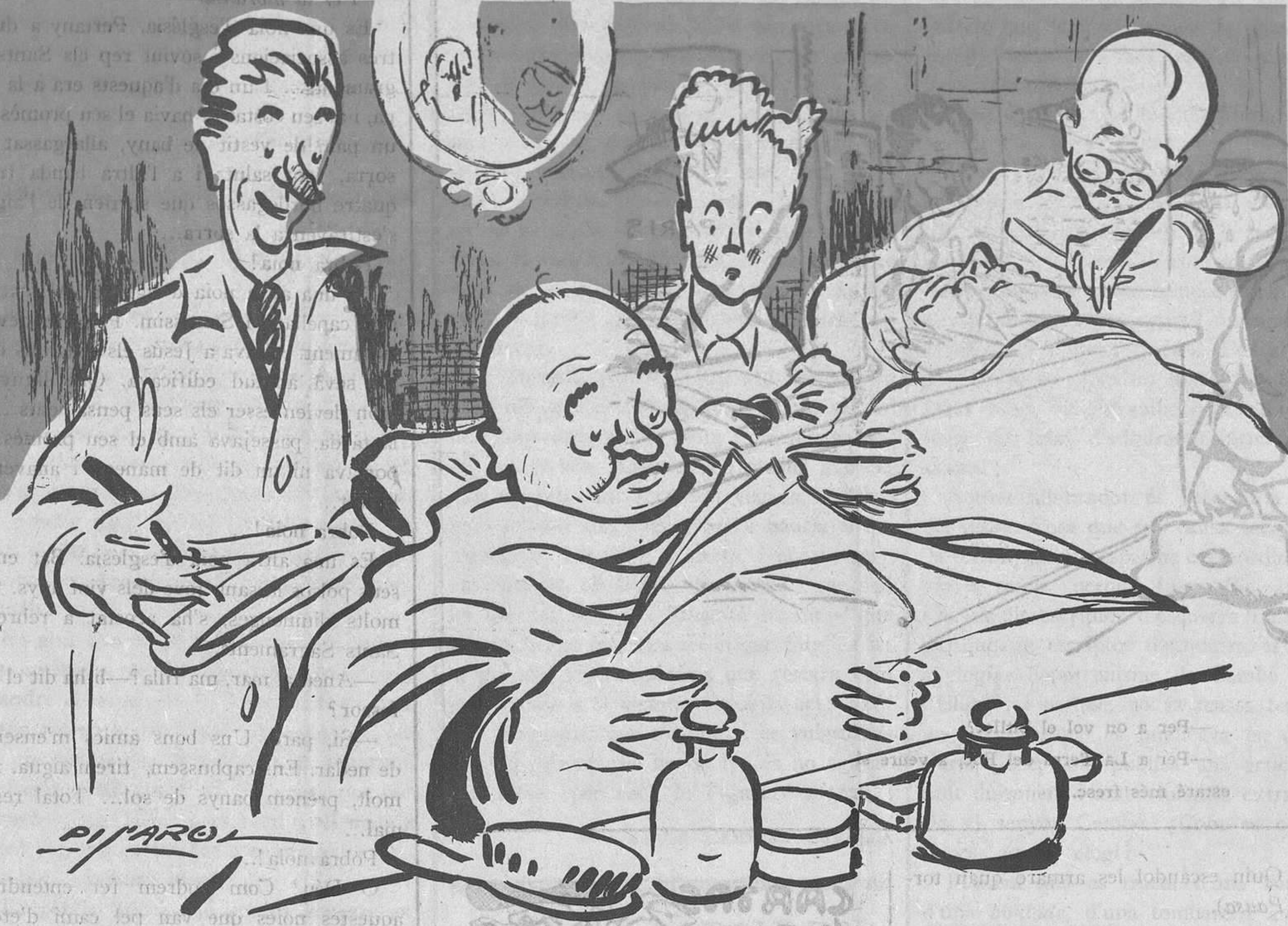
A CASA EL BARBER

—Ahir van afaitar deu melons a la Plaça de la Lluna. —No comprenc com pot ésser. —Ara li demostraré.