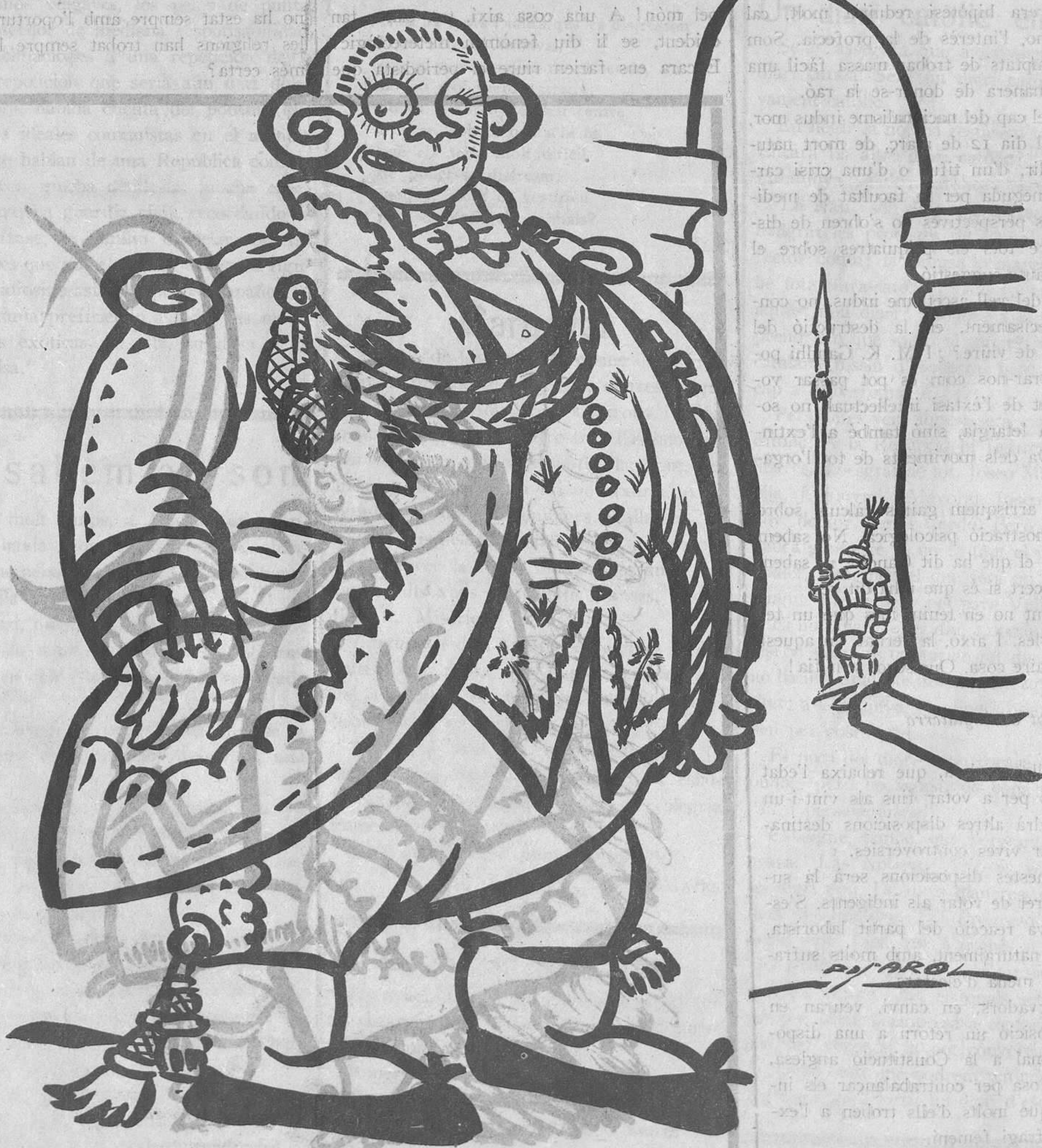
L'HORA DE L'ALEGRIA

Impremta La Campana i L'Esquella Oim 8, Barcelona.