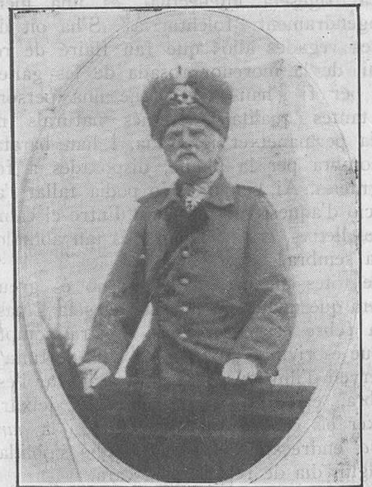
Mackensen, el general de 1914, arengant les tropes

Impremta La Campana i L'Esquella: Oim. 8, Barcelona