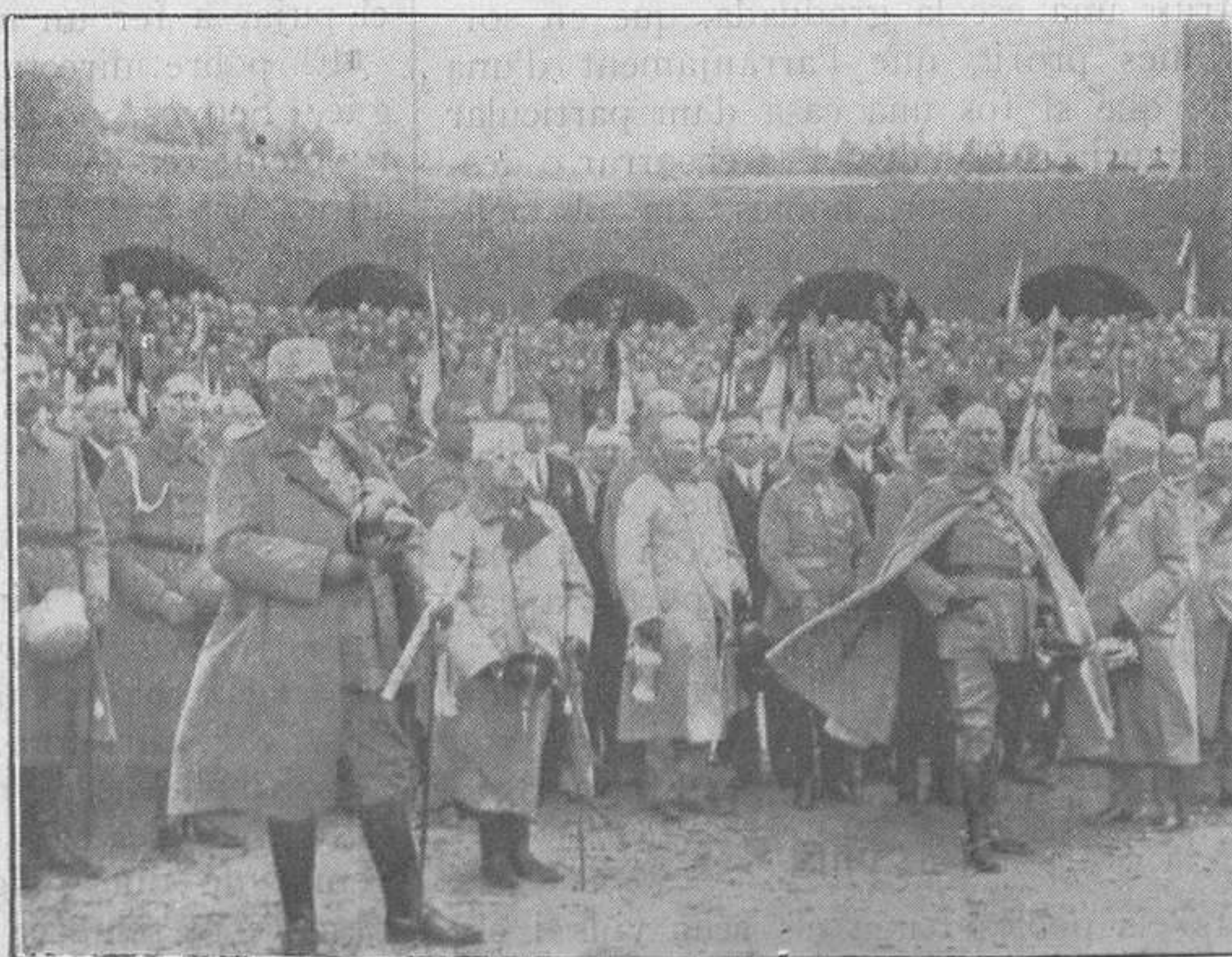
EL RESORGIMENT D'ALEMANYA

Mireu si és gran el conflicte de la vida cara, que a Londres, per a què la gent vagi al teatre, al "Majestic Theater", els han de convidar a prendre te... i encara no hi van