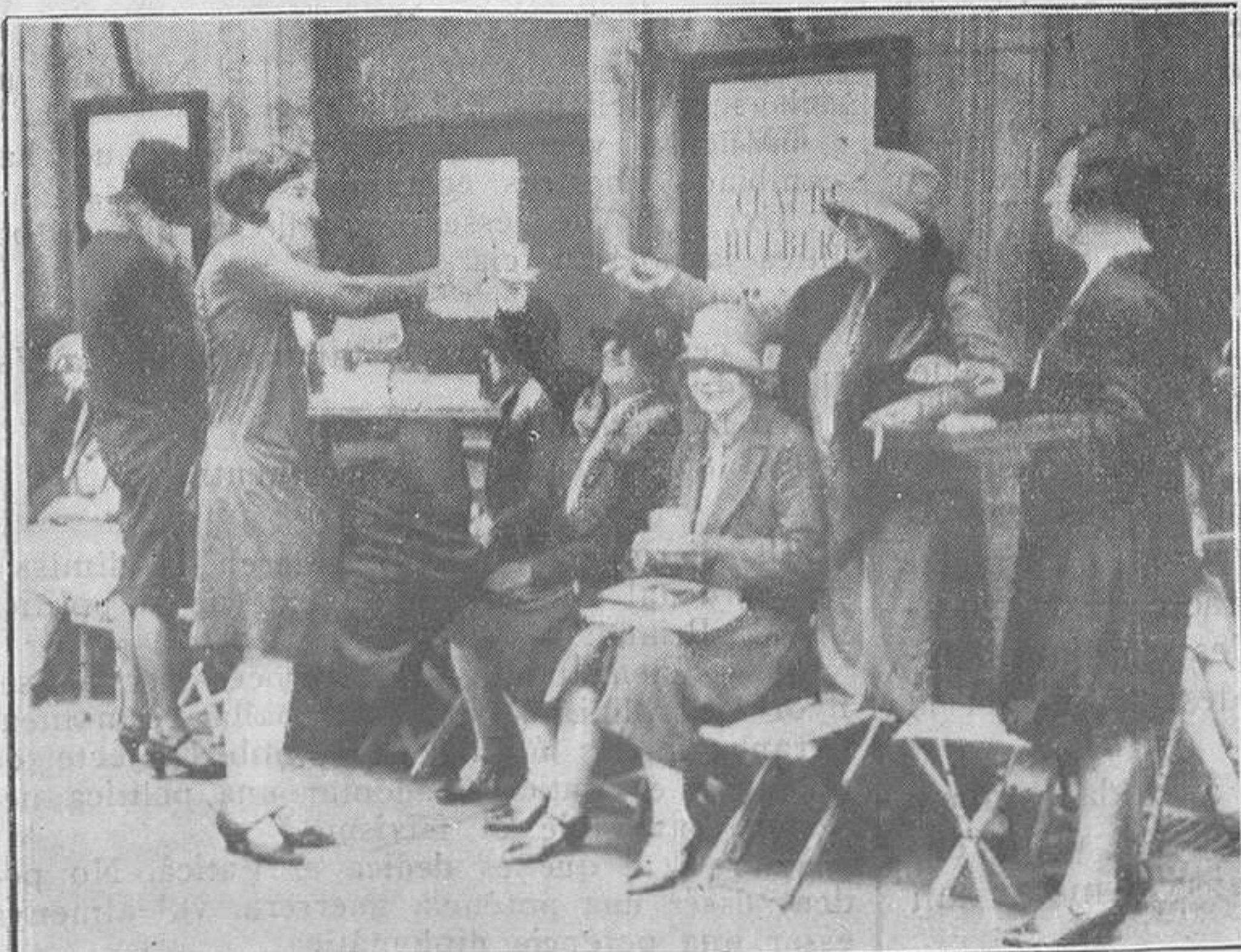
LA VIDA CARA

Mireu si és gran el conflicte de la vida cara, que a Londres, per a què la gent vagi al teatre, al "Majestic Theater", els han de convidar a prendre te... i encara no hi van