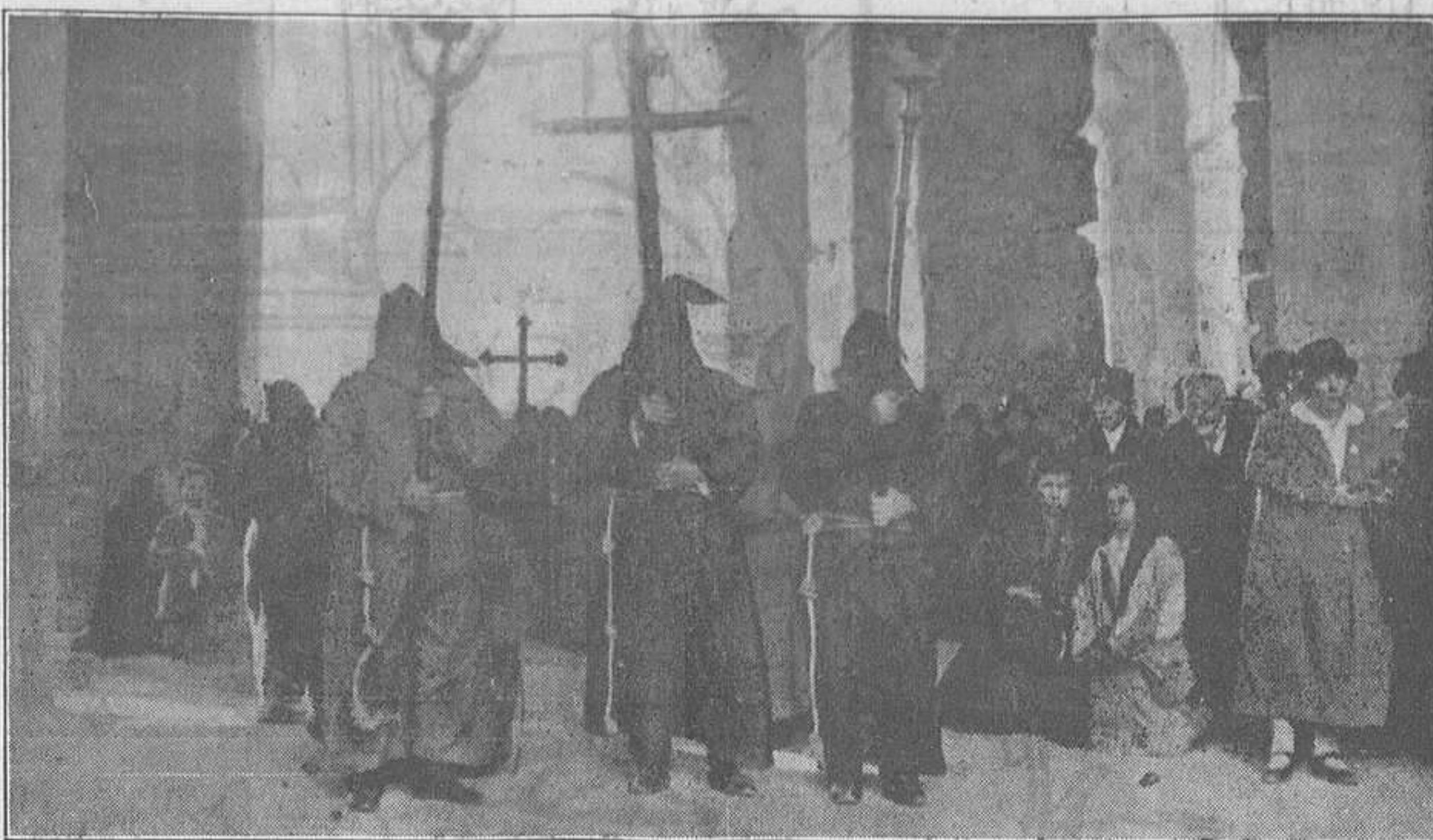
UNA PROCESSION A ROMA

Heus ací una tètrica processó a Roma. Segons la revista anglesa "The Sphere", d'on reproduïm el gravat, és una processó d'inquisidors.