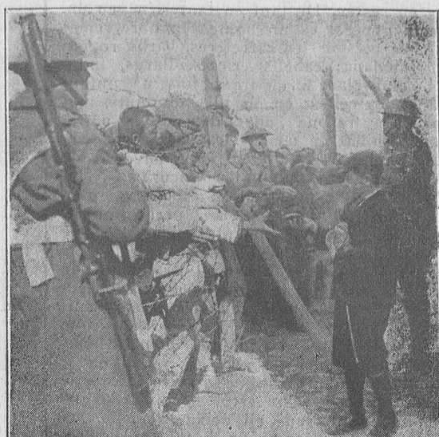
LA GUERRA A XINA

Heus ací una tètrica processó a Roma. Segons la revista anglesa "The Sphere", d'on reproduïm el gravat, és una processó d'inquisidors.