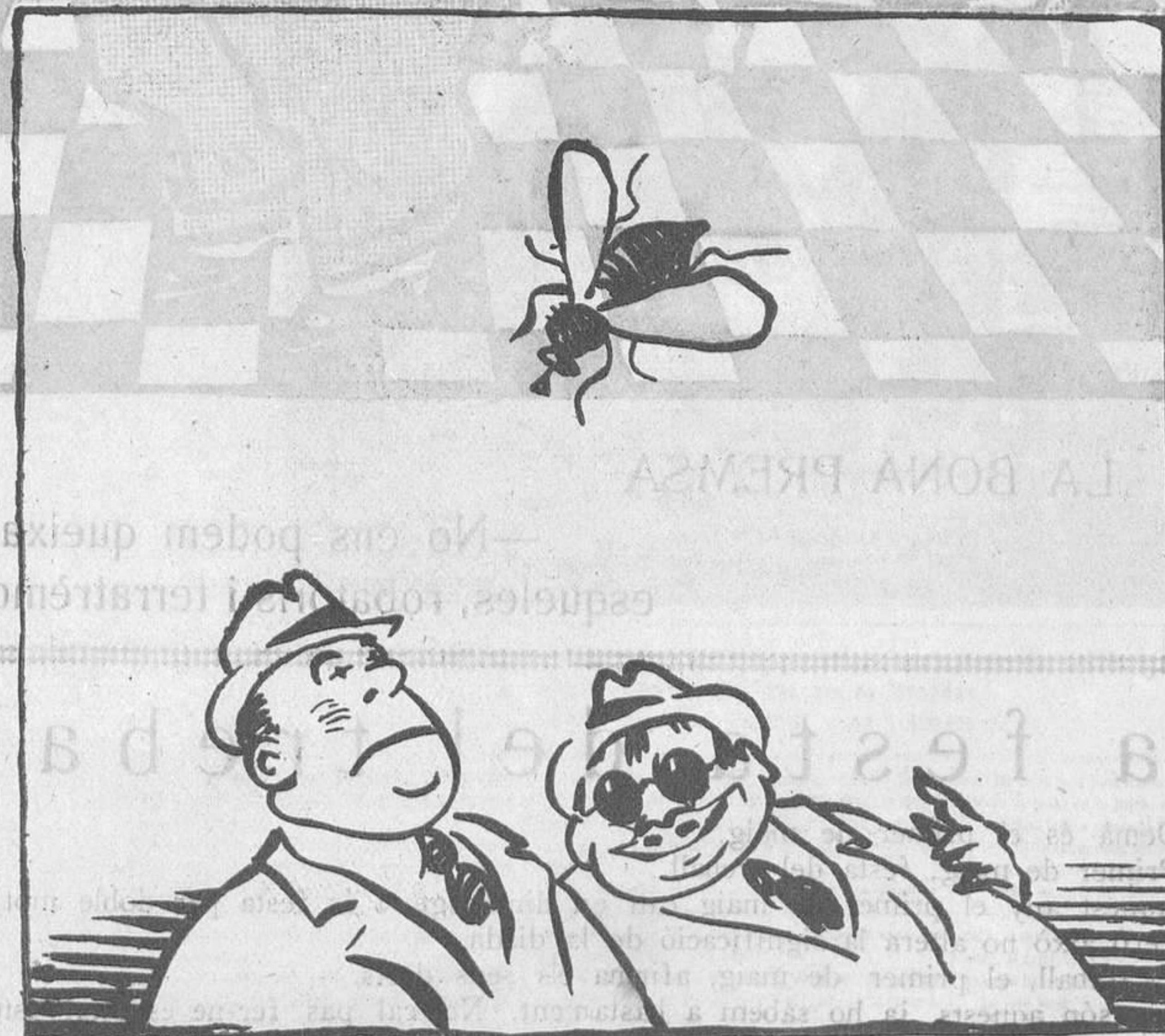
ELS CURTS DE VISTA

En "C. Gumà", l'home que ha batut el re-