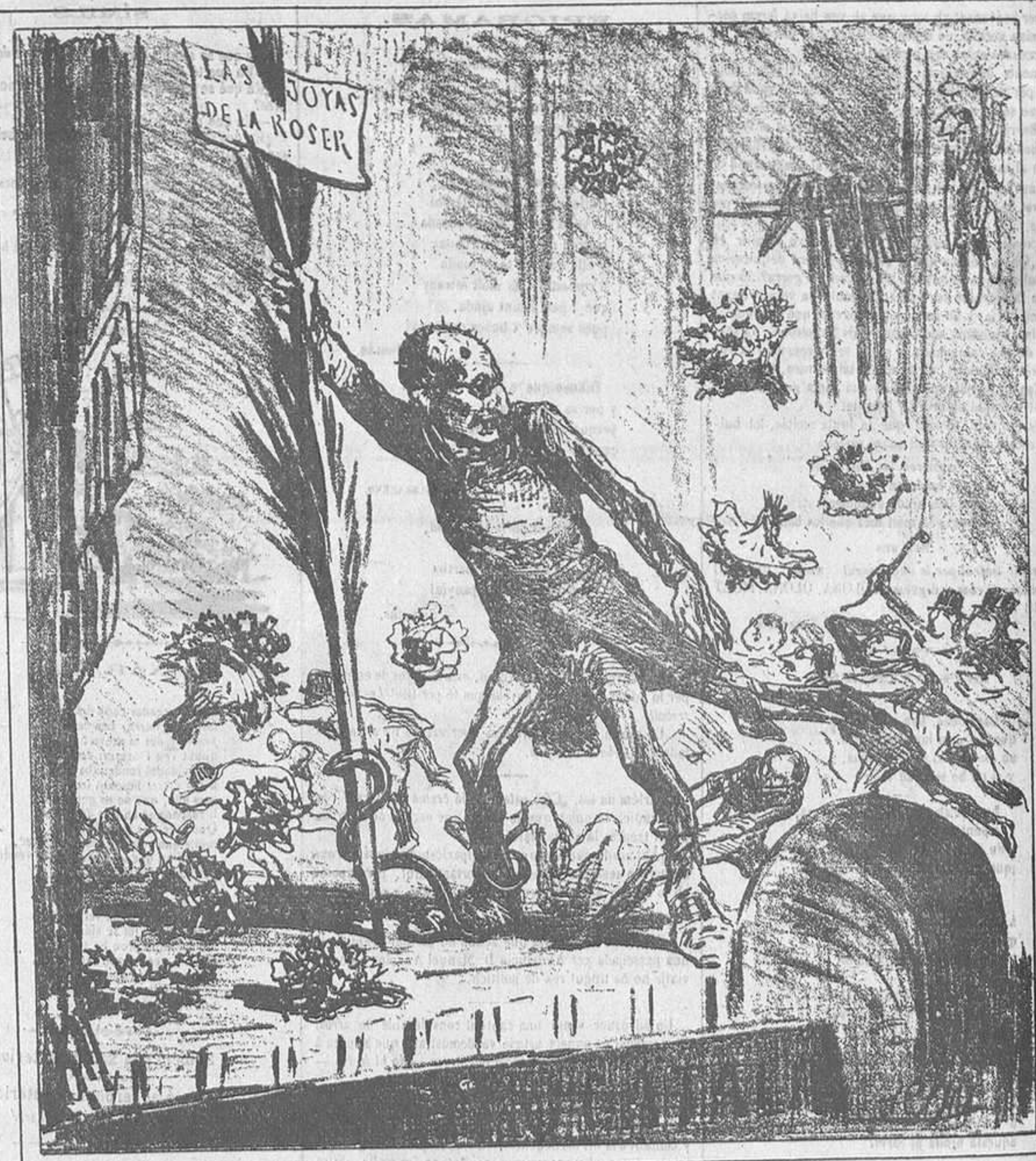
Trunfo de D. Serafi Pilarra

Si per cas algun maliciós lector se havia figurat alguna vegada que no hi havia entre nosaltres alguna persona decent, sapiga, de avuy per en devant, que hasta ne tenim que son de mi!