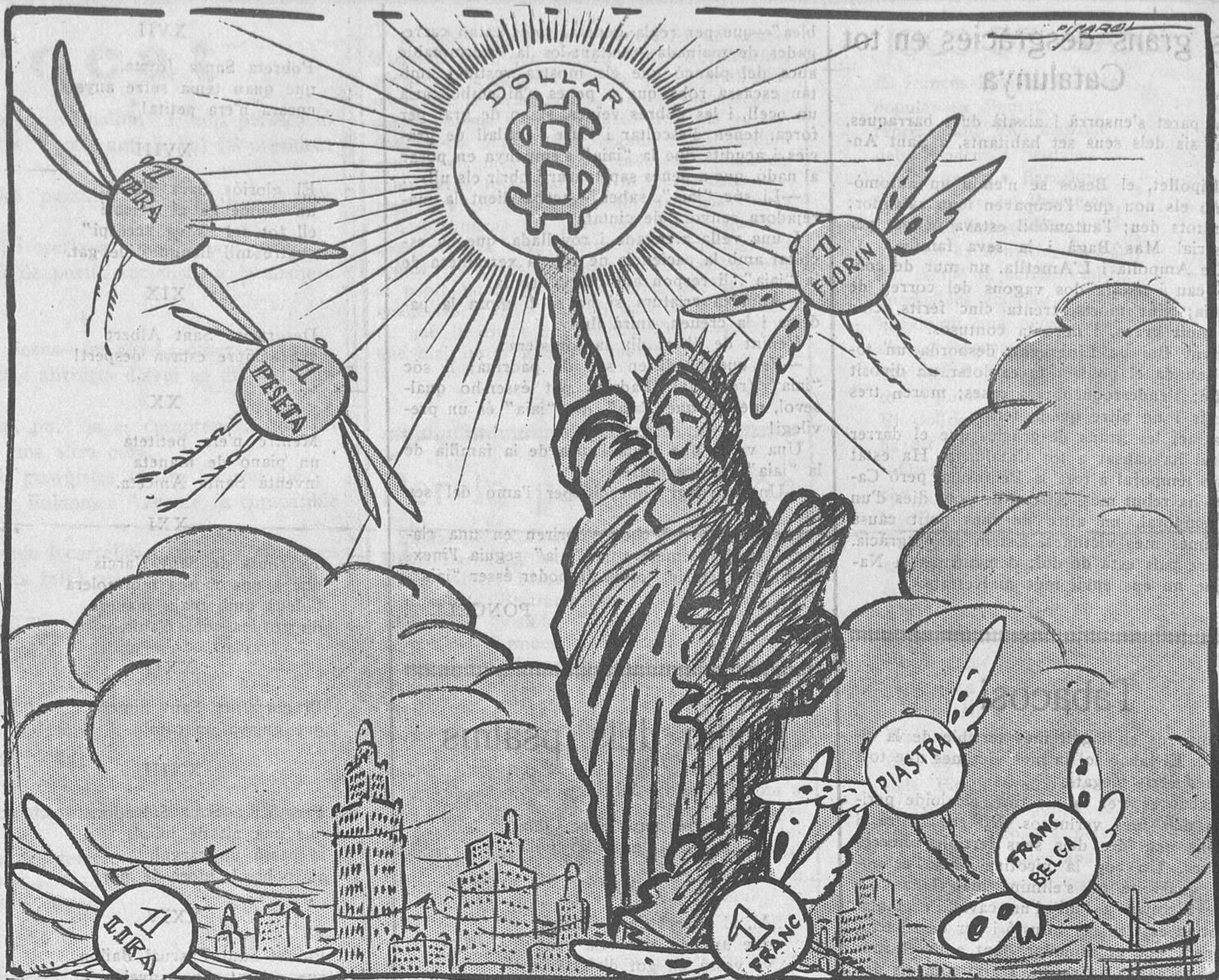
MONUMENTS DEL SEGLE XX