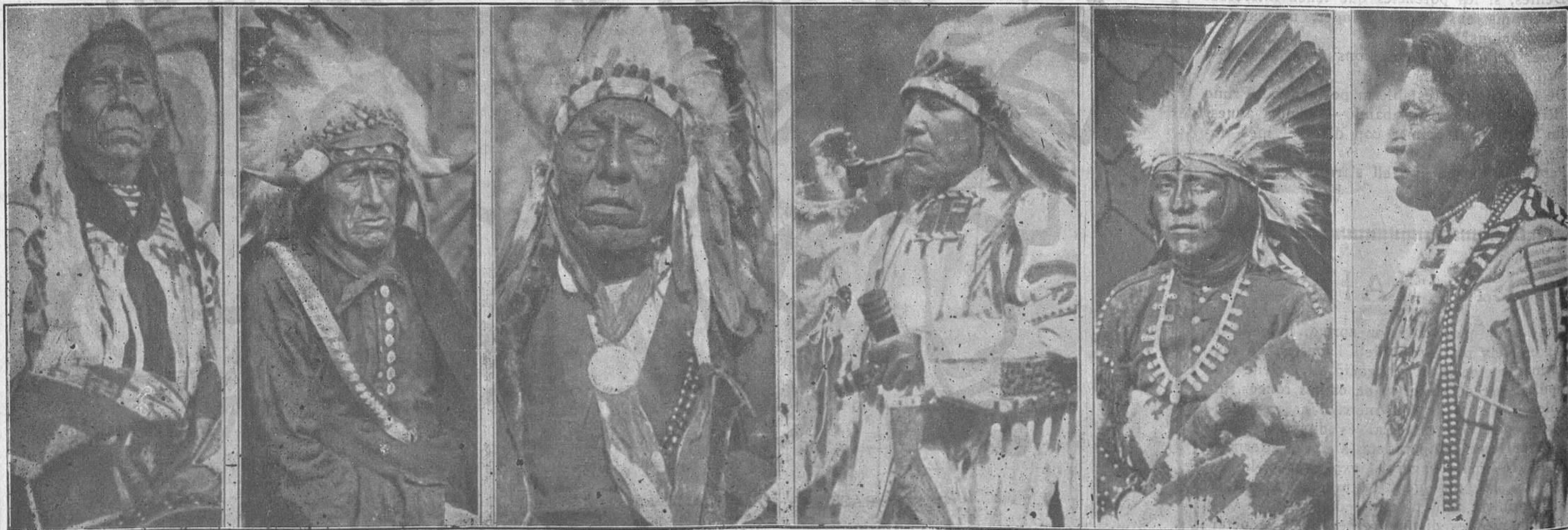
Varis tipus d'indígenes d'aquesta raça que es perdí