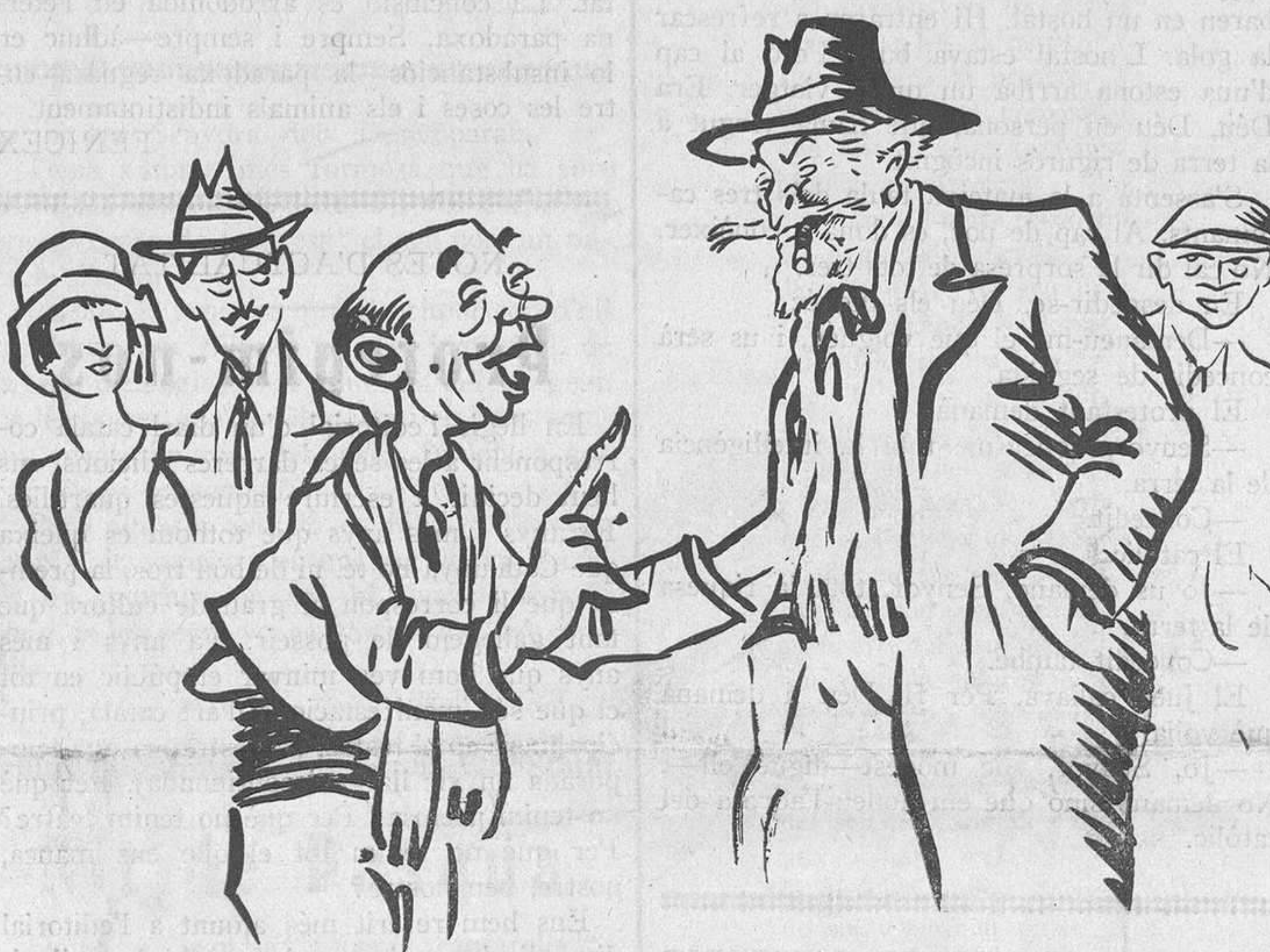
EN RUSIÑOL I EL POBLE

L'hora de dinar en un interior obrer de Barcelona.