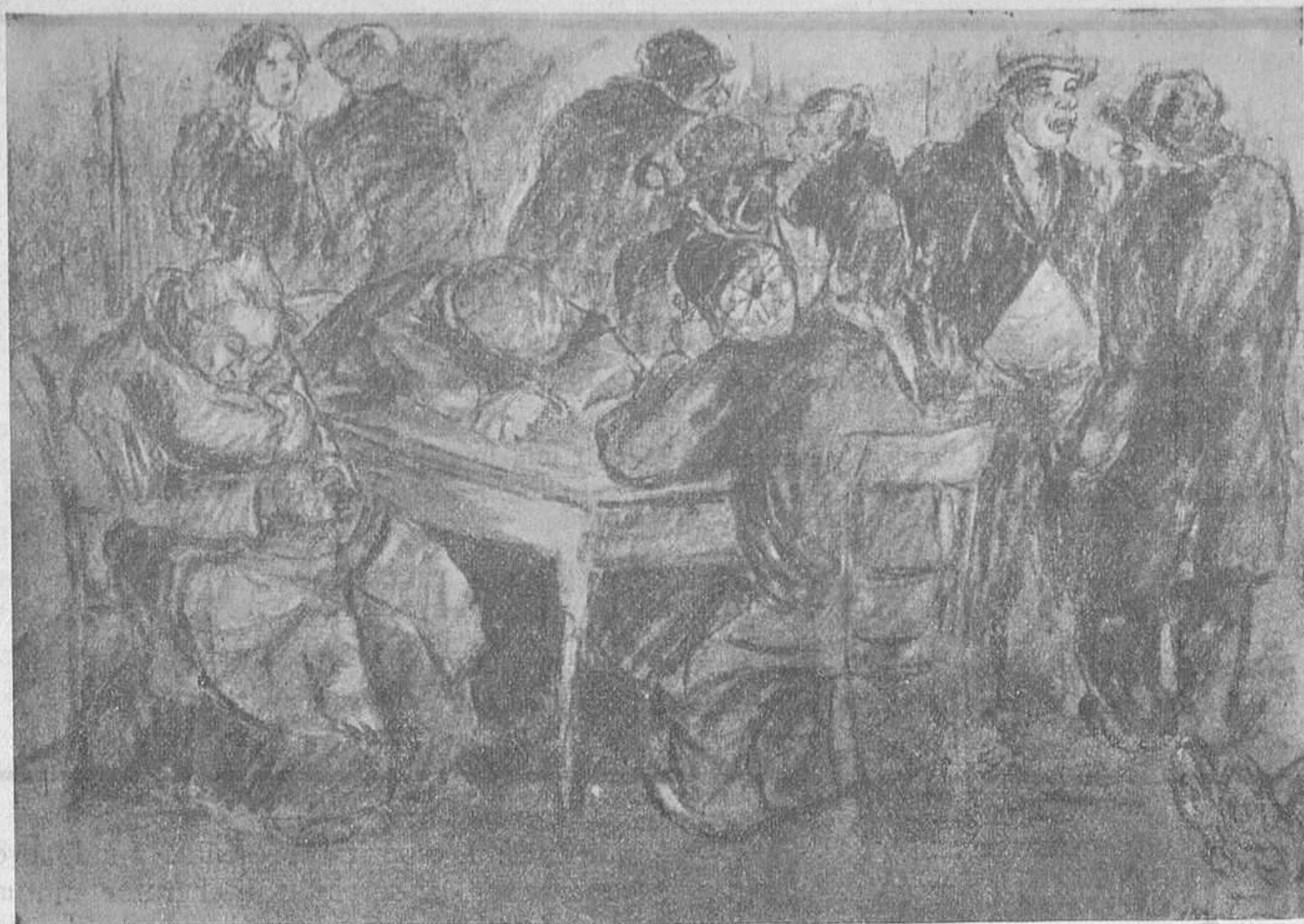
EL MILLOR DELS MONS

Quants pobres hi hauran a Londres—i aquí—, que no tindran tantes comoditats!