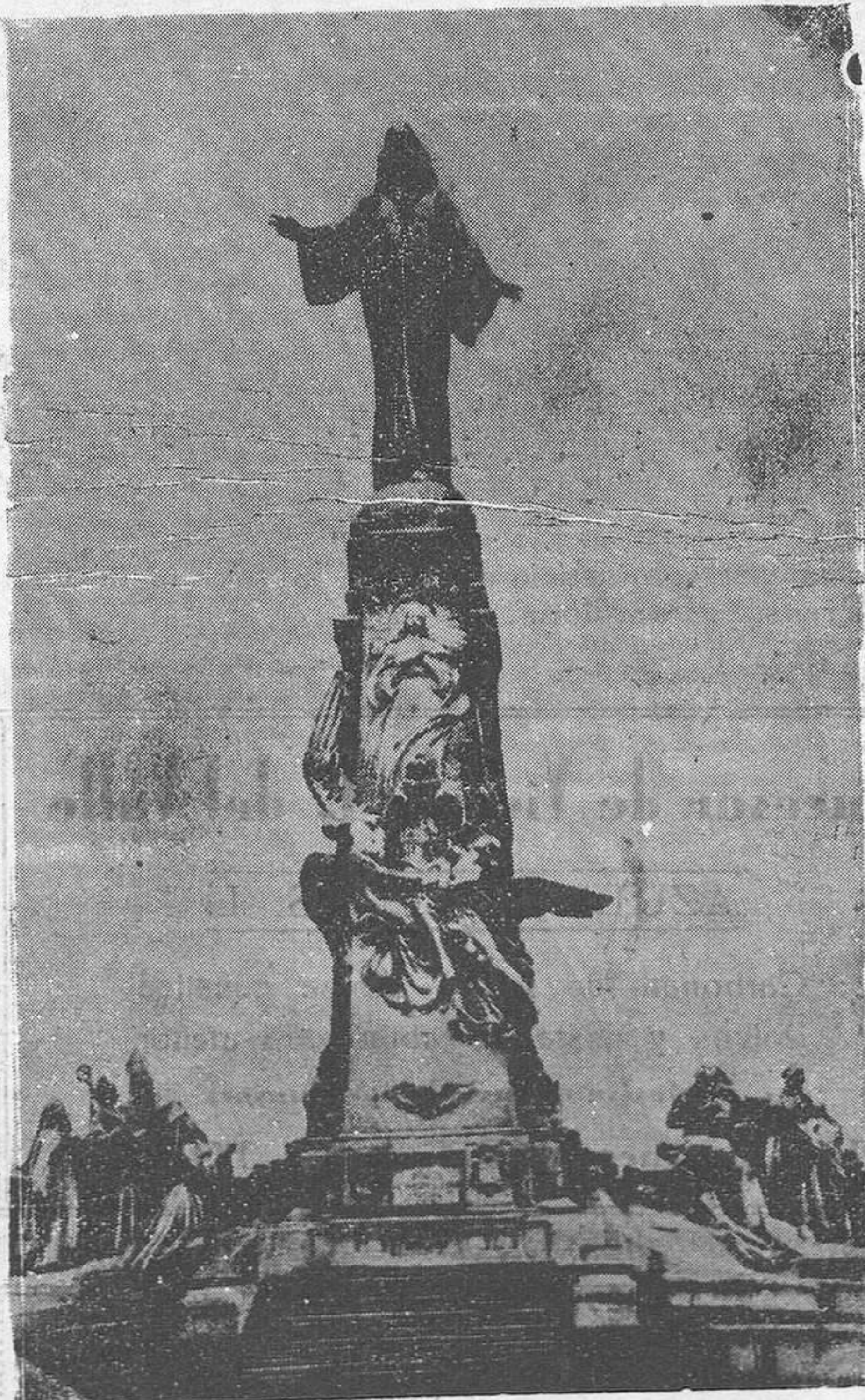
Cerro místico, de un reino espiritual de Cristo en España. Hoy no vendrán ya los romeros a arrodillarse ante la imagen venerada ni el eco devolverá las plegarias y cantares piadosos. El Cerro de los Angeles ya no se cubrirá hoy de peregrinos. Su tierra sangrada por las granadas muestra al aire sus marchas de pólvora y sus entrañas calcinadas lloran el sacrilegio cometido