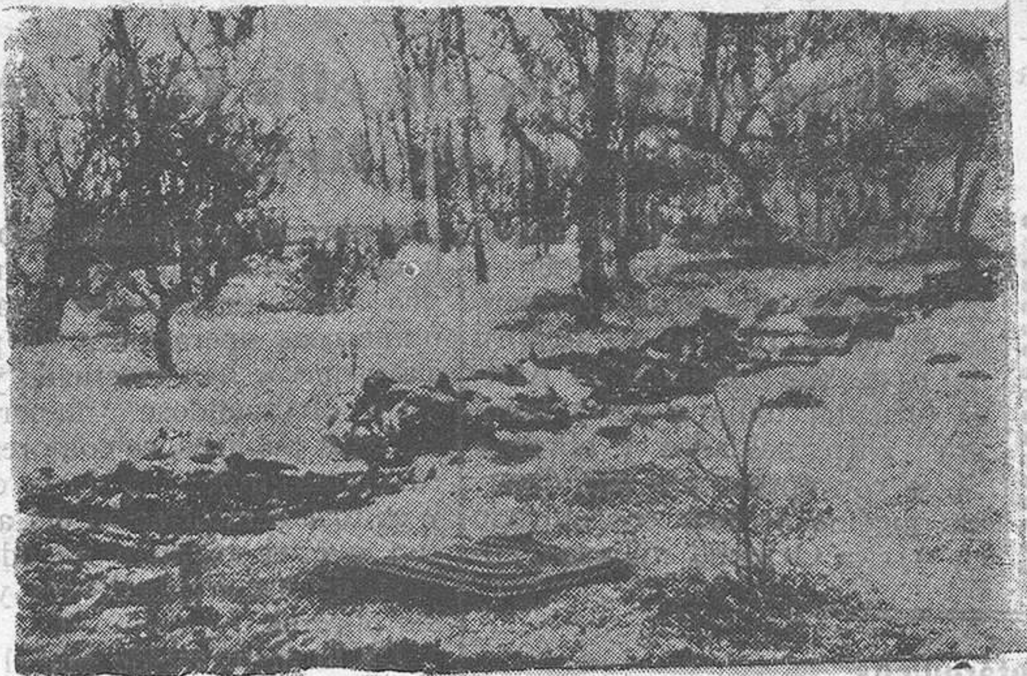
Miseria y muerte: He aquí el programa de Moscú y he aquí lo que quieren los rojos que sea España.

Moscou.—La sinceridad de "Isvezitia" alcanza alguna vez el descubrimiento de trucos diabólicos que se cometen imprudentemente en el denominado régimen del pueblo. El diario oficial gubernativo, en efecto, publica