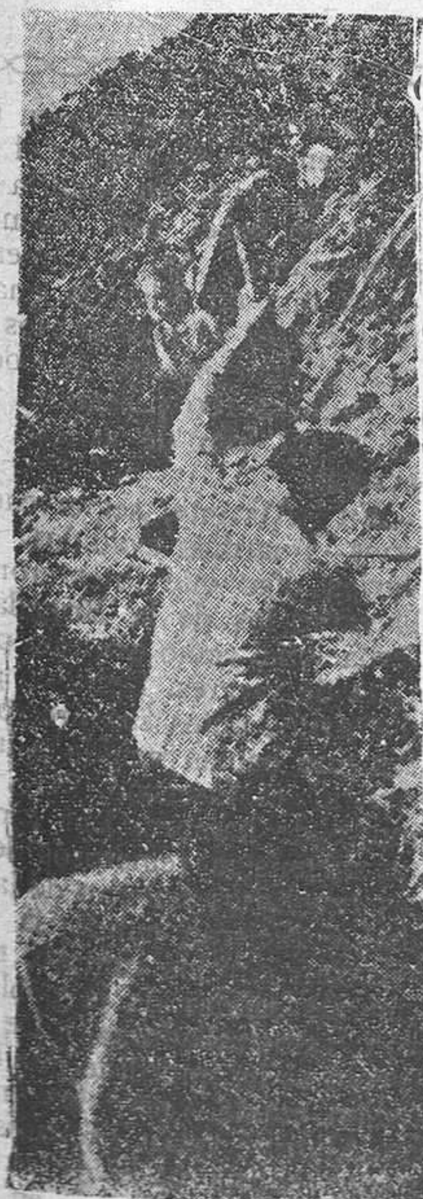
Nuestra artillería bate el "cinturón de hierro"; de hierro español sacado de las entrañas de España y puesto por traidores separatistas al servicio de Moscú.