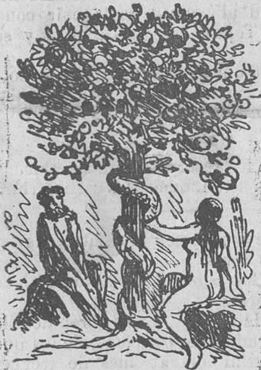
LA PRIMERA RESERVA