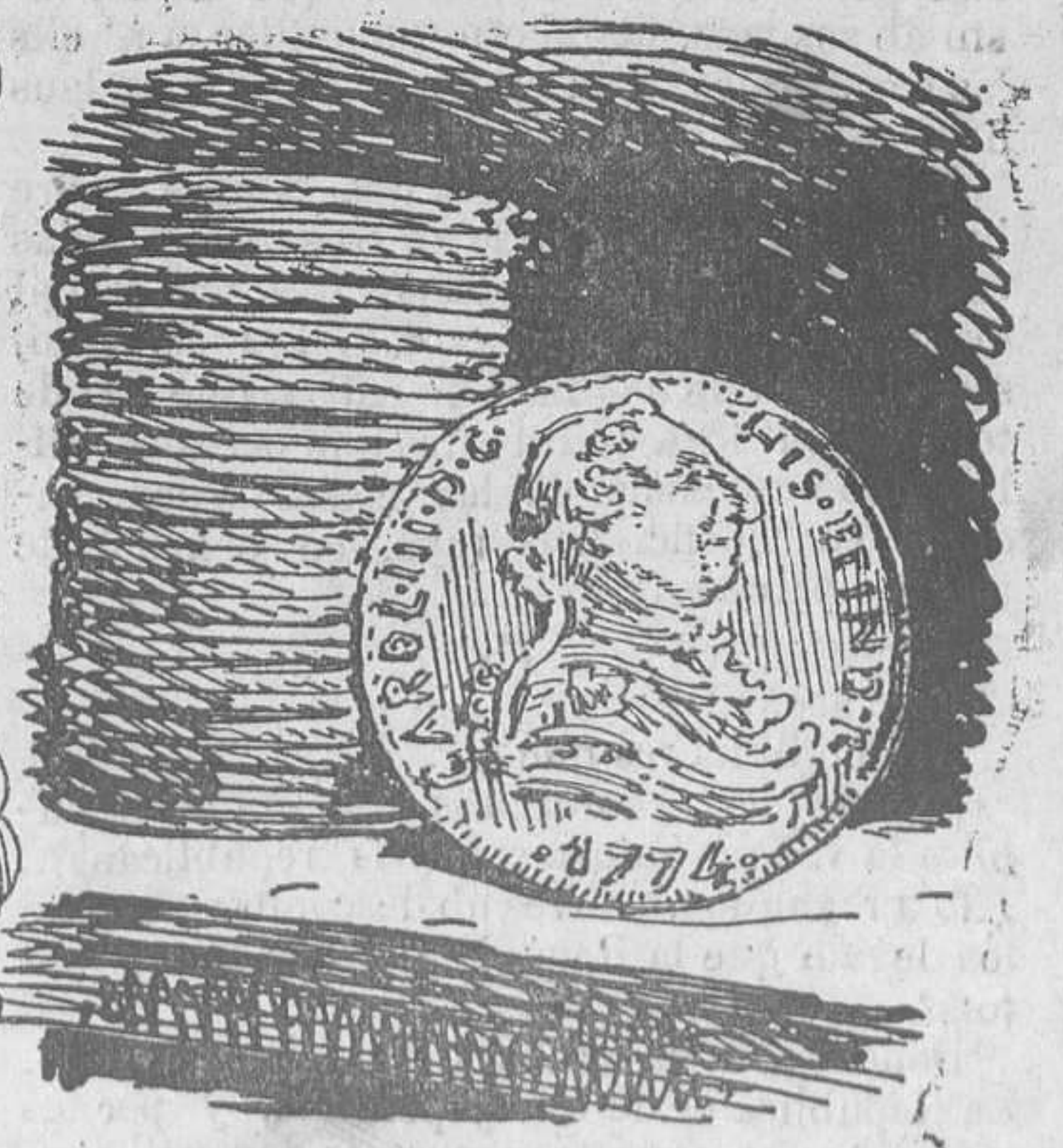
LA MILLOR DE LAS RESERVAS