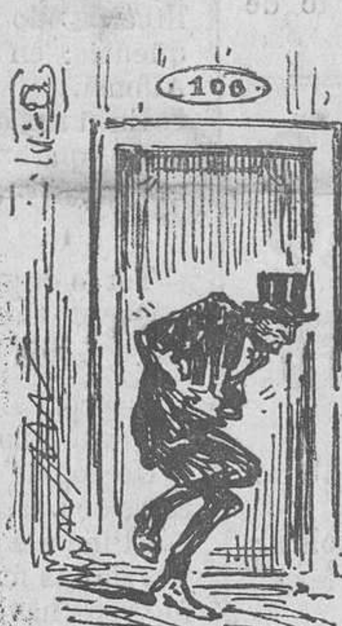
RESERVAT PELS SENYORS