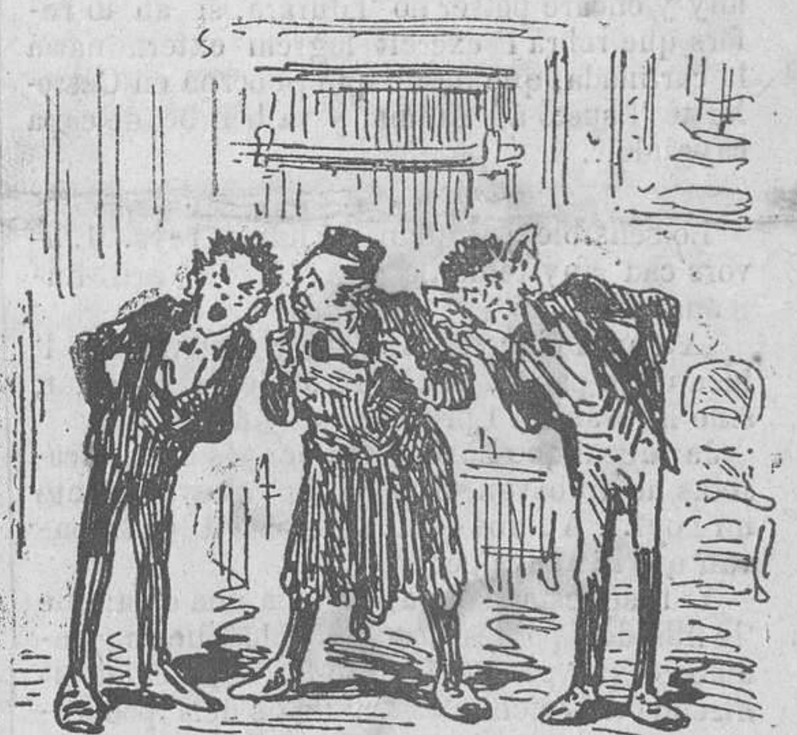
UNA COSA DITA AB MOLTA RESERVA