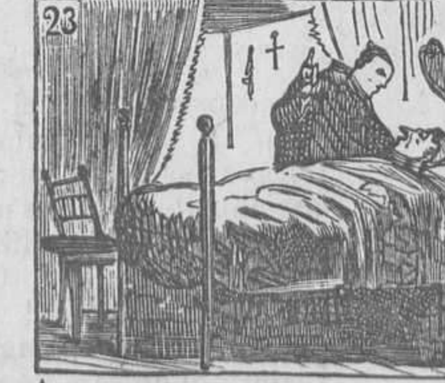
23 Aun no se encuentra en la cama cuando á su confesor llama.