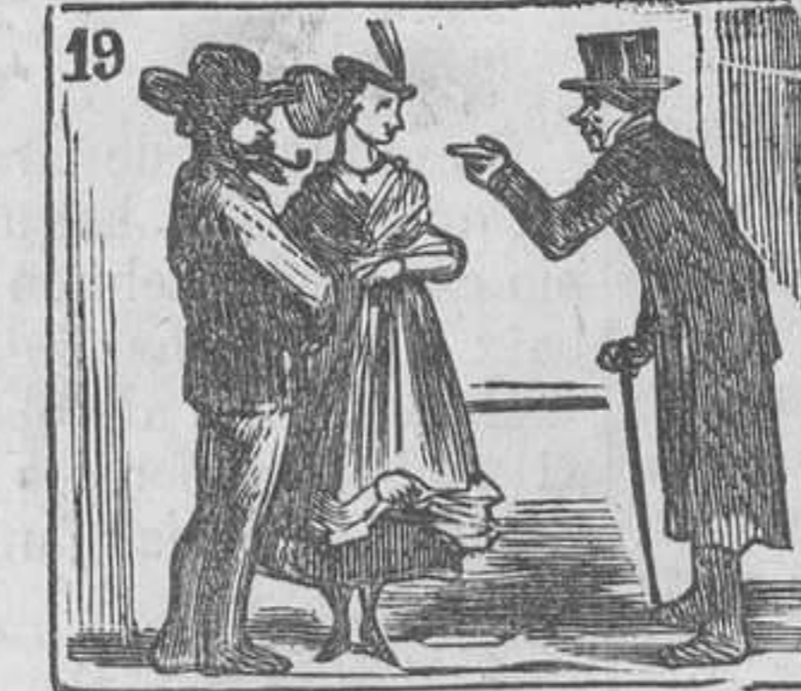
19 A un matrimonio civil trata de canalla vil.