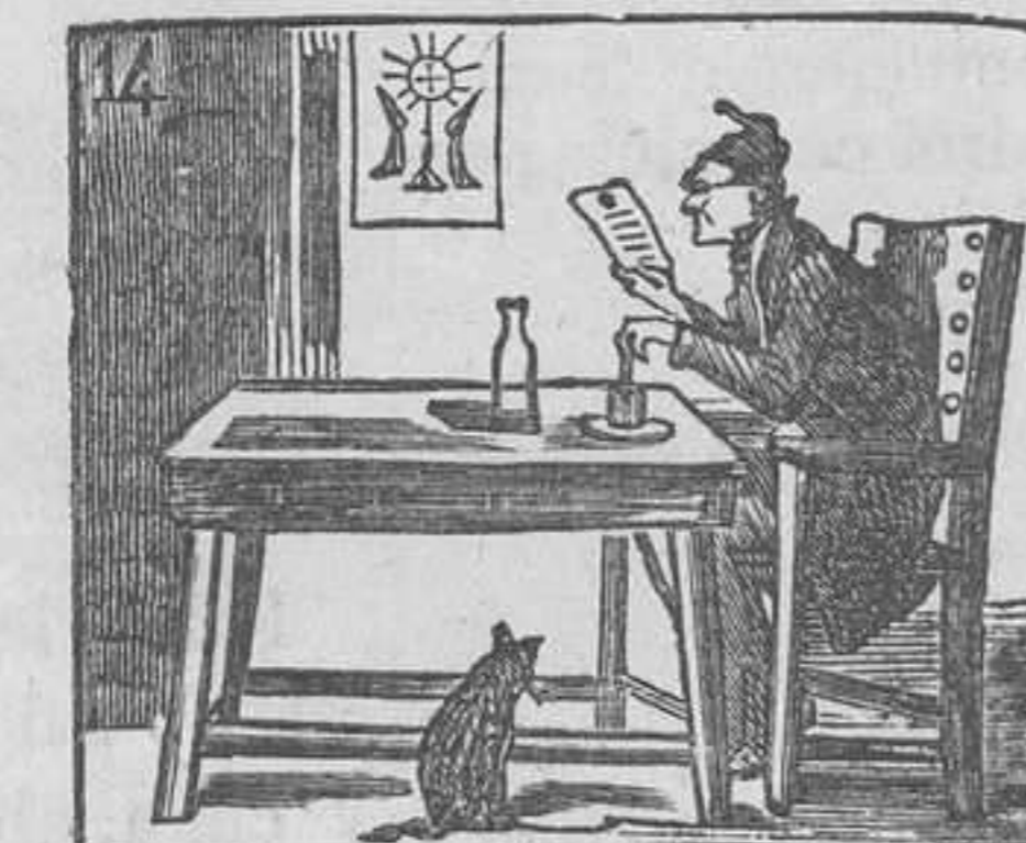
14 Lee con gran afic on] el diario «La Conviccion.»