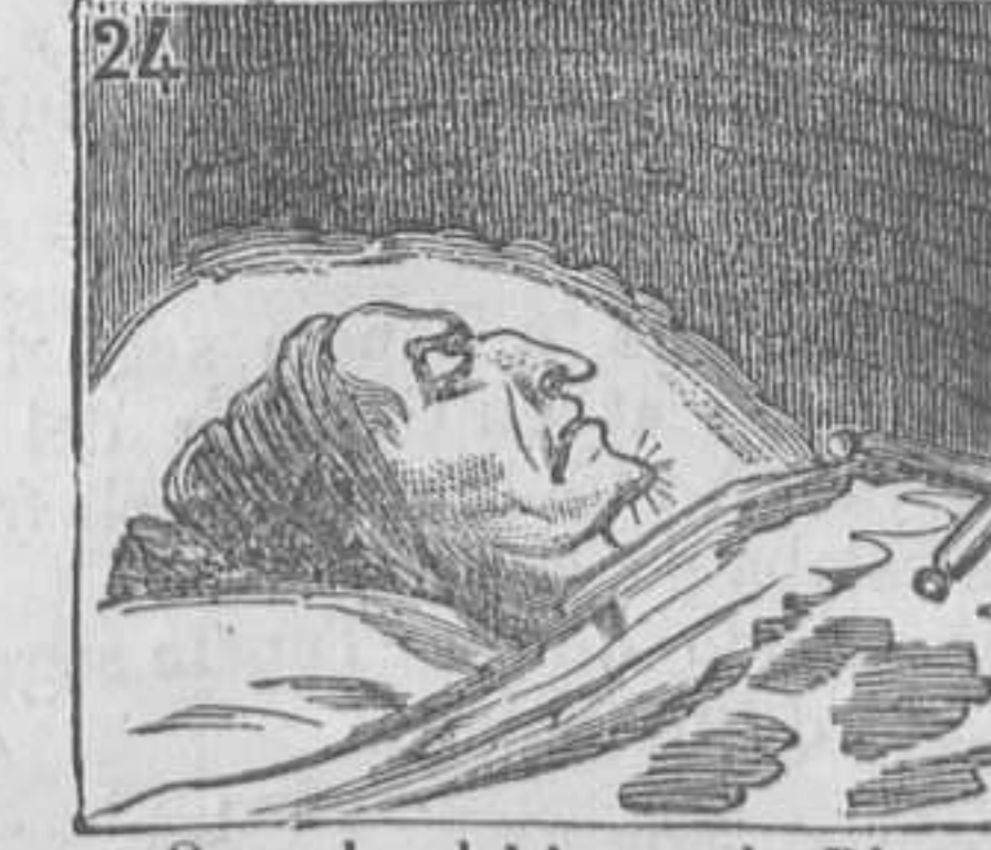
24 Oyendo el himno de Riego empeora y muere luego.]