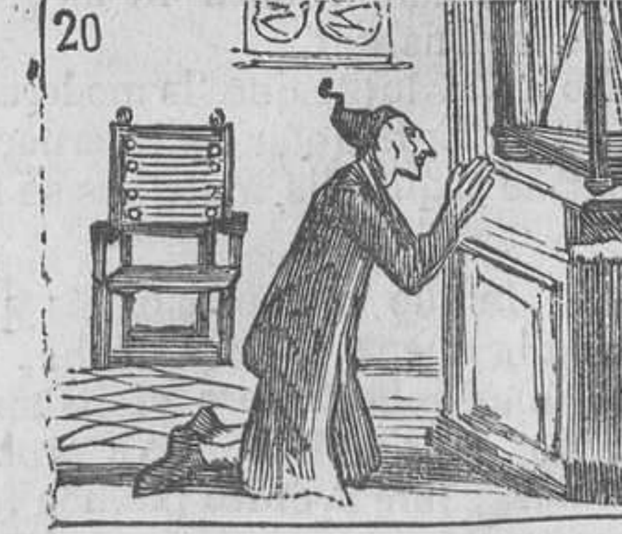
20 Antes de meterse en cama la Virgen fé reclama.