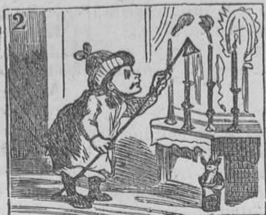
2 Apenas empieza á andar, luces ya sabe apagar.