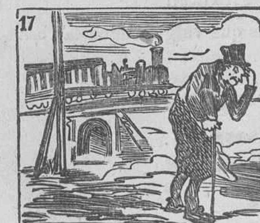
17 Del siglo los adelantos le causan muchos quebrantos.