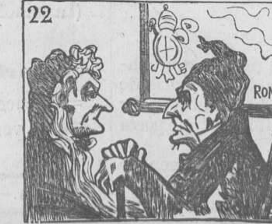
22 Con su esposa habla de Roma, y enferma, tan mal lo toma.