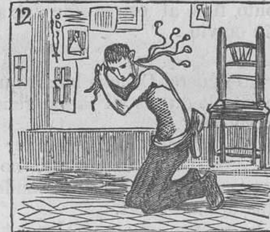
12 Teniendo un mal pensamiento, se disciplina al momento.