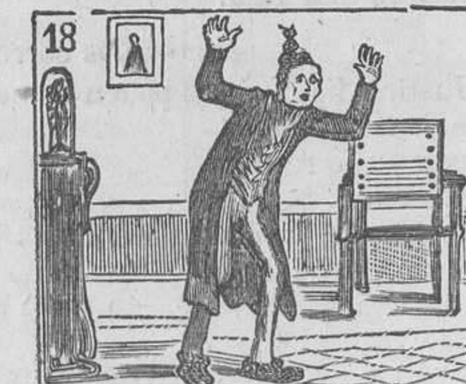
18 Le aturde la impiedad de esta malhadada edad.