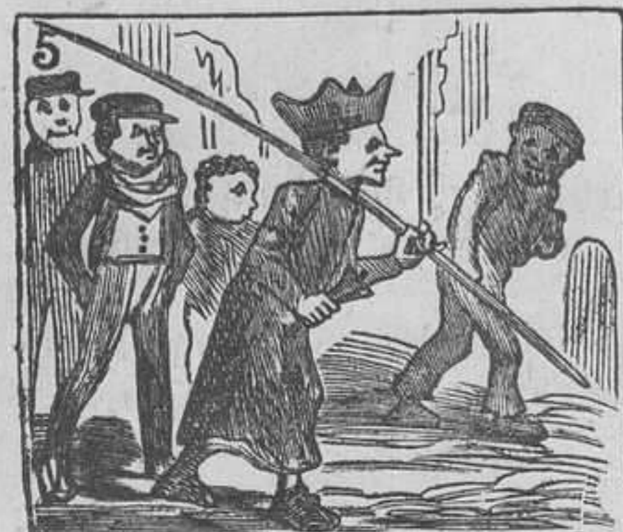
5 Va anunciando la doctrina á la canalla vecina.