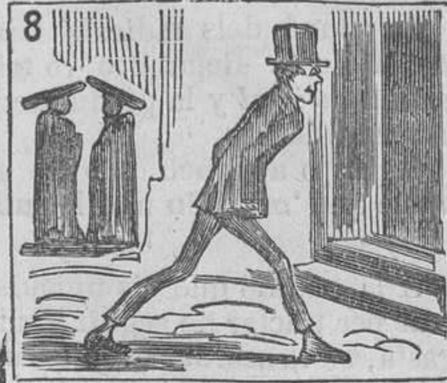
8 El crudo frio resiste y á todo sermon asiste.