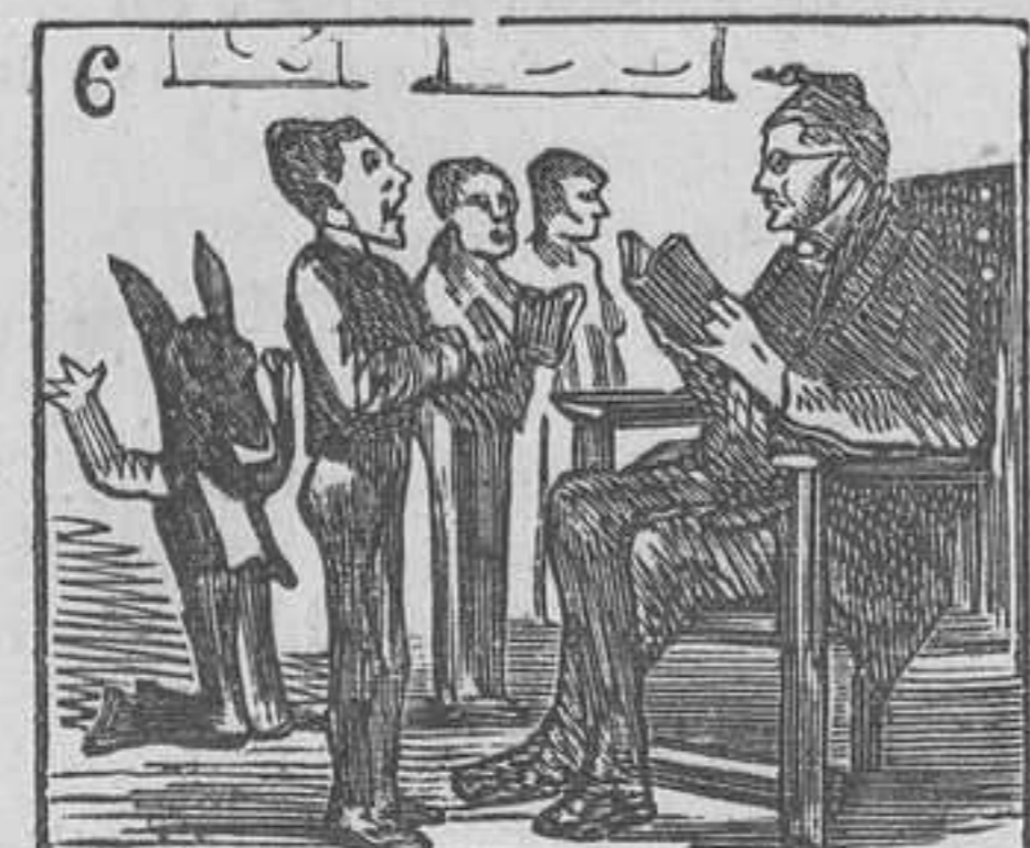
6 Por el mas desapicado en la escuela es castigado.