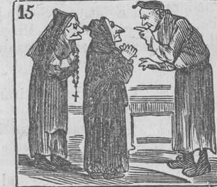
15 Le proponen por esposa una muger religiosa.