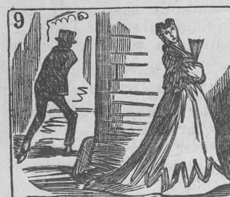
9 Cuando encuentra una doncella no va por la calle de ella.