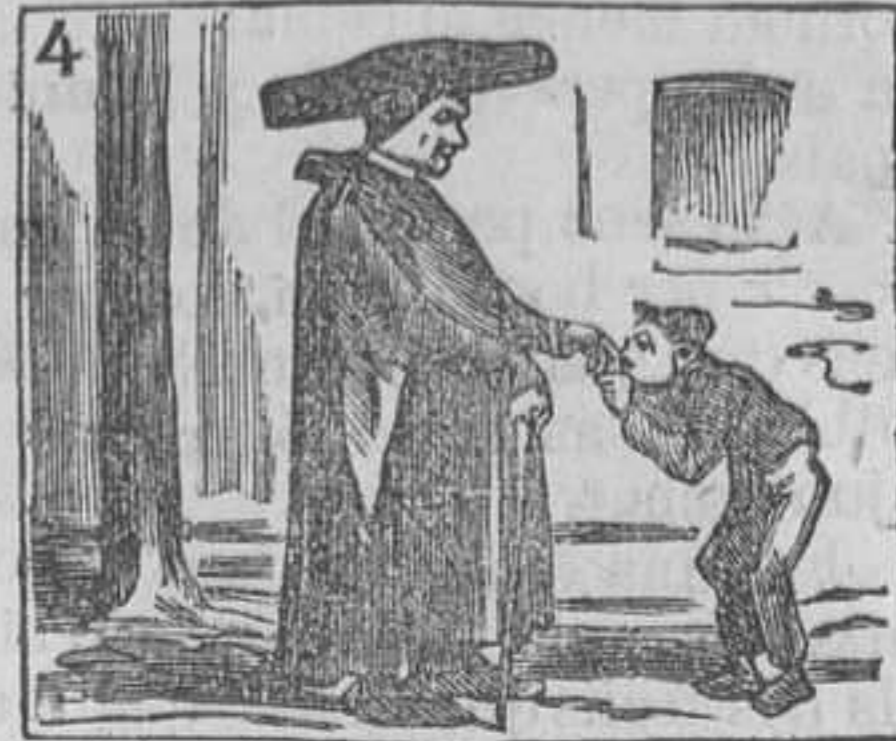
4 Por las calles, muy ufano, besa á los curas la maro.