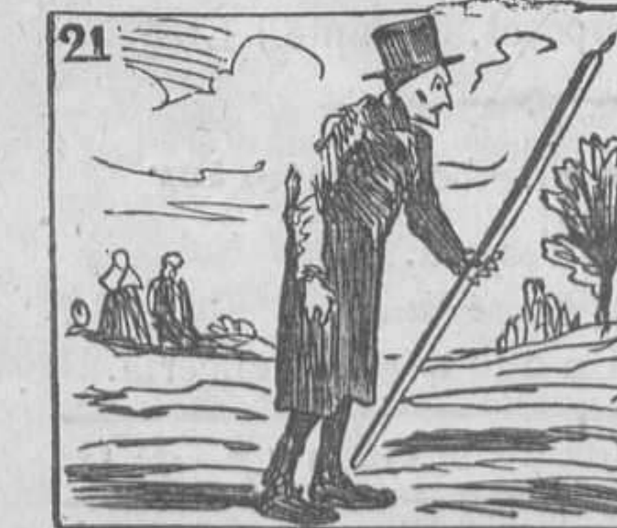
21 Cumpliendo un ex-voto, lleva un cirio á la Buena-nueva.