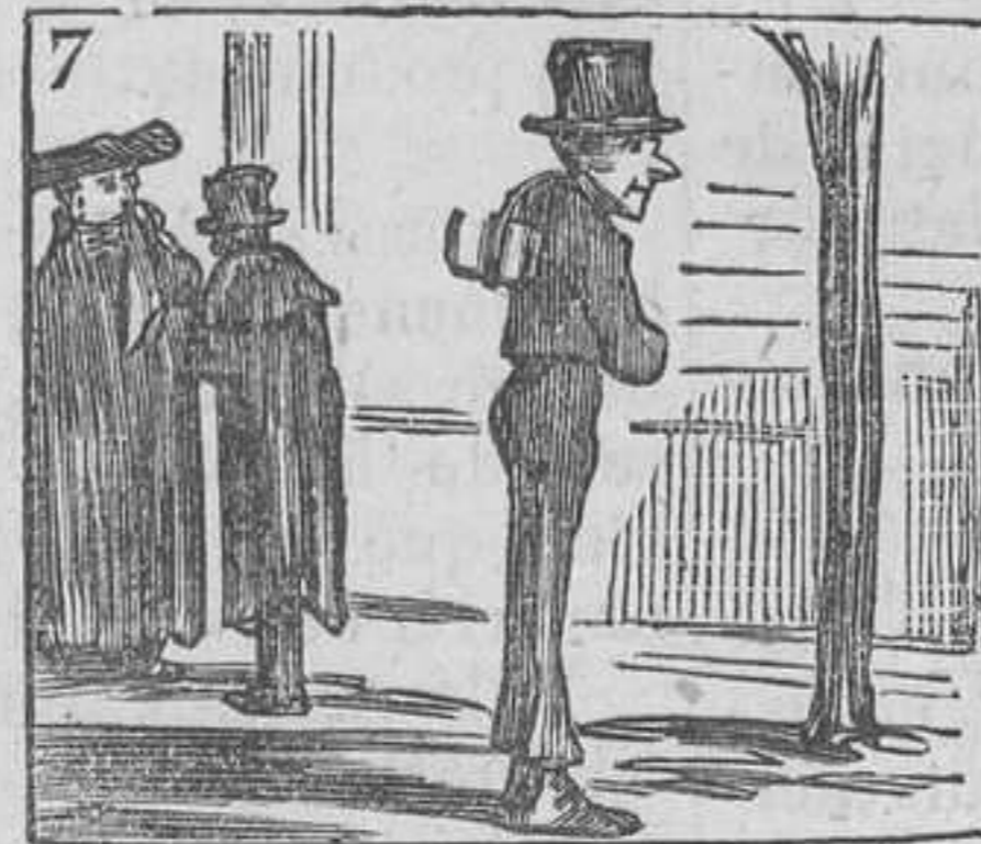
7 Quieto y rezando el rosario, se dirige al Seminario.