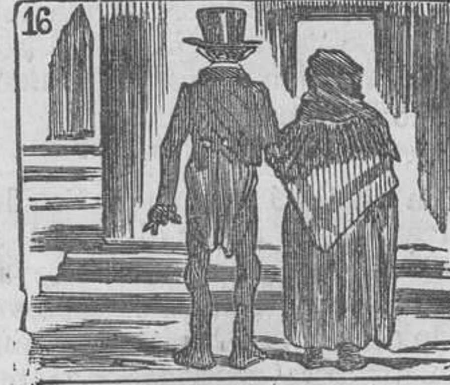
16 Los dos esposos, contentos, visitan los monumentos.