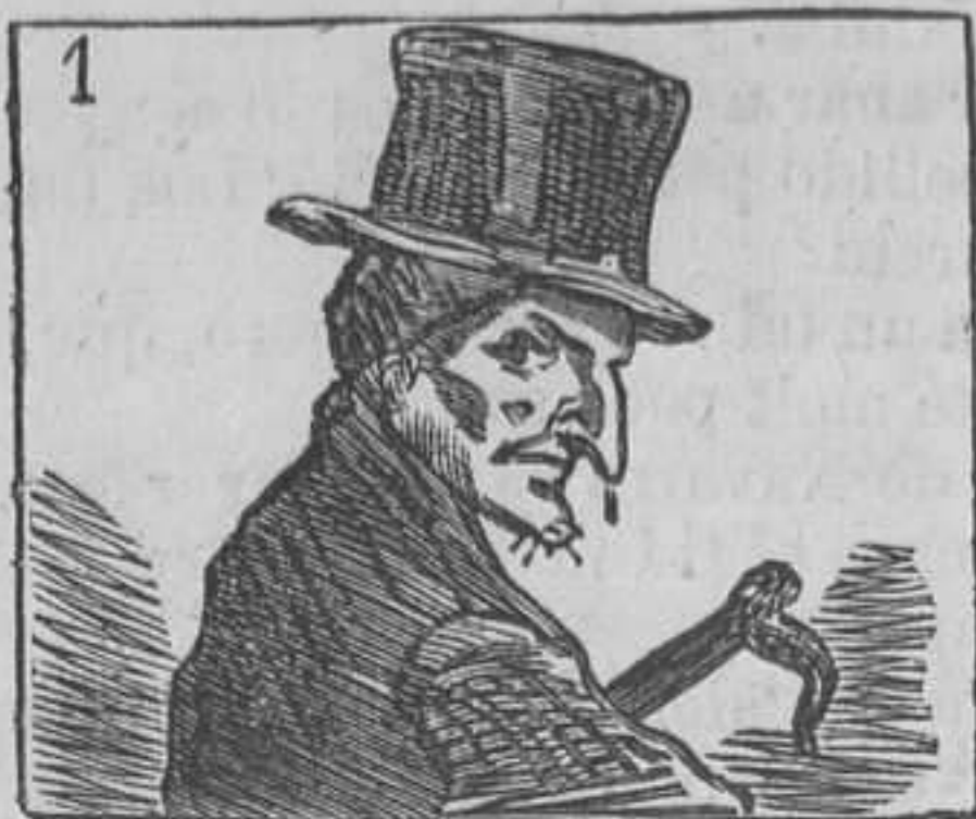
1 En el retrato que veis, al hombre neo teneis.