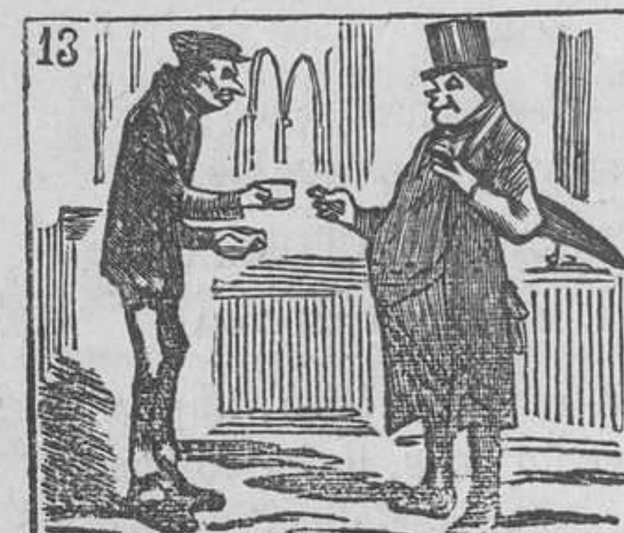
13 Reparte candidaturas, por encargo de los curas.