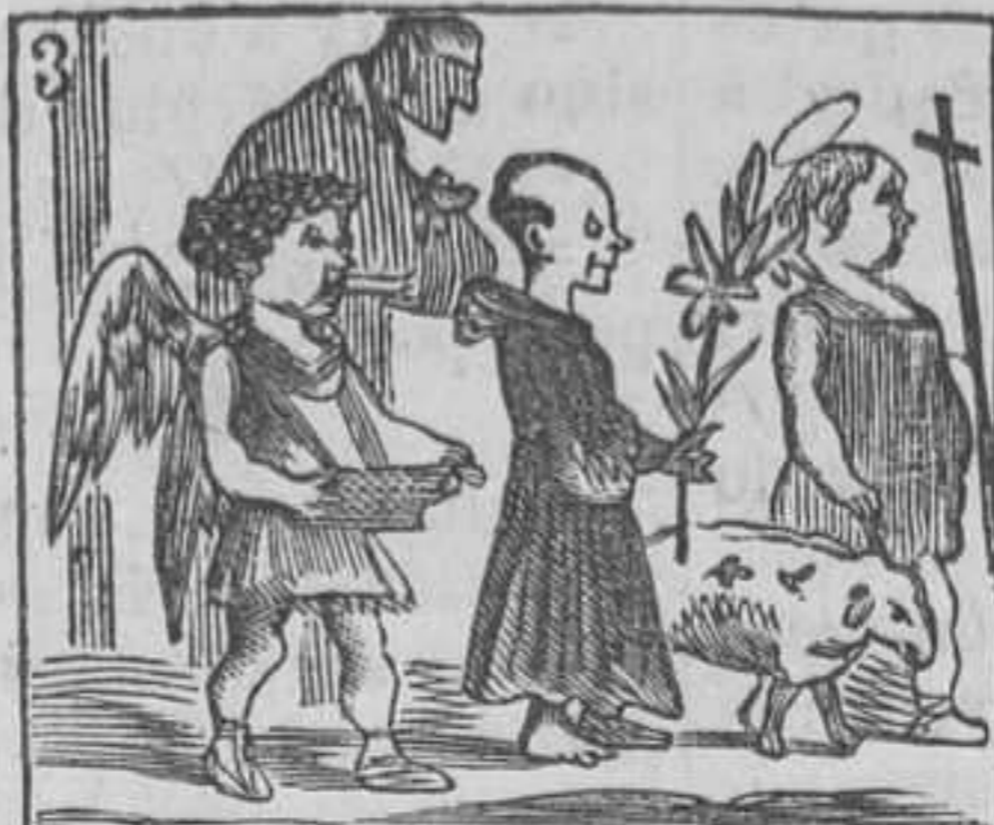
3 Satisfecho y peladito va de S. Anton bendito.