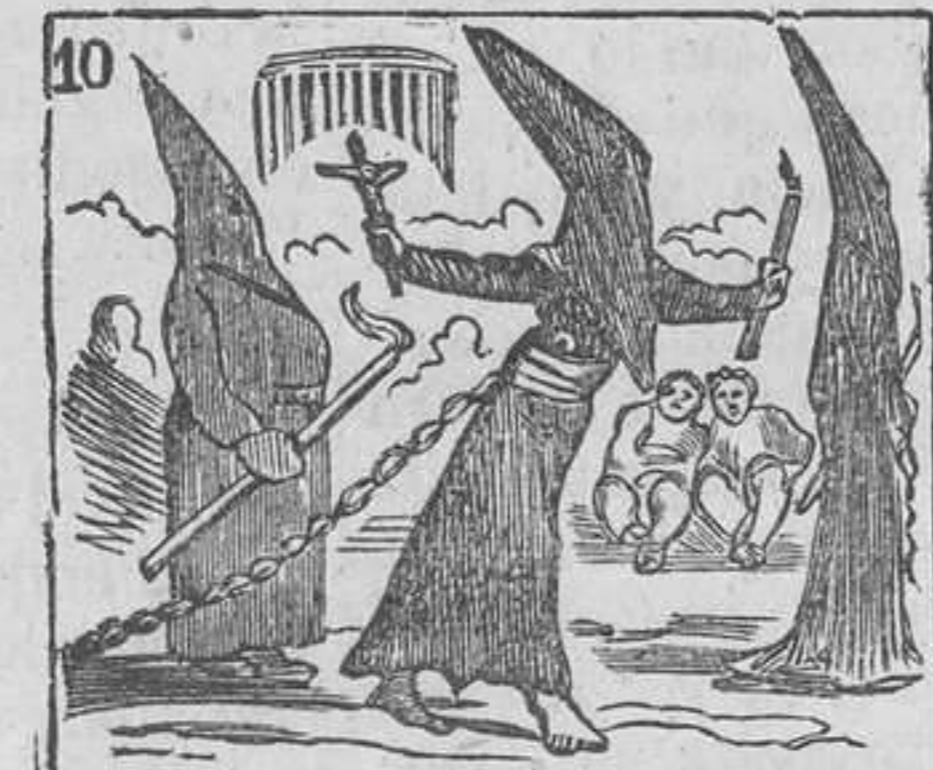
10 Sufre con gusto la pena le arrastrar larga cadena.