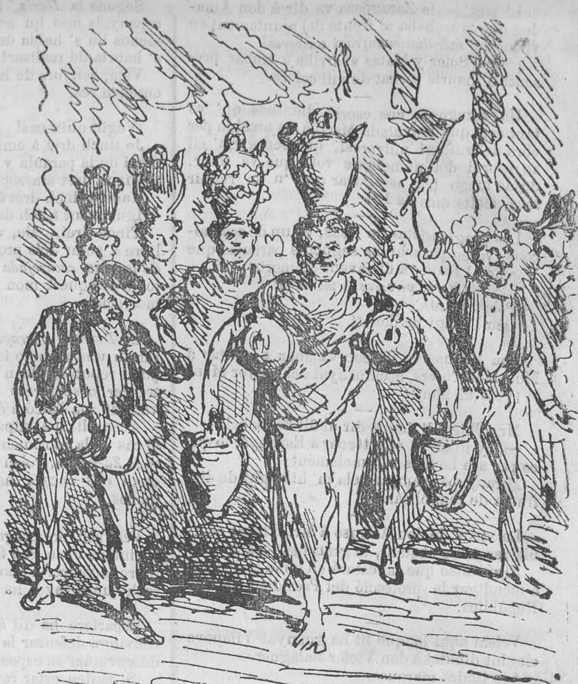
DIVERSIONS DEL CARRER NOU.

Allavoras se cubria de gloria y 'ns deixaria llibres de influencias sagastinas.