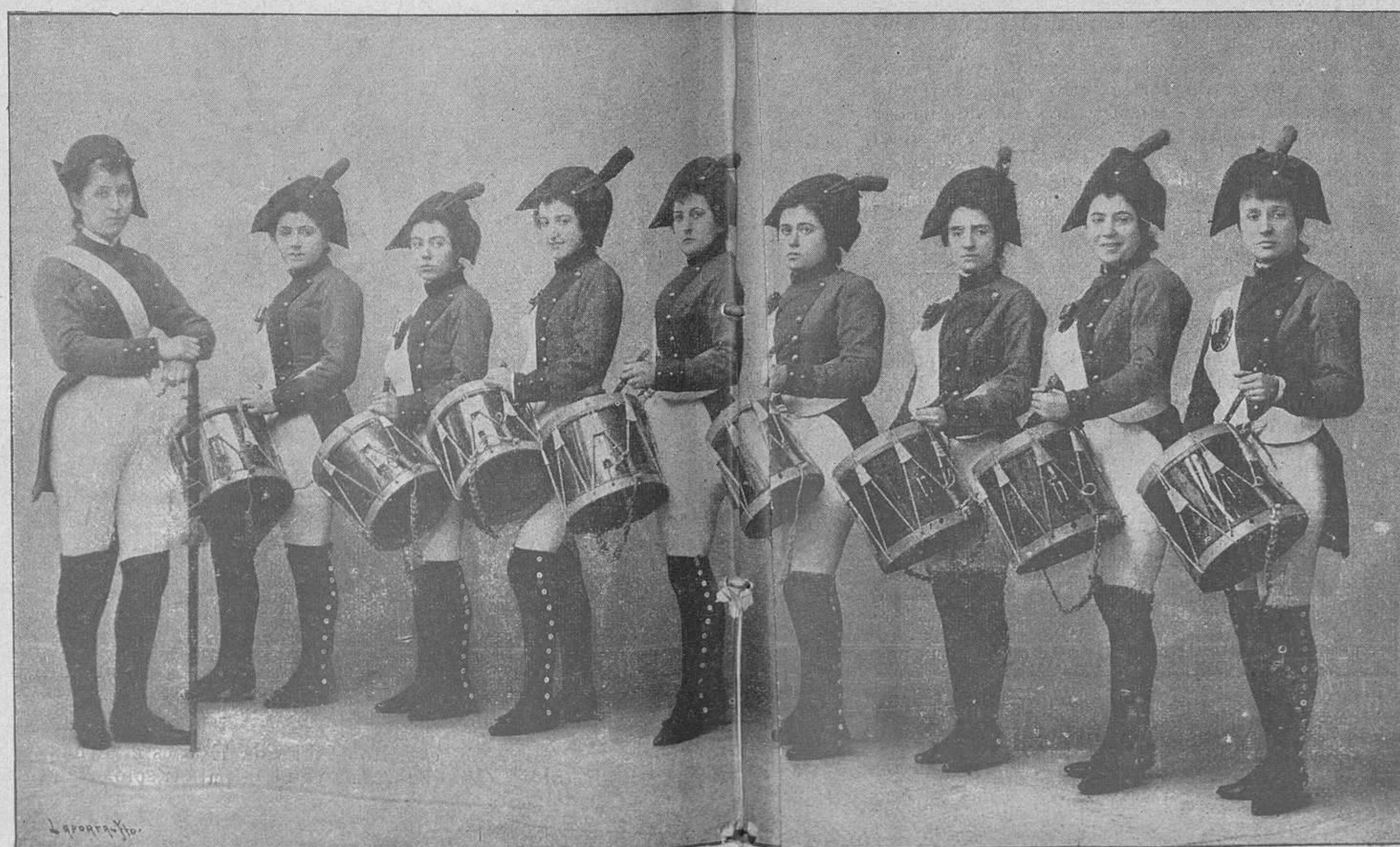
SRTAS. DIEGO, DÍAZ, ESPINOSA, BARRAGÁN, ELDOZAIN, MONTERDE, LIZCANO, BARINAGA, GONZÁLEZ.

-- Mi mayor placer sería fusilar media docena de frailes.