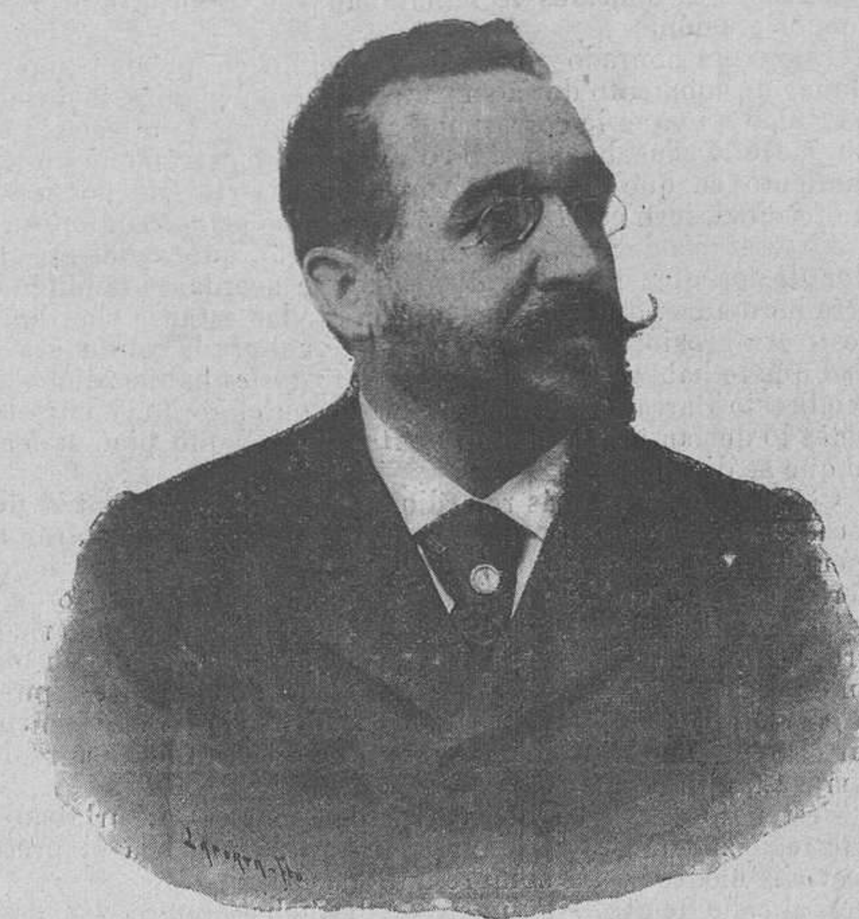
D. Ruperto Chapí. AUTOR DE LA MÚSICA.