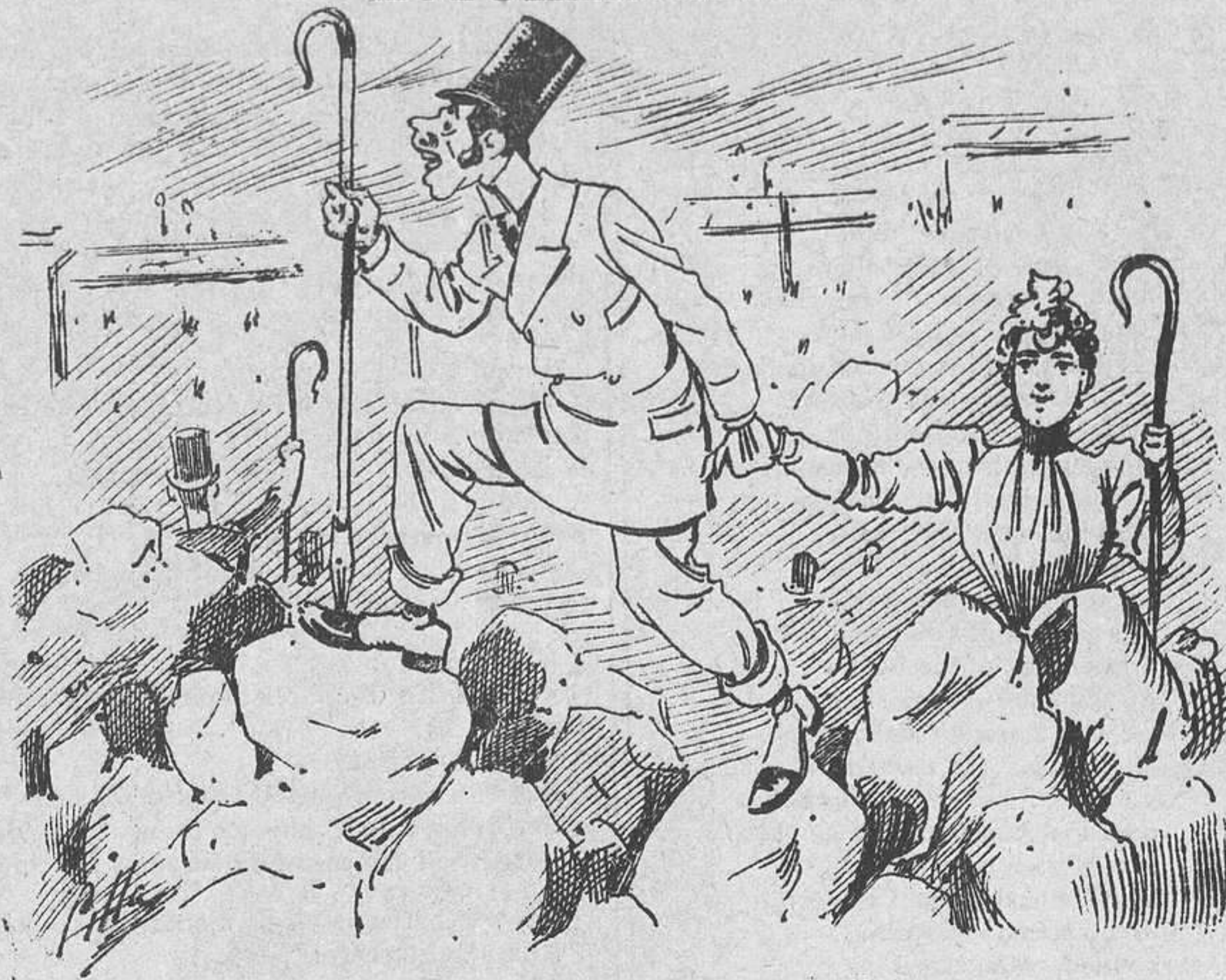
Único modo de pasar por la calle de Peligros.

Est. Madrid Cómico, Jesús del Valle, 36.