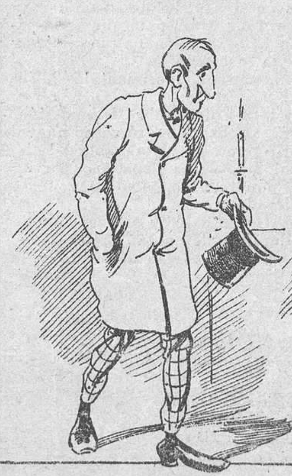
Las buenas tardes.