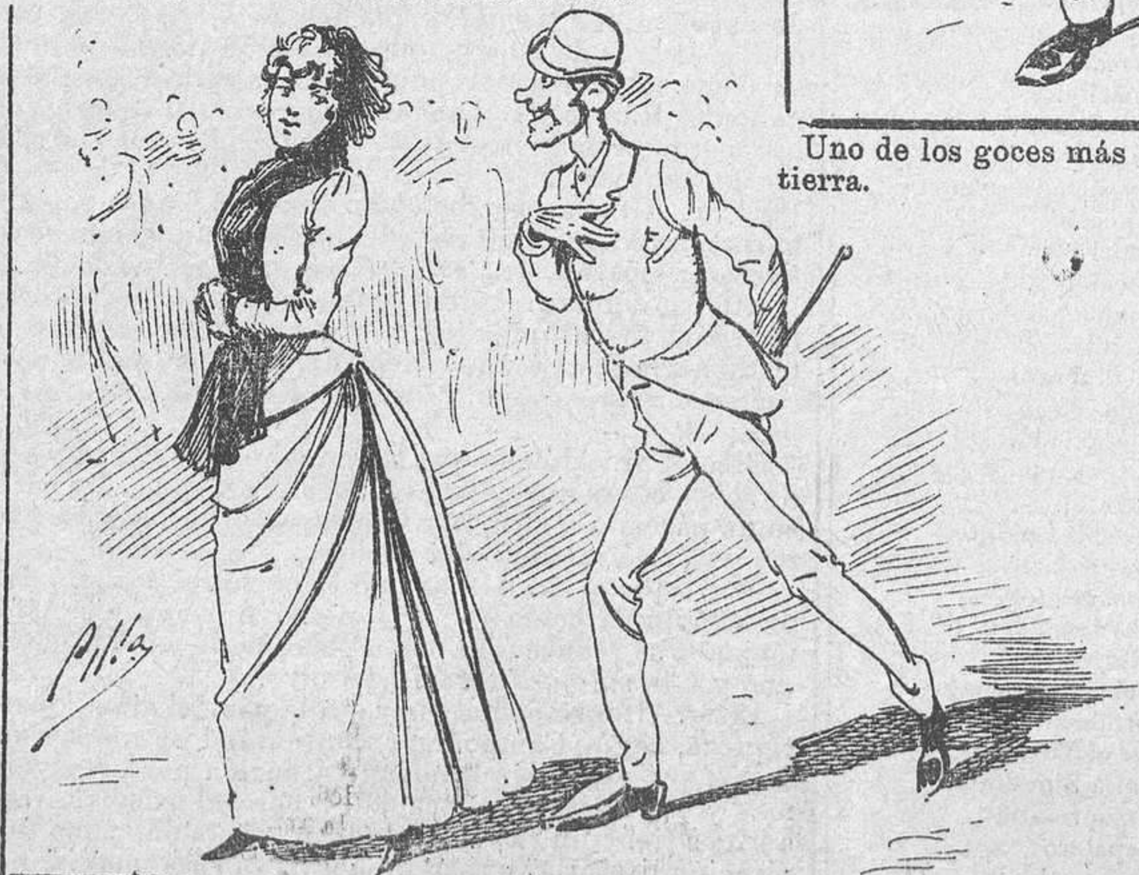
Para pasión..... la de este cura.

Uno de los goces más puros y candorosos de la tierra.