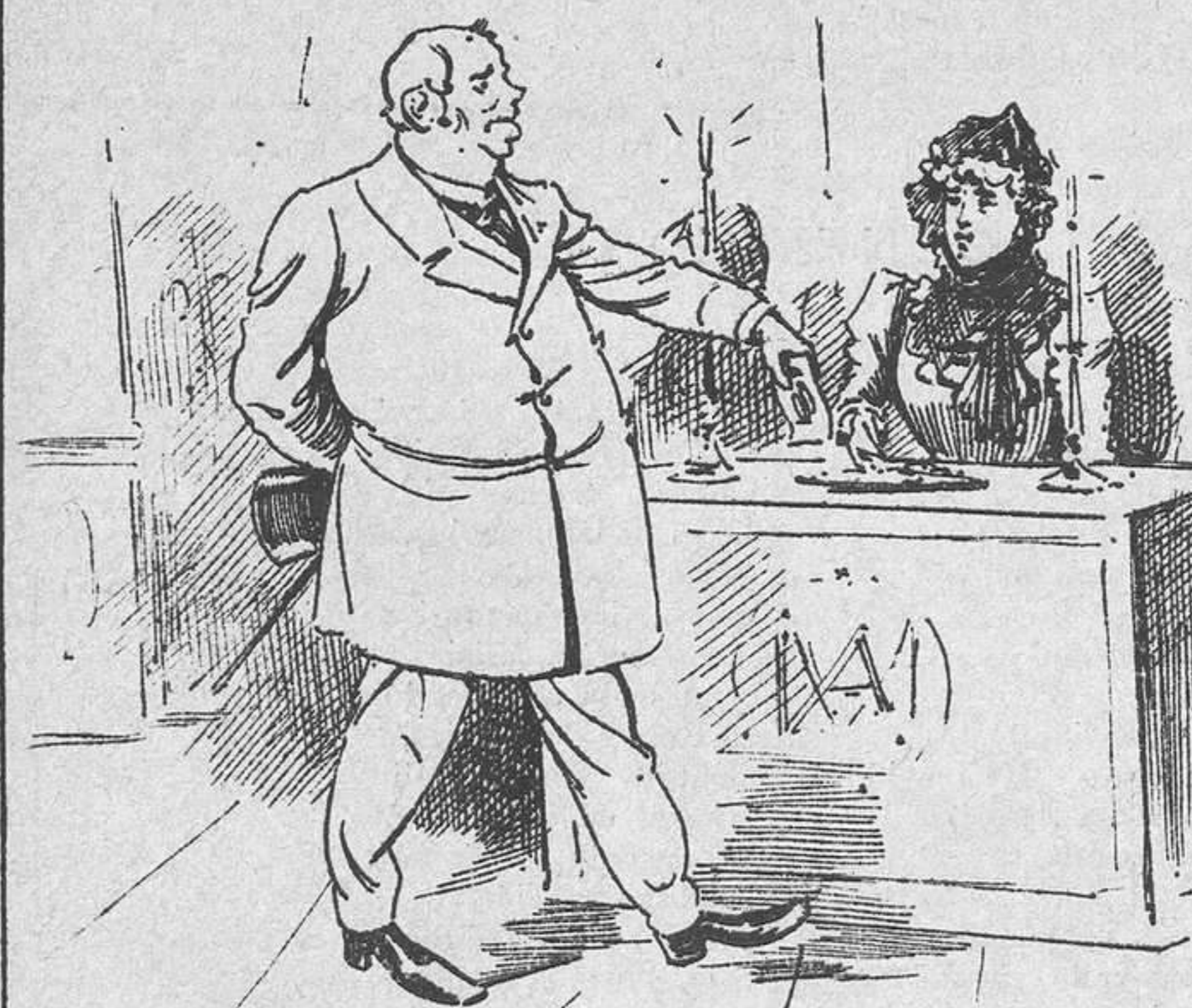
Un billete de cincuenta pesetas.

“.....Tengo el gusto de participar á usted que el próximo jueves pediré para los pobres en el oratorio de San Policarpo, de dos á cuatro de la tarde.....”