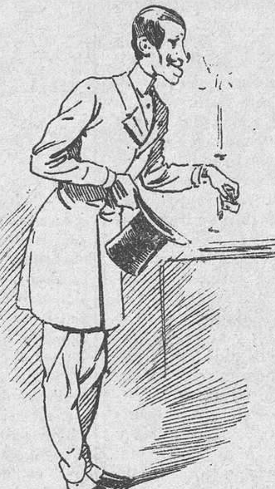
Otro ídem de veinticinco, procedente del bacarrat,