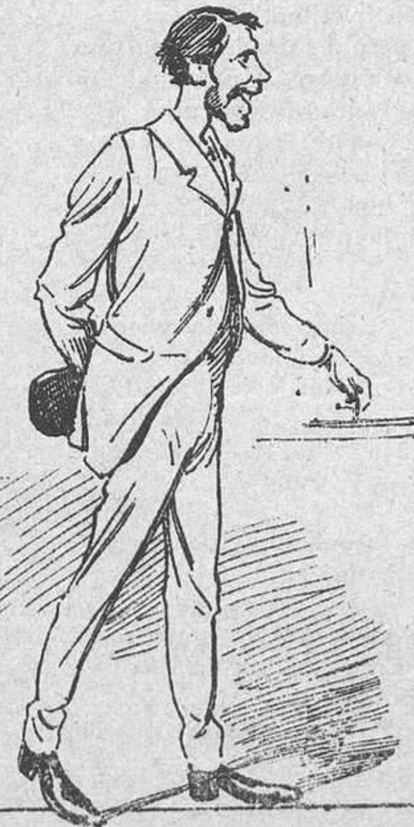
Dos nesetas..... falsas.