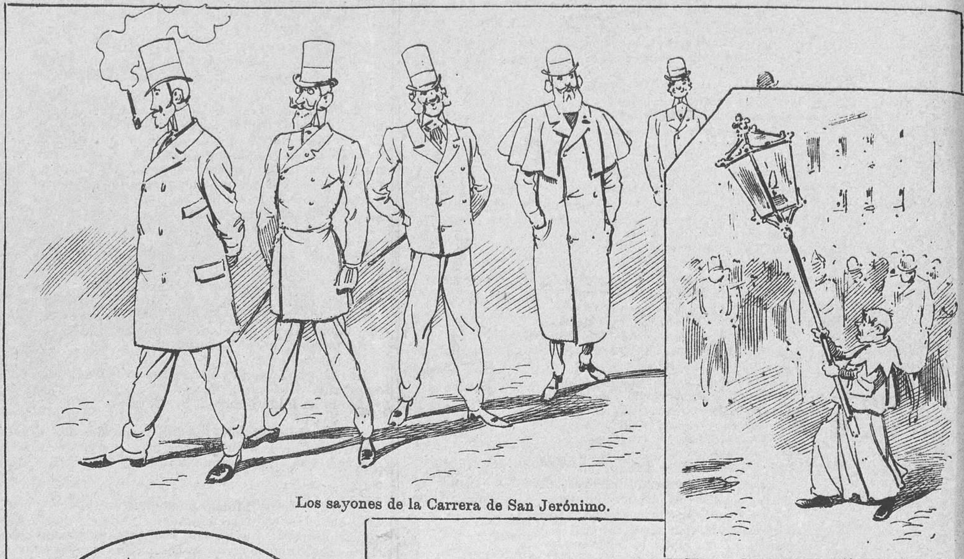
Los sayones de la Carrera de San Jerónimo.