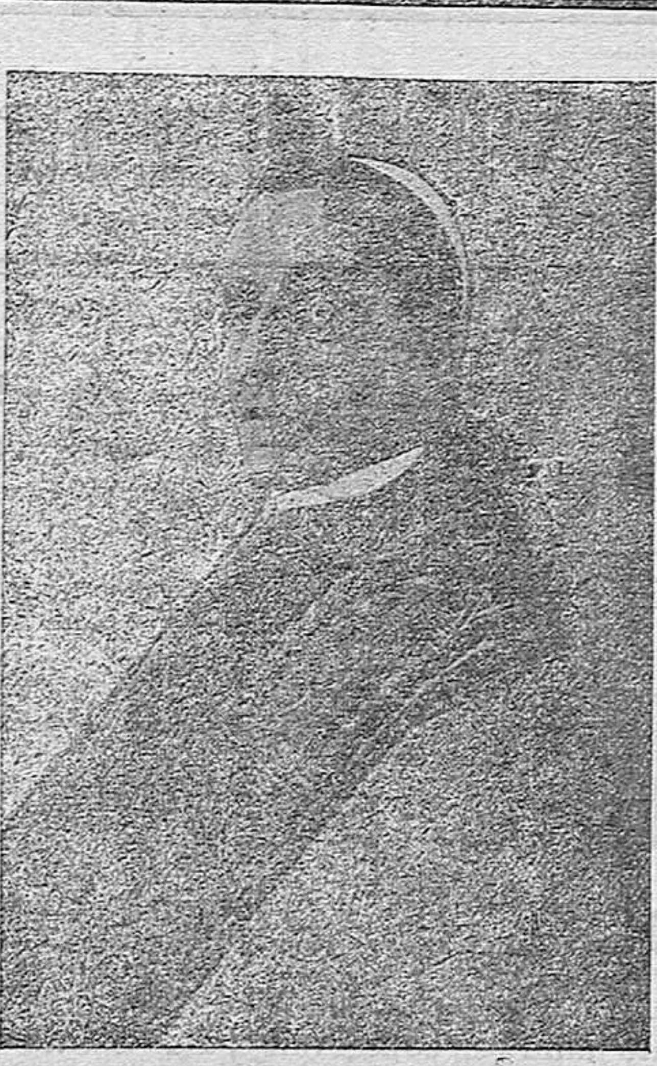
S. S. el Papa Benedicto XV † 22 Enero 1922

y aun no hace muchos días que LA MONTAÑA daba cuenta de un acto suyo, revelador de su altruismo y magnanimidad de corazón, conmovido por el hambre de esos desgraciados rusos inocentes víctimas de su propia inconsciencia, a los que envió un millón de libras para aliviarlos en su miseria.