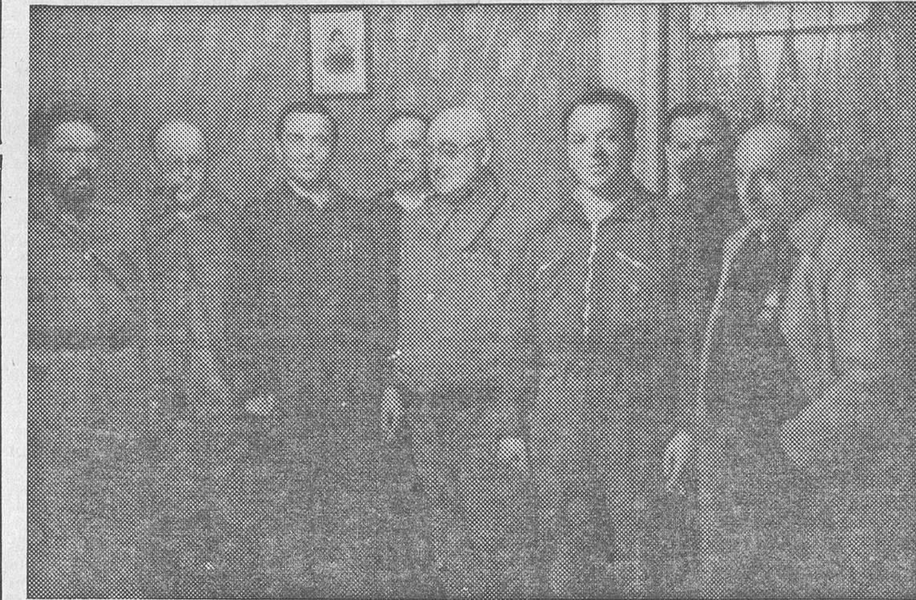
El general Miaja, caudillo insigne de la defensa de Madrid, y los camaradas que con él, y ante la emisora del Socorro Rojo Internacional, rindieron un homenaje a las heroicas fuerzas que hacen de Madrid un baluarte de la libertad inexpugnable

Las obras que, por tener ese carácter, han sido elegidas, se dividen en dos grupos: uno de ensanche interior, conforme a anti-proyectos municipales, y otro de apertura de nuevas vías de acceso, con arreglo a estudios del Gabinete de Accesos y Extrarradio. A estos dos grupos de obras se unirán las de los Enlaces ferroviarios, actualmente paralizadas; las de nuevas conducciones de Canales del Lozoya, las de reparación de carreteras próximas, cuyo tráfico ha adquirido durante este azaroso período proporciones enormes, y la construc-