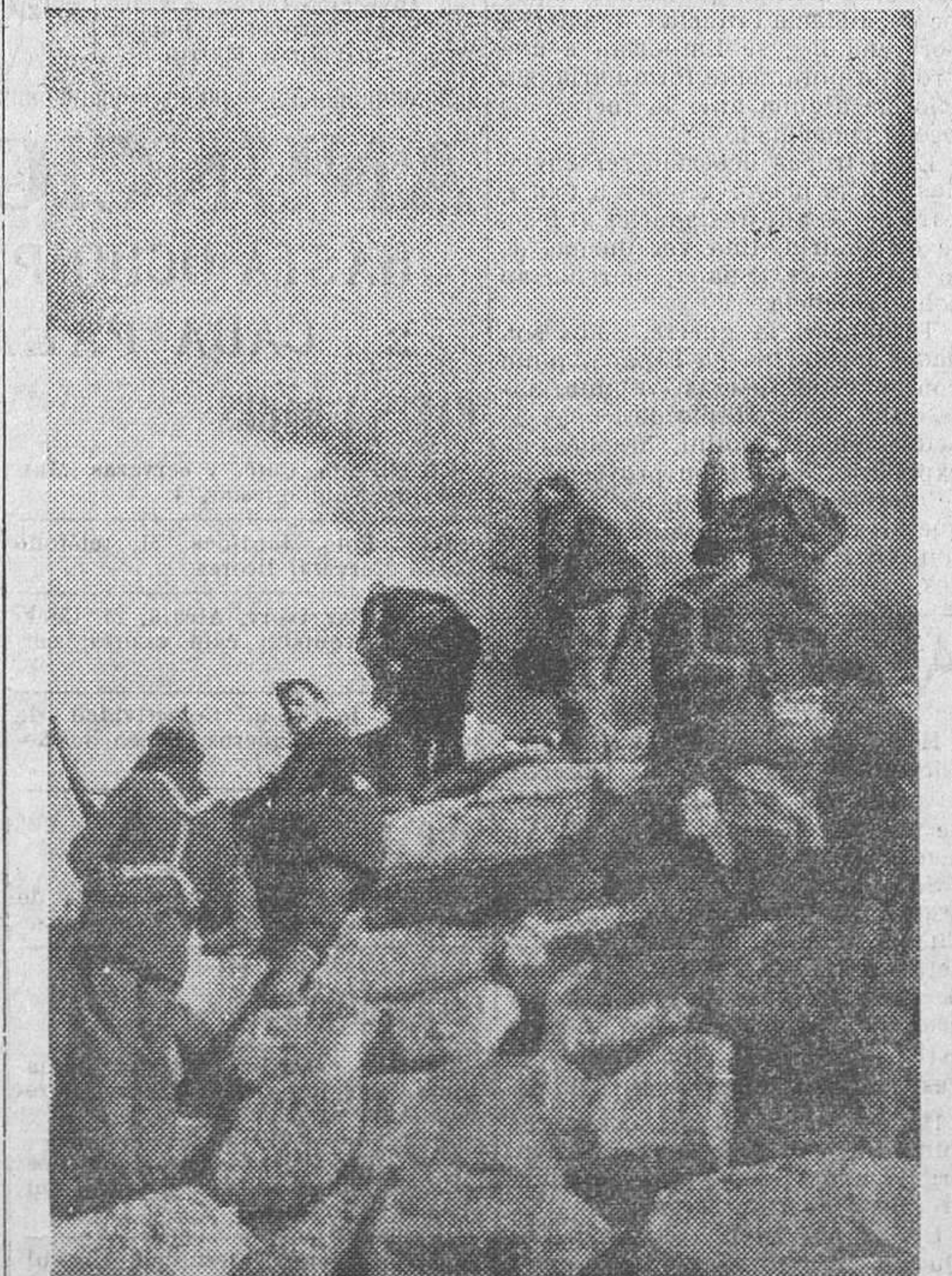
Los soldados del pueblo, atléticos y encendidos por un ideal humano, saltan por todos los obstáculos en su camino de victoria