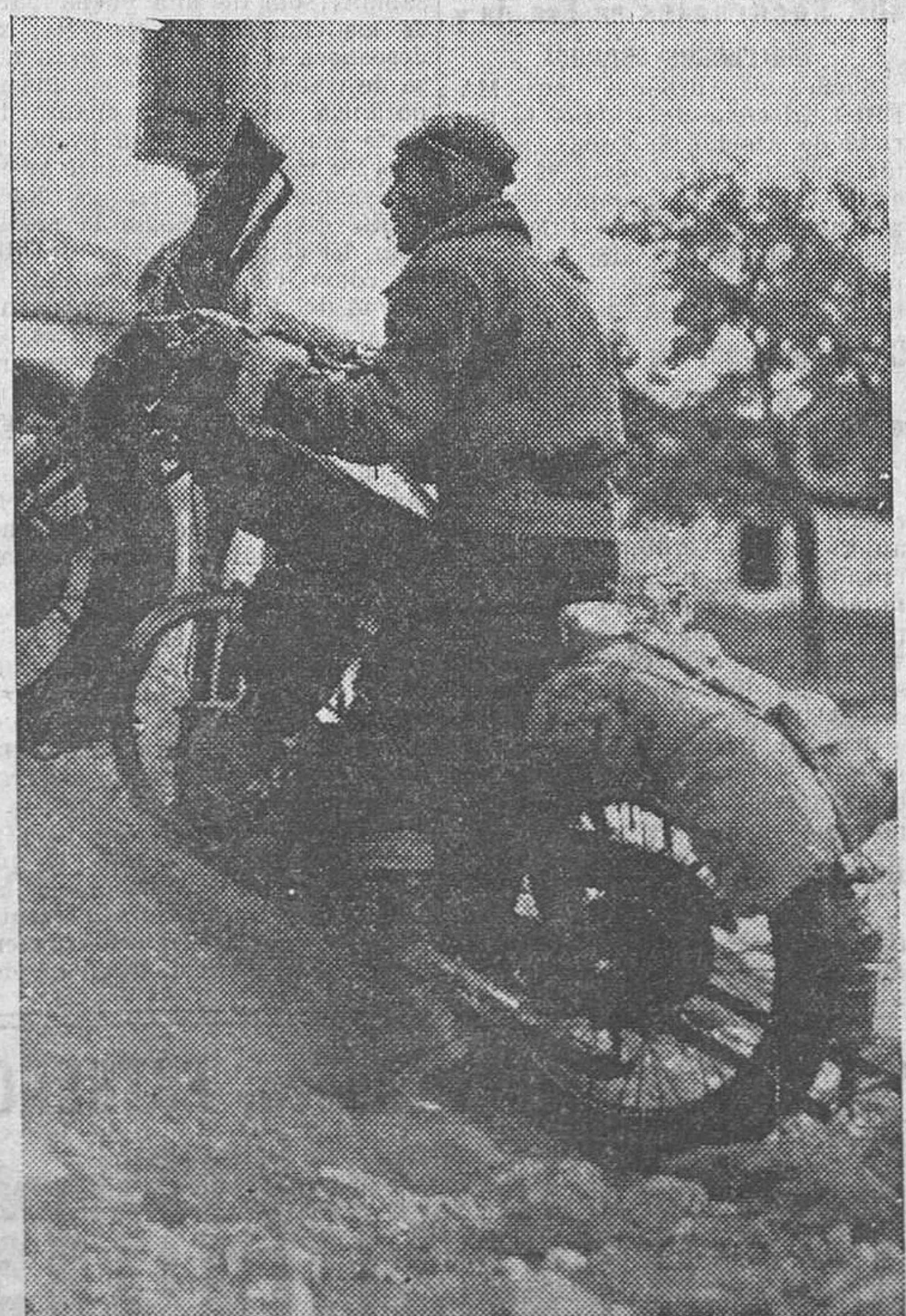
El magnífico y heroico servicio motorizado de enlace no se detiene ni en los caminos más intransitables para el cumplimiento de su importante misión

Por la mañana, dos bimotrices bombardearon en las cercanías de Málaga a los cruceros «Balears» y «Canarias», sin lograr alcanzarlos. El bombardeo de los mismos buques se repitió durante la tarde por otro bimotor, sin lograr tampoco resultado positivo.