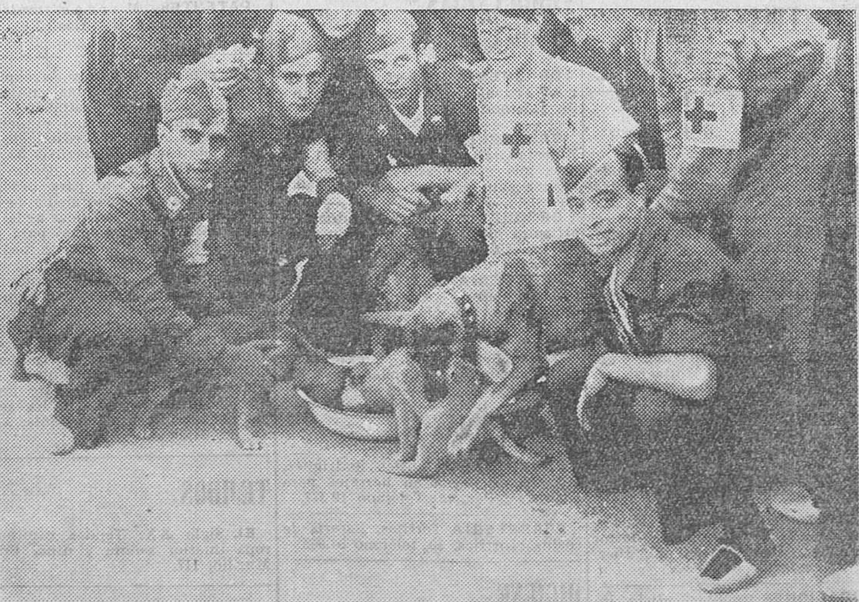
La Cruz Roja, en su humanitaria labor, atiende también en la línea de fuego a estos animalitos «amigos del hombre», que han nacido entre el humo de la pólvora y los gritos entusiastas de los combatientes republicanos al atacar a los fascistas

Berlin, 28.—Ludendorff, hablando de la situación actual, dice que la actitud de Francia, Bélgica y Rusia es más comprensible, habiendo adoptado una política más moderada que el Gobierno del Reich respecto a Marruecos, y escribe que Francia teme que Franco pague las deudas que ha contraído con Alemania por el auxilio recibido en la actual guerra civil con el Marruecos español y sus minerales. Franco—dice—debe pagar de una manera o de otra.