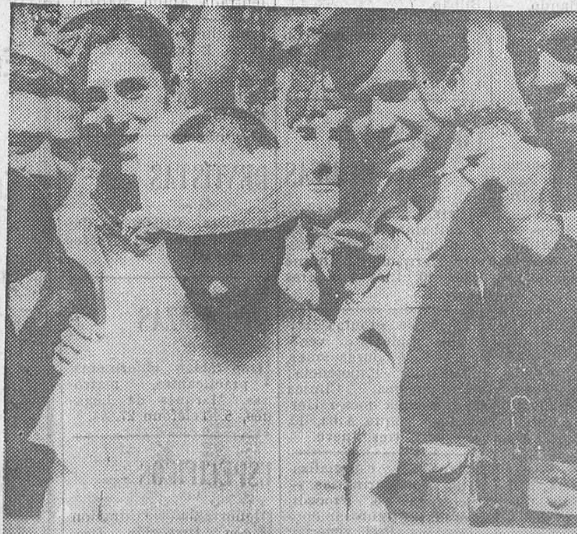
Un jefe faccioso detenido por las milicias en la Sierra, vestido de moro