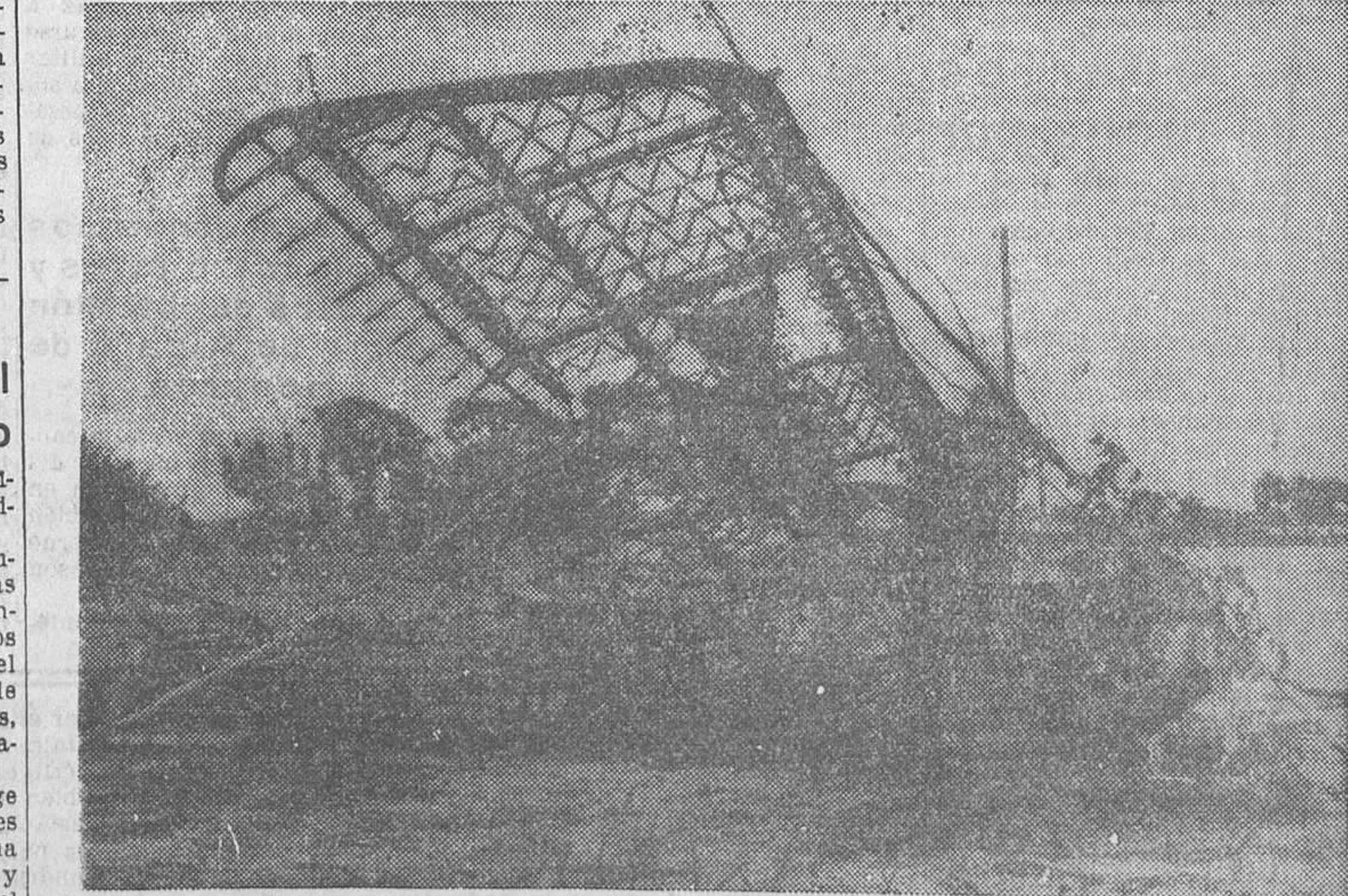
EL AVANCE DE NUESTRAS TROPAS EN LA PROVINCIA DE BADAJOZ.—Este avión, que pertenece a los rebeldes, fué abatido por la aviación nuestra durante uno de los combates recientes, en los que nuestros aviadores dieron buena prueba de energía y técnica. Vedlo aquí destruido, después de su incendio.

Hay un poco de tertulia en el comedor del Cuartel general. El coronel ASENSIO, tan fino, tan amable, obsequia con cerveza a