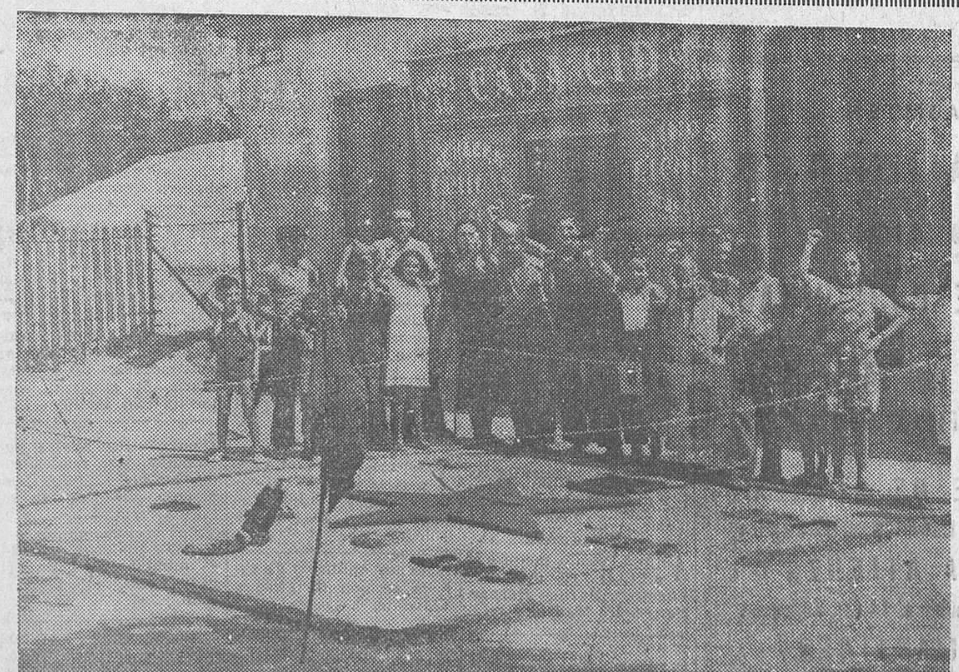
Los pioneros haciendo dibujos en las aceras de las calles de Madrid para recaudar fondos destinados a los hospitales de sangre

Al mismo tiempo hace un llamamiento a todas las mujeres españolas, sean o no asociadas a esta Agrupación, para que aporten su ayuda a la confección de toda clase de prendas.