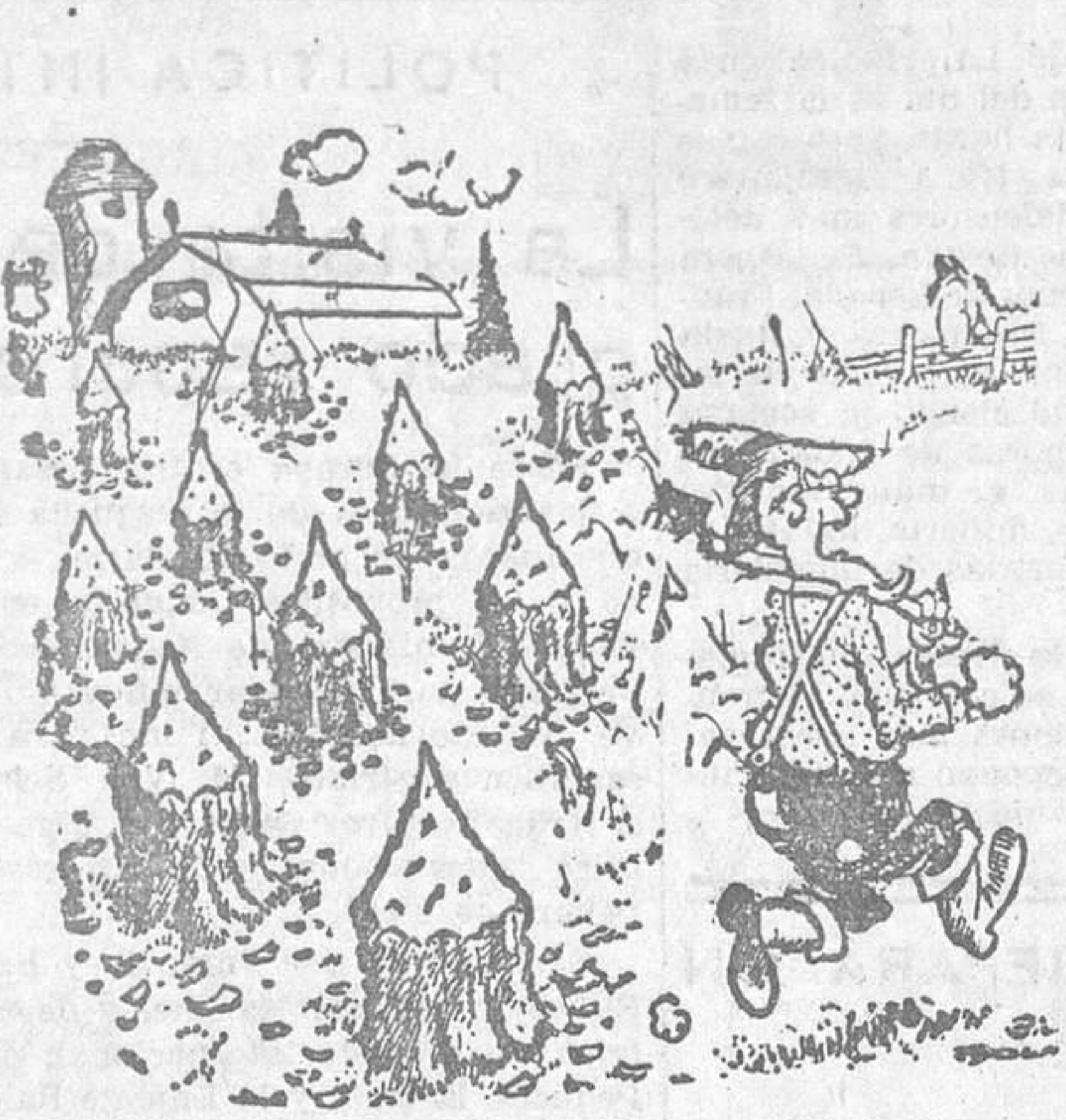
—Así aprenderán estos trabajadores holgazanes a no sentarse durante las horas de faena.