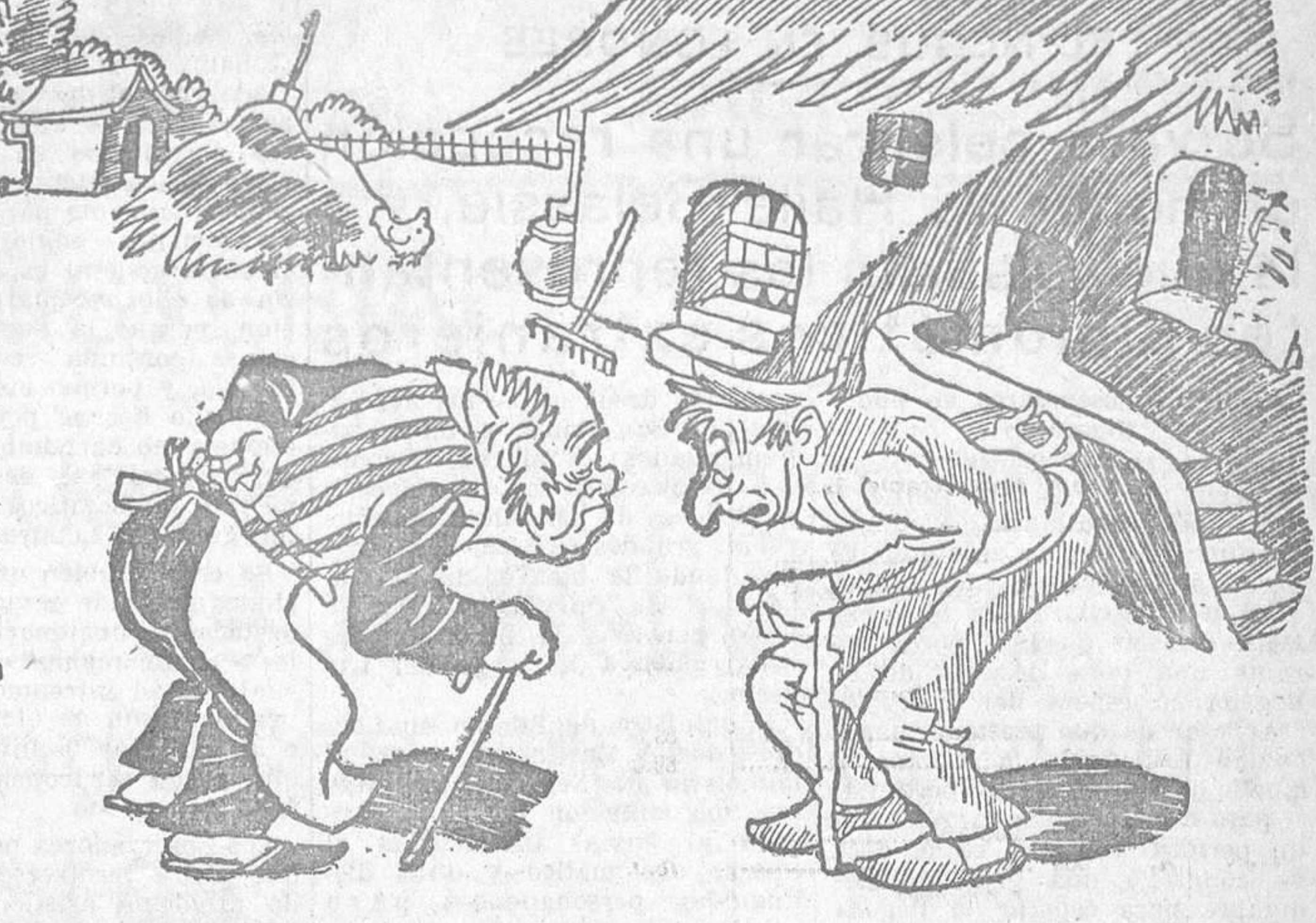
DEFORMACION PROFESIONAL. El rústico.—Yo me encuentro así de trabajar la tierra. El detective del hotel.—Yo, de mirar por todos los agujeros de la cerradura.