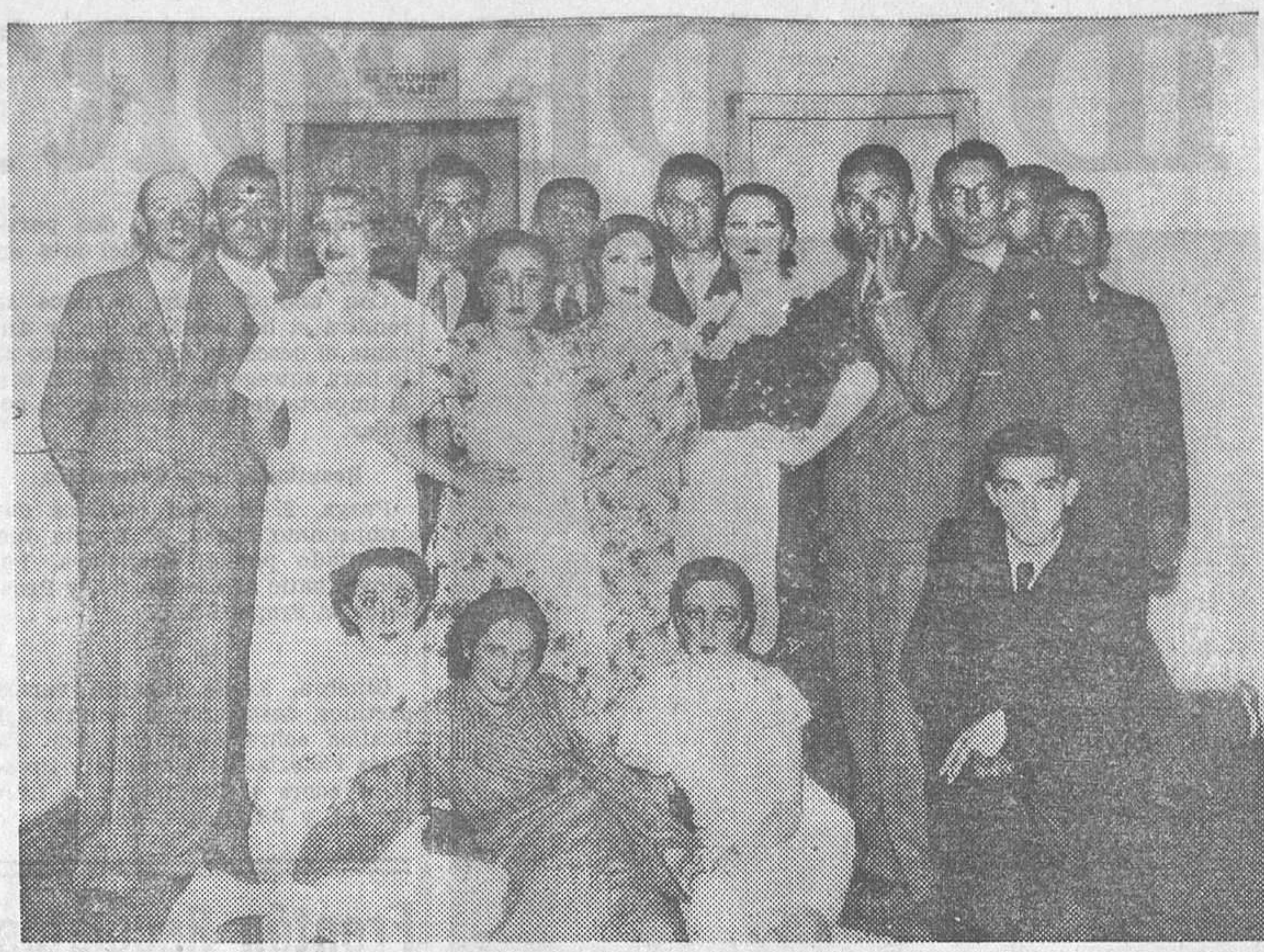
EN EL TEATRO DE LA COMEDIA.—Grupo de intérpretes afortunados que han estrenado en este teatro un sainete lírico, en función a beneficio de la Cruz Roja

Esperamos de los trabajadores de toda la región la asistencia al acto.—El Comité regional.