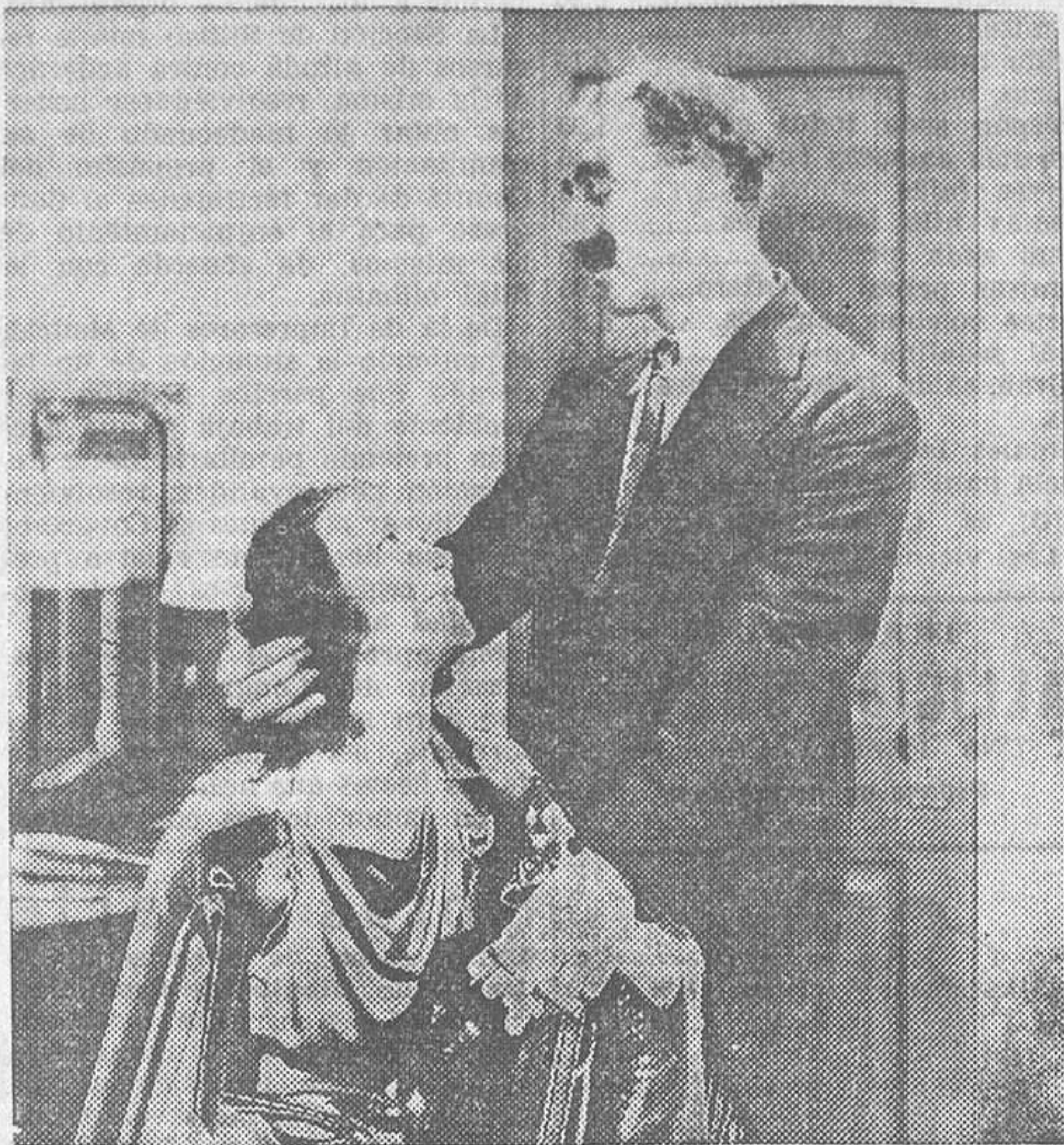
Una escena de «Una noche en la Opera», film cómico de gran éxito que la Metro-Goldwyn-Mayer exhibe en Capitol