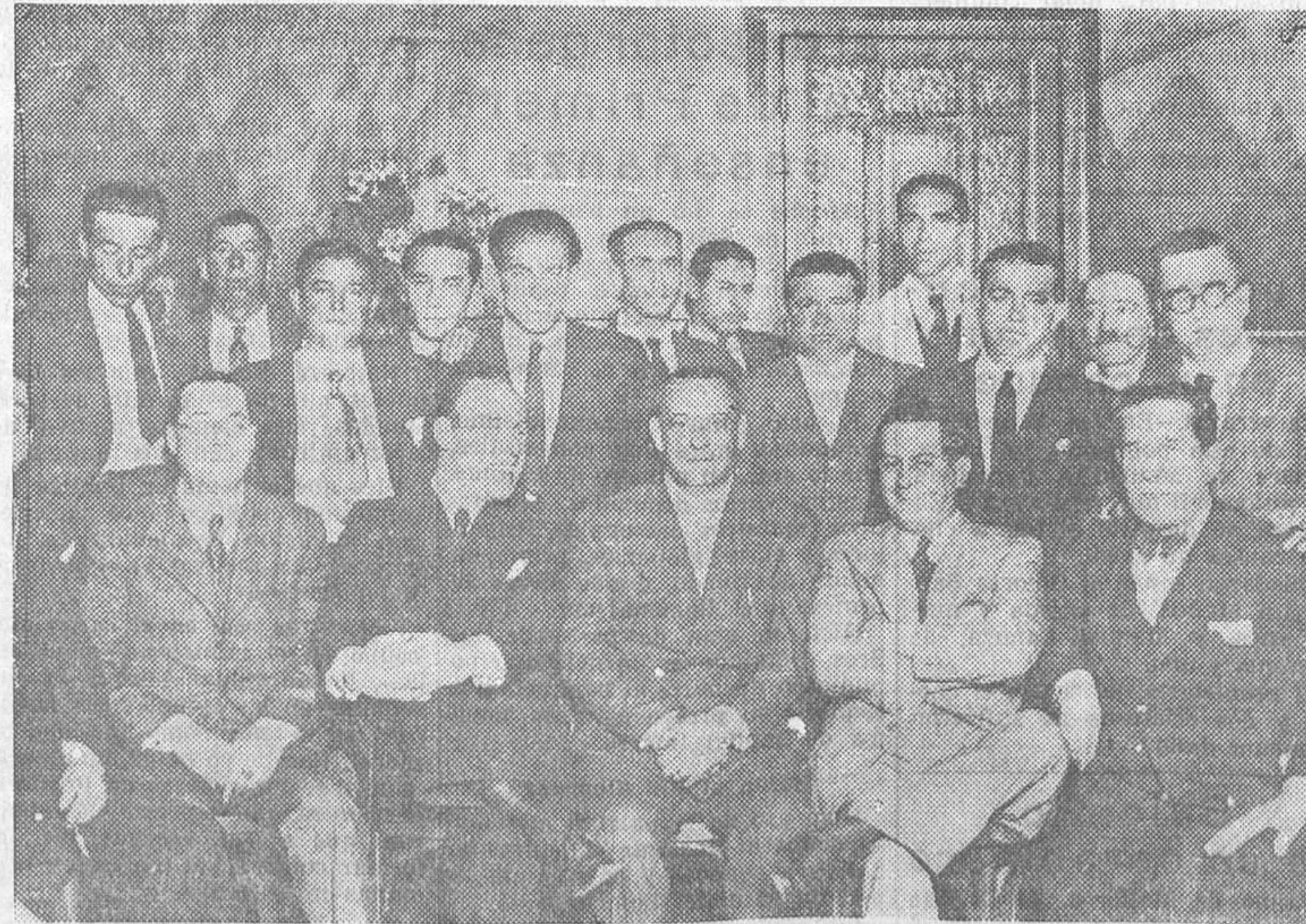
Banquete íntimo con que la nueva Empresa de la plaza de toros de Tetuán ha obsequiado a los críticos taurinos e informadores gráficos, con motivo de la inauguración de la temporada.

El problema no es baladí. Seguiremos insistiendo. Nuestros propósitos son nobles. Y un deber elemental nos obliga a desenmascarar esa carcoma que corroee las Escuelas Normales.