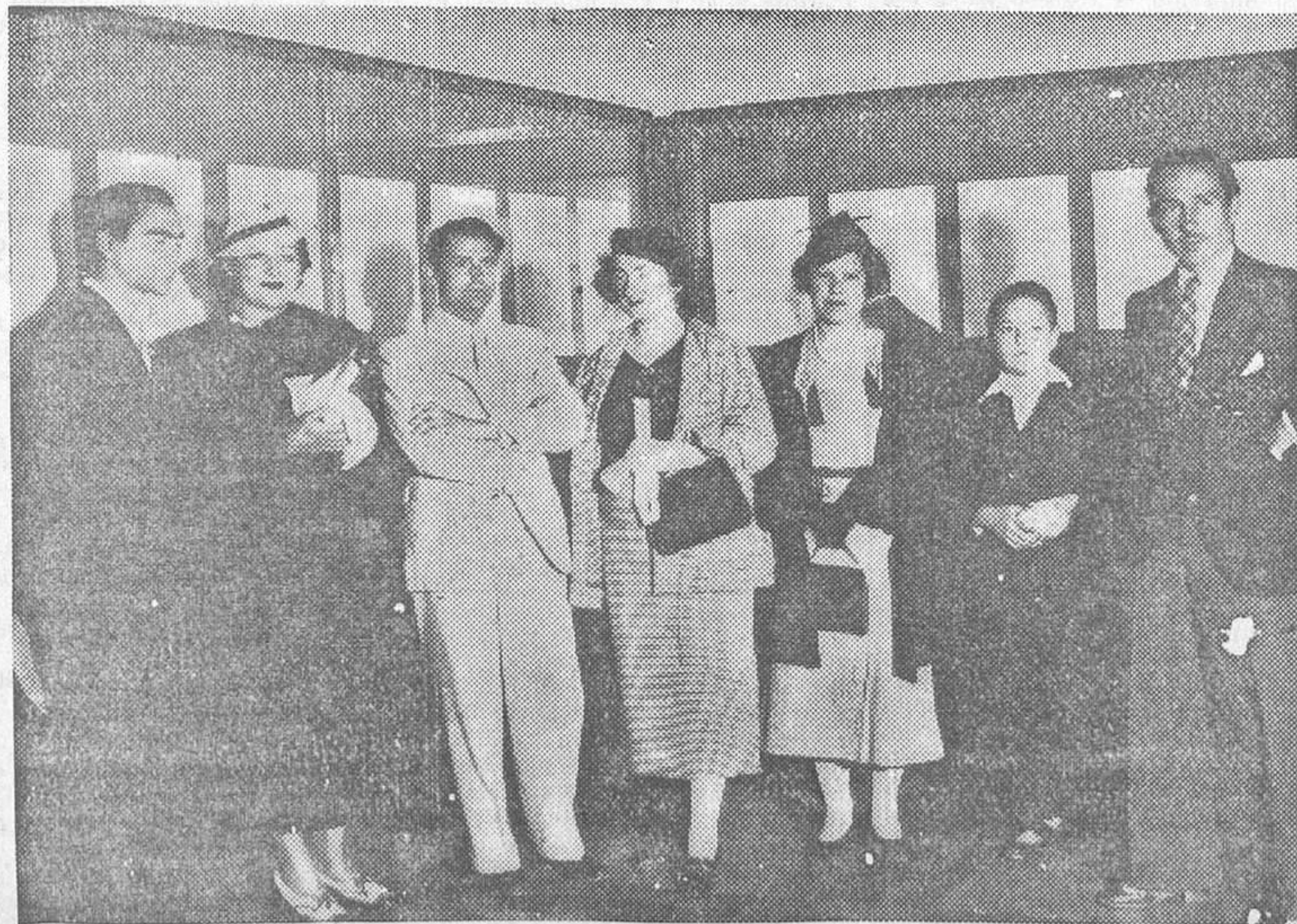
Inauguración de la Exposición de dibujos de Gregorio Prieto, en el Museo de Arte Moderno

Cuando acudieron los bomberos el incendio había destruído por completo el edificio y la gran cantidad de mercancías almacenadas en él. Se calculan las pérdidas en unas setenta mil pesetas.