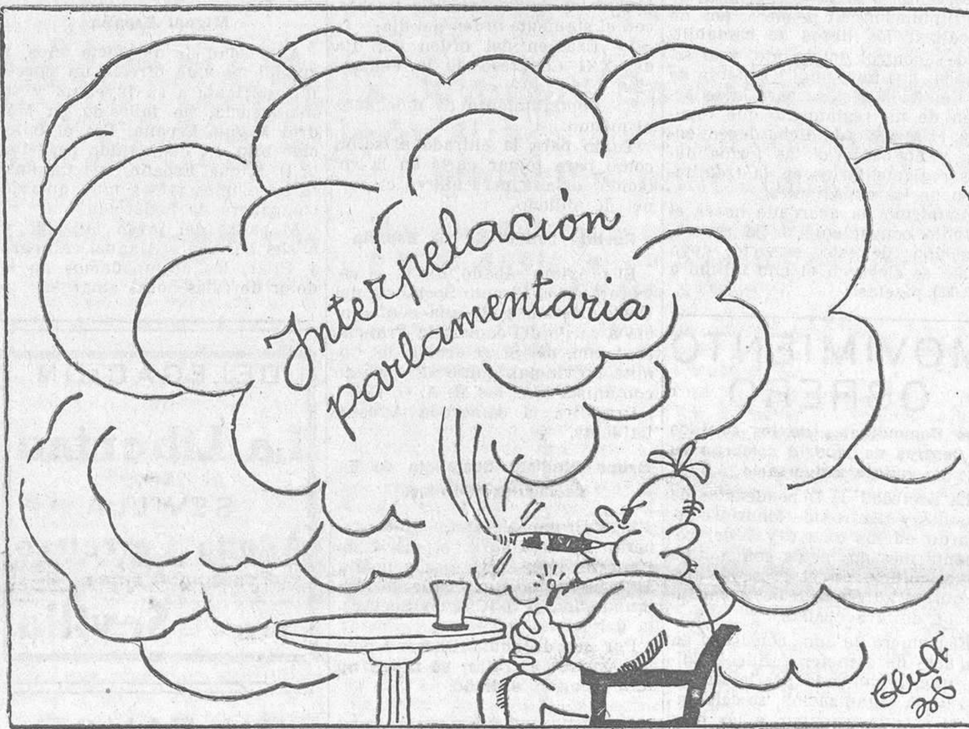
LA BREVA DE YESTE, por Bluff

Pues bien; la enorme cantidad de experiencias—¡cincos años consecutivos de agresión a la República!—y la actividad acrecida de los enemigos del régimen requieren una actitud neta y terminante. Aunque haya que modificar algunos viejos conceptos de la democracia. Porque ello también modificaría con ventaja los principios de acción, hoy imprescindibles para sostener los regimenes.