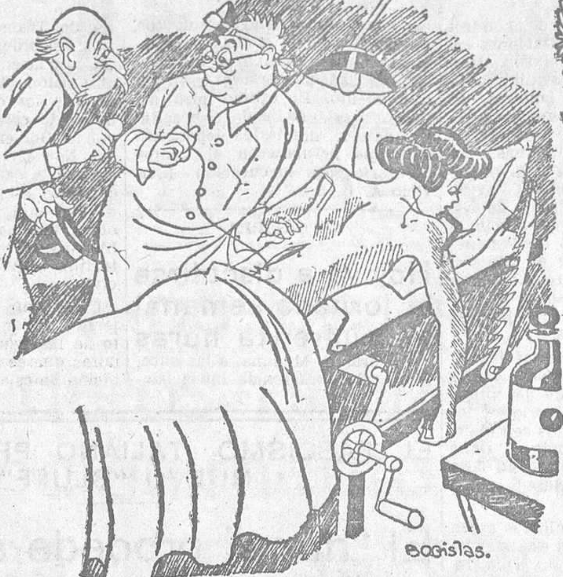
El marido.—Tenga otros veinte francos.. y hágame el favor de hacerle lo mismo en la boca.