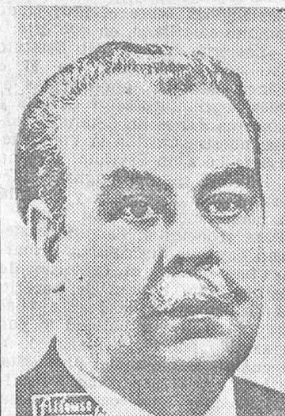
Don Manuel Blasco Garzón, ministro de Justicia

El ministro de JUSTICIA hace el resumen del debate.