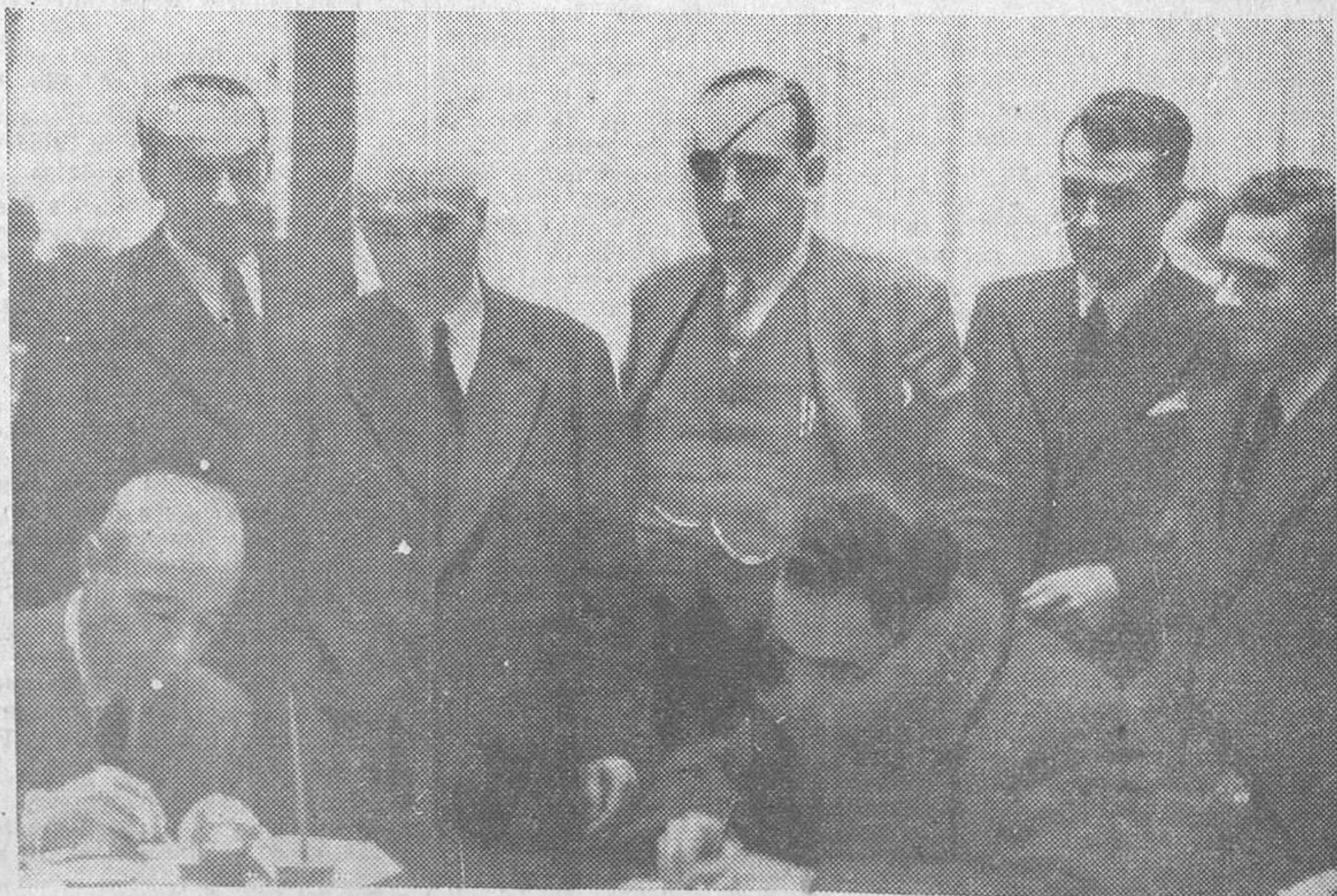
AYER EN EL CONGRESO.—El presidente y miembros de la Comisión parlamentaria dando cuenta a los periodistas de lo tratado sobre el «affaire» Taya