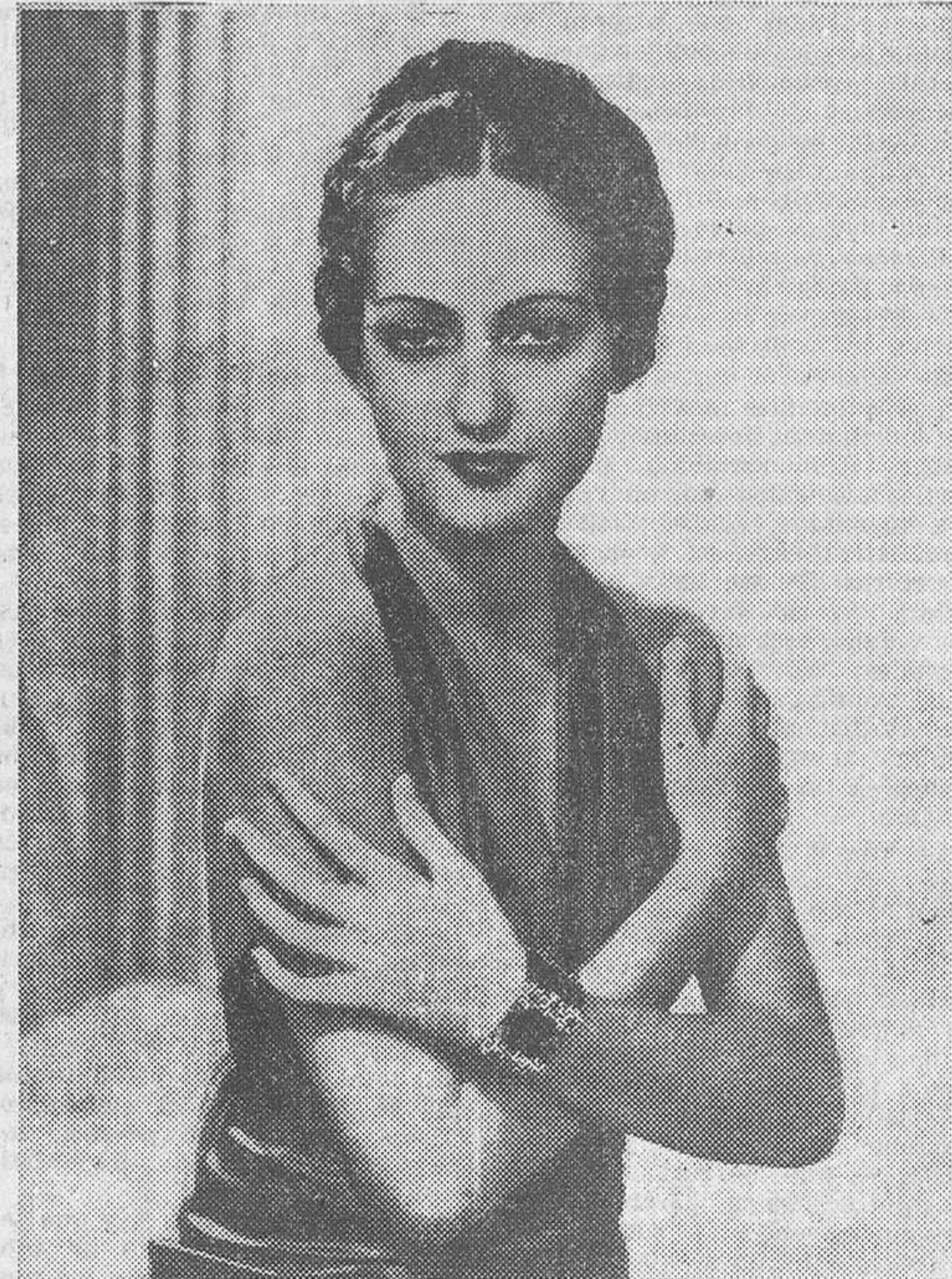
EL UNICO INCONVENIENTE DE LA RADIO.—Es lamentable que no se practique la televisión cuando las radioemisoras son como Dorothy Lamour, nueva estrella que ha cantado en las sesiones de la N. B. C.

Las experiencias, tienen por objeto establecer comunicaciones no sólo entre las islas, sino asegurar el enlace en el interior del país entre localidades que a veces se encuentran a grandes distancias unas de otras. La Administración noruega considera que obtendrá, además, grandes economías, evitándose lo costoso de las líneas aéreas y el de los cables por mar.