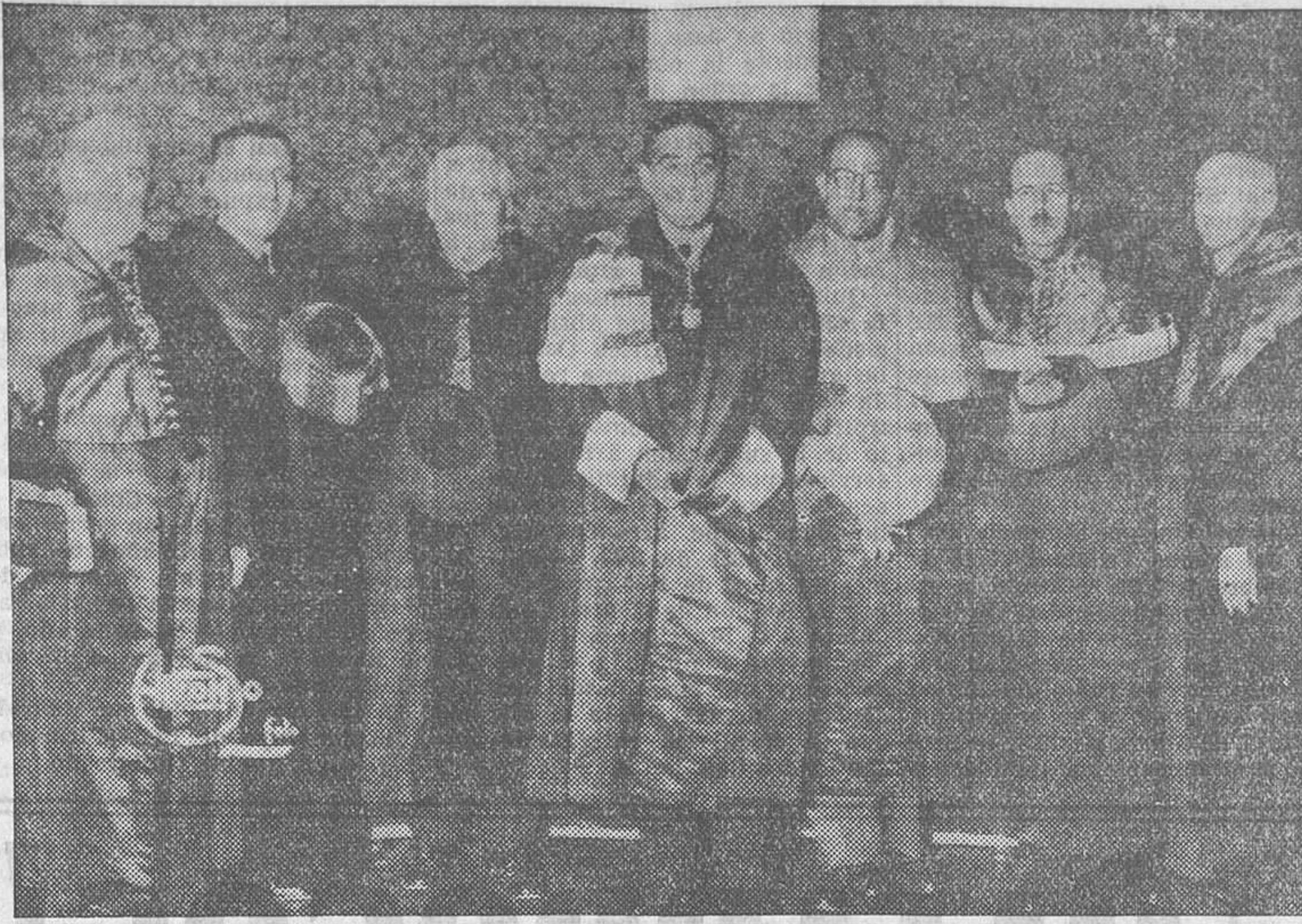
EN LA UNIVERSIDAD CENTRAL.—El doctor Marañón, acompañado de distintas personalidades, momentos antes de inaugurar el ciclo de conferencias organizado por el Colegio de Doctores