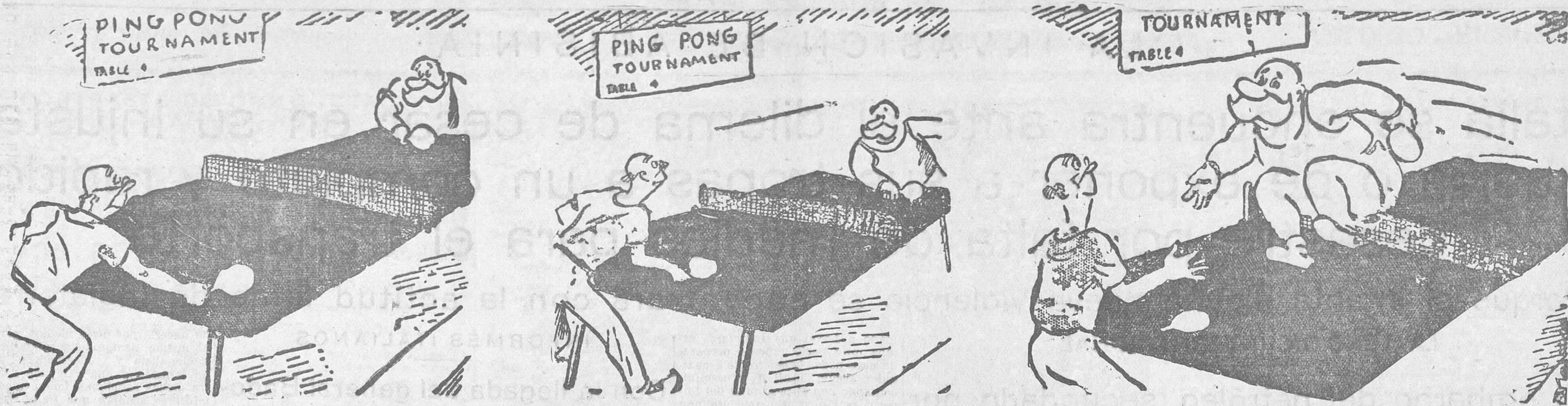
La costumbre del "tennisman"