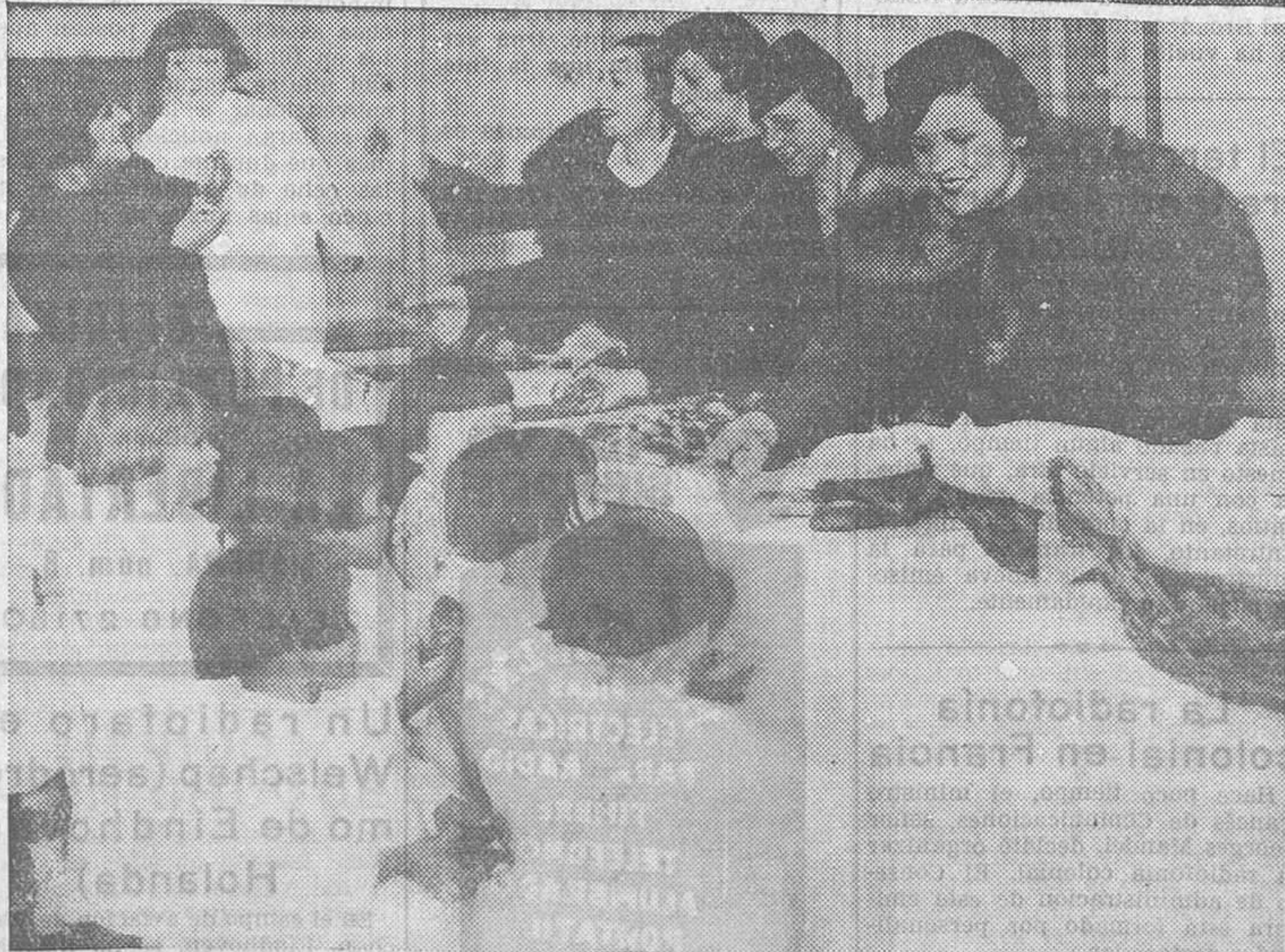
Grupo de niñas de la Inclusa que ayer tarde fueron obsequiadas con una merienda costada por el Gobierno civil y la Diputación provincial.—Abajo, señoritas repartiendo el obsequio a las pequeñas.