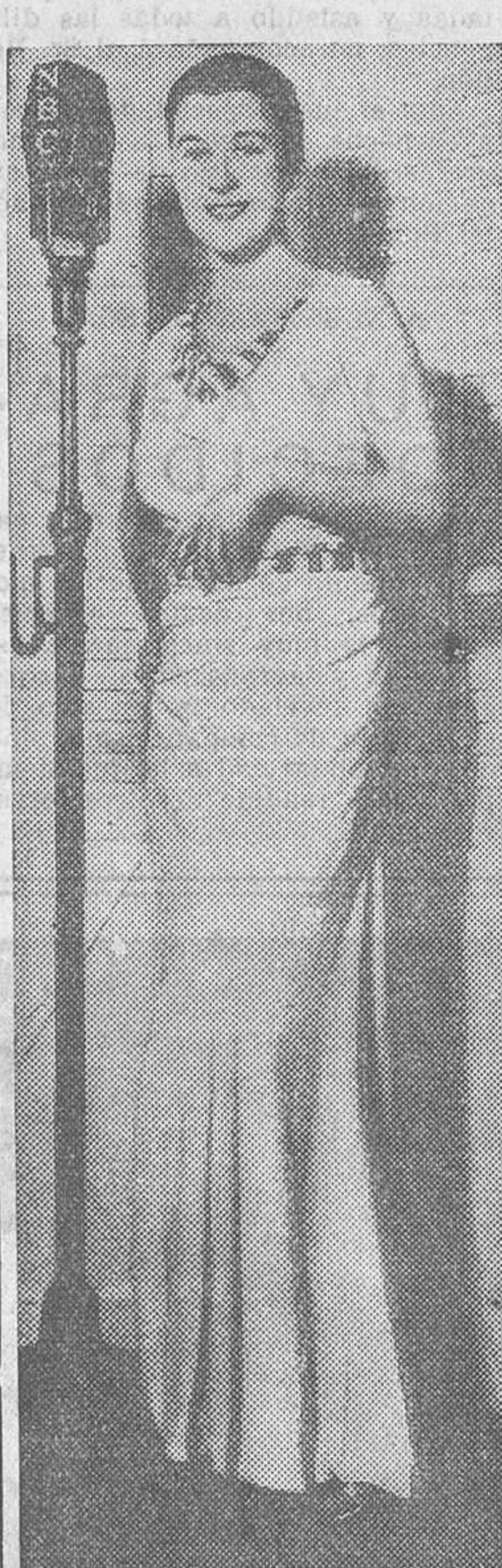
La famosa Beatrice Lillie ante el micrófono de la W. J. Z.

En la Prensa se atribuye gran importancia a esta iniciativa, porque se estrecha así el lazo entre la metrópoli y las colonias.