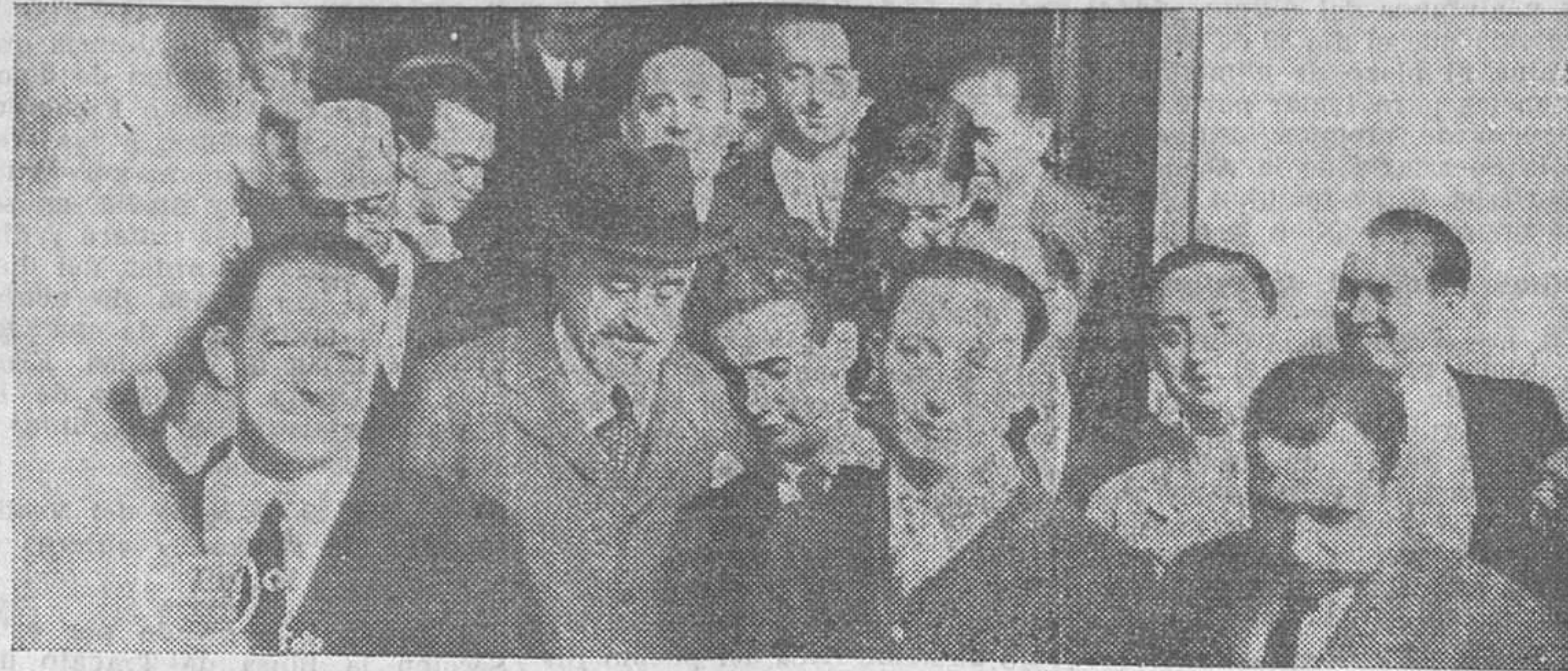
El presidente de la Cámara, Sr. Alba, saliendo de Palacio después de dar cuenta a su excelencia de la marcha de sus gestiones para formar Gobierno

Y es que resulta muy fácil adquirir automotores «voladores», aunque cuesten 1.800.000 pesetas. Pero es muy difícil regentar negocios de la envergadura de nuestras grandes Empresas ferroviarias.