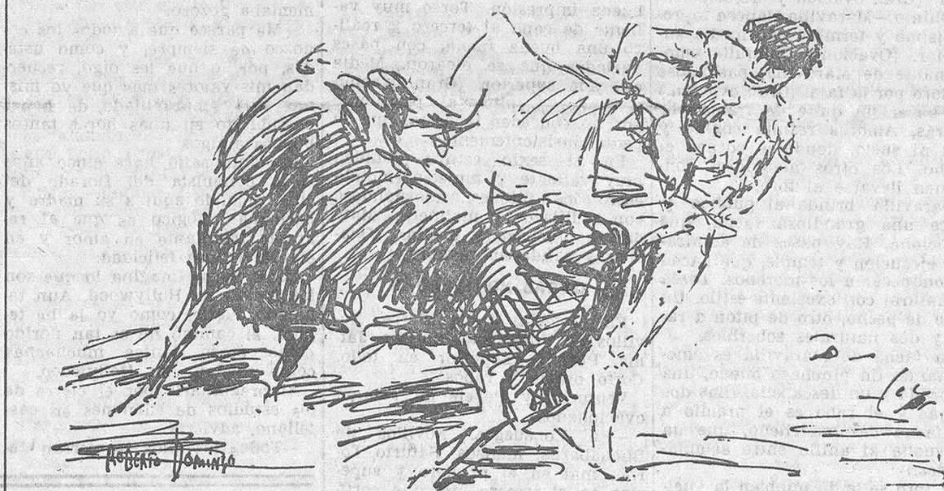
EL DOMINGO EN MADRID.—Belmonte en la magnífica media verónica al sexto toro

zado premio en un concurso. El cuarto, su segundo, de Coquilla, fué un manso huido, que echaba la cara por delante y ponía la cabeza en las nubes, como demostró en el último par de banderillas a cargo de Rosalito.