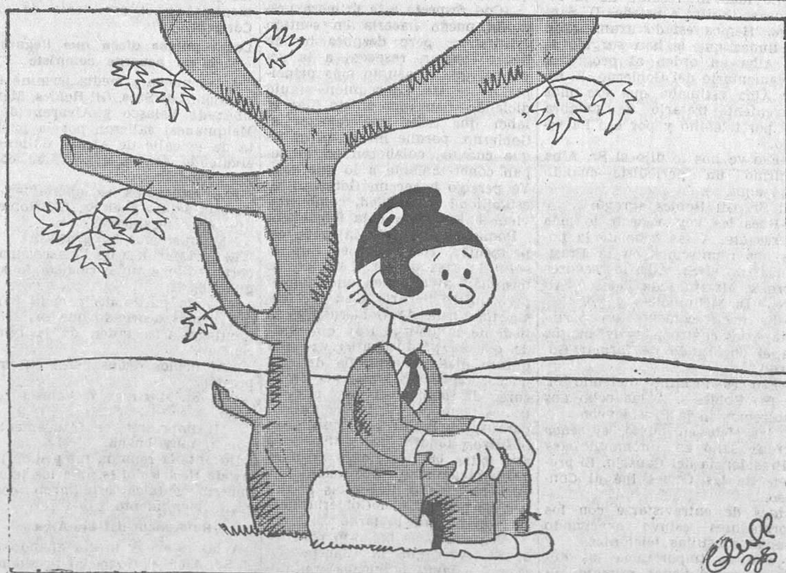
FALTA DE COSTUMBRE, por Bluff —Convivencia civil... ¡Qué palabras más raras! Yo conozco convivencia incivil.

listas que, sin renuncia de su ideario, hayan desenvuelto su actividad conforme a los métodos y cauces de la norma constitucional.»