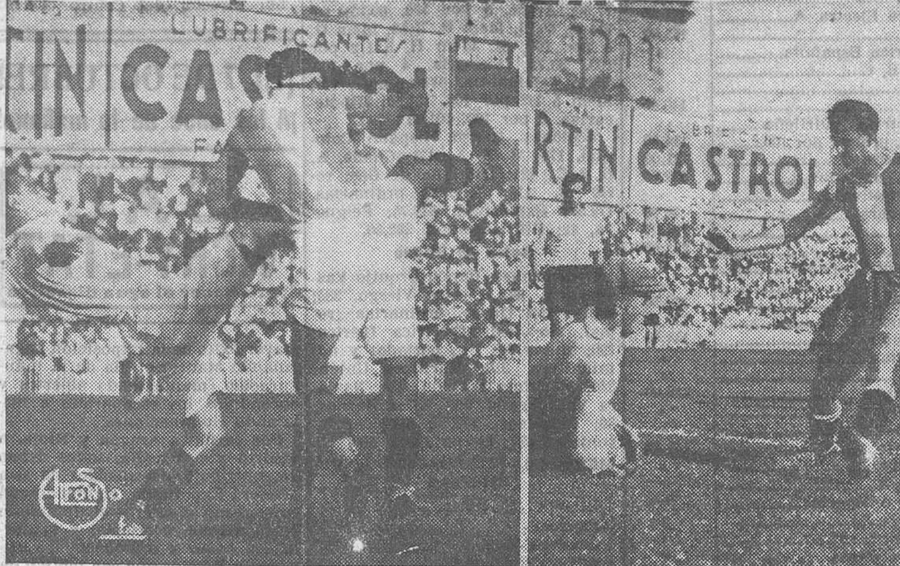
LOS PARTIDOS DEL DOMINGO EN MADRID.—Un momento del encuentro Madrid-Valladolid.—Una intervención del portero del Racing en el partido Racing-Nacional

Arbitró García Soletó. Equipos: Ferroviaria: Gómez; Graifo, Villalba; Gorospe, Muleiro, Pablito; Alonso, Peña, Romero, Molero, Brazales. Carabanchel: Zamorita; Sana-