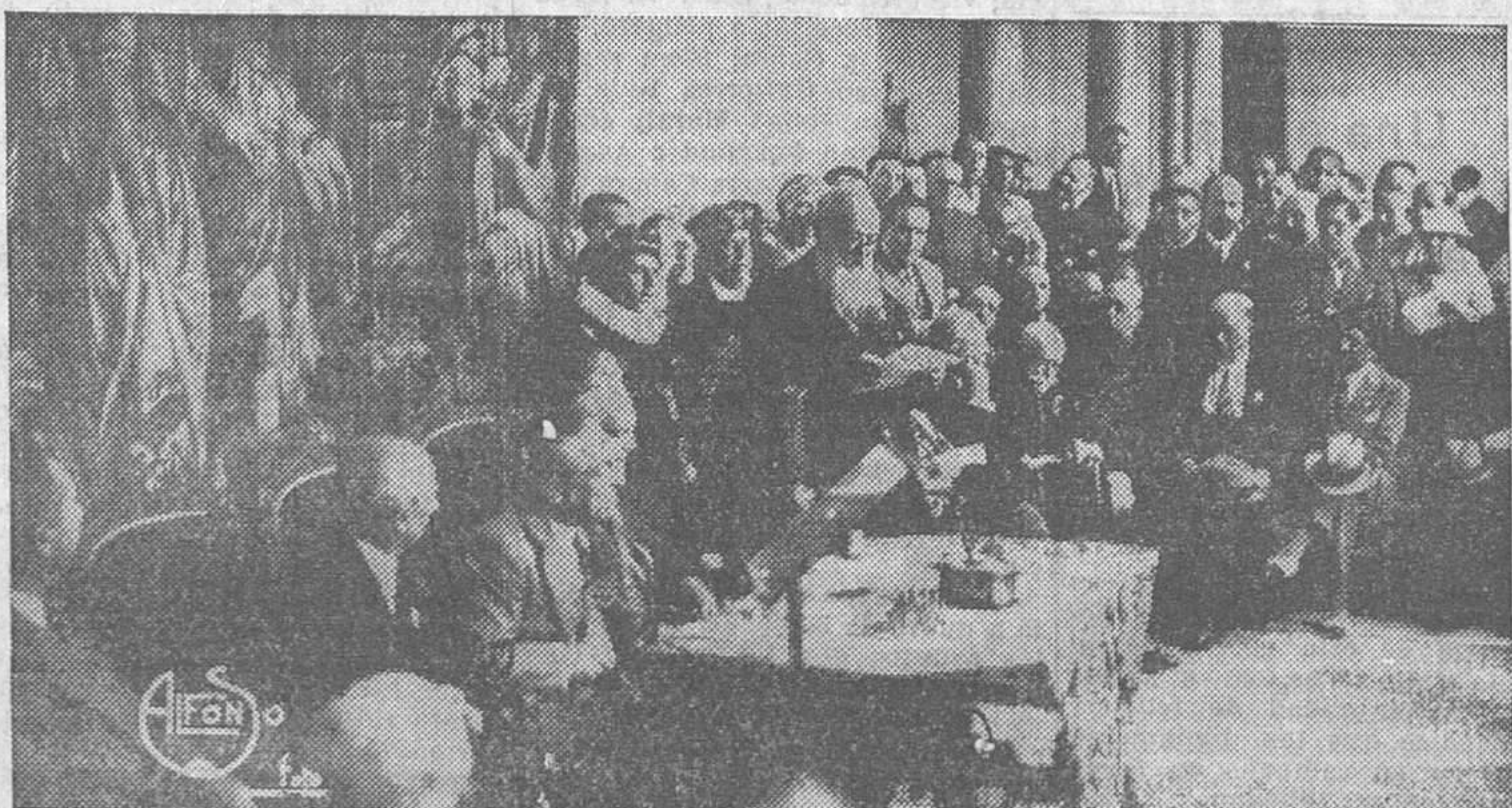
DECIMO CONGRESO INTERNACIONAL DE HISTORIA DE LA MEDICINA.—Un congresista extranjero durante un discurso en el acto de la inauguración de dicho Congreso en el Hospital de Santa Cruz, en Toledo

España, tan buena, tan resignada, tan sobria, es la criada ideal; la criada que duerme en el suelo y trabaja de balde,