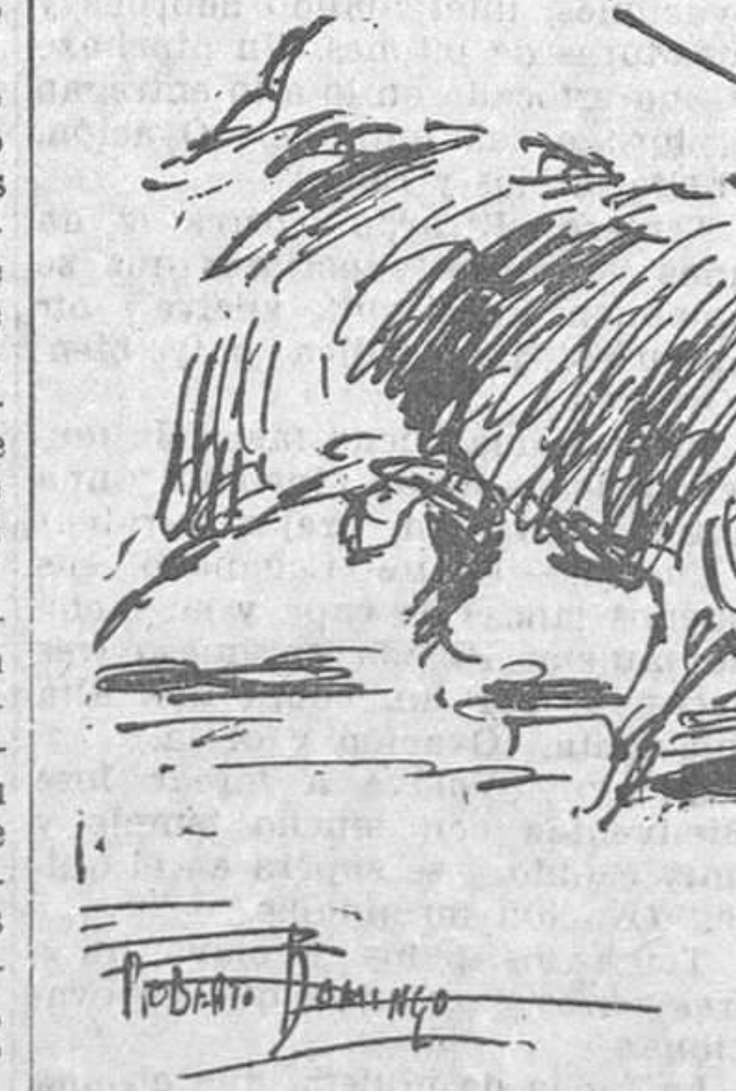
EL DOMINGO EN MADRID.—Corrochano en el sexto toro, del que se le concedieron las orejas y rabo

delante para esquivar un momento de peligro, se inició un griterío injusto, que dió al traste con los ánimos del espada.