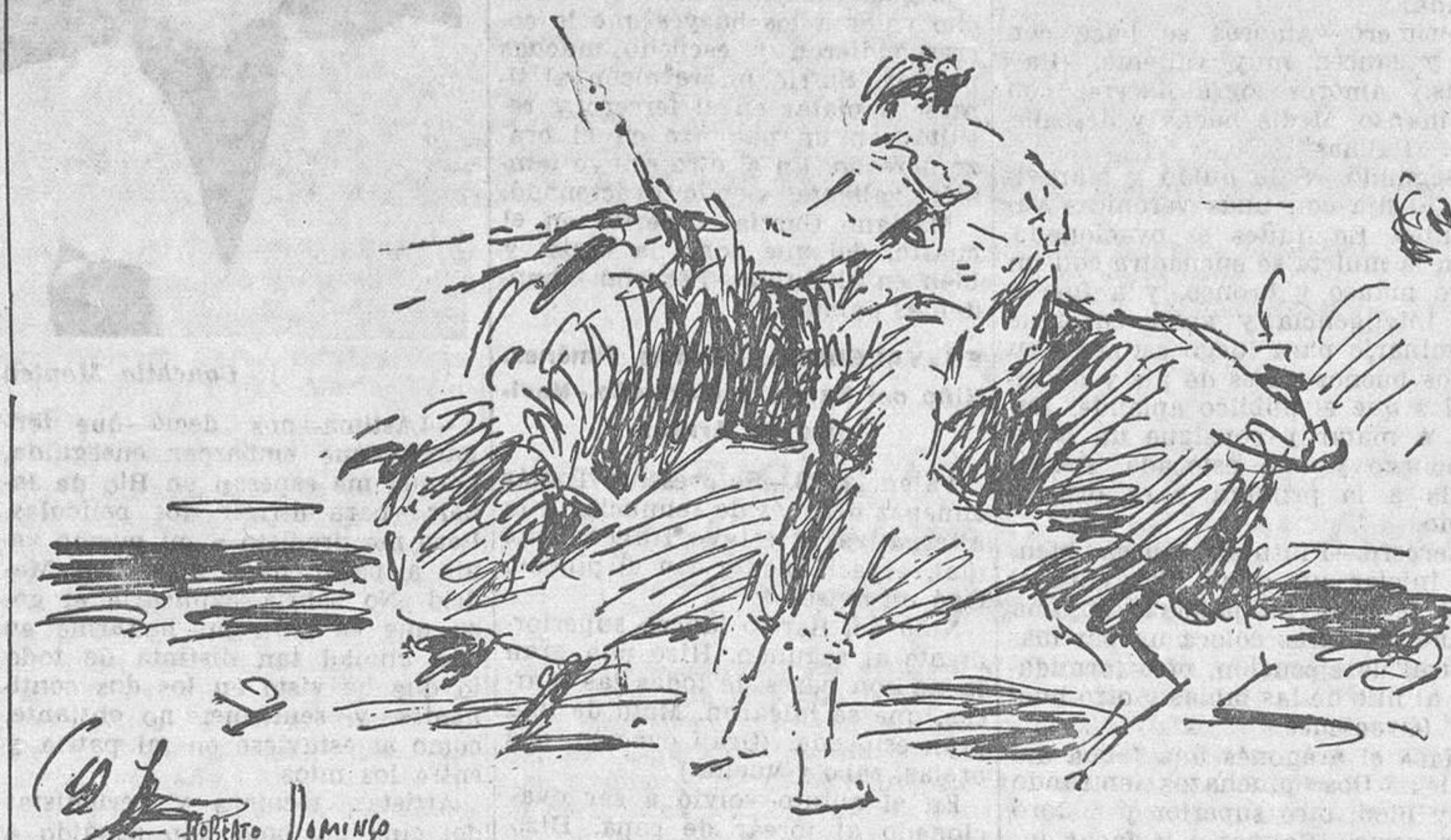
EL DOMINGO EN MADRID.—Belmonte en la faena de muleta al cuarto toro, del que se le concedieron las orejas y rabo