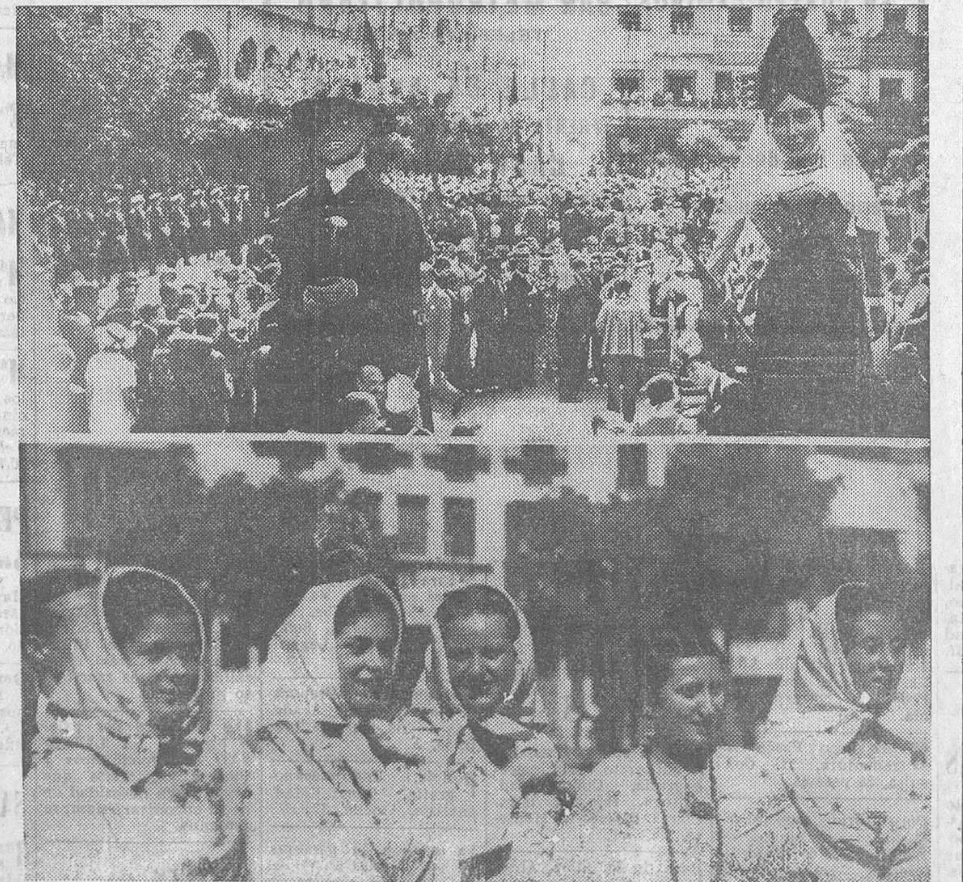
EL DOMINGO EN TOLEDO.—Los congresistas del X Congreso de Historia de la Medicina viendo el desfile de gigantes en la plaza de Zocodover.—Abajo, lindas toledanas con sus trajes regionales que actuaron en honor de los congresistas extranjeros