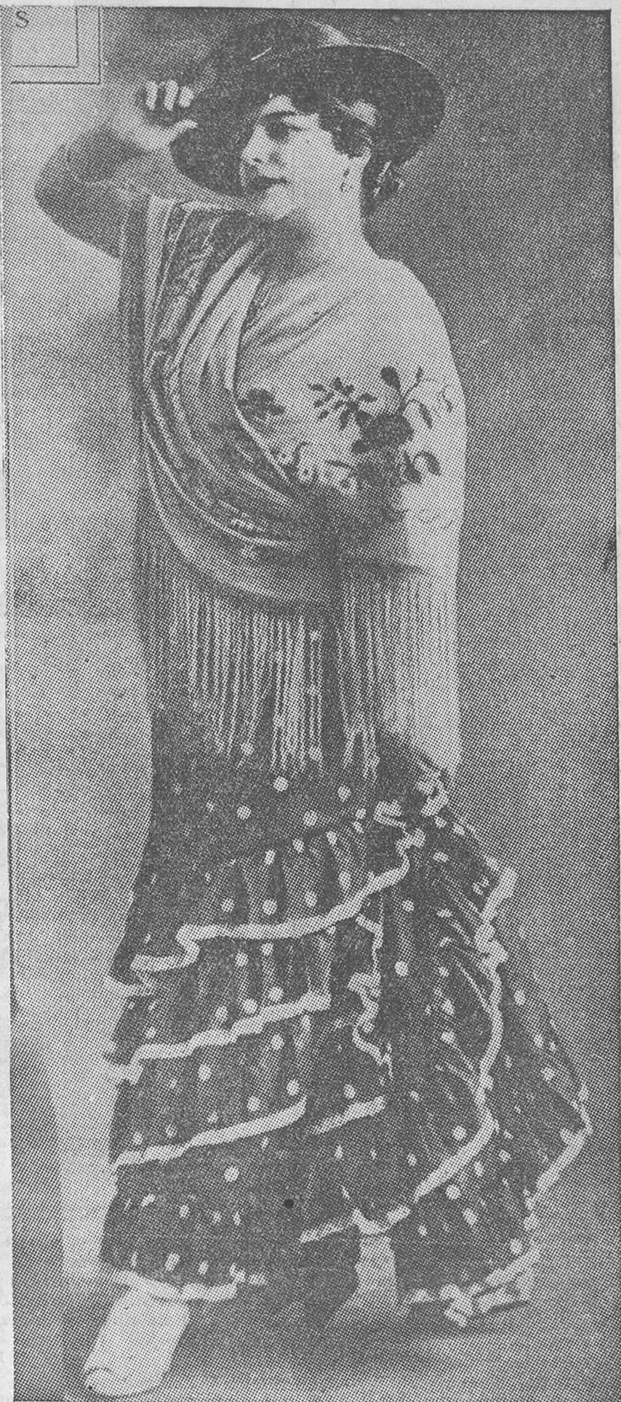
Aquellos lejanos amores de la Pastora y el Gallo tuvieron un solo momento de sonoridad y de color. Fueron como una copilla de José Mairena: exaltación múltiple de todos los ritmos gitanos. Pastora Imperio — nombre formado de una zampaña y una diadema, según frase de Guido da Verona — era todavía moza mimbreña que subyugaba a los públicos con aquel terrible garrotín eléctrico que sacudía todas las fibras del andalucismo neto y rotundo. Rafael Gómez el Gallo aún era un junca gitano garciloroqueño, cubierto de todas las gracias y de todos los temblores de la superstición, que vestido de oro y al compás de los alambres, movido por un viento de tragedia, dibujaba ante el toro los más bellos movimientos acordados del arte de torrear.

Pasó el tiempo. Poco tiempo. Todo el deslumbramiento que nos produjo la boda de los dos artistas extraordinarios se ensombreció de pronto. La Pastora y el Gallo se separaban. ¿Qué había ocurrido? El rumor extraño tendió su red finísima y exaltó las imaginaciones. La Venus gitana y el divino calvo rompieron su unión definitivamente. Sonó la malagueña dramática. Cada uno de ellos se refugió en su arte, en las emociones diversas y distintas de su arte netamente español.