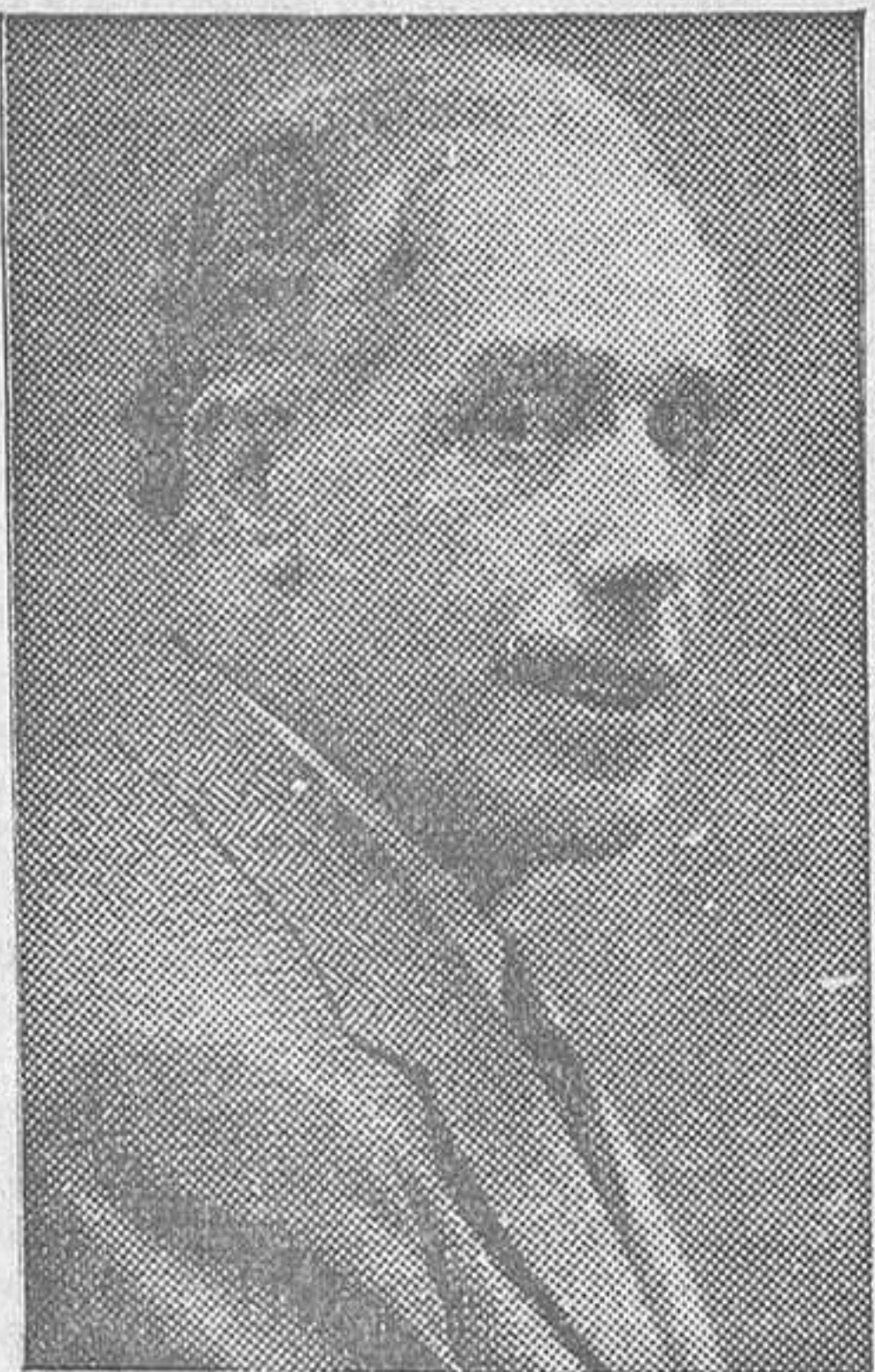
Don Julián Besteiro

En la sesión celebrada el martes por la Academia de Ciencias Morales y Políticas, fué propuesta la candidatura del Sr. Besteiro para