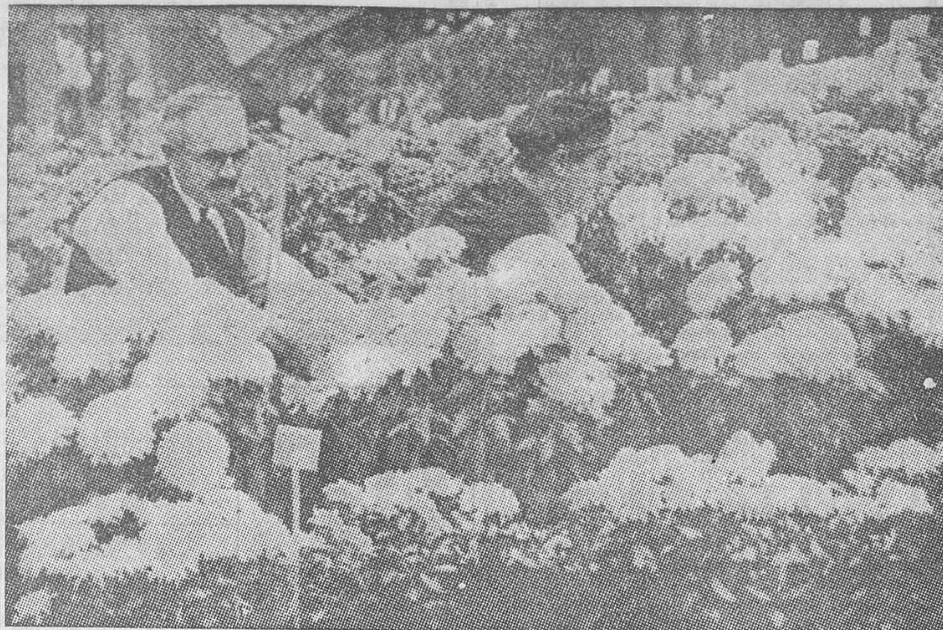
Los horticultores de París preparando la tradicional Exposición de Horticultura, que es una de las más bellas manifestaciones de la vida parisiense

El secretario del soberano ha afirmado que tal noticia carece por completo de fundamento.