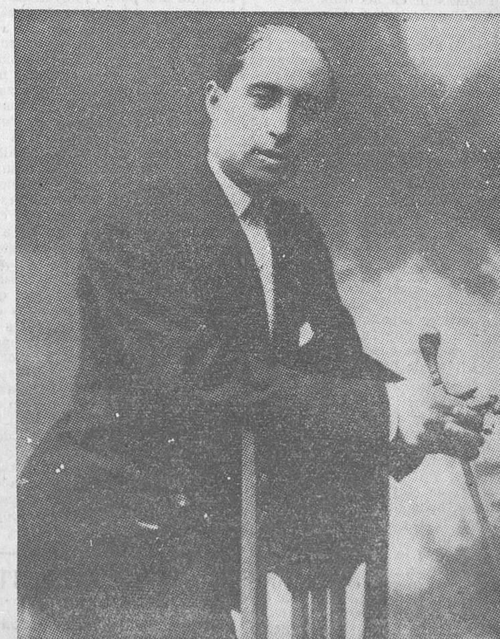
Pasó el tiempo. Poco tiempo. Todo el deslumbramiento que nos produjo la boda de los dos artistas extraordinarios se ensombreció de pronto. La Pastora y el Gallo se separaban. ¿Qué había ocurrido? El rumor extraño tendió su red finísima y exaltó las imaginaciones. La Venus gitana y el divino calvo rompieron su unión definitivamente. Sonó la malagueña dramática. Cada uno de ellos se refugió en su arte, en las emociones diversas y distintas de su arte netamente español. Y ahora, al cabo de un tiempo profundo en misterio y en leyenda popular, la prosa de una sen-

Y ahora, al cabo de un tiempo profundo en misterio y en leyenda popular, la prosa de una sen-