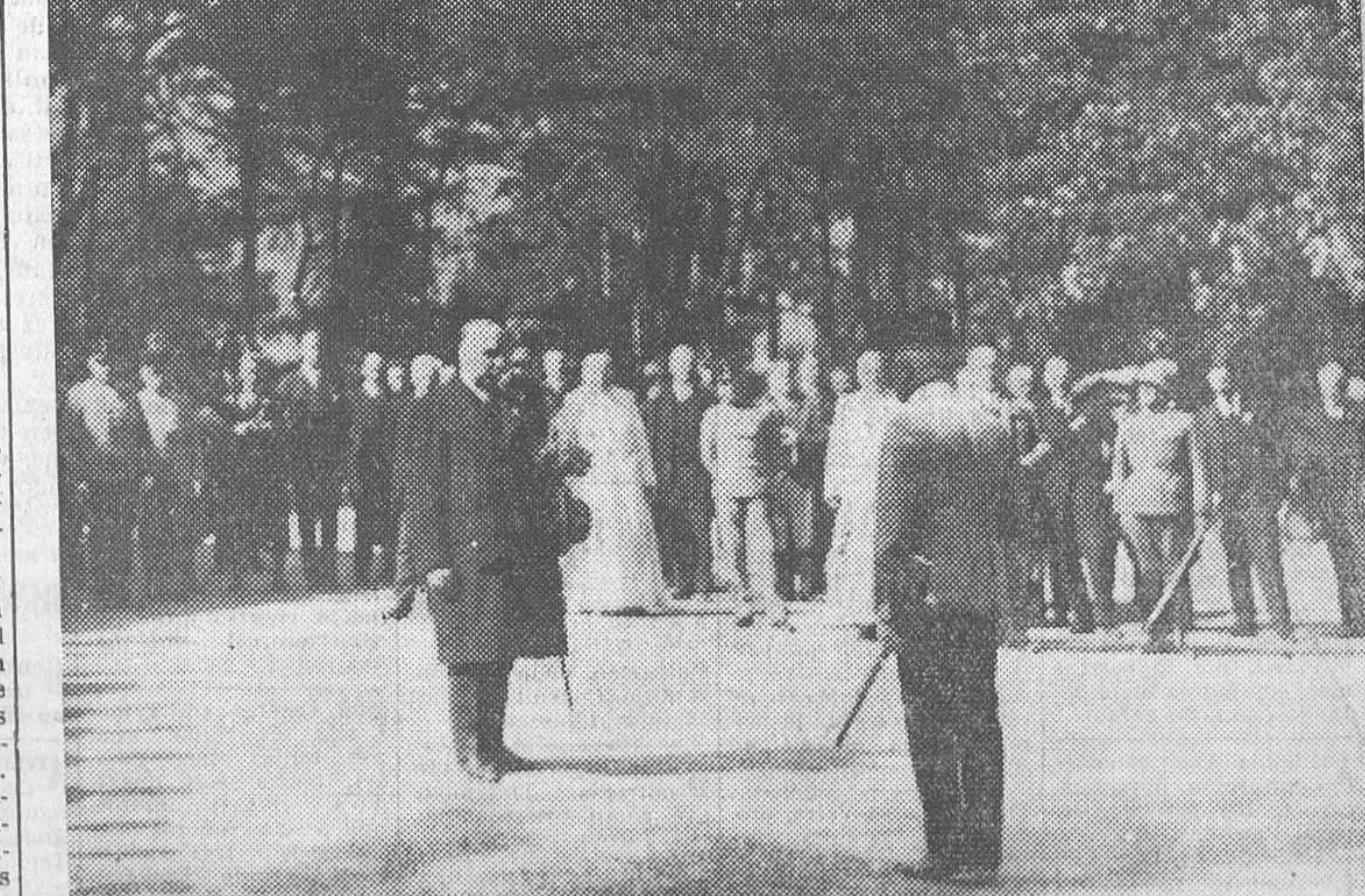
En Innsbruck se ha celebrado la gran fiesta de los francos tiradores, a la que han asistido más de 40.000 tiroleses, para celebrar la fecha—1805—de la independencia del Tirol. El presidente, Miklas, ante el monumento de los tiroleses muertos por la patria