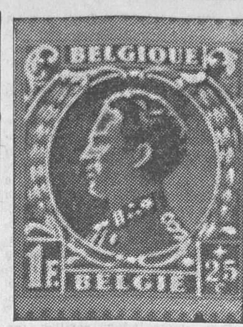
Un nuevo sello de Correos belga con la efigie de Leopoldo III. Los primeros ejemplares de este sello serán vendidos en un sobreprecio de 25 céntimos a beneficio de los inválidos de la guerra

UN ROBO Valencia, 6.—Hoy se ha realizado un robo audaz en la Facultad de Medicina. Cuando esta tarde los oficiales de secretaría se reintegraron al trabajo se encontraron con que había sido abierta la