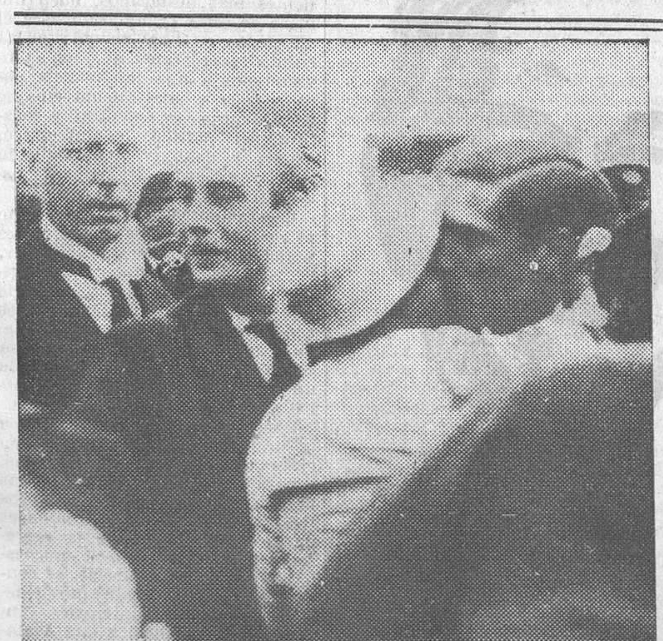
Cosyns, el famoso aeronauta, a su llegada a Bruselas ha sido triunfalmente recibido