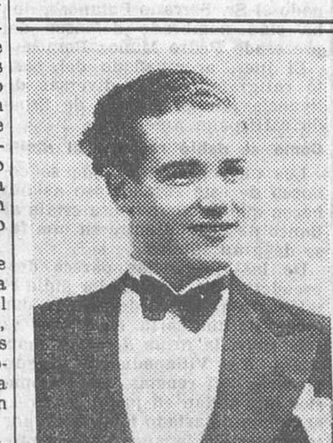
Pascual Albero, notable tenor aragonés, que se ha presentado con «La alegría de la huerta» y que obtuvo un éxito clamoroso

Al darse cuenta la vecindad de lo ocurrido acudió en auxilio de los heridos, a los que trasladó a la Casa de socorro del Euzkadi, en donde se le hizo la primera cura, conduciéndose después al hospital, en el cual, y en vista de la gravedad de las heridas, hubo que operar a ambos.