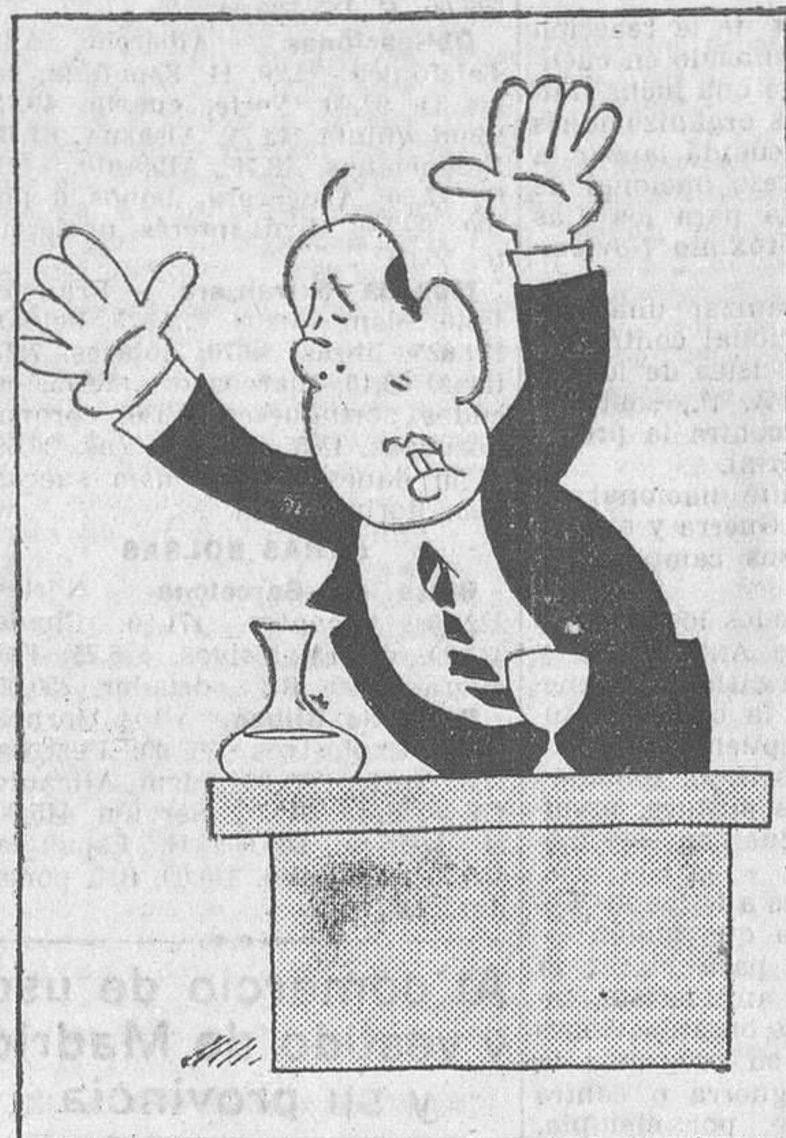
Gil Robles decía: «¡Yo acabaré con el paro!»