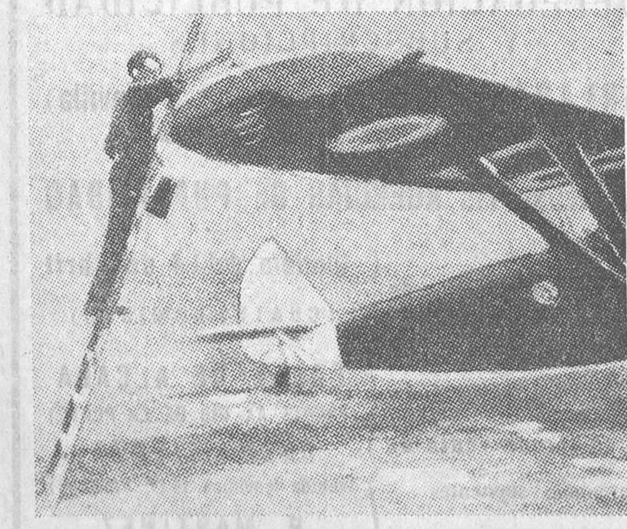
Esta madrugada han dado comienzo las maniobras aéreas sobre París. Un soldado, en Le Bourget, da los últimos toques a un avión de caza

Gerencia de LA LIBERTAD, teléfono num. 27151