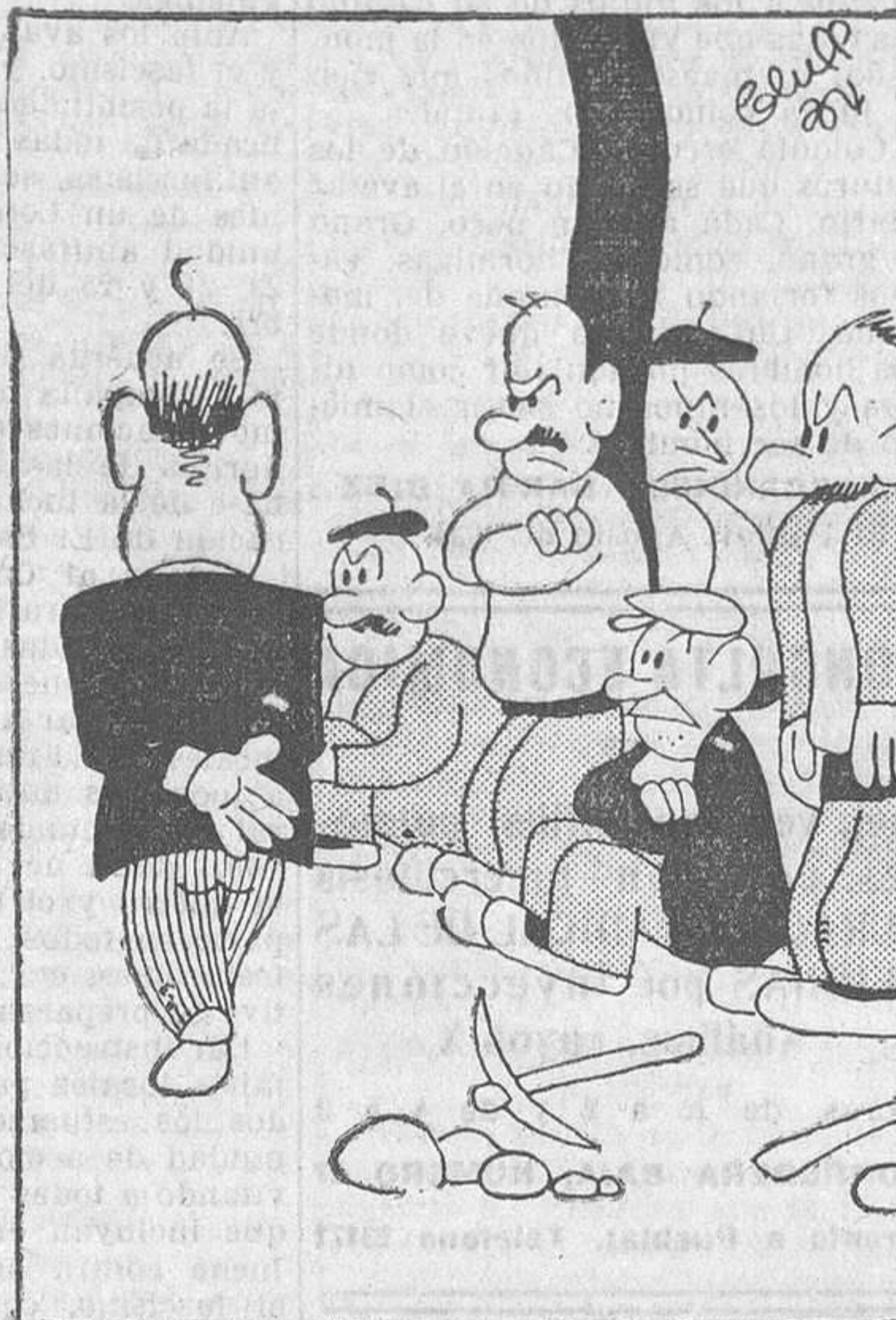
Y, en efecto, en dondequiera que asoma se paran hasta los relojes.