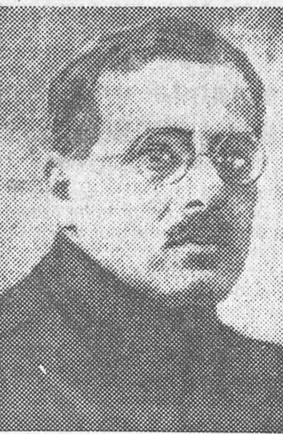
El general Unschlicht, jefe de la escuadrilla soviética que ha llegado a Le Bourget