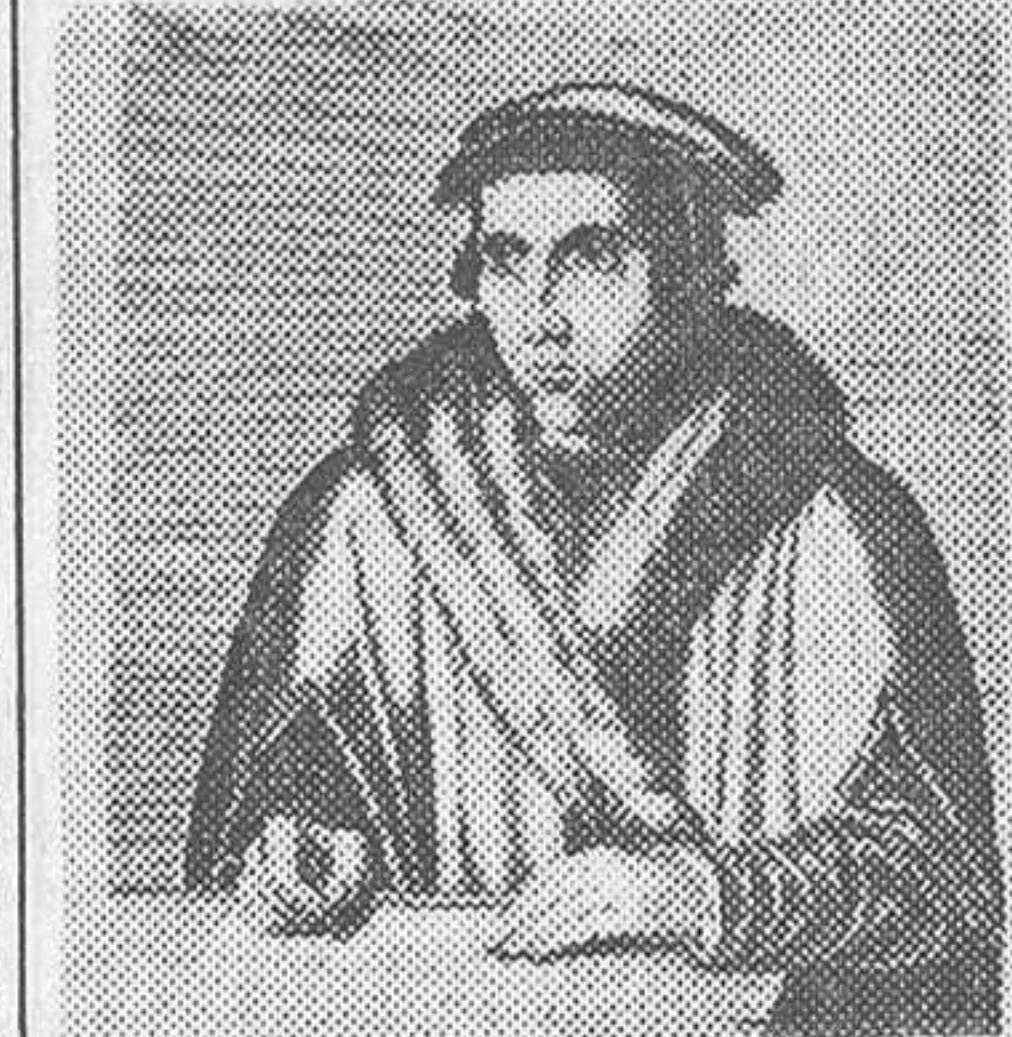
Retrato de Luis Vives, desconocido hasta ahora. Ha sido hallado en la Universidad de Lovaina