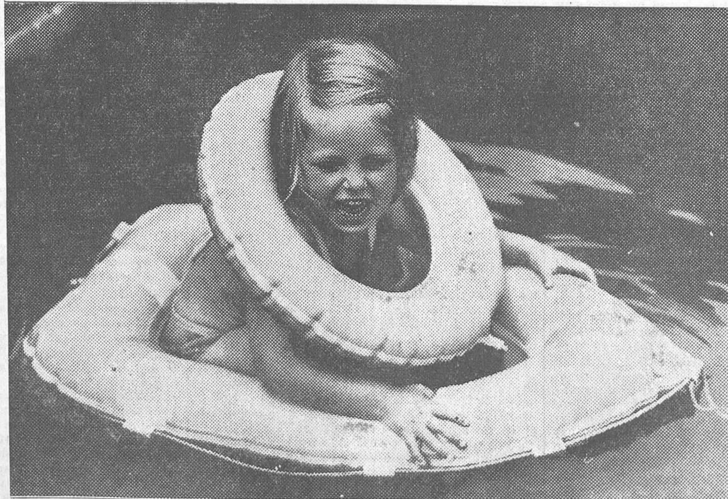
«¡Sálvese el que pueda!» La nena, no obstante la mansedumbre de las aguas, ha tomado sus precauciones. (Escena sorprendida en una piscina)