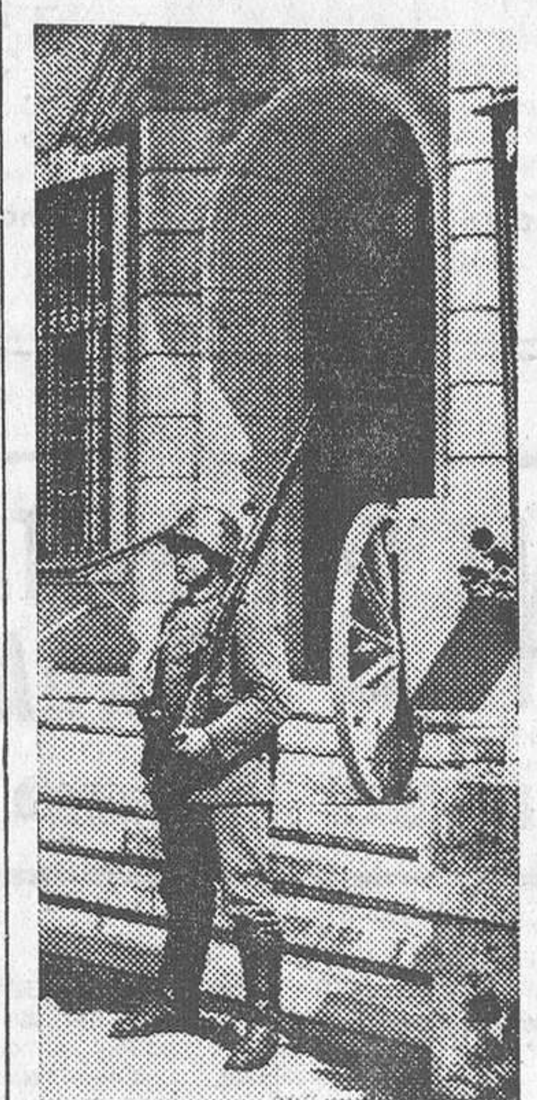
Los últimos honores a Hindenburg. La guardia en el castillo de Neudeck

Cuatro años más tarde fué testigo de la proclamación de su rey, elevado a la dignidad de emperador de Alemania unida. En