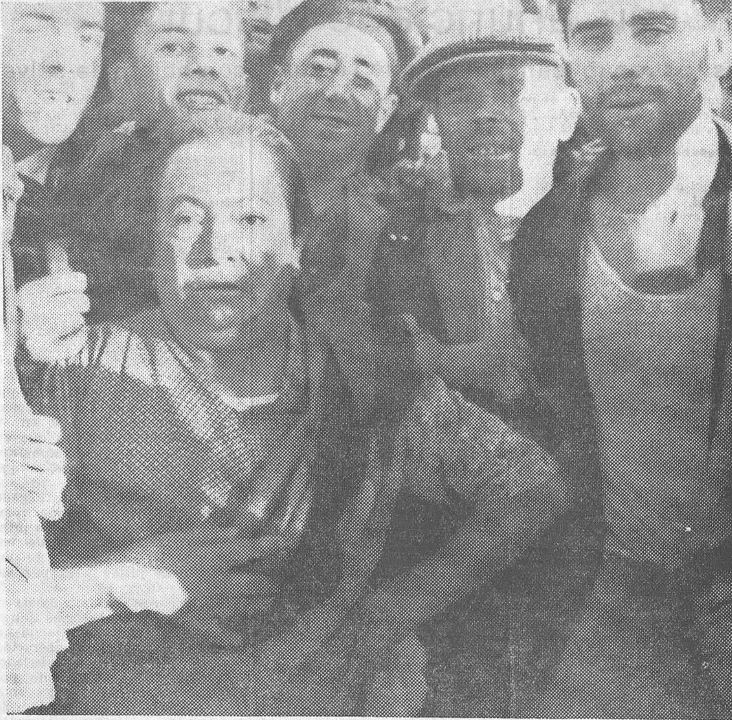
MADRID.—Los sucesos del Banco de España.—Una mujer del pueblo que ha estado aguardando la salida de los obreros, rodeada de los primeros huelguistas que abandonaron los sótanos en la madrugada del domingo