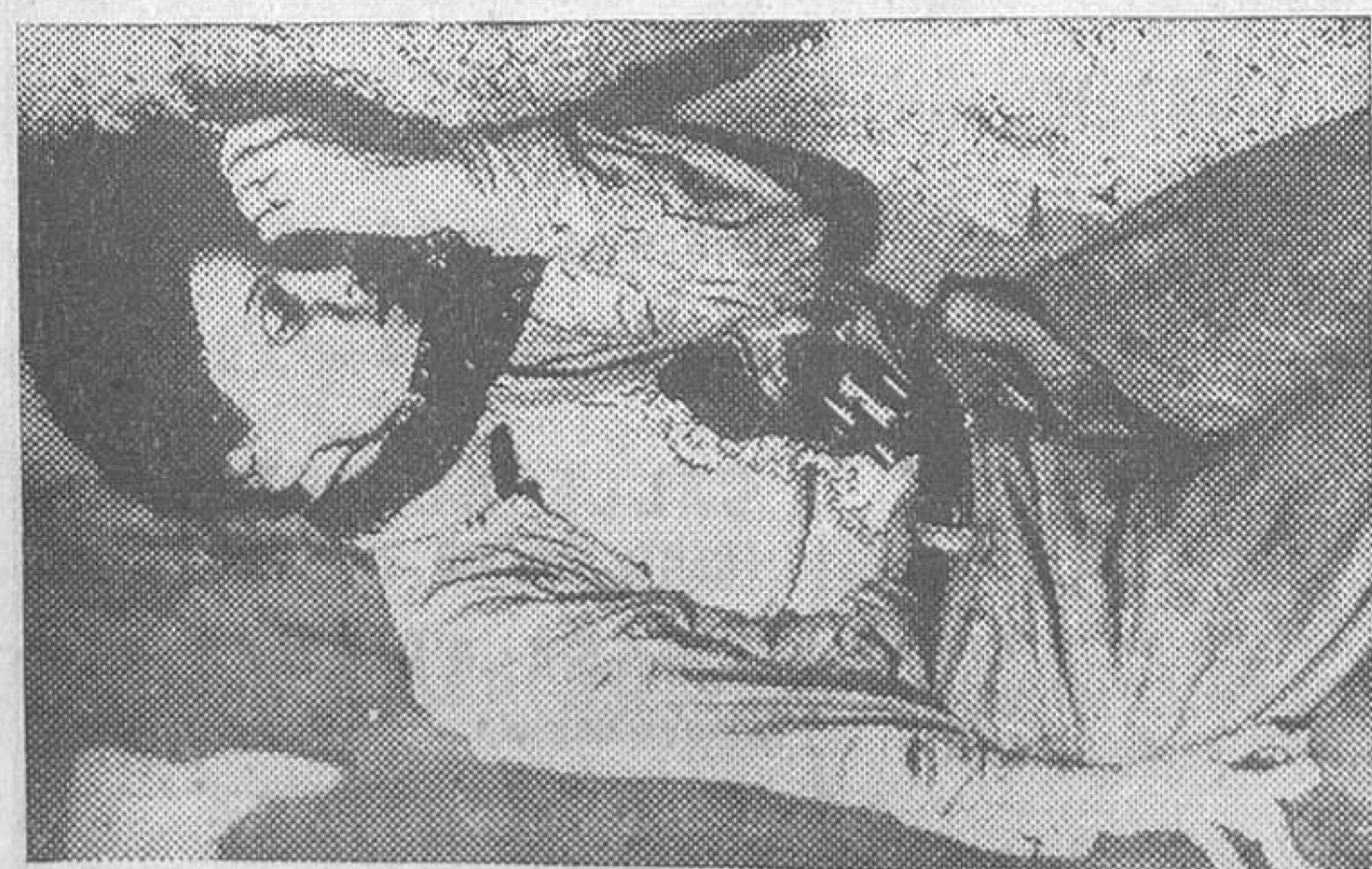
La joven criminal americana Helen Spence, muerta por la Policía