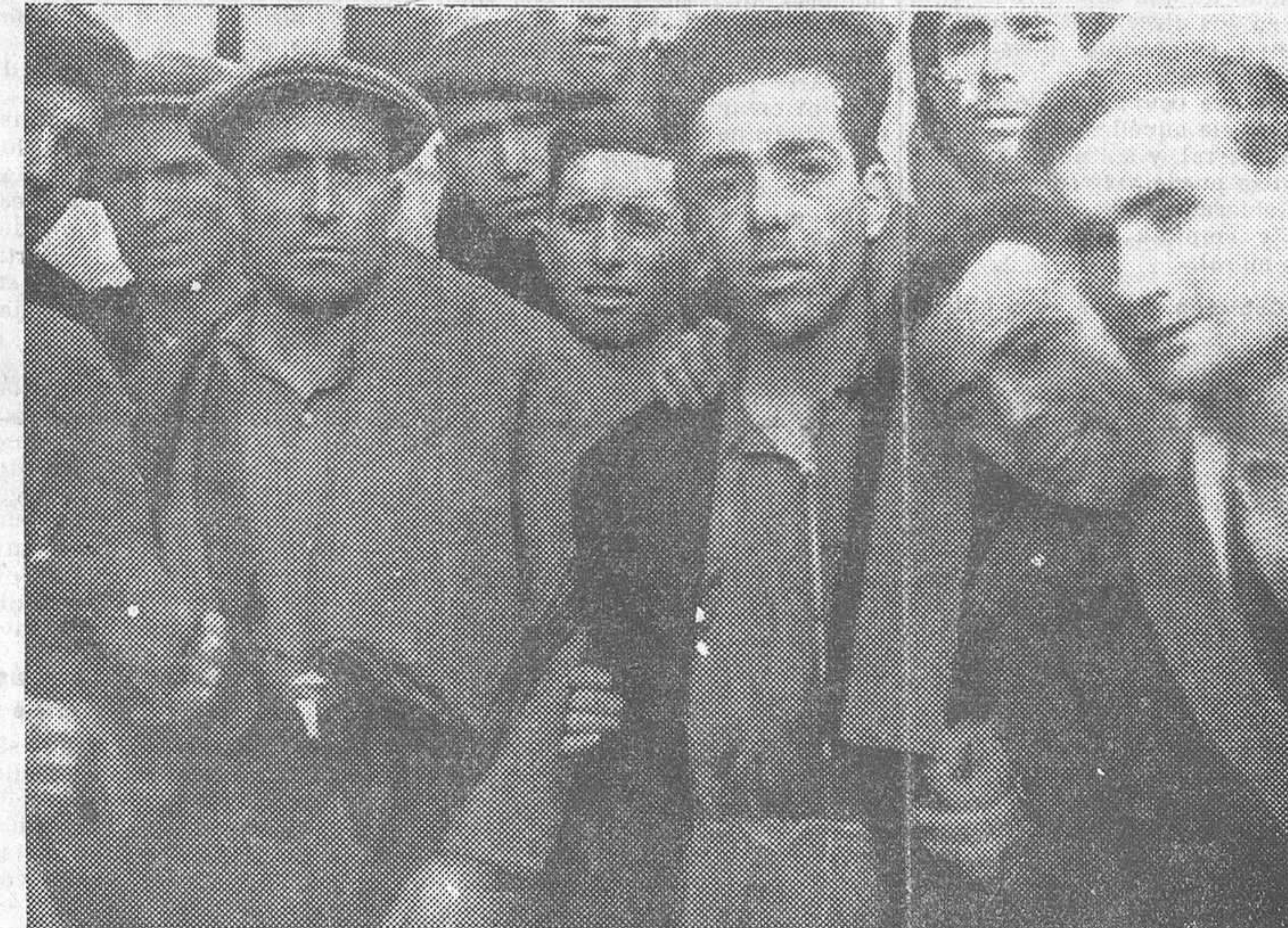
MADRID.—Los obreros del Banco de España abandonan los sótanos en que han estado recluidos voluntariamente durante tres días.