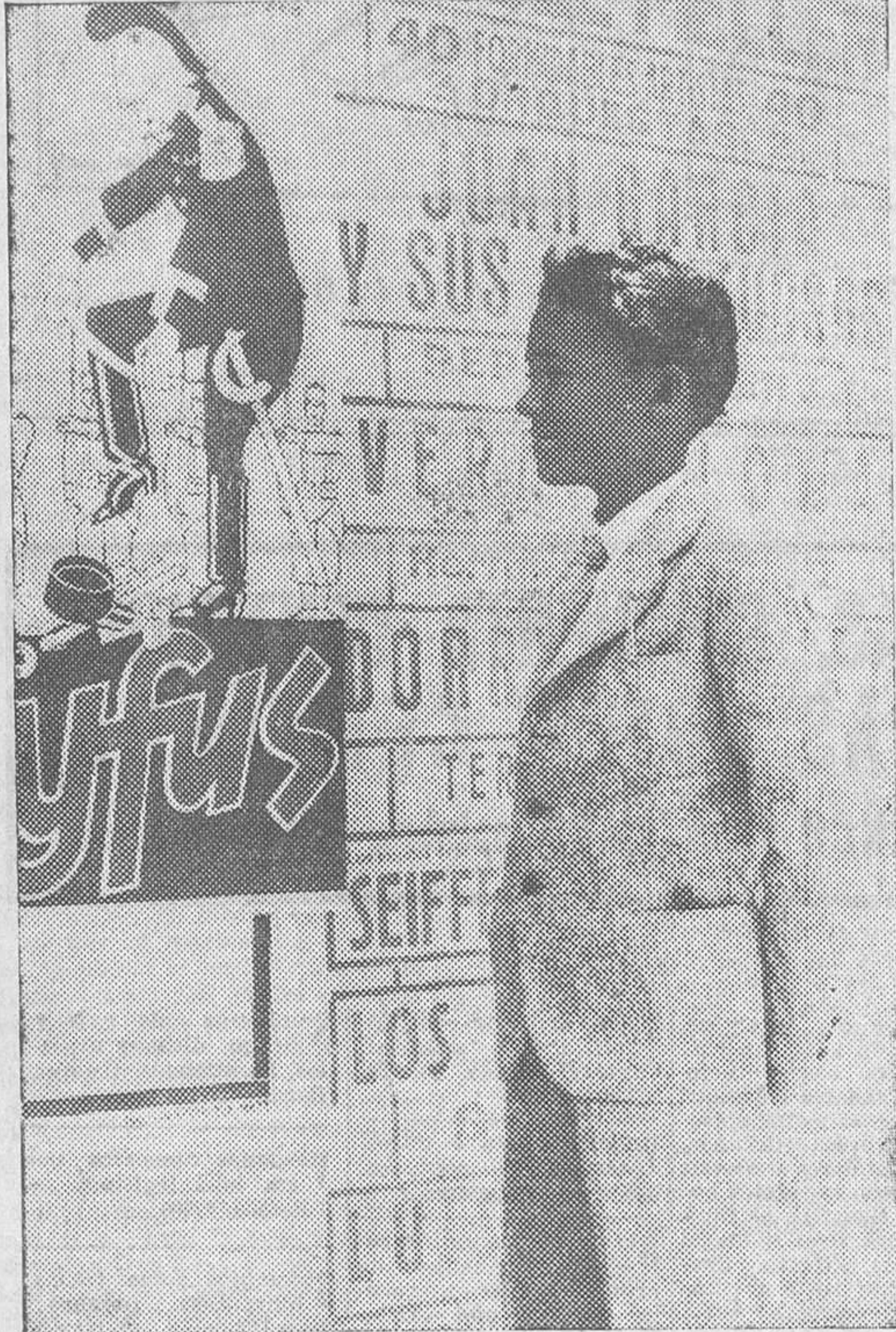
Aristides proyecta ante los carteles de espectáculos su "brincadeira"

Un tabatingo de trece años salta desde la selva amazónica a Madrid y filosofa "¡Aproveita, que está oscuro!" Los amazónicos las prefieren rubias