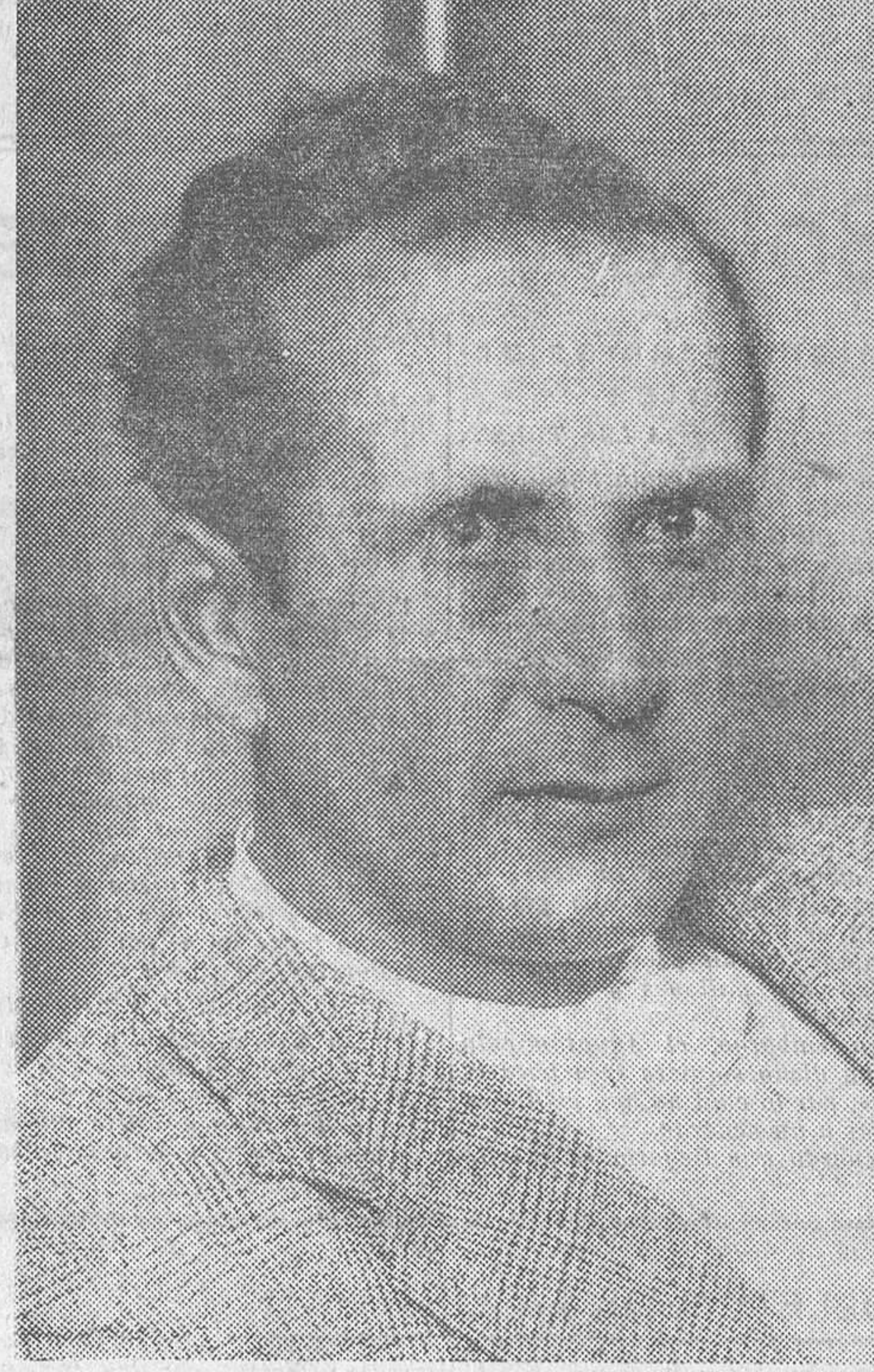
«El rey Boris» en la Dirección general de Seguridad

Las diez en punto. Y el tren, matemático, con la puntualidad de un convoy real, en las agujas de la estación de Atocha. Los fotógrafos—a falta del elemento oficial—hacen columna de honor para esperar al huésped. Las gentes están soliviantadas. El rey Boris desciende de un tercera. ¡Están tan pobres los reyes