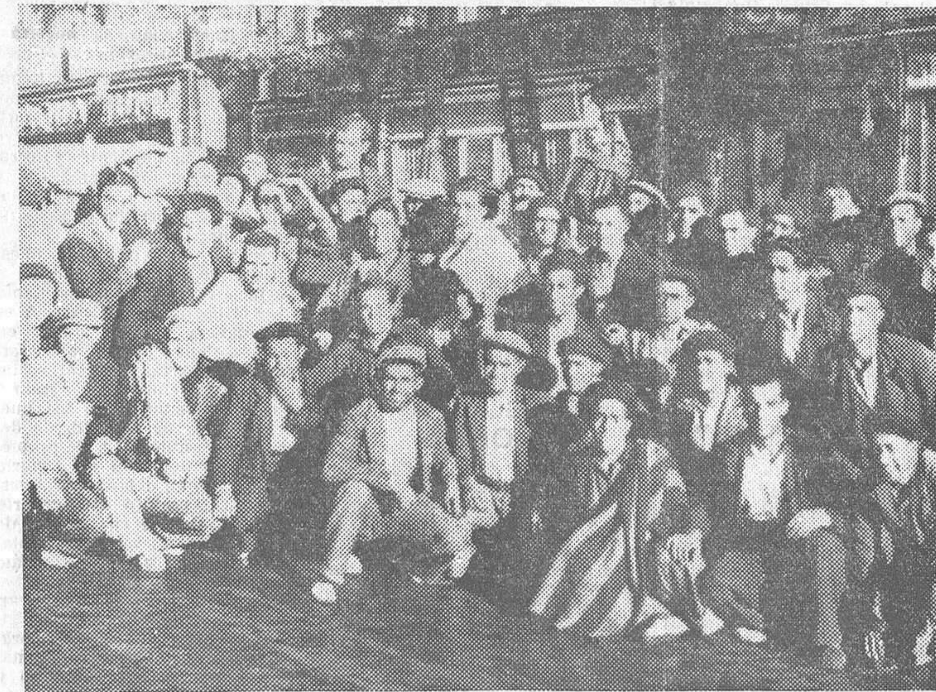
MADRID.—A pocos metros del Banco de España, en la madrugada del domingo, los obreros que han estado recluidos en los sótanos posan para las únicas fotografías obtenidas de este suceso, y adquiridas exclusivamente para LA LIBERTAD