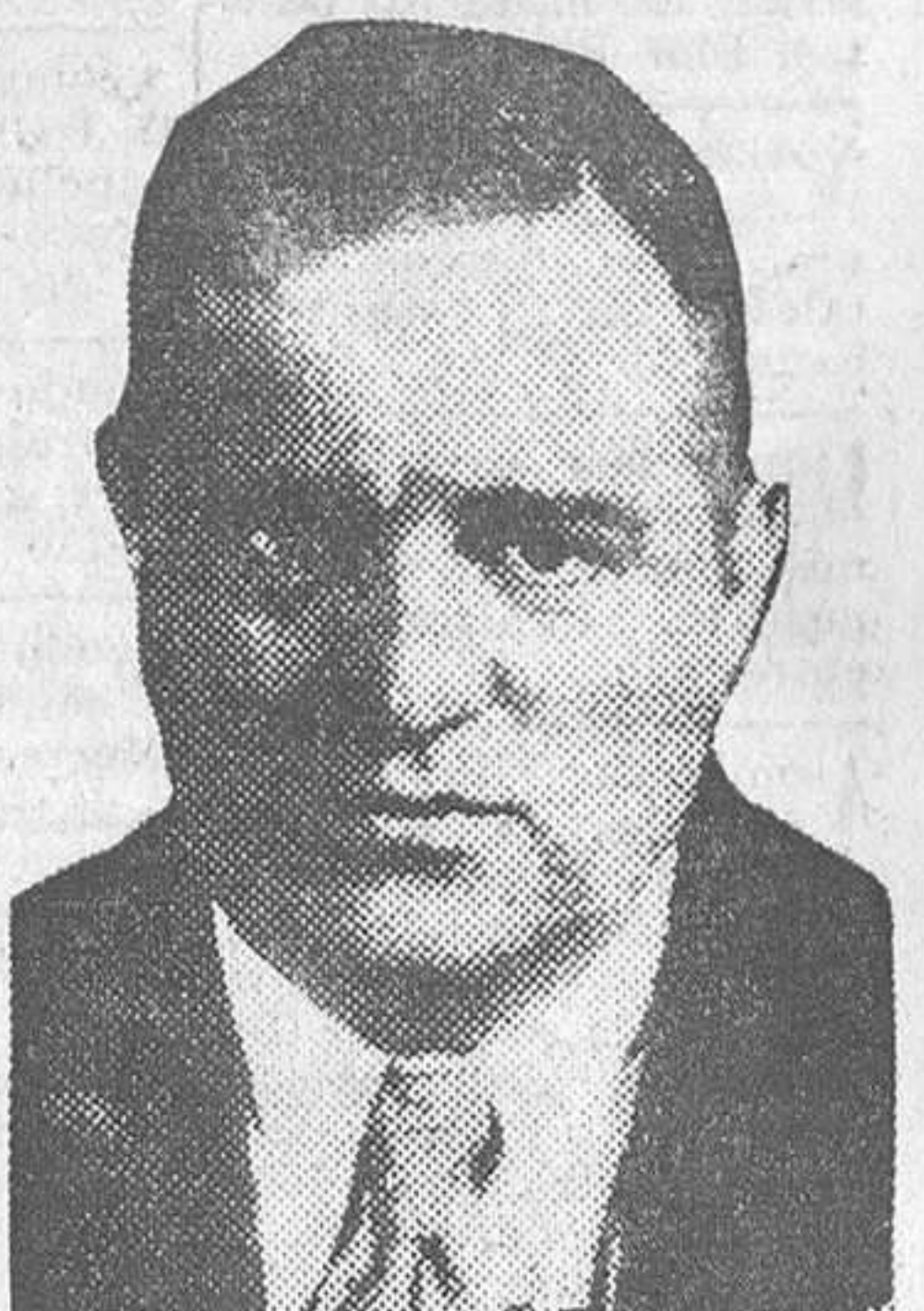
El alcalde de Nueva York, Fiorello La Guardia

El alcalde de la metrópoli americana, Fiorello La Guardia, acaba