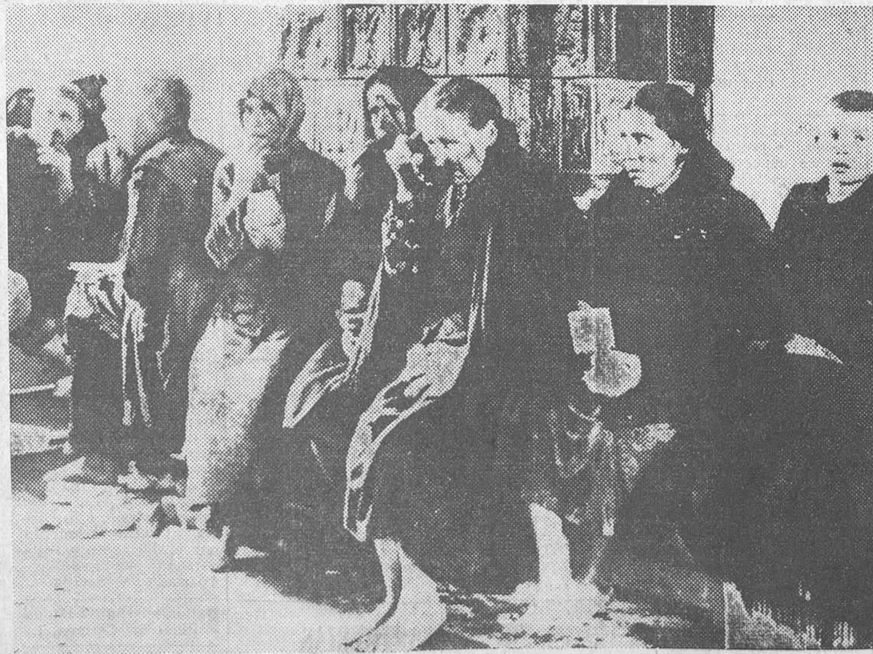
La inundación que ha destruido varias ciudades del Sur de Polonia ha dejado sin hogar a dos millones de habitantes. Una dramática foto de vecinos en espera de recibir su ración alimenticia diaria

Se abrigan serios temores acerca de la desaparición del vicealmirante.