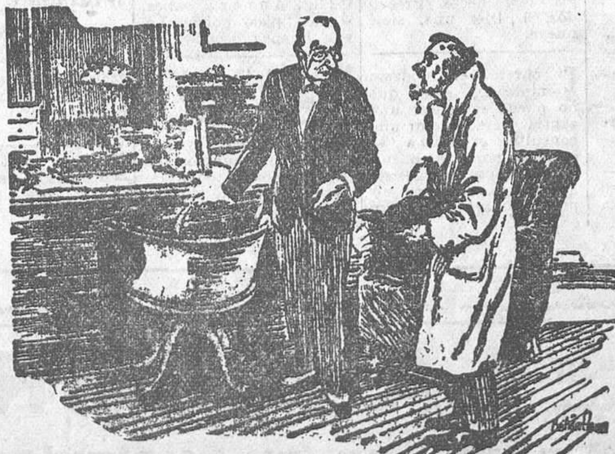
—Quisiera algo que me calmase los nervios. —Se ha equivocado usted, caballero. Yo no soy médico. Soy abogado. —Precisamente; deseo un divorcio. (De «London Opinion»)