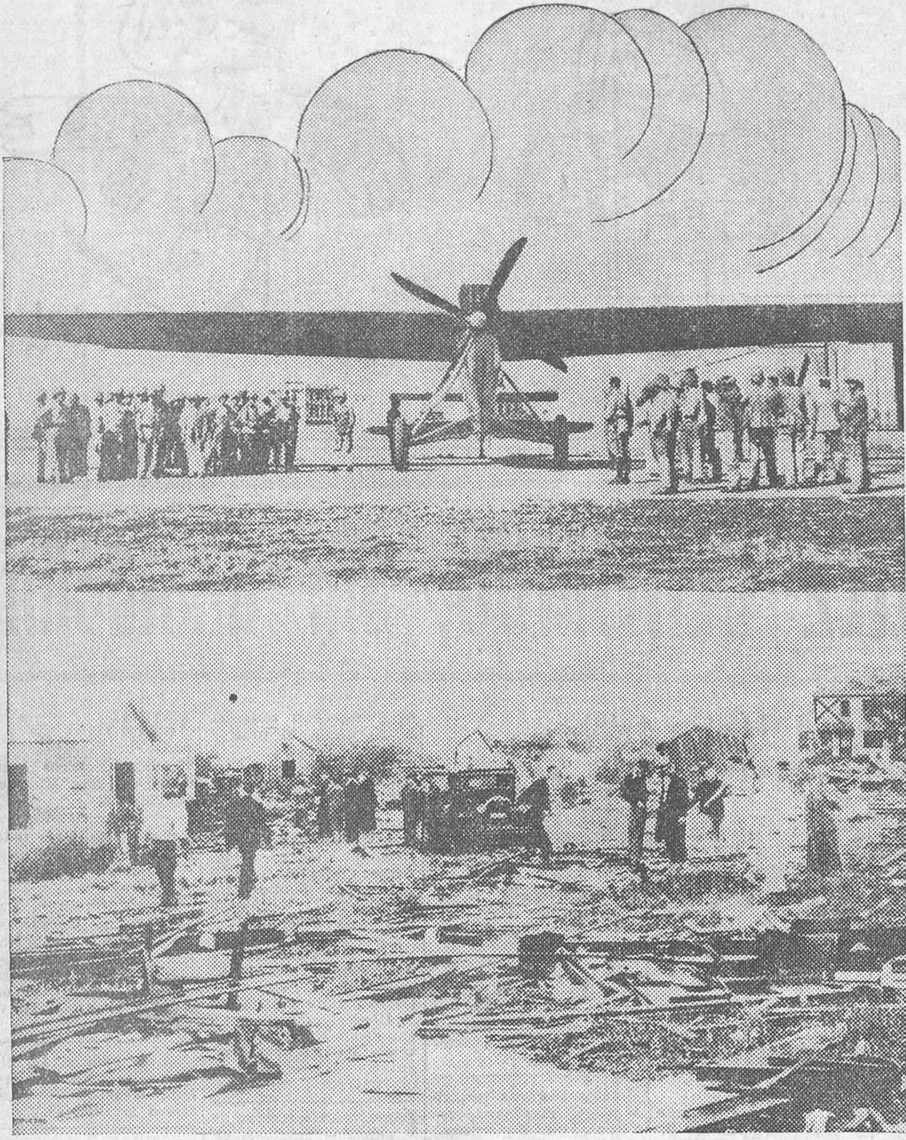
Arriba, una de las primeras fotografías del avión de Codos y Rossi en el momento de aterrizar en Rayack (Siria), después de haber batido el record del mundo de vuelo en línea recta.— Abajo, vista general de los efectos producidos por el tornado de Texas (Méjico), en el que resultaron tres personas muertas. Los perjuicios causados en la ciudad se calculan en un millón de dólares