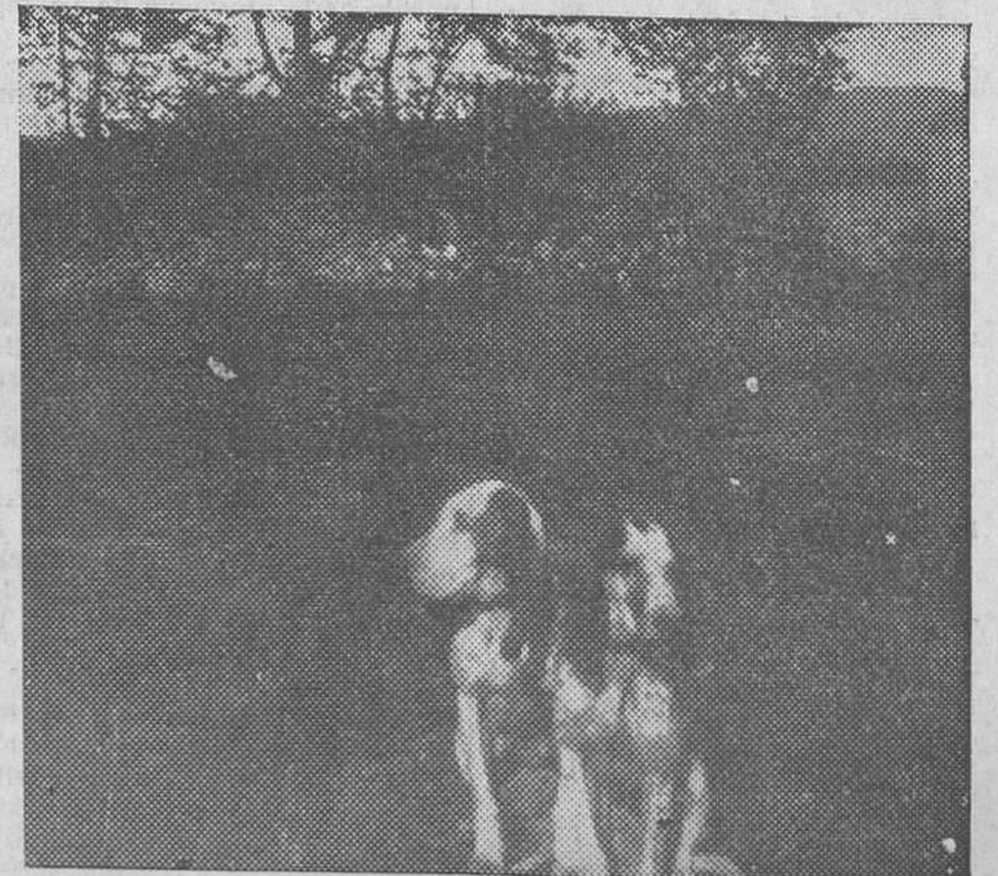
Los dóciles lebletes que antaño cazaban con el ex rey, ahora observan, sin servidumbres, el paisaje interior de la Magdalena

XESUS NIETO PENA, Santander, Agosto, 1933.