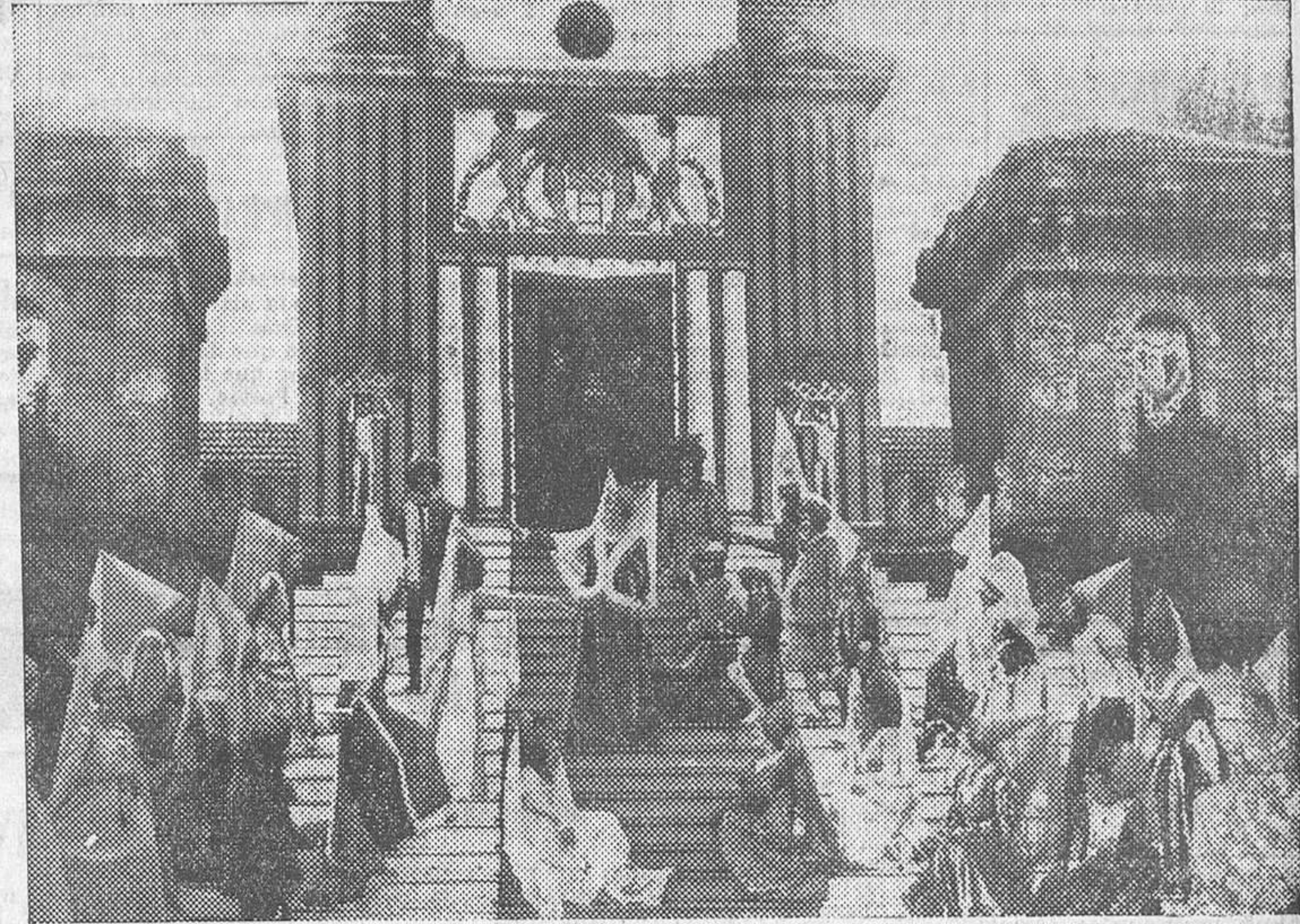
Un ensayo del cuadro «La fundación de los hospicios de Beaune», que figura en el programa de festejos