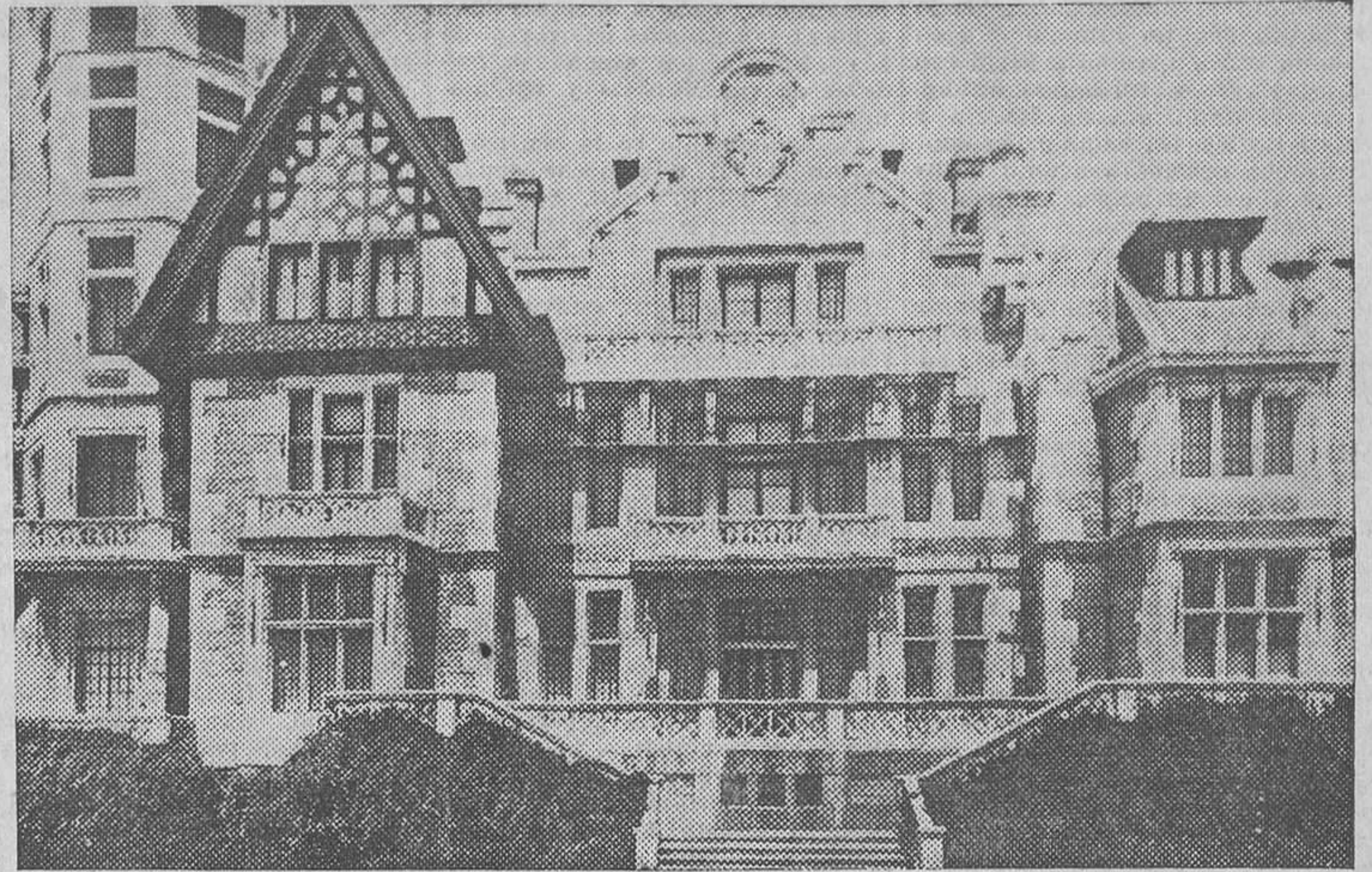
Uno de los pabellones de la Residencia Internacional, convertido en sala de estudios