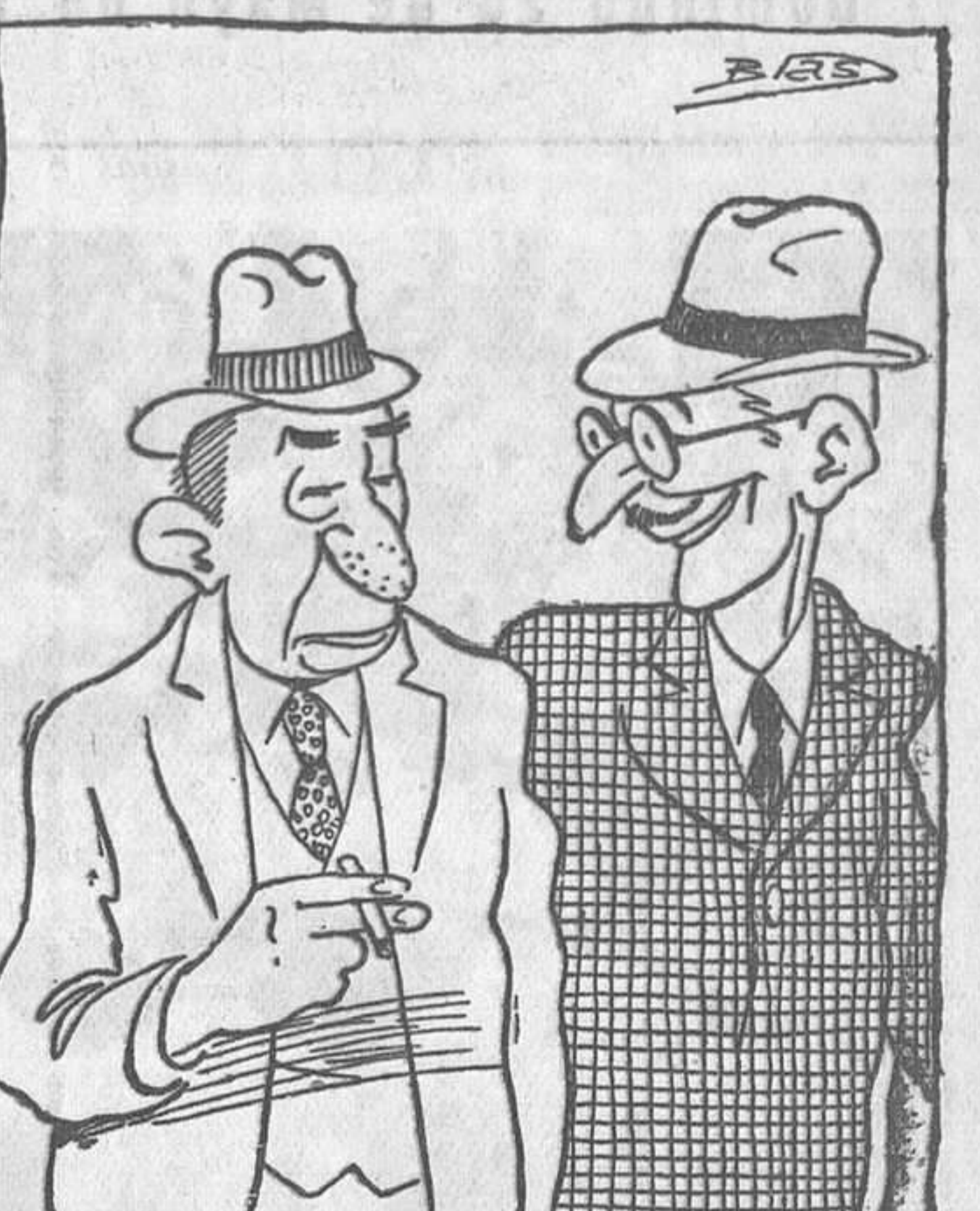
-Le aseguro a usted que el nuevo partido radical democrata ha adquirido gran volumen. -¿Usted cree? -Claro que sí. ¡Como que ha ingresado en el D. Pedro Rico!

ANUNCIOS POR SECCIONES No se admiten anuncios Inmorales