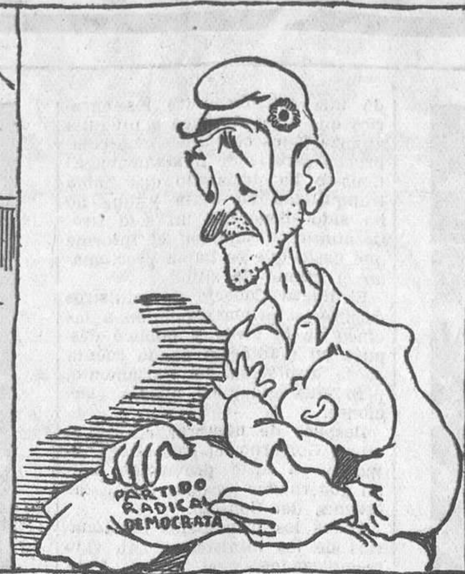
-¡Un chico más! Así no puedo levantar cabeza.