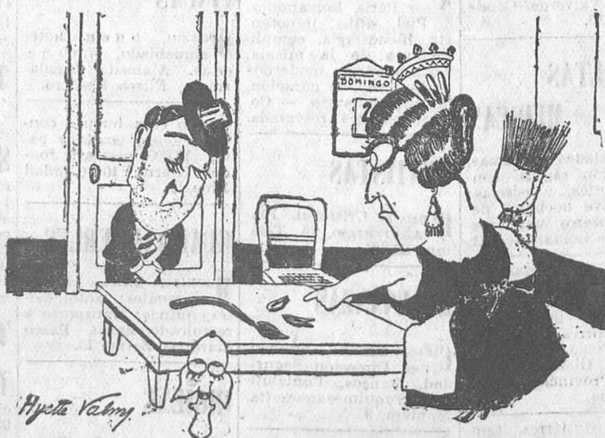
La mujer del torero.—Como la próxima vez no me traigas un flete, en vez de las orejas y el rabo, te has caído. (Ric et Rac.)