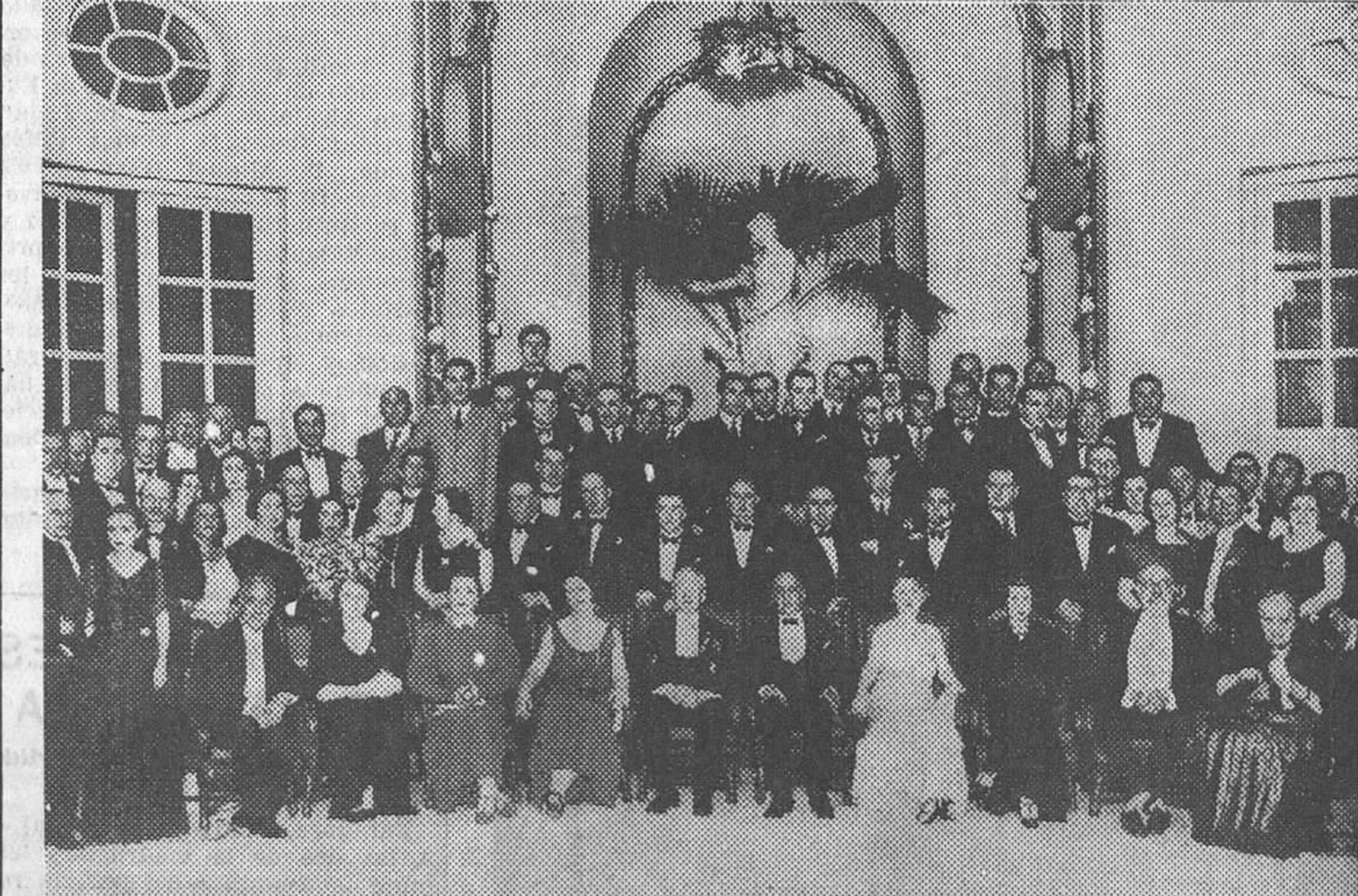
Concurrentes al banquete ofrecido por la Academia Española de Dermatología a los delegados de veintidós naciones que han asistido a su Congreso Internacional, celebrado estos días