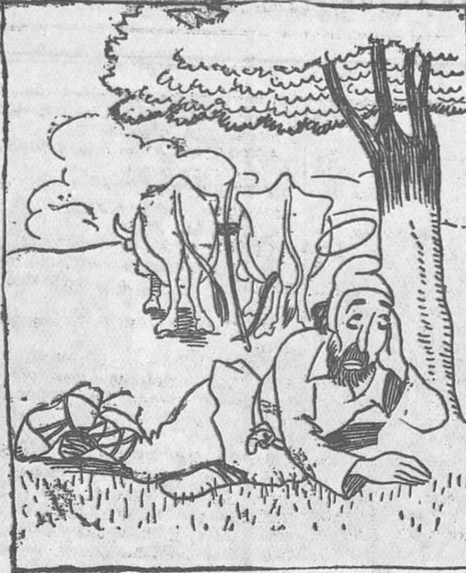
-Voy a echarme una siesteita a ver si se repite el milagro, y cuando despierte encuentro hecha la Reforma agraria.