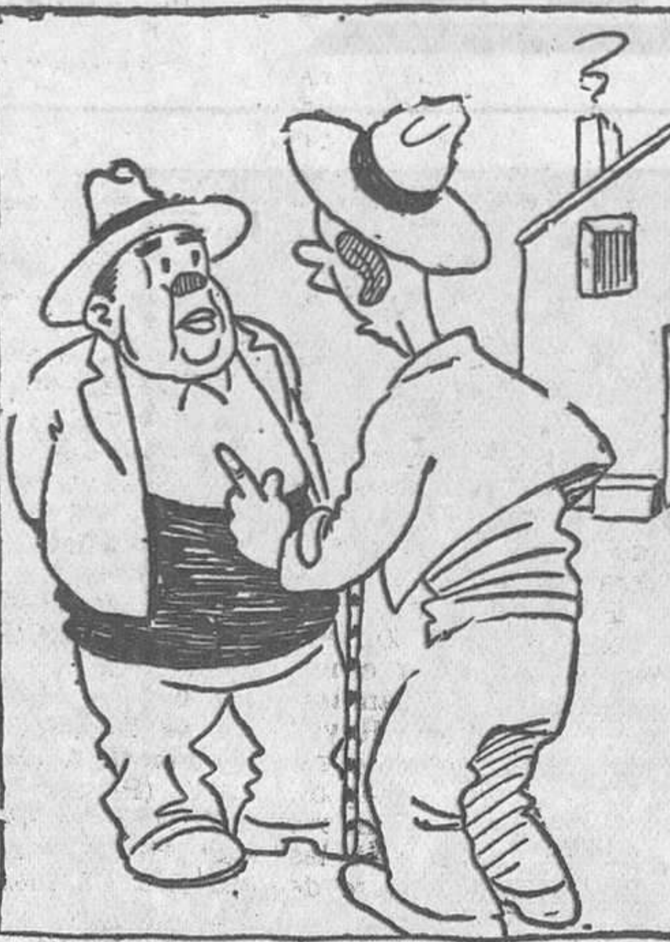
-¿Y qué tal por Madrid? -Aquello es único. El día de San Isidro asistí a una corrida de veinte toros. -¿Vamos, andal? -Echa la cuenta: Ocho anunciados y tres substituidos, once; tres cabestros que salieron tres veces al ruedo, nueve; total, veinte.