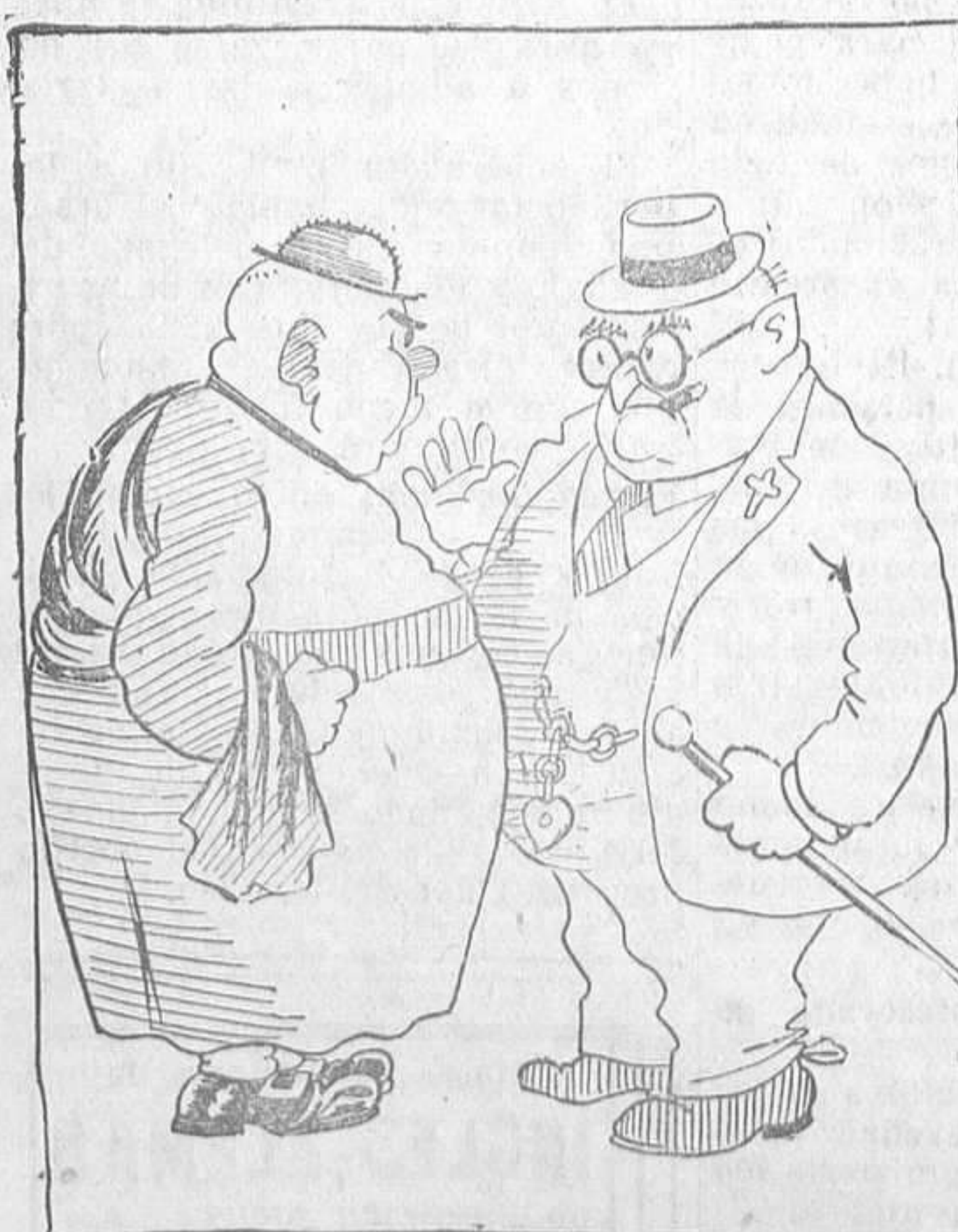
—Y suprimidos los nuestros. ¿a qué colegios piensa usted llevar los niños? —A los electorales.