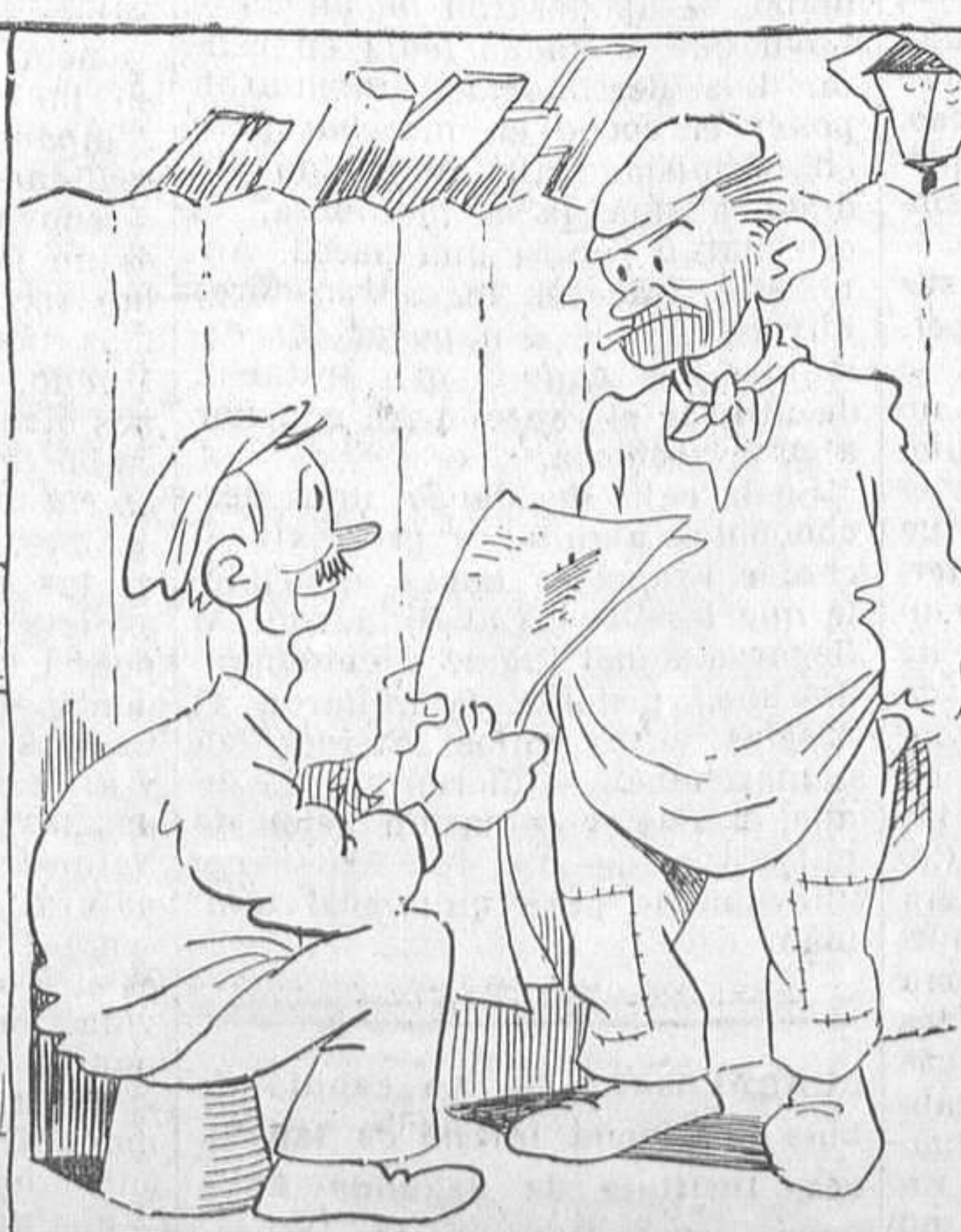
—Lo que yo te digo, Usebio, es que mas que un Gabinete necesitamos una cocina.