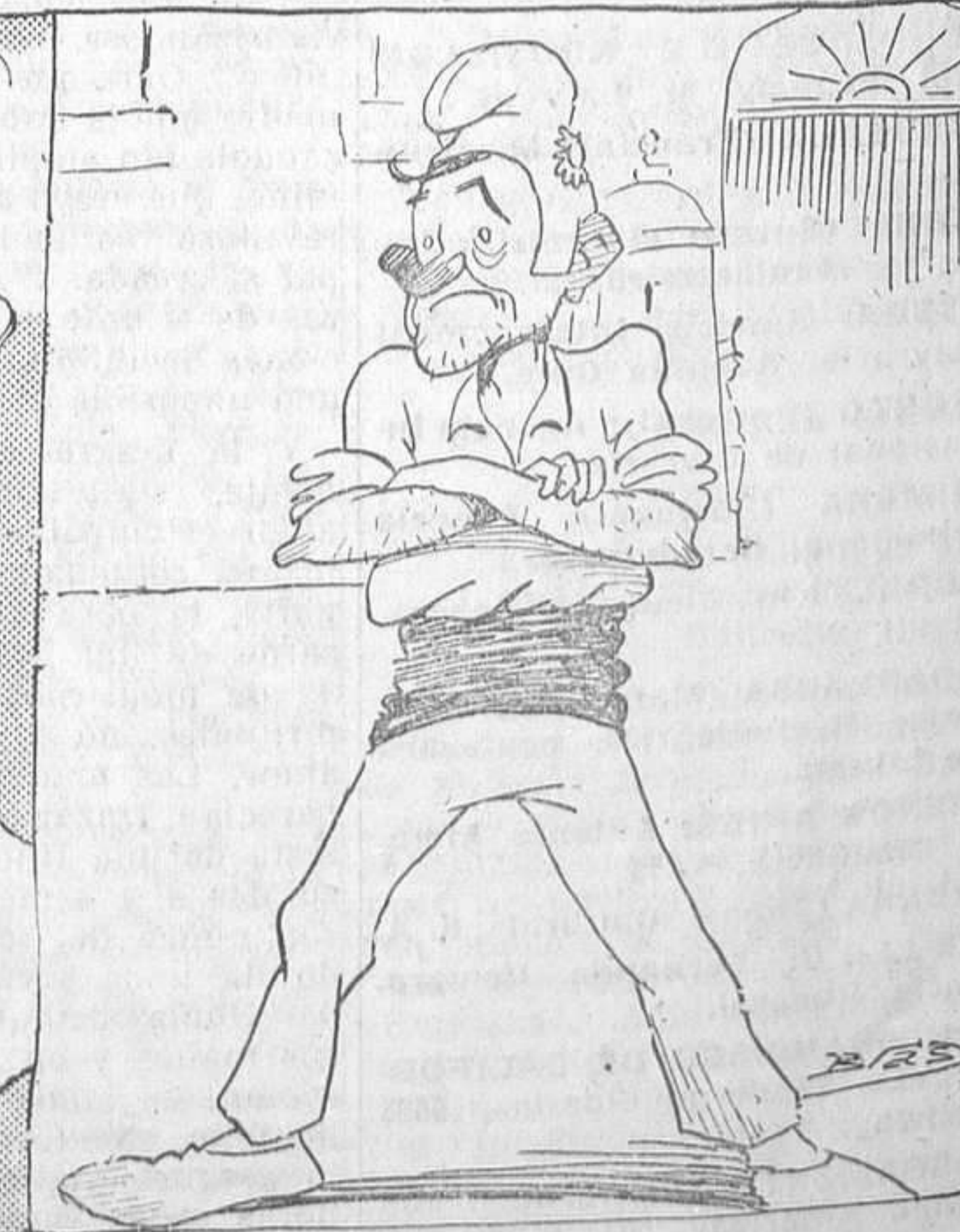
—¿Y a mí por qué no me consultan?