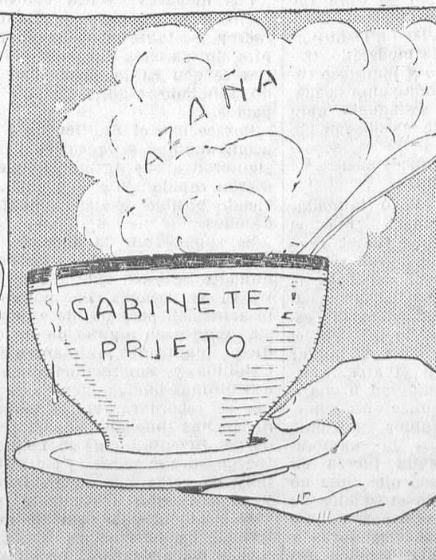
A quien no quiere caldo, ¡un tazón!