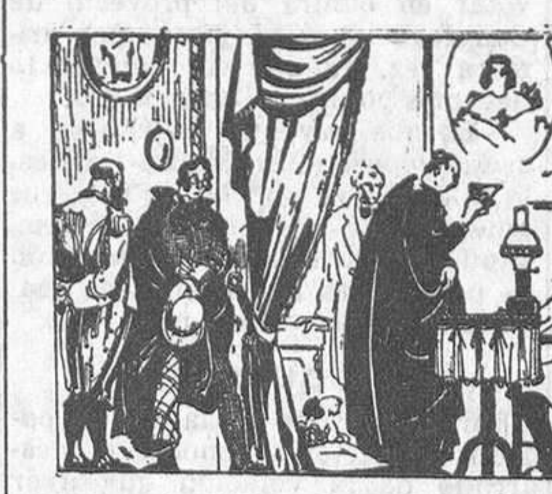
«La lectura de la pastoral», dibujo de Emilio Ferrer, en el Salón de Humoristas

to del arte español con sus dibujos, sus tallas en madera policromada, esculturas y figuras recortadas en metal.