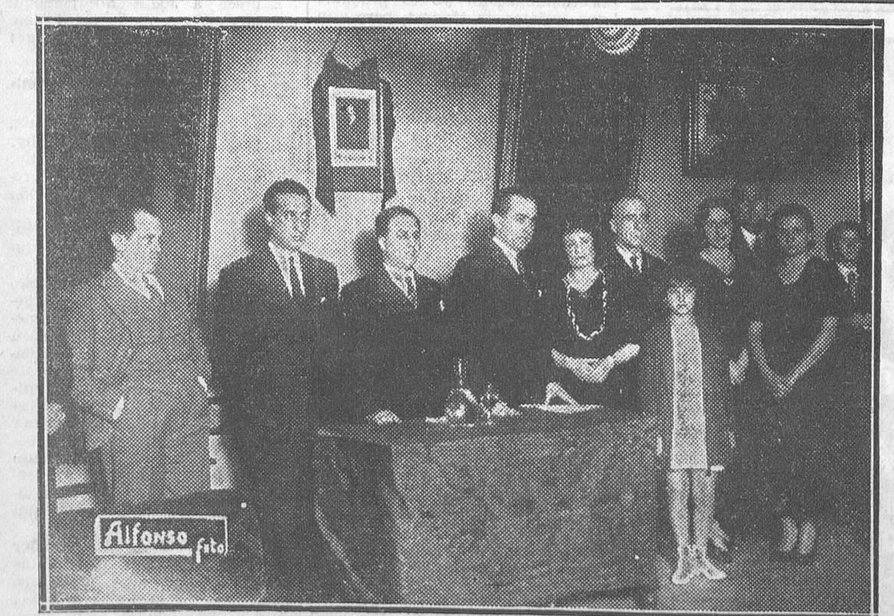
EN EL LICEO ANDALUZ.—Personalidades que tomaron parte en la velada necrológica celebrada en el Liceo de Andalucía en memoria del gran pintor Julio Romero de Torres, con motivo del tercer aniversario de su muerte

Ha sido inaugurada ayer por el ministro de Instrucción pública la Exposición escolar checoslovaca, organizada por el Comité Hispano-eslavo en colaboración con el Museo Pedagógico y la Agrupación de Amigos de Checoslovaquia. La Exposición se halla instalada en la Casa de Primera enseñanza (ex Instituto de Sordomudos, Hipódromo), y contiene cuatro grandes colecciones de más de 600 dibujos ejecutados en los establecimientos de primera y segunda enseñanza de la República Checoslovaca; después, muestras de trabajos manuales de muchachos y muchachas, incluso juguetes de carácter folklórico, y, finalmente, una rica colección de manuales de la educación artística y de otras