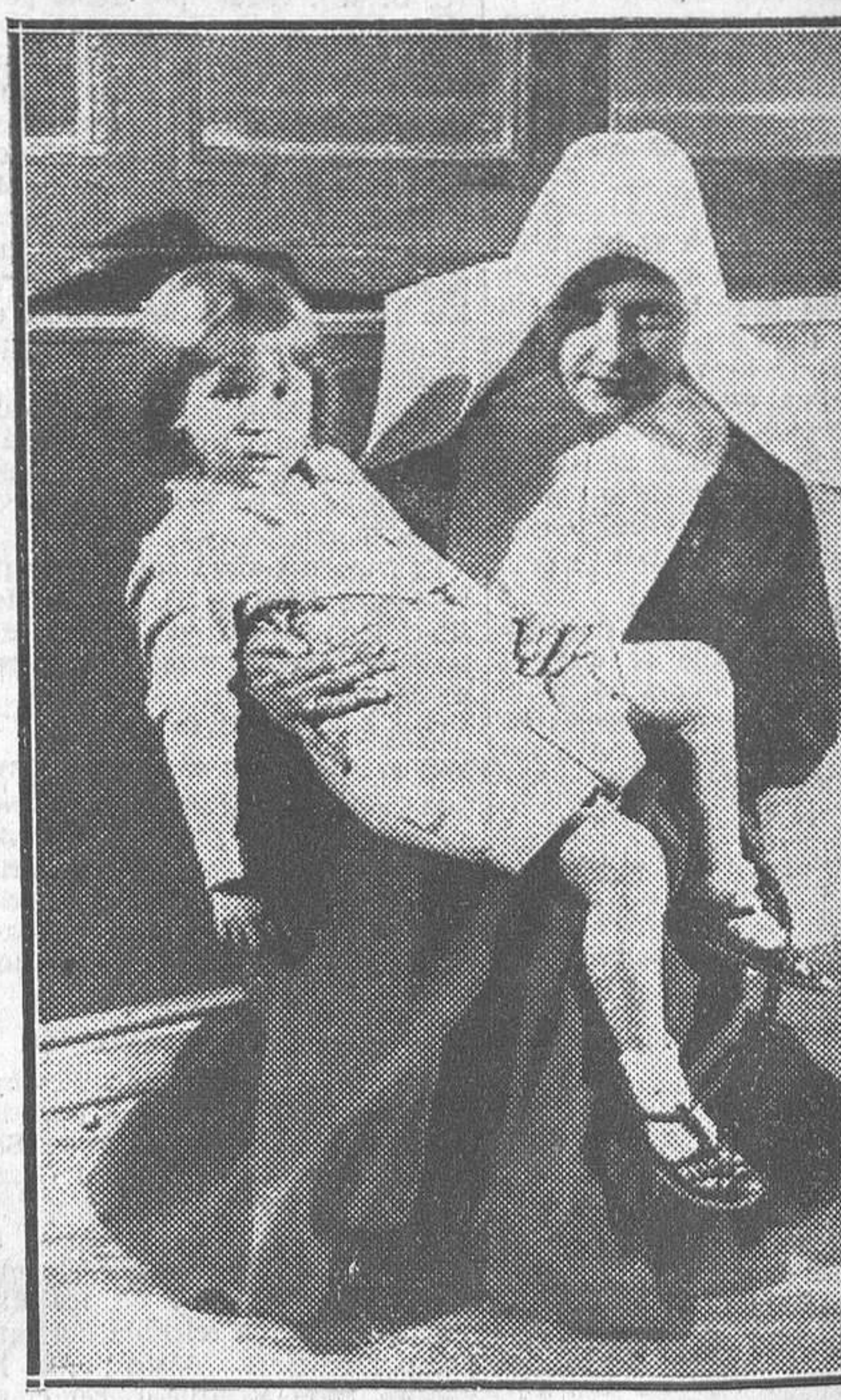
UNA ESCENA DE 'SOL EN LA NIEVE', PELICULA DE LA E. C. E. S. A. PROXIMA A TERMINARSE

Existe un espionaje y contraespionaje cauteloso, tenaz, lleno de intrigas y de misterios por parte de los traficantes de drogas, que presta singular interés a la lucha contra el tráfico de estupefacientes. No es gente pacífica la que se dedica a estos arriesgados negocios. Es gente que siempre tiene cuentas pendientes con la justicia; matones, estafadores y toda clase de indeseables—mujeres y hombres—son los más activos contrabandistas de drogas.