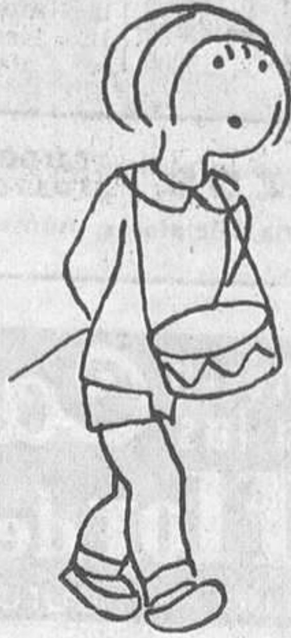
-«¡Pos» nos ha «fastidiado» el «Mengue»!