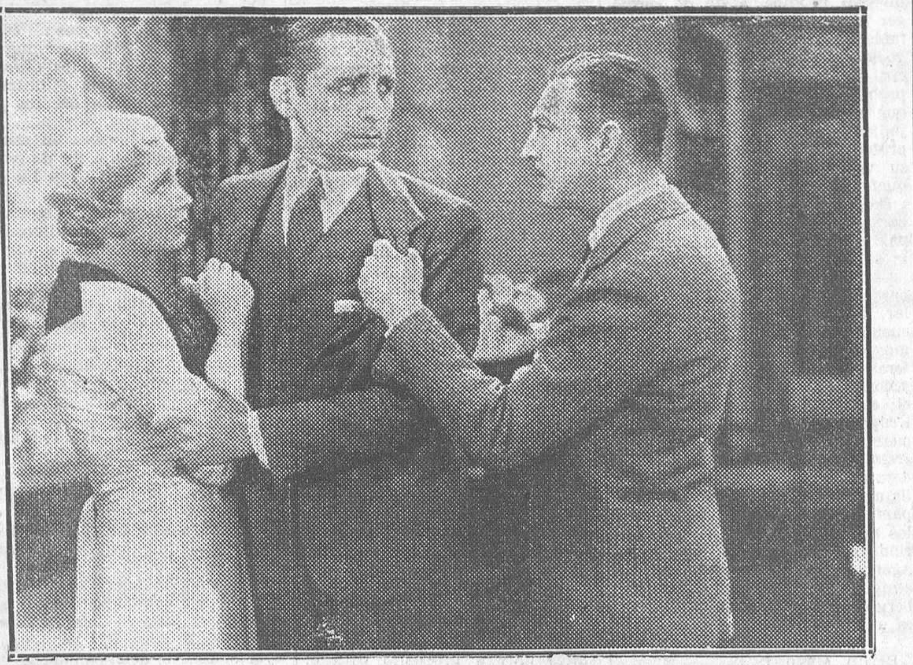
UNA ESCENA DE 'LA ULTIMA ACUSACION', QUE SE PROYECTA CON EXITO EN EL AVENIDA

'Topaze' ha sido dirigido por Louis Gasnier e interpretado por Louis Jouvent Pauley y Edwige Feuillère y Marcel Valdes. Es un film Paramount realizado en los estudios de París.