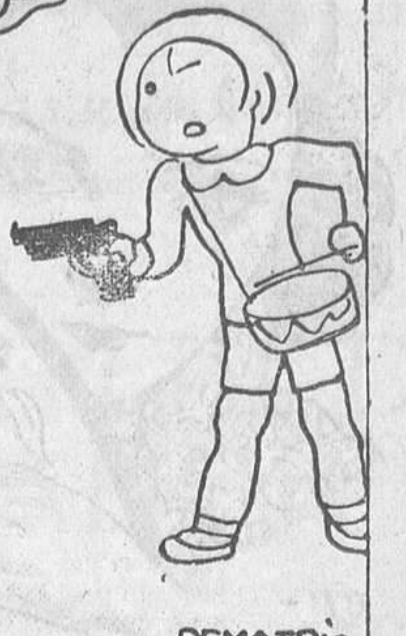
-«¡Pos» que venga si quiere, que le voy a «sacudí» un tiro que le voy a «levantá»!