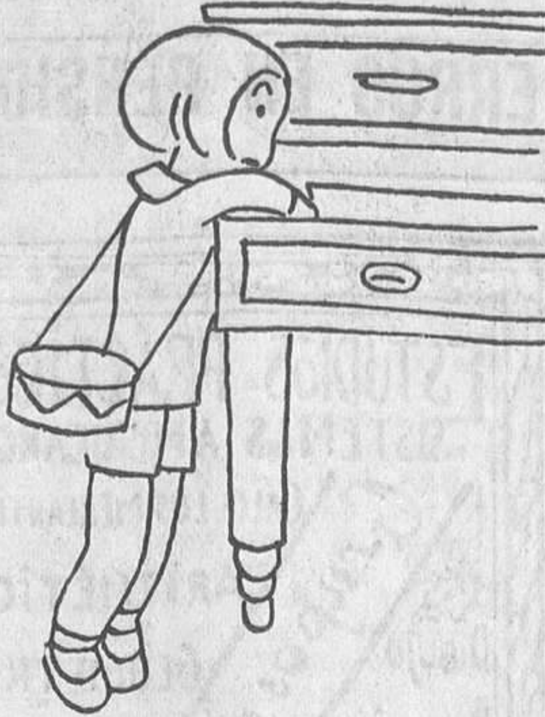
-¡A ver si es que no puedo jugar porque el «Mengue» no quiera!