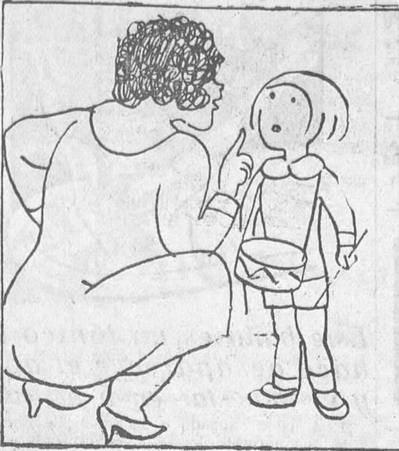
-¡No hagas ruido, encanto mío, porque vendrá el «Mengue» y te cogerá!