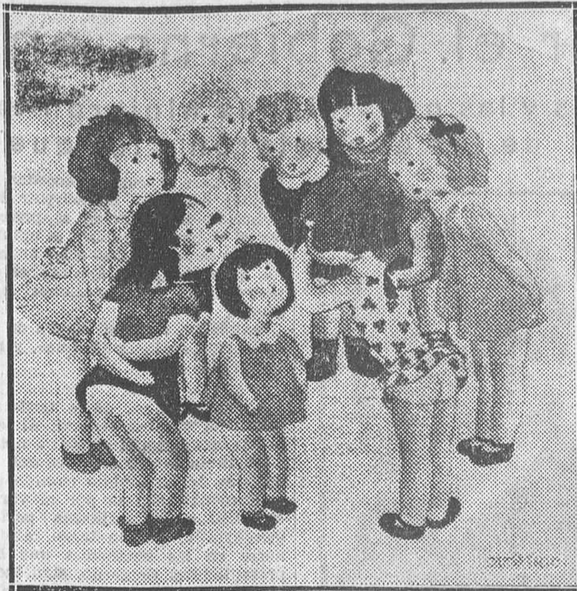
«El secreto», dibujo de Demetrio, en el Salón de Humoristas

La Unión de Dibujantes Españoles, organizadora de los Salones de Humoristas, ha obtenido un indiscutible éxito en el XVI, que se ha celebrado en la Exposición permanente del Círculo de Bellas Artes.