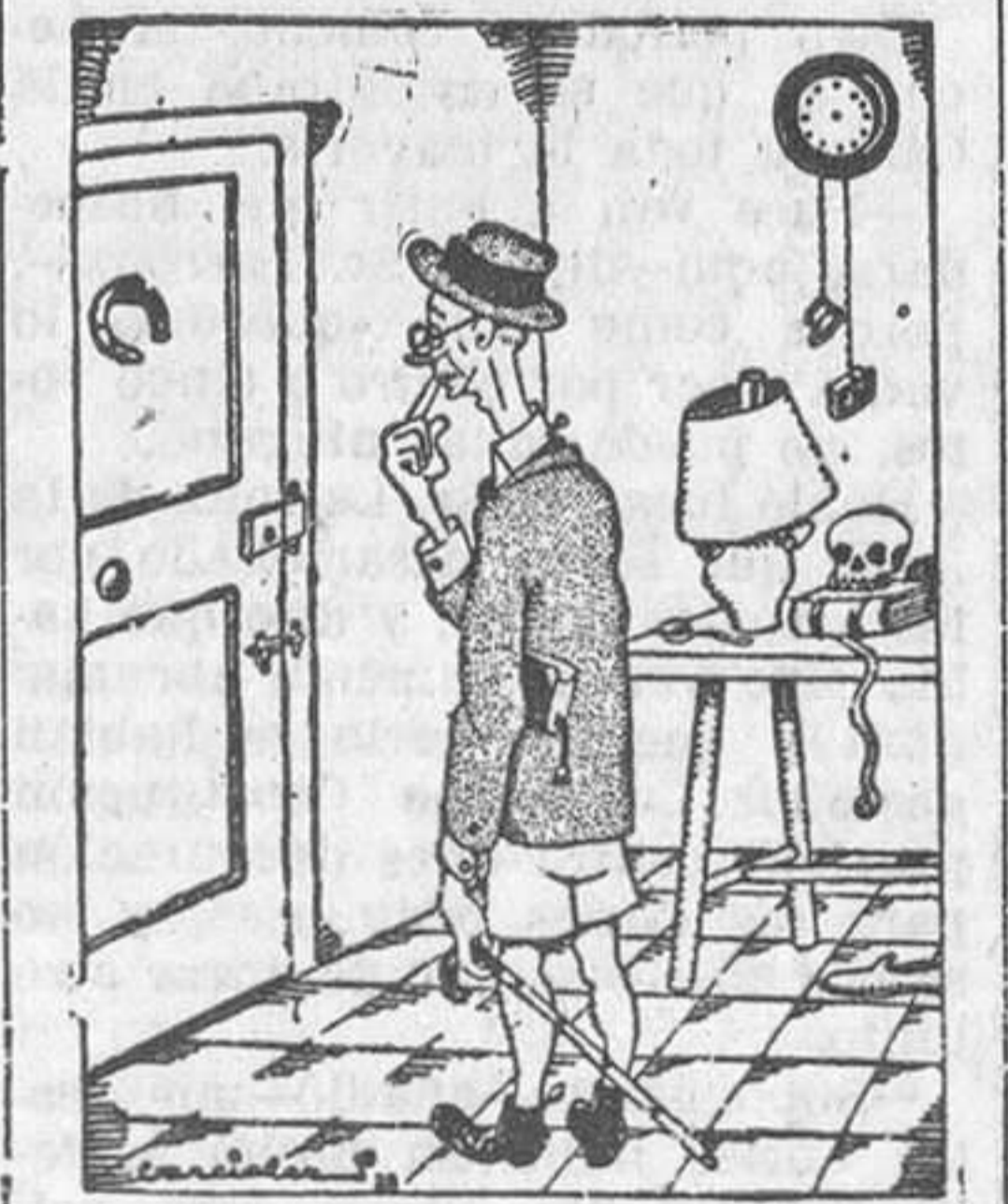
«El sabio distraído.—Creo que hoy no se me olvida nada», dibujo de García, en el Salón de Humoristas

El numeroso público de profesionales y aficionados que asistió a la inauguración de la Exposición Elena Verdes Montenegro elogió grandemente las obras exhibidas y felicitó a su autora.