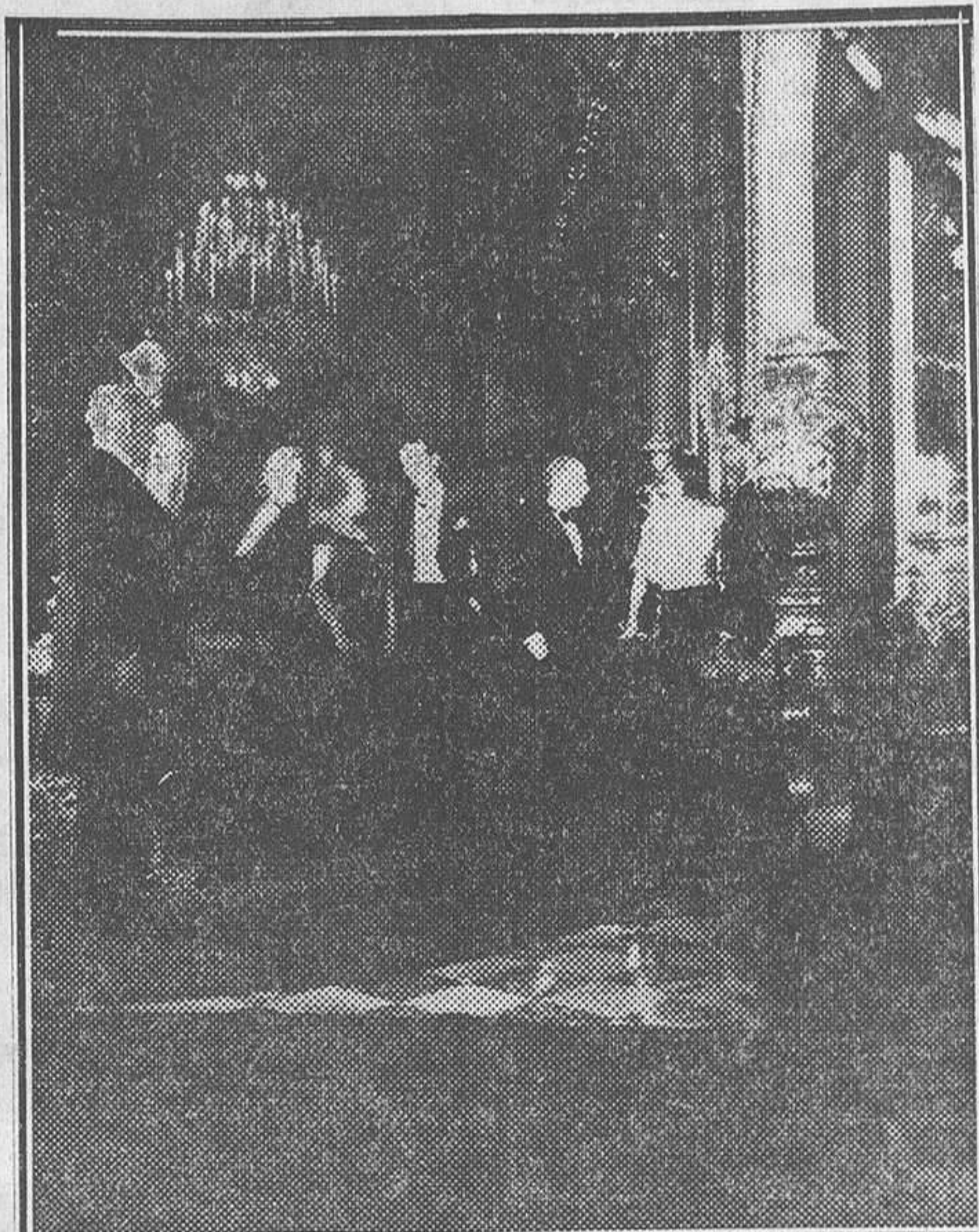
UNA ESCENA DE «MADRID SE DIVORCIA», PELICULA ESPANOLA QUE SONORO FILMS PRESENTARA PROXIMAMENTE A NUESTRO PUBLICO

¡ÉXITO! ¡ÉXITO! ¡ÉXITO! Segunda semana de LA PRINCESITA DE SCHOENBRUNN Es el 8.º EXTRAORDINARIO FILM del Barceló