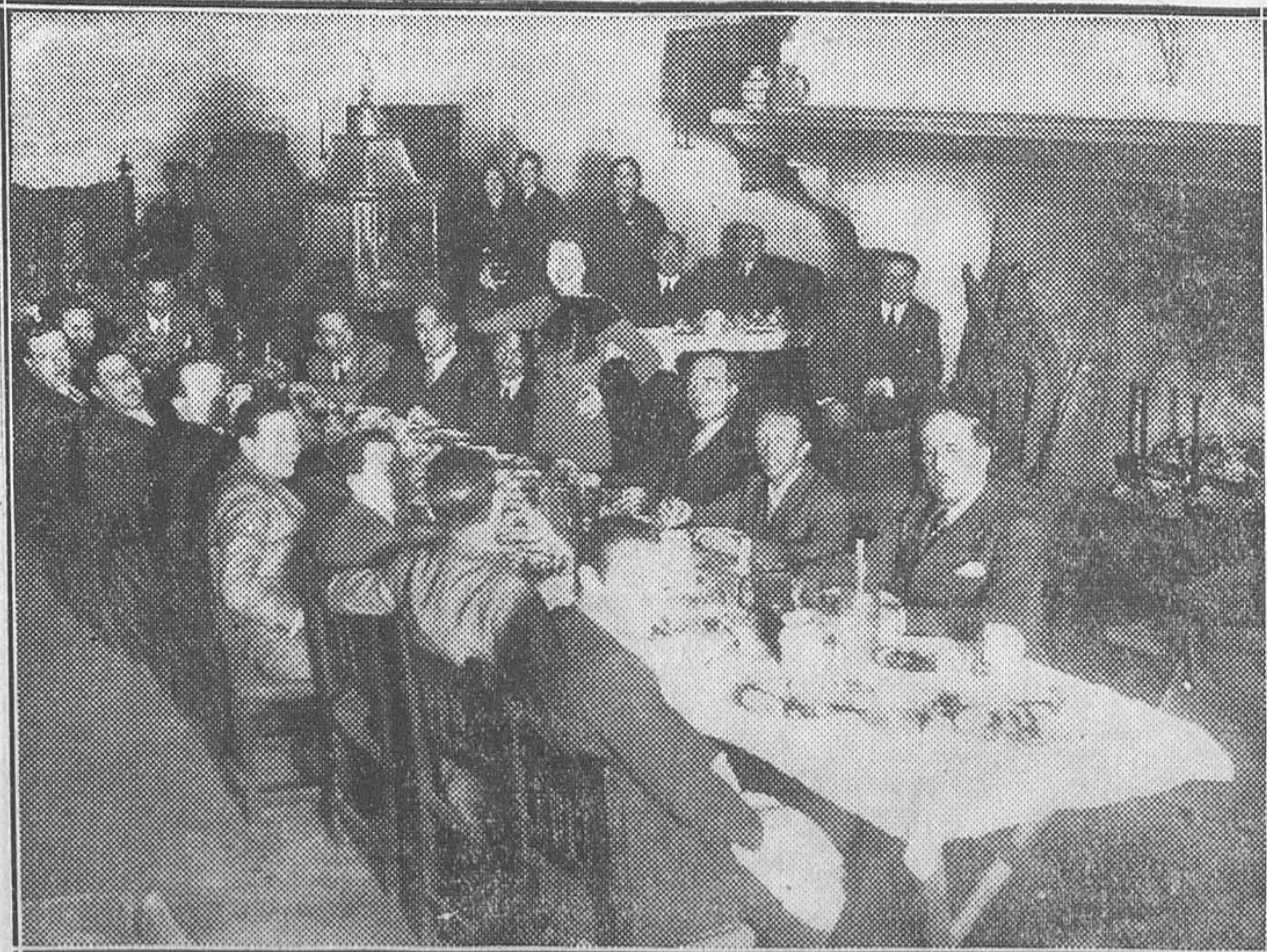
COMIDA OFRECIDA POR REDACTORES CINEMATOGRAFICOS UNIDOS A LA ESTRELLA RUMANA POLA ILLERY EN ALCALA DE HENARES