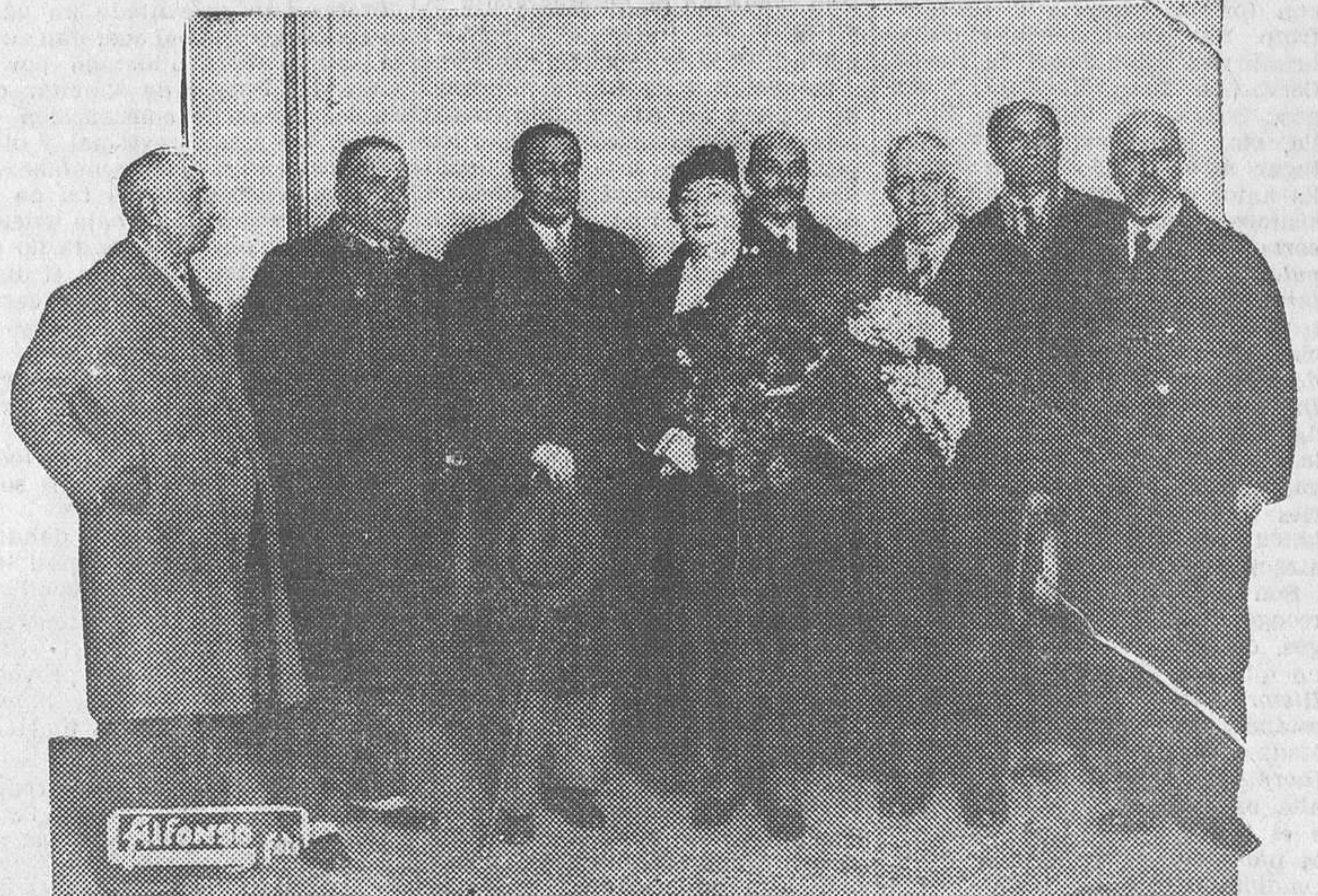
La doctora uruguaya doña Paulina Luisi en la ceremonia de ser recibida como miembro del Colegio de Doctores