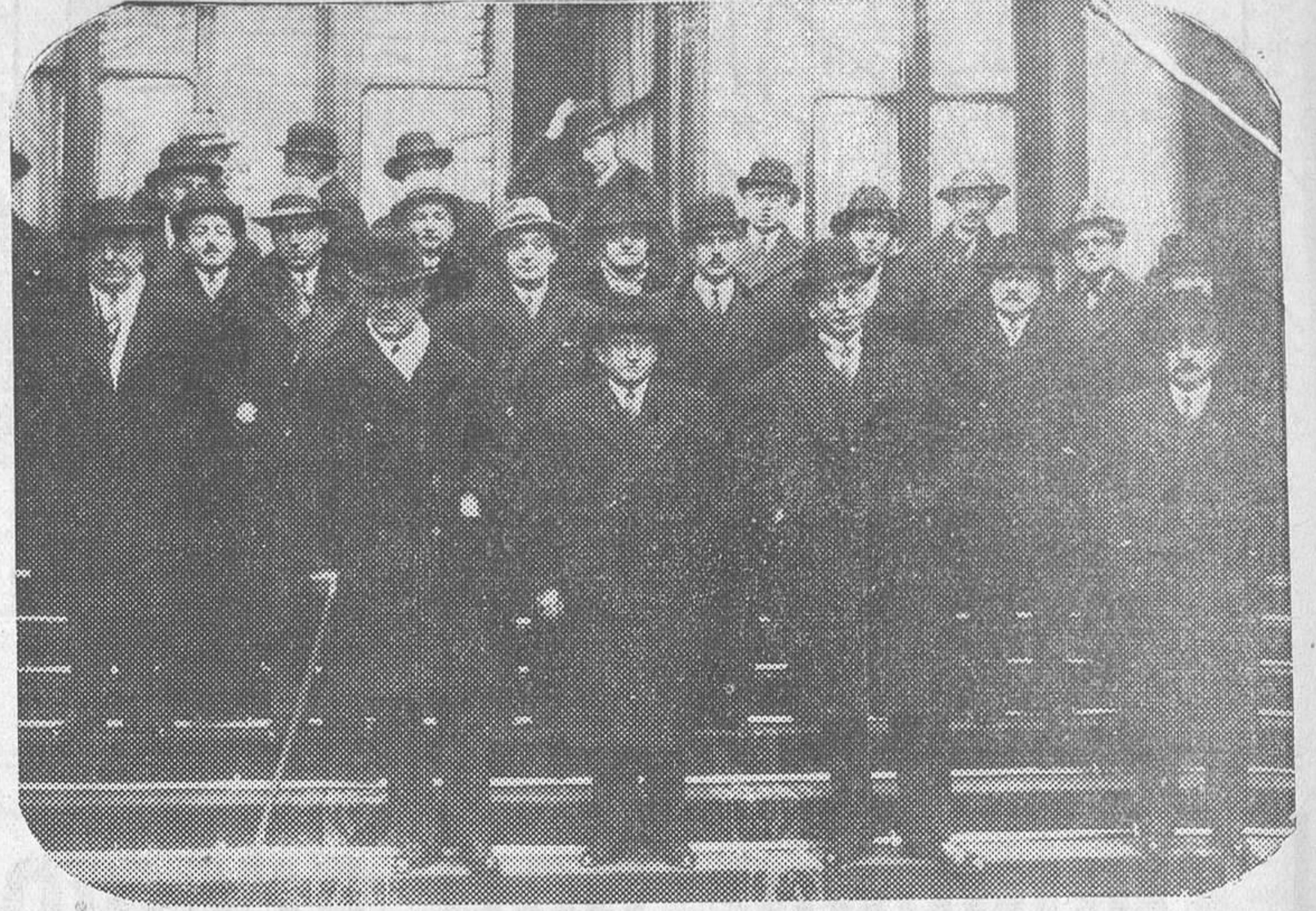
Edouard Daladier, que acaba de formar el nuevo Gobierno de Francia, fotografiado con los ministros a la salida del Eliseo

Se asegura que esta conversación está relacionada con el propósito del Gobierno de pedir se designe inmediatamente la Comisión de encuesta parlamentaria para que ponga en claro todo lo relacionado con el asunto Staviski.