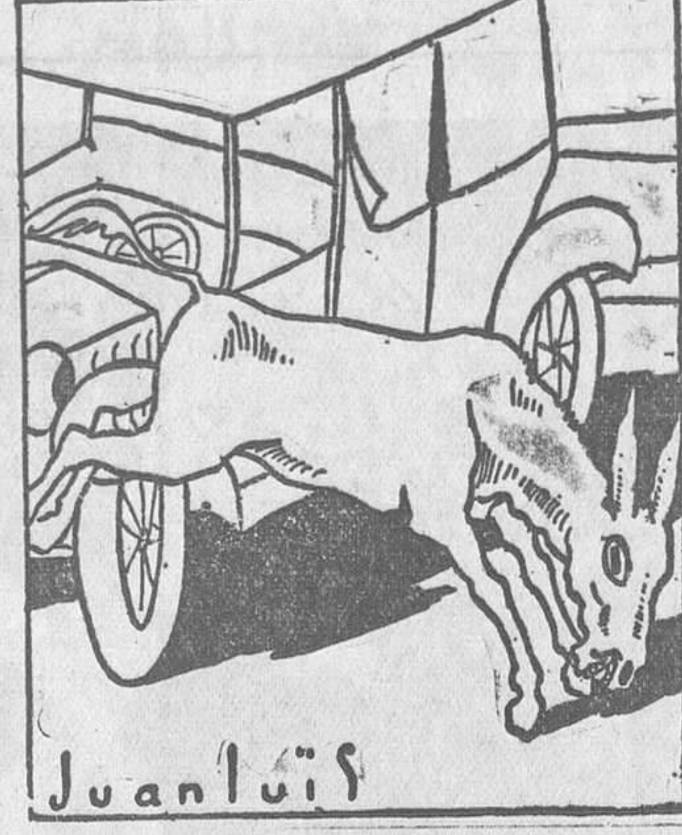
—¿Y decía usted que había comprado un automóvil? ¡Mardita zae!...