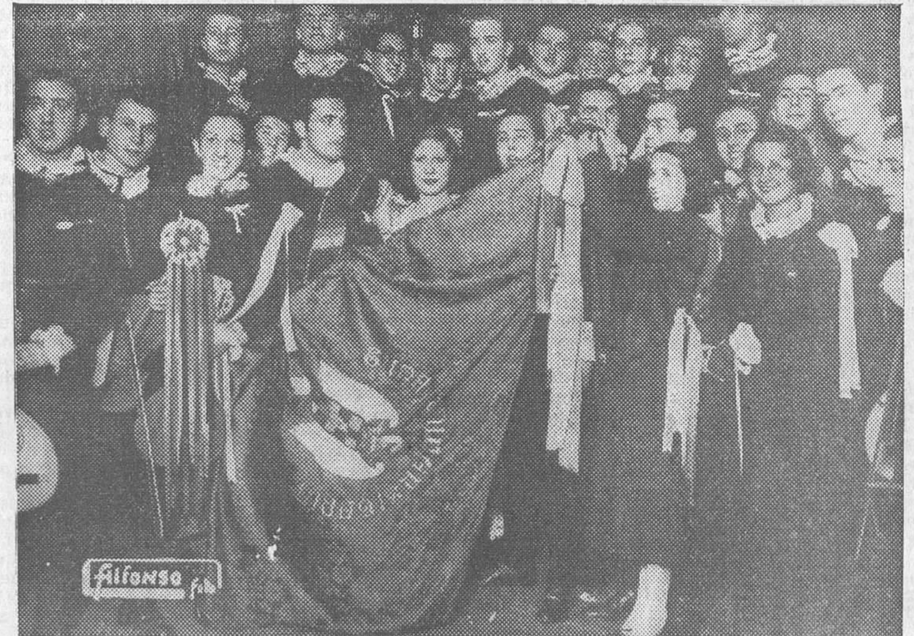
La Tuna Universitaria de Madrid al serle impuesta a su bandera la corbata ofrecida por el cuadro artístico El Relablo de Masaj Pedro