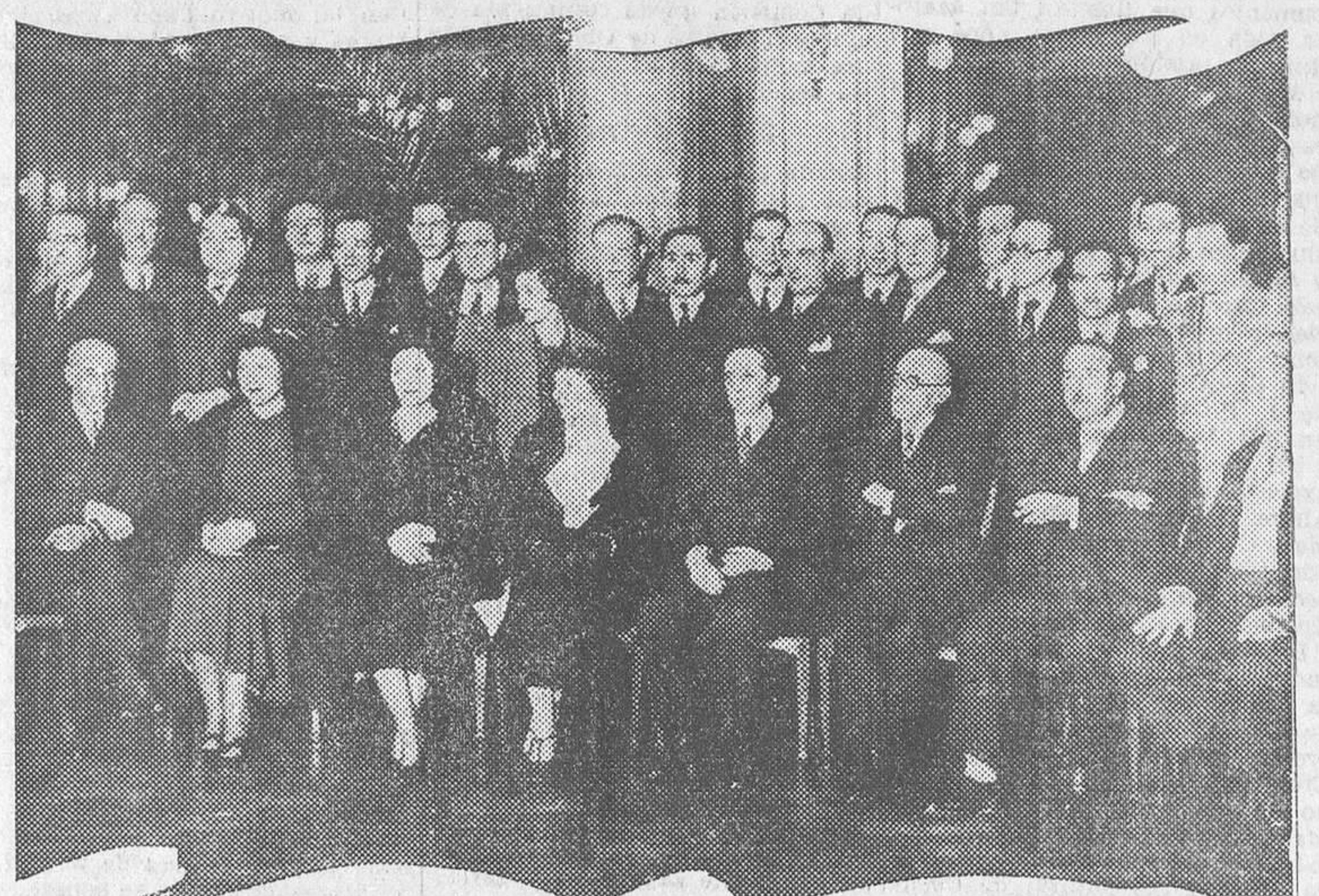
La ilustre actriz Catalina Bárcena, que ayer tarde fué obsequiada con un almuerzo para festejar sus triunfos como artista cinematográfica, acto al que concurrieron el embajador norteamericano en España, algunos escritores y otras personas