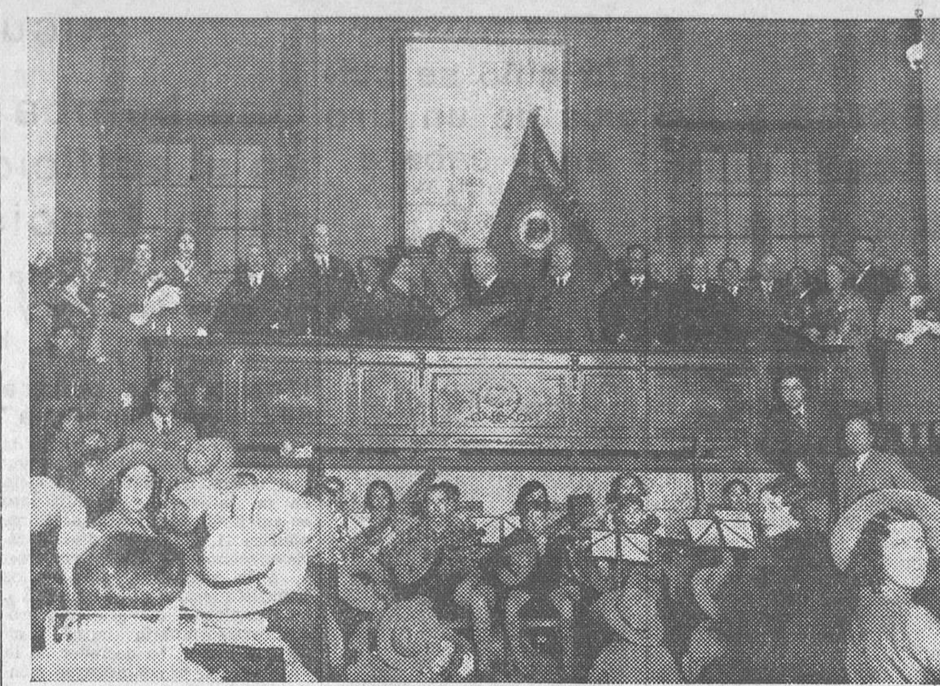
La Junta directiva de las Legionarias de la Salud en la Asociación de Ferroviarios, donde ha sido recibida para agradecerle la labor que viene realizando.

Notas informativas Manifestaciones del alcalde El Sr. Rico manifestó ayer a los periodistas que había conferenciado con el ministro de Agri-