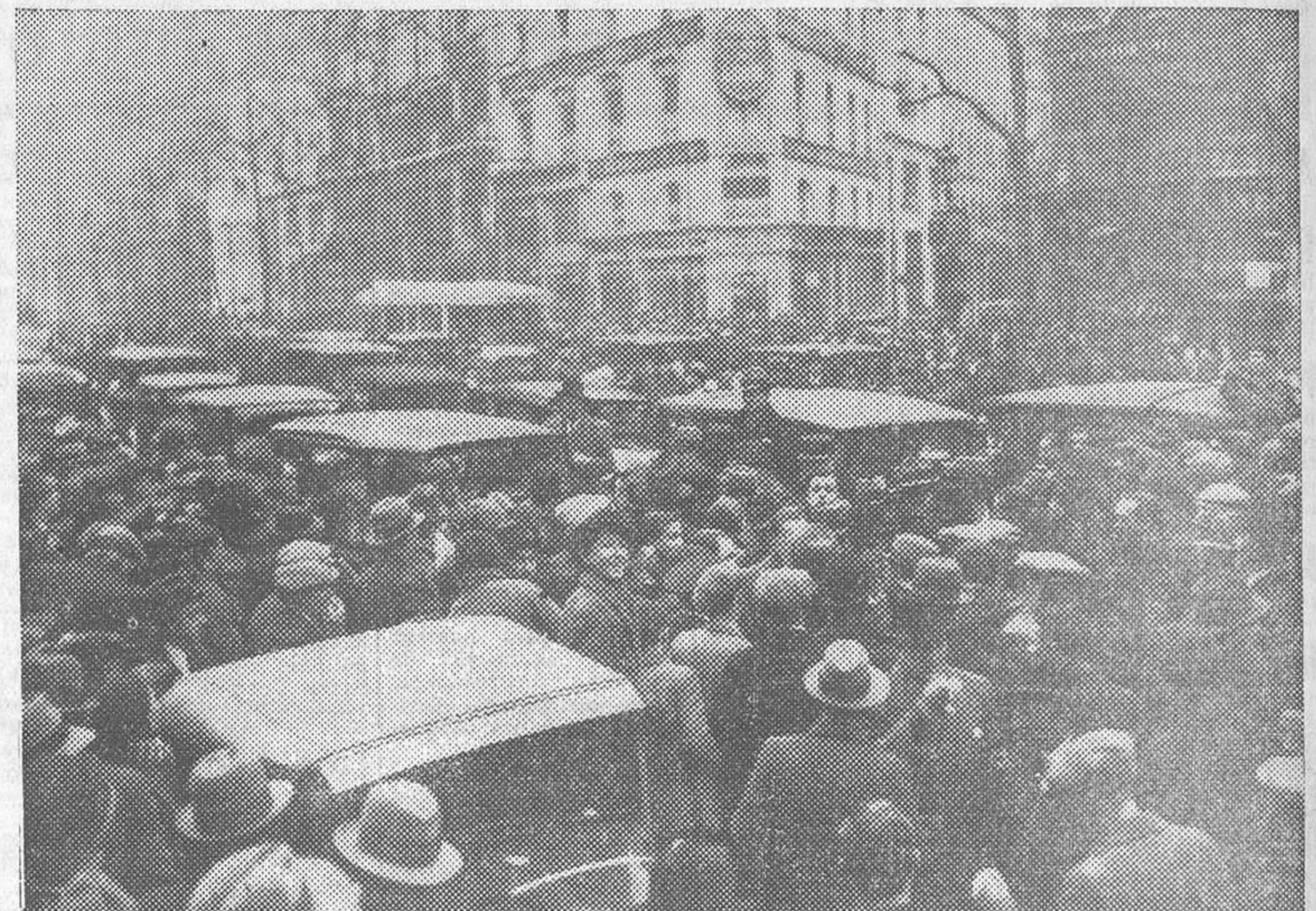
Los taxistas de París han organizado una manifestación, para protestar contra el nuevo impuesto sobre la esencia, en el barrio de la Opera. Vista de la manifestación, que interrumpió la circulación por todo el barrio durante más de una hora