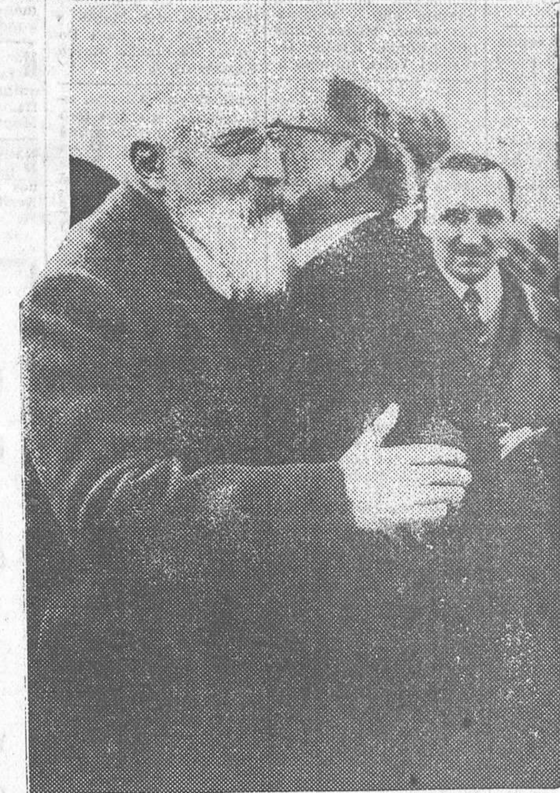
A su llegada a Marsella en el avión «Emeraude», el gobernador general de la Indochina, M. Pasquier, abraza a su hermano, que fué a esperarle. Unas horas más tarde, el avión se destrozaba trágicamente en Corbigny, la Nièvre, muriendo aquel alto funcionario.