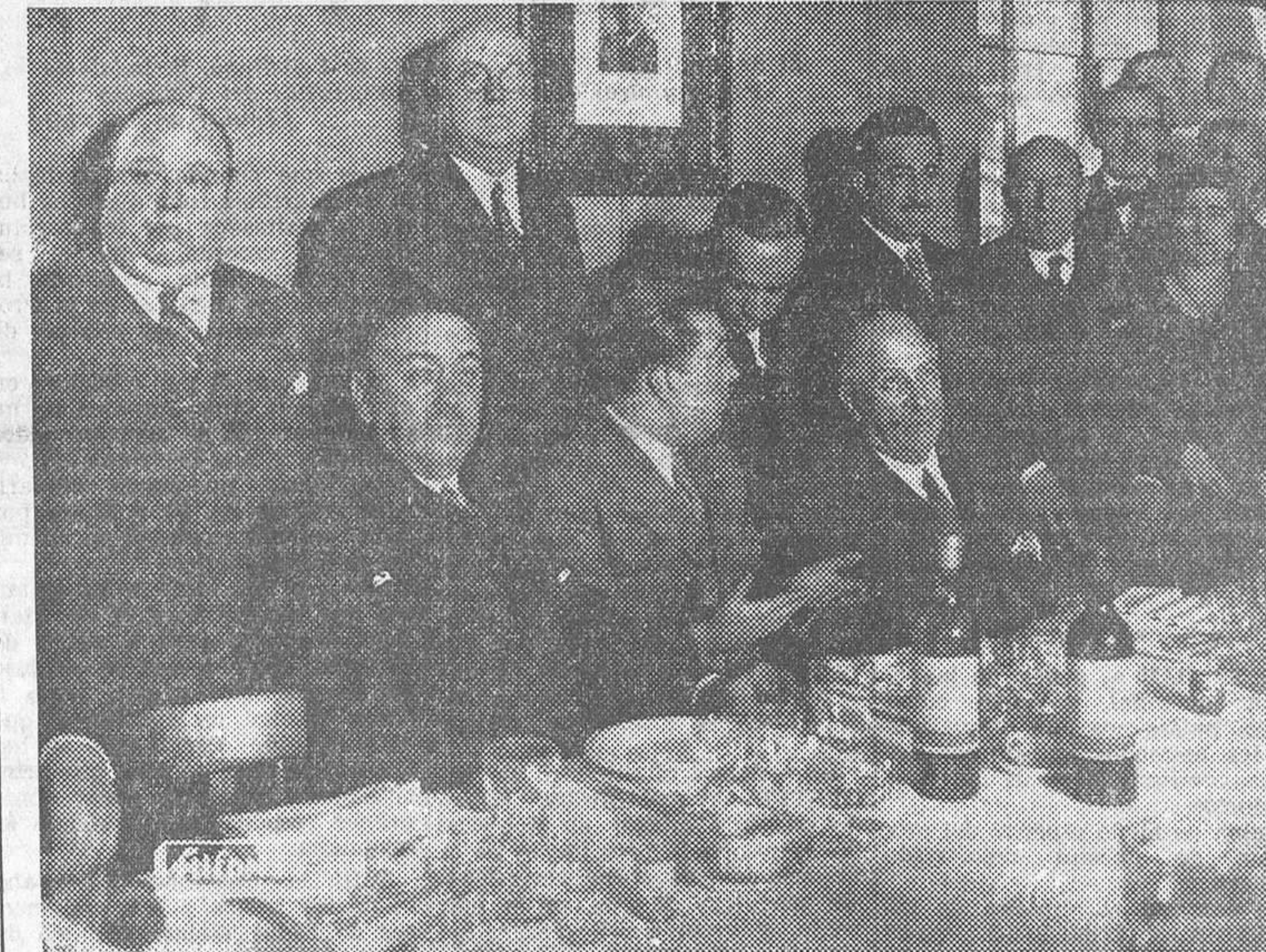
Banquete ofrecido ayer por la colonia andaluza a sus paisanos el presidente del Consejo y los ministros de la Guerra, Instrucción pública y de Agricultura

manifiesto que se había empleado toda la mañana en discutir la propuesta del conde de Vellellano. Que se habían presentado otras proposiciones, entre ellas la siguiente, del Sr. Salmón, de la C. E. D. A.: