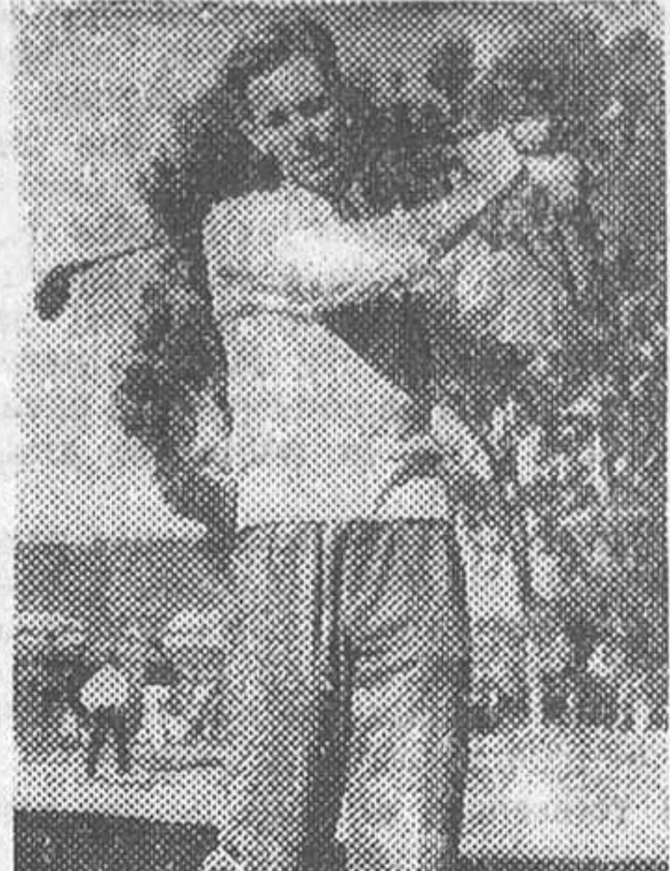
El celebre tennisman americano Ellsworth tiene intencion de dejar la raqueta y dedicarse al golf. En la foto le vemos entrenandose