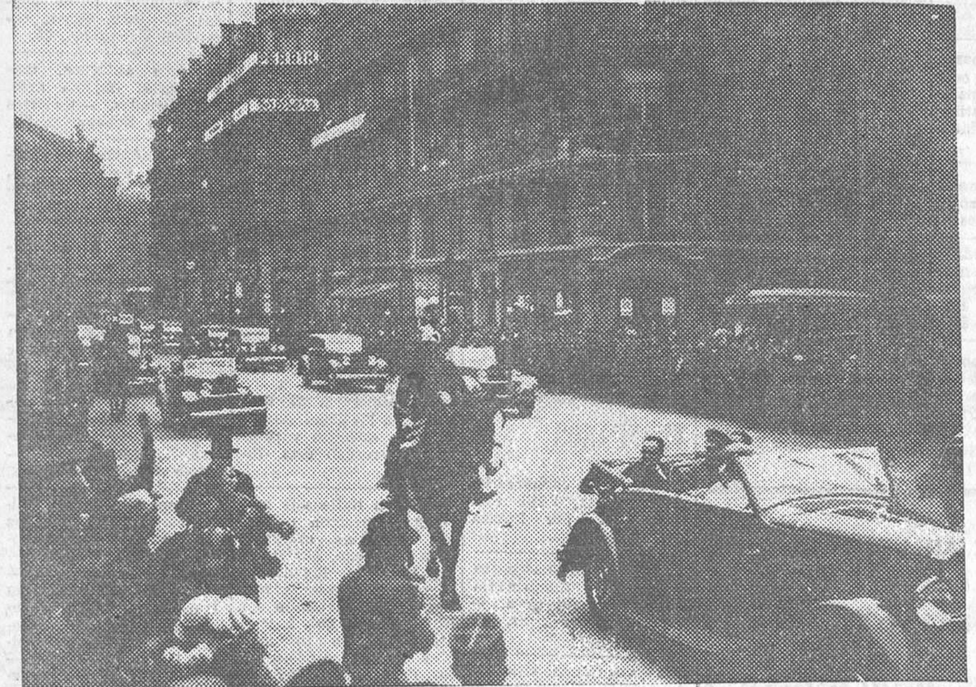
El coche que conduce a Vuillemin y al ministro del Aire pasa por la avenida de la Opera, con dirección al Ayuntamiento.

«Enterados por la comunicación del Gobierno de la República española de los resultados de la segunda Conferencia de Oficinas de Prensa gubernamentales y de representantes de Prensa, reunida en Madrid del 7 al 11 de Noviembre de 1933, el Consejo felicita al Gobierno español por la importante cooperación aportada, merced a su iniciativa, al examinar las cuestiones de la difusión de noticias inexactas capaces de dificultar el mantenimiento de la paz y de la amistad de los pueblos.»