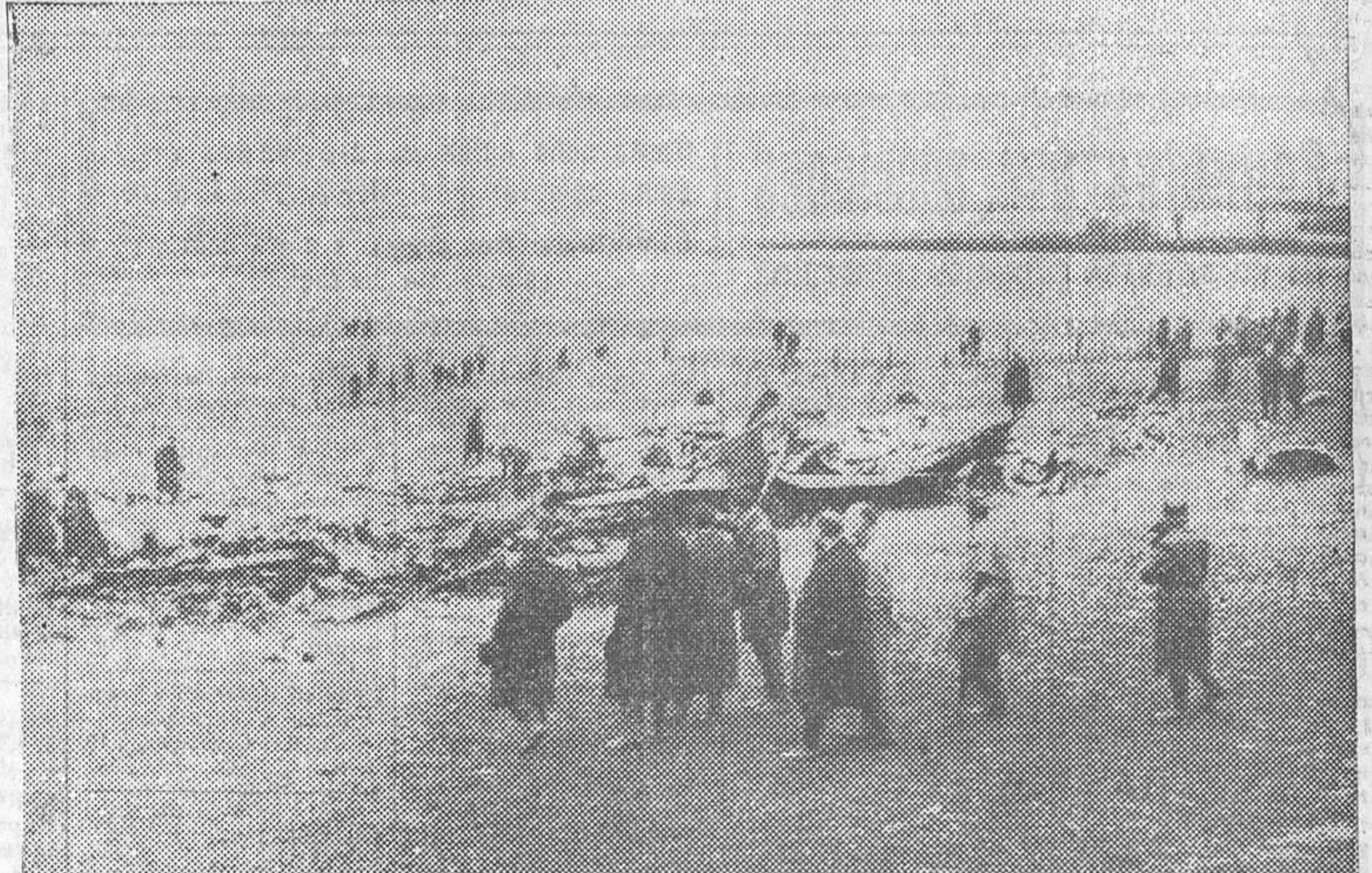
De la catástrofe del «Emeraude». Los restos calcinados del trimotor en Corbigny.