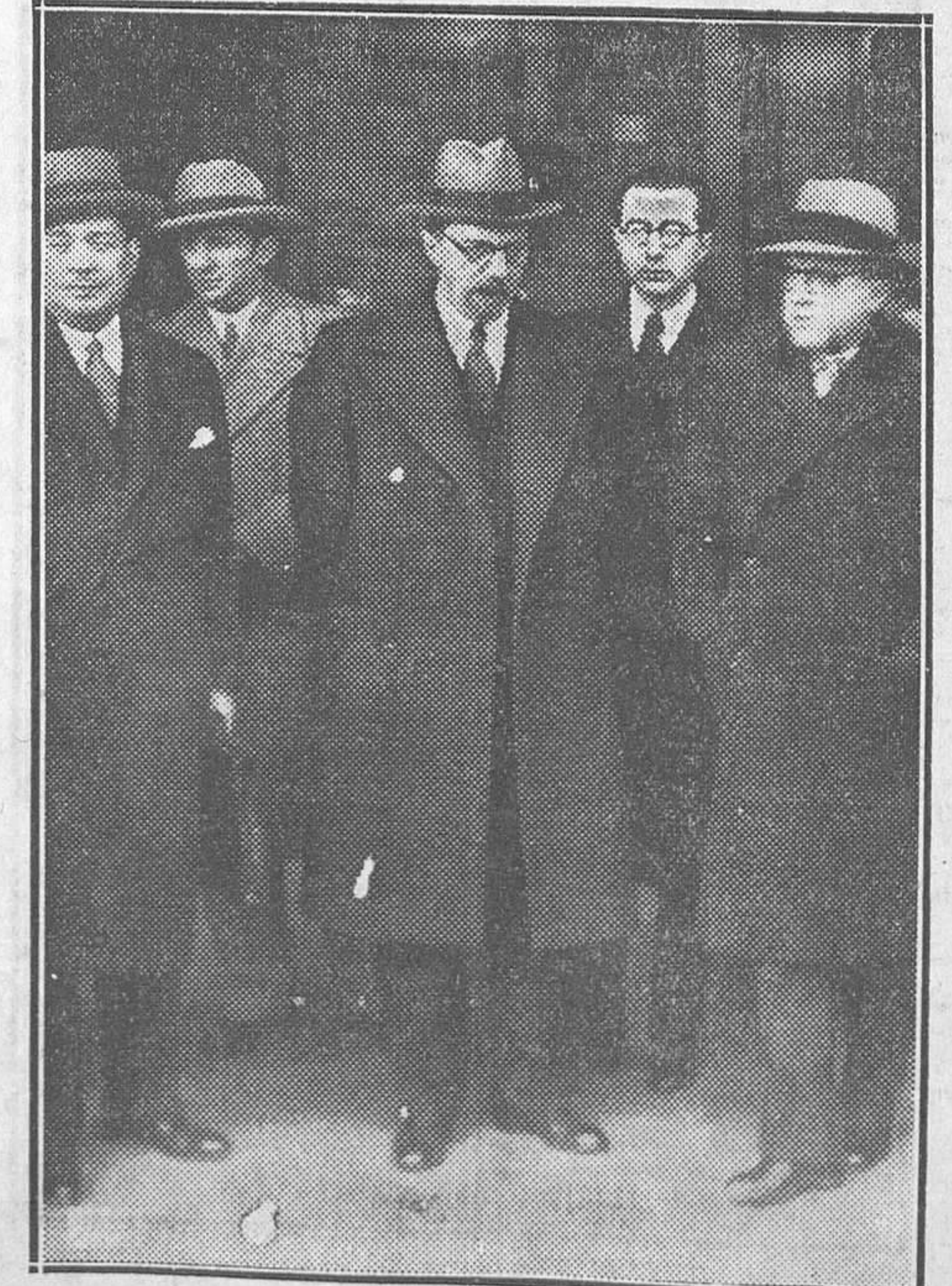
El nuevo alto comisario de España en Marruecos al llegar ayer mañana a Madrid.