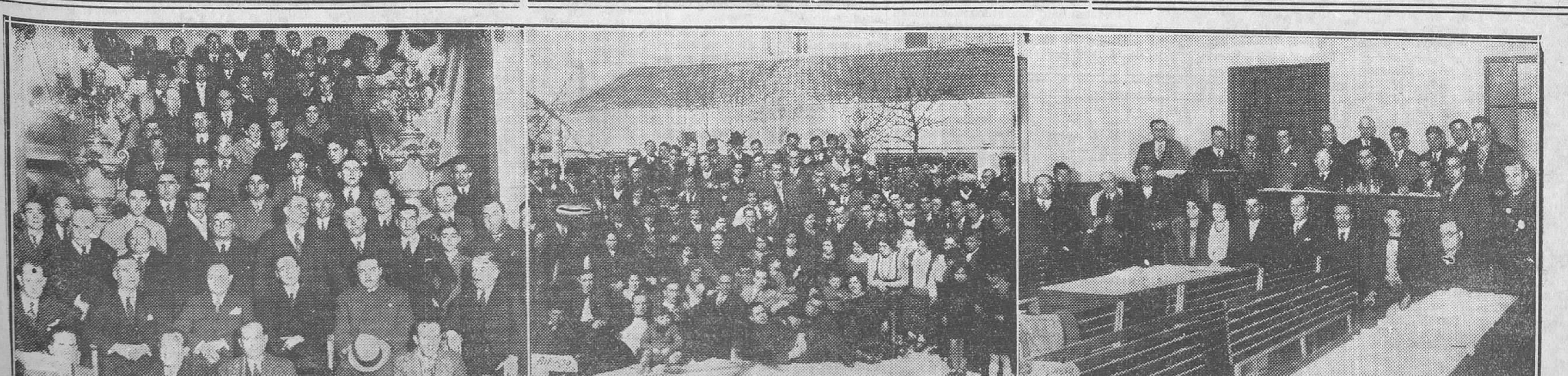
ACTOS DEL DOMINGO.—Delegados que asisten a la Asamblea de la Federación de Drogueros, inaugurada en el Circulo de la Unión Mercantil.—Concurrentes al banquete celebrado con motivo del XXXII aniversario de la Asociación de Cerradores y Repartidores de Prensa.—Delegados del II Congreso de la Cooperativa de Casas baratas Pablo Iglesias, en la sesión inaugural, celebrada en la Casa del Pueblo