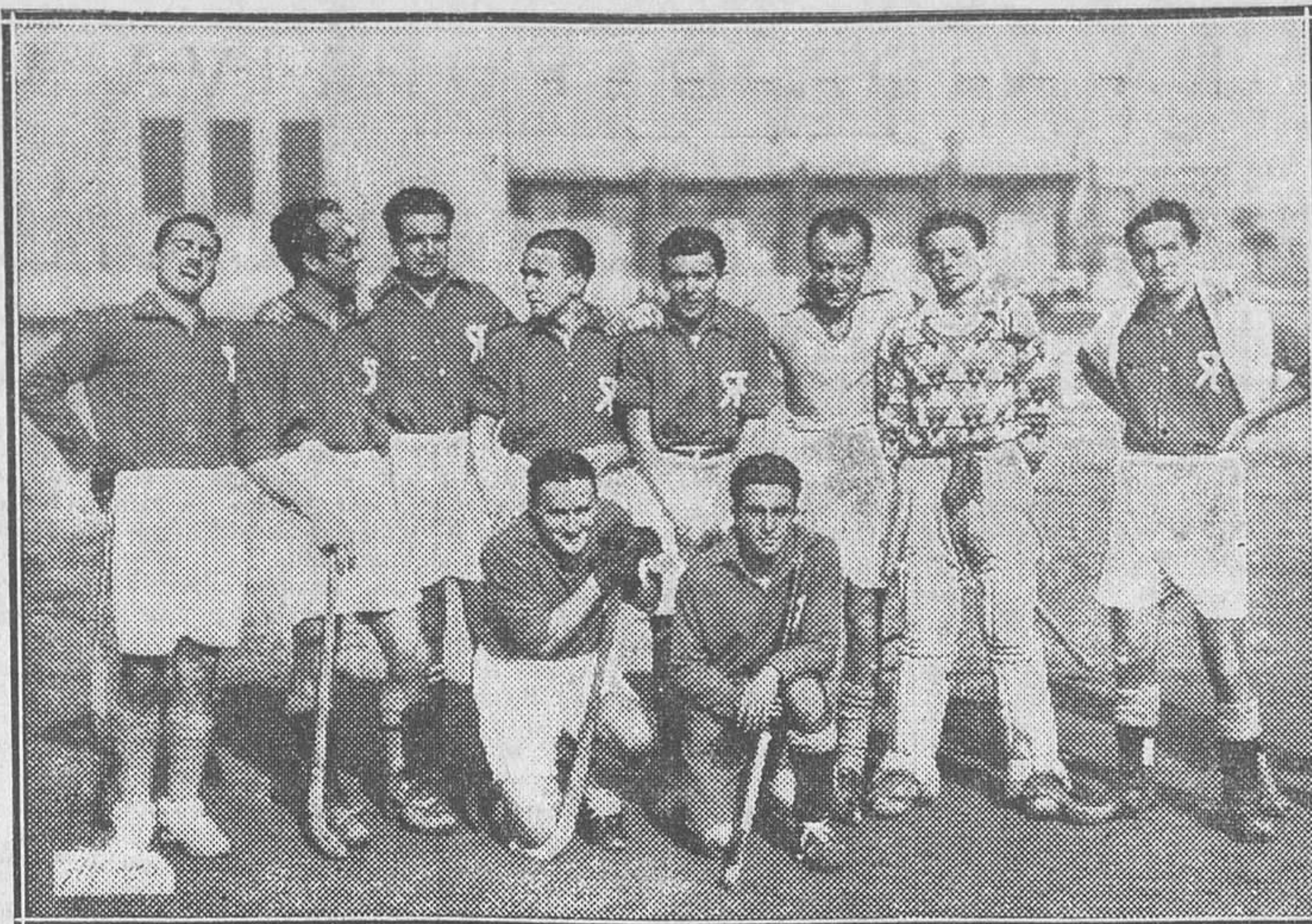
El equipo de hockey de la Residencia de Estudiantes que jugó el domingo en Madrid contra el de la Fundación del Amo

Se celebró en la Sierra de Guadarrama la prueba de menores en esquí, cuyo recorrido fue: Pradera de los Cogorros (meta de salida), segundo Cogorro, puerto de Navacerrada, chalet de Peñalara (meta de llegada).