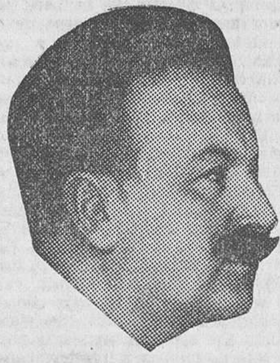
Serafín Alvarez Quintero

—Porque las comedias deben tener los actos que precisen: uno, dos, tres, cuatro actos. Los que sean. Hay que hacer algo contra la rutina de los tres actos. Nosotros estamos dispuestos, dígame usted, insista usted sobre esto, a escribir comedias en dos actos para dar ocasión a la prueba del autor nuevo. Así empezamos nosotros, por la pieza corta. Así empieza el pintor: primero por el cuadro pequeño, después el gran