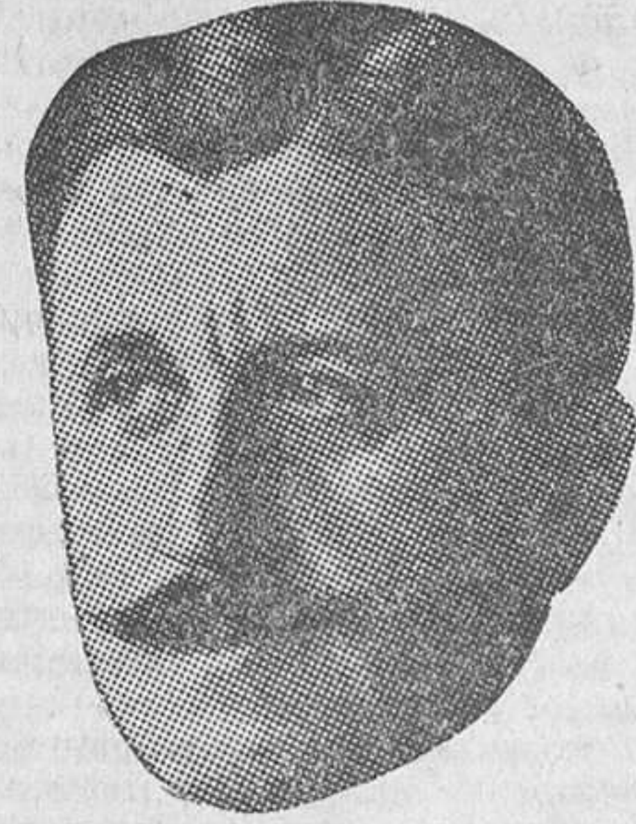
Joaquín Alvarez Quintero

ciudad de Autores, ante las cuales un autor se pregunta: «¿Pero dónde he caído? ¡Qué escritores son éstos, a los que uno jamás ha visto ni ha oído nombrar? ¡Claro! Por eso resulta que en un país como el nuestro, donde es infinita casi la lista de autores—dígamos mejor de gente que escribe para el teatro y hasta vive de él por temporadas—, no tenemos verdaderos autores más que unos poquitos: los que son escritores de verdad.