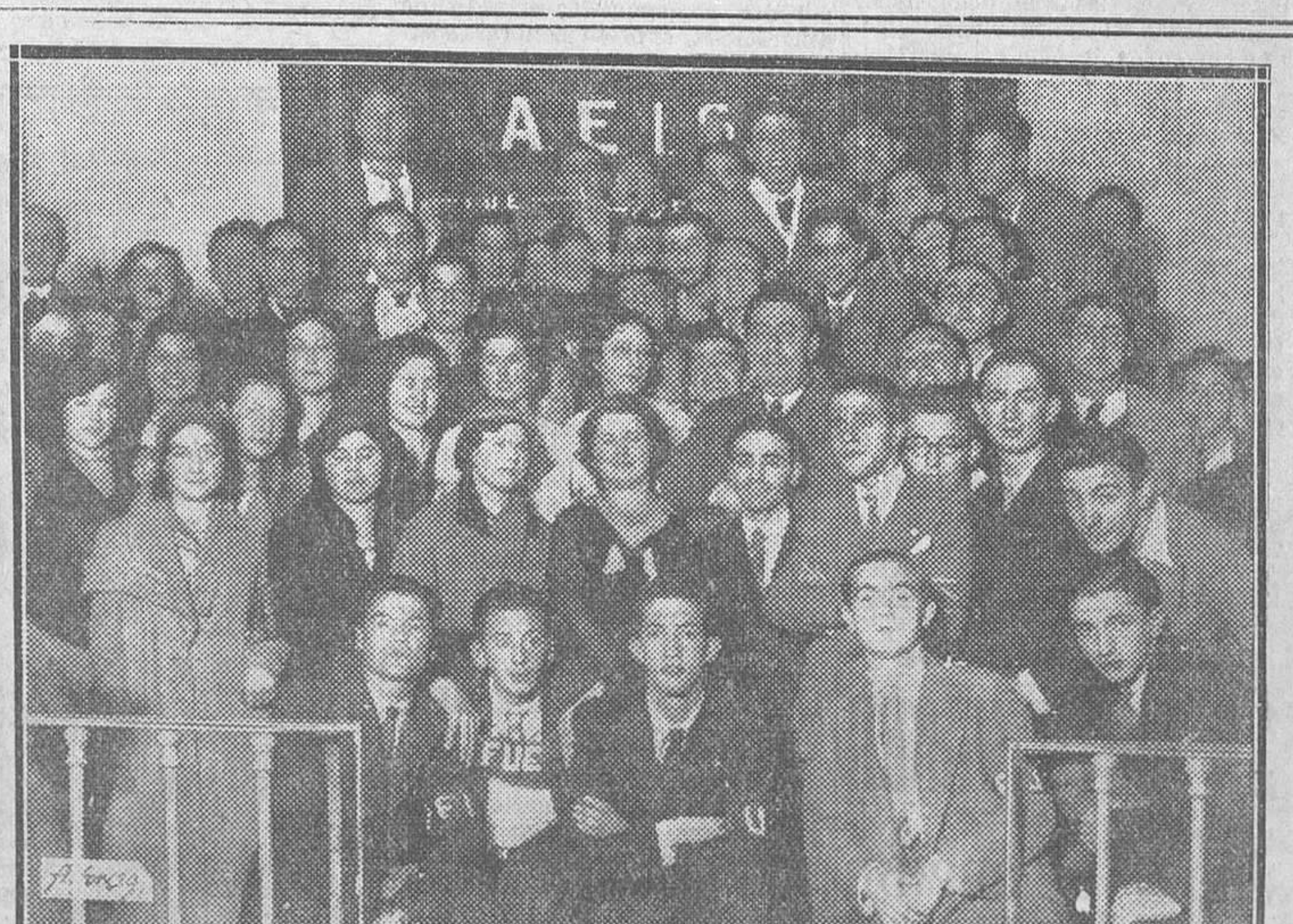
El director del Instituto de San Isidro rodeado de los alumnos que tomaron parte en el festival artístico celebrado con motivo del primer aniversario de la fundación de la Juventud de la F. U. E.