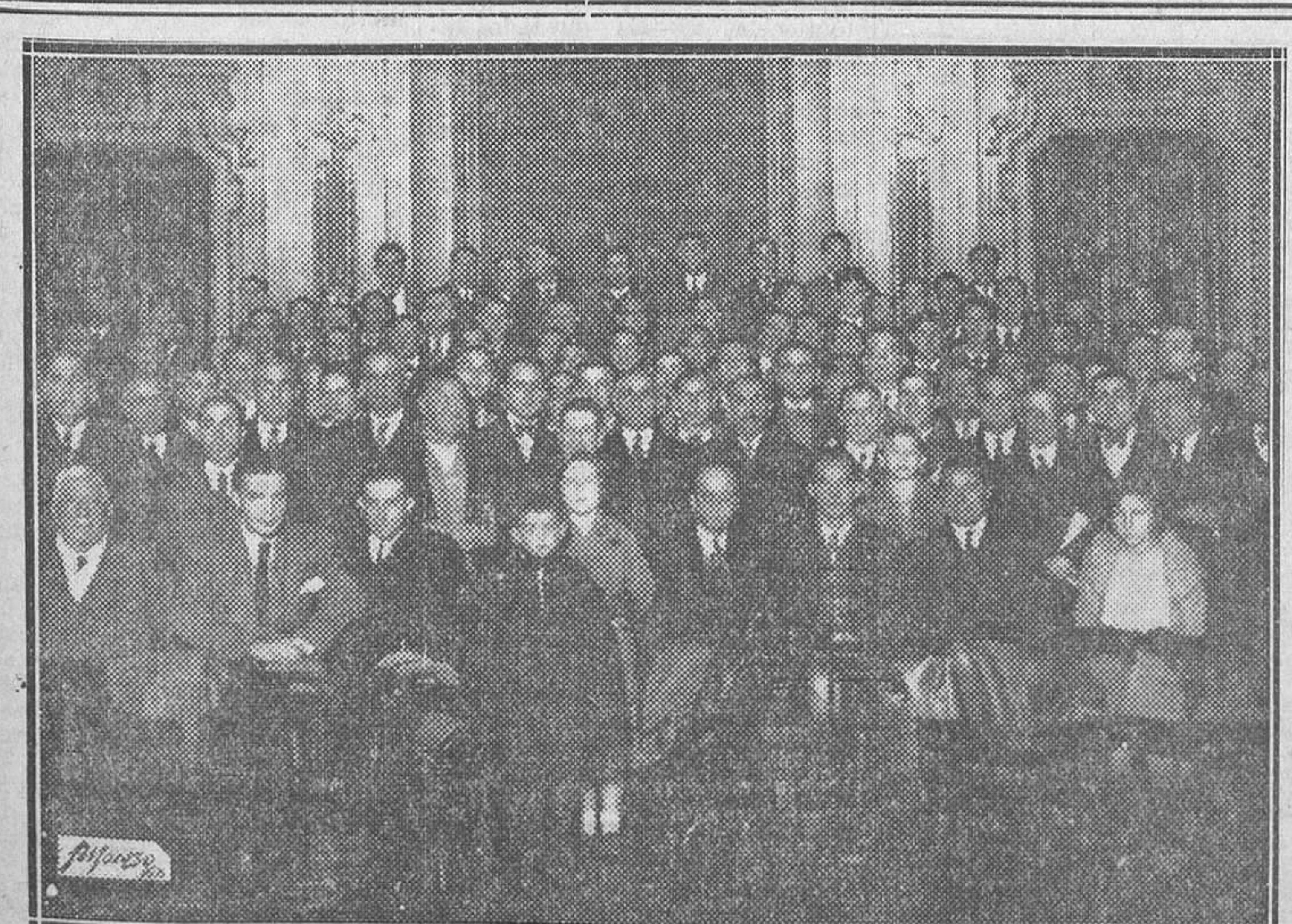
Reunión celebrada en el Círculo de la Unión Mercantil por los alcarreños residentes en Madrid para tratar de la creación de la Casa de la Alcarria