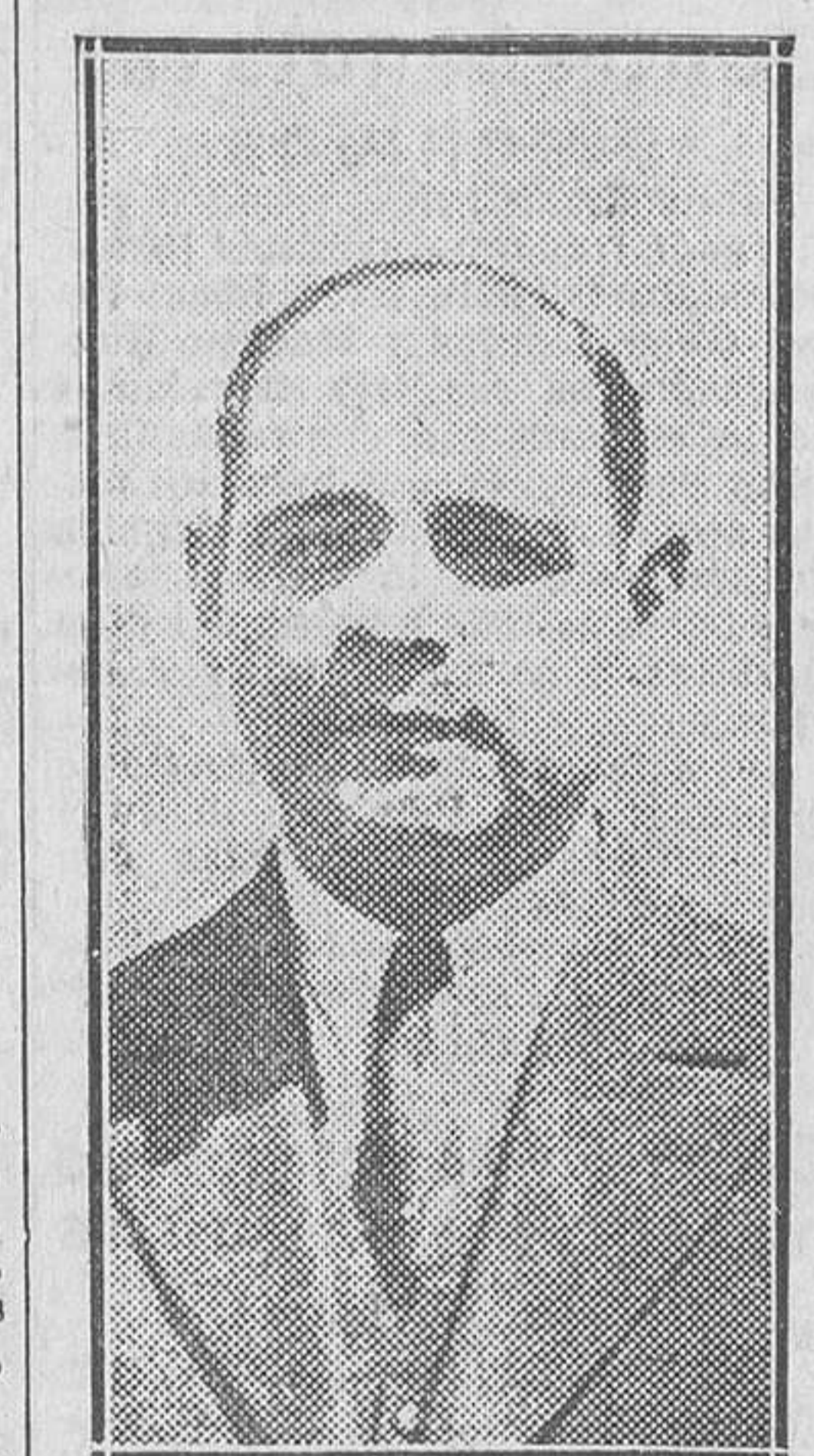
Don Abelardo Rodríguez, nuevo presidente de Méjico