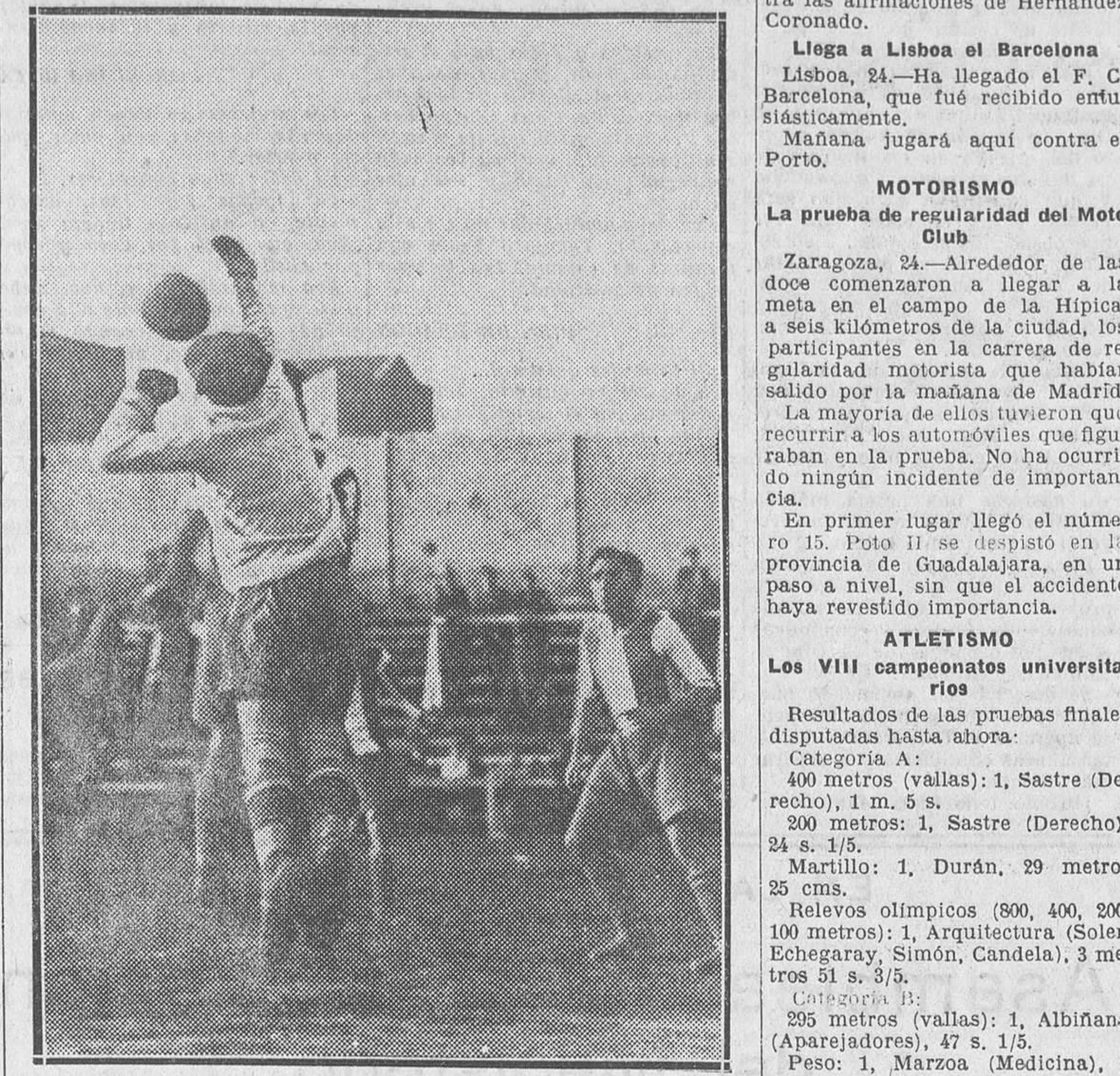
Una intervención del portero del Nacional en el partido jugado ayer en Madrid entre el Athletic y el Nacional

FUTBOL Los partidos de ayer En el campo del Nacional jugaron un partido amistoso los propietarios del terreno y el Athletic Club.