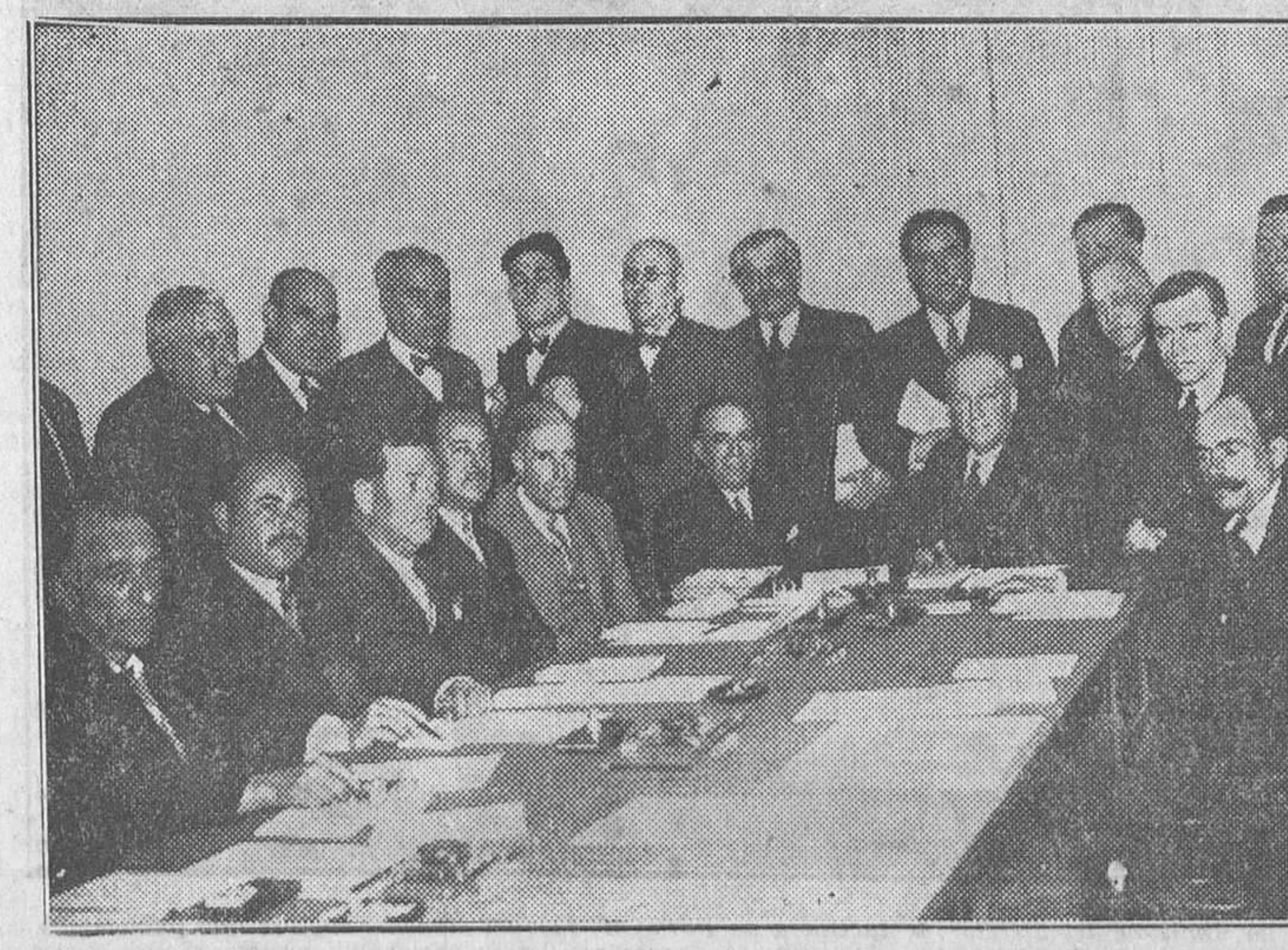
Reunión celebrada ayer por el Comité Nacional Socialista para fijar el orden del día del XIII Congreso del Partido, que se celebrará en breve

El Sr. Domingo hizo hoy a los periodistas las manifestaciones siguientes: —Hoy saldrán para Jaén diez ingenieros de los que constituyen la Junta Central de Laboreo forzoso para la aplicación inmediata del decreto que sobre laboreo forzoso acaba de publicarse. Hay ya en Jaén actualmente otros ingenieros del mismo servicio y con el encargo de cumplir idéntica misión.