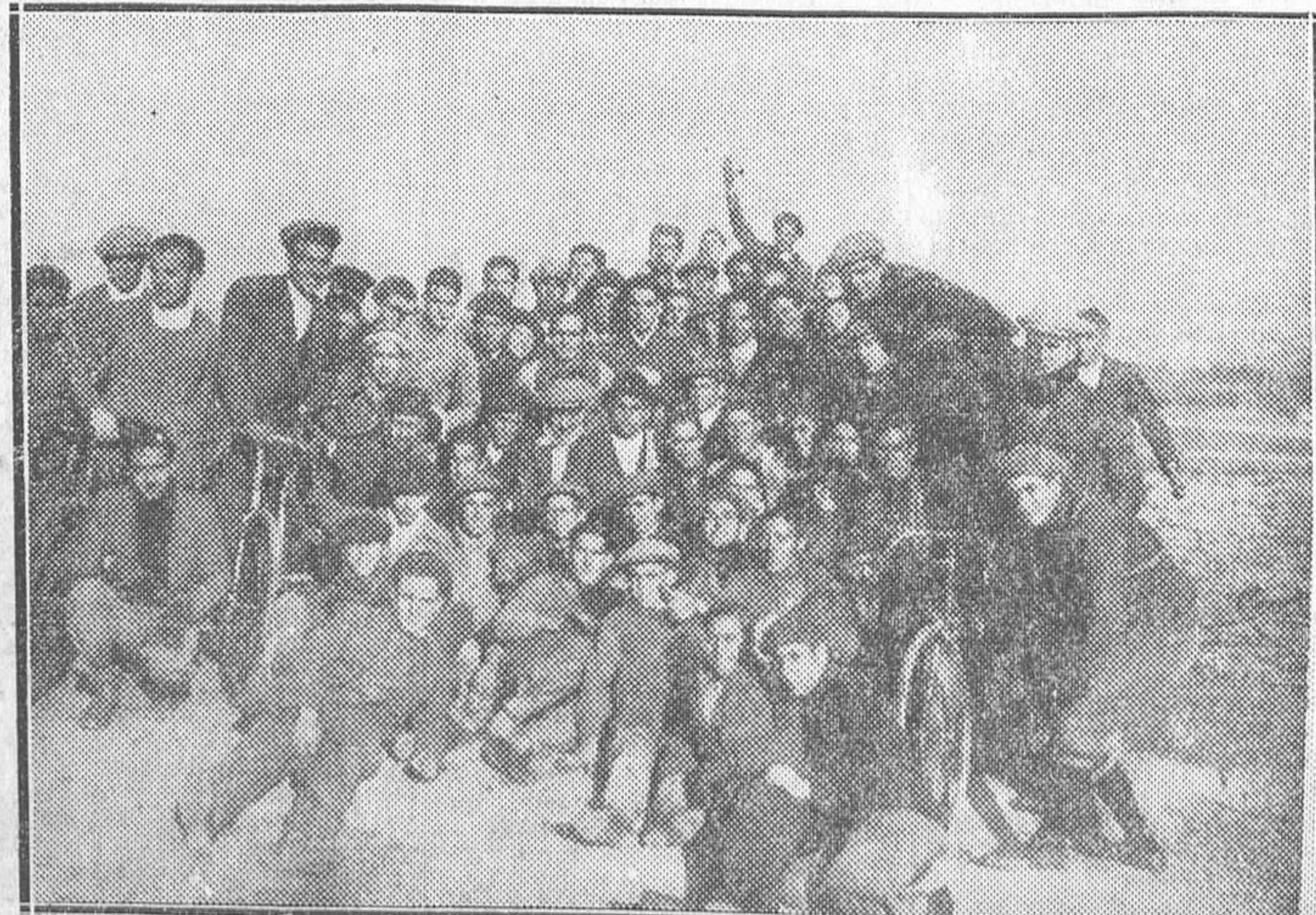
Grupo de ciclistas que participaron en la prueba de descenso sin cadena por la Cuesta de las Perdices, organizada por el Club Portillo