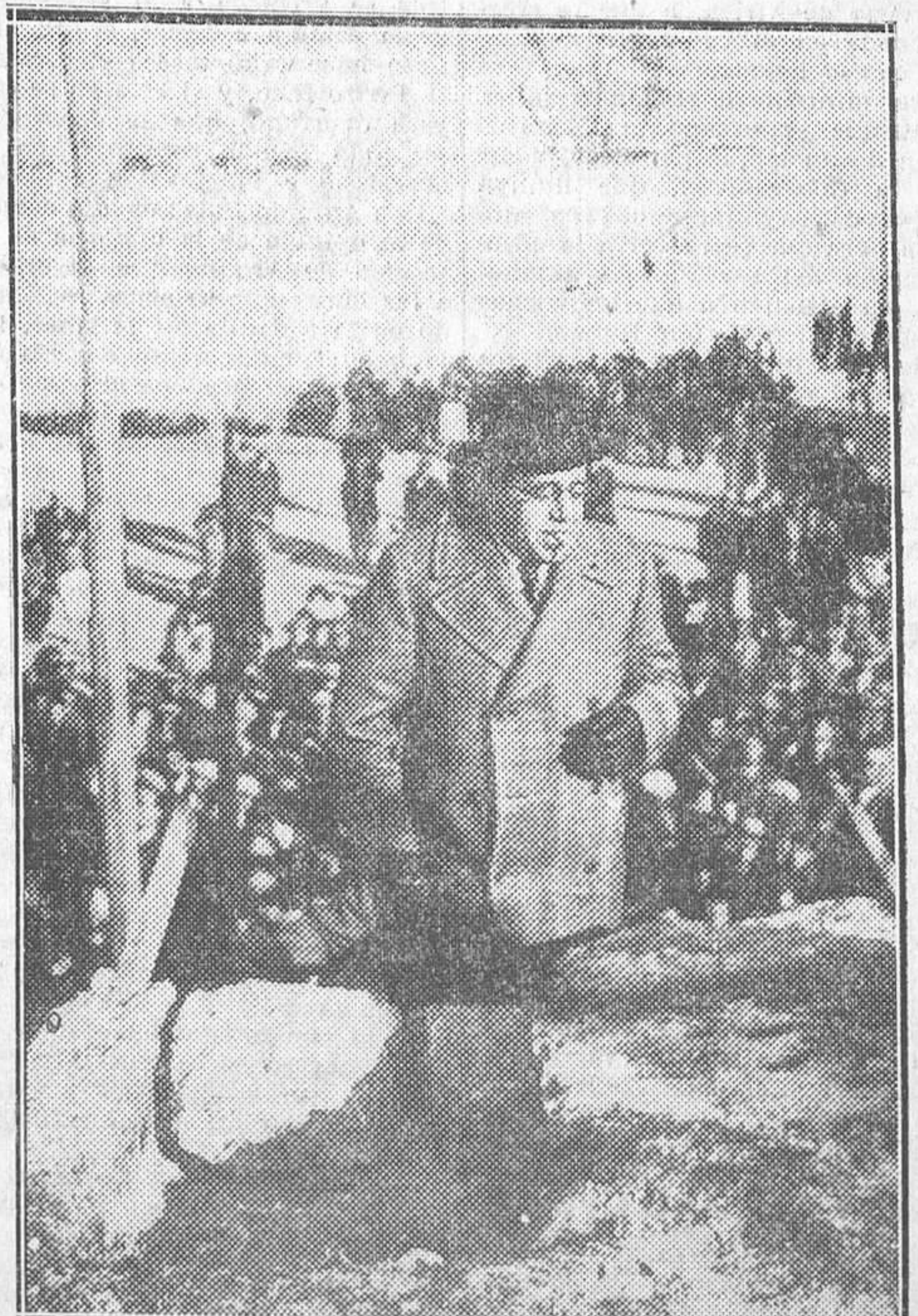
GERONA.—El jefe del Gobierno, Sr. Azaña, iniciando el derribo de las murallas de la ciudad