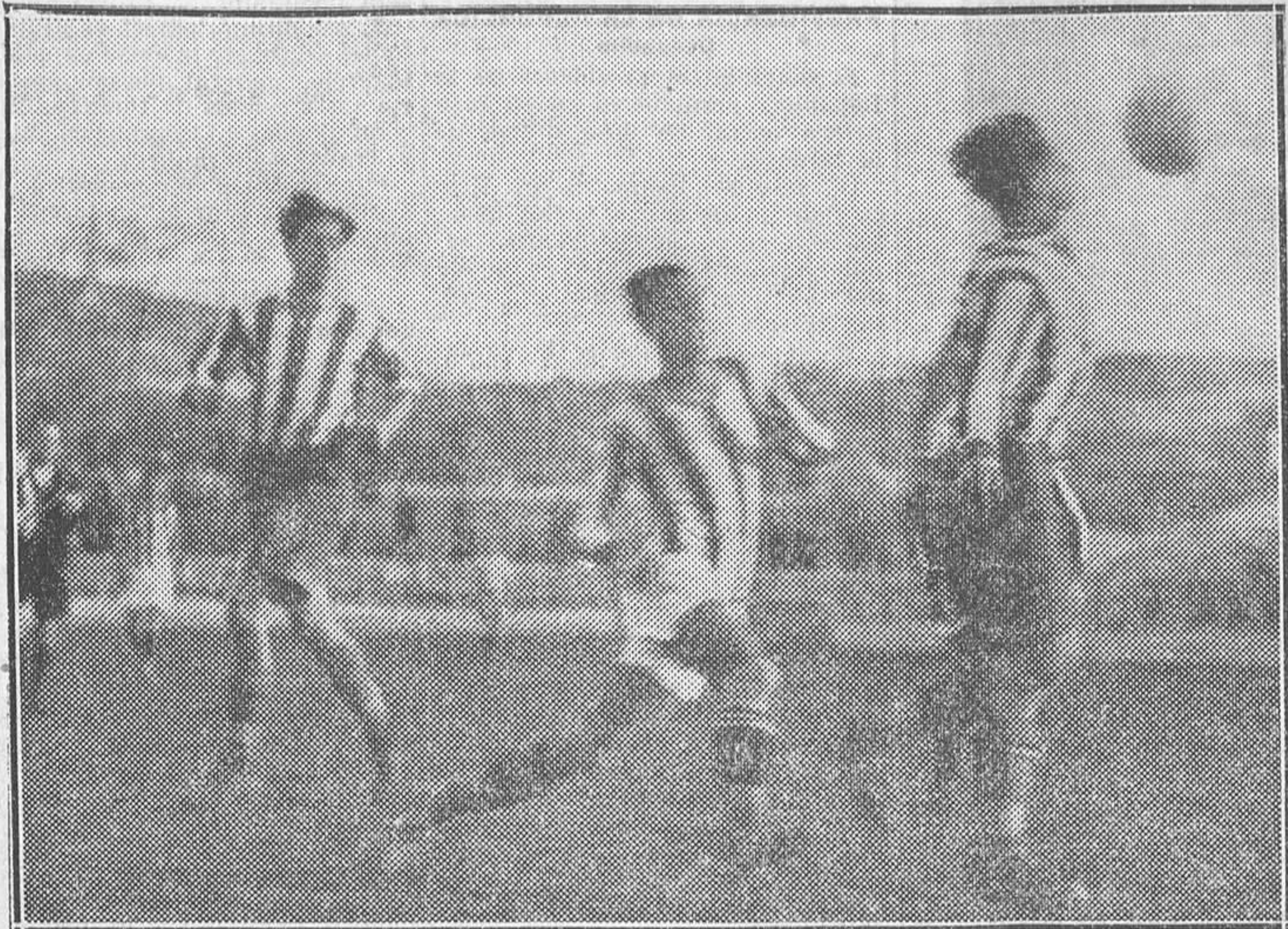
Un momento del campeonato de Liga jugado el domingo entre el Athlétic y el Castellón en el Estadio de Vallecas

Se ha hecho la selección de jugadores de Madrid que contendrán con la de Budapest