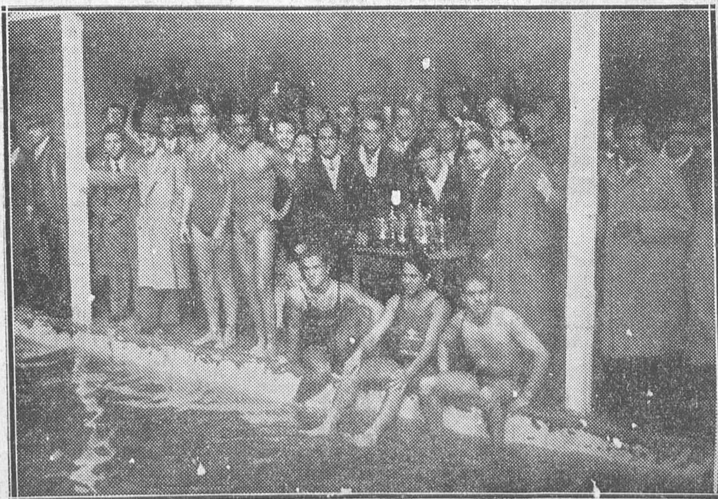
Reparto de copas a los socios del Canoe Natación Club, con motivo de la inauguración de la piscina de invierno

El Athlétic se vió obligado a presentar una alineación que dis-