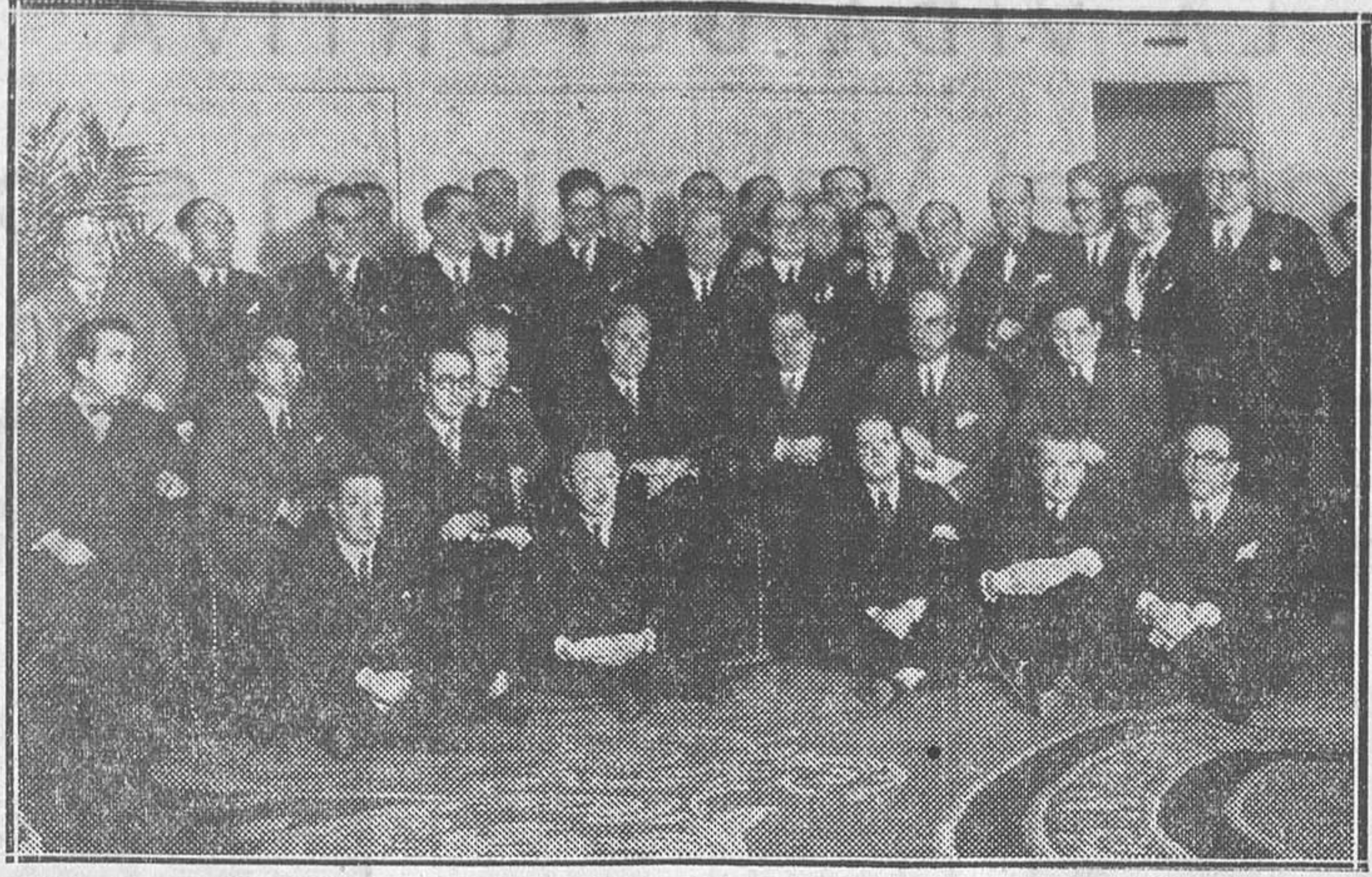
El presidente de la Cámara, Sr. Besteiro, rodeado de los periodistas que hacen información en el Congreso, después del banquete con que le obsequiaron los informadores