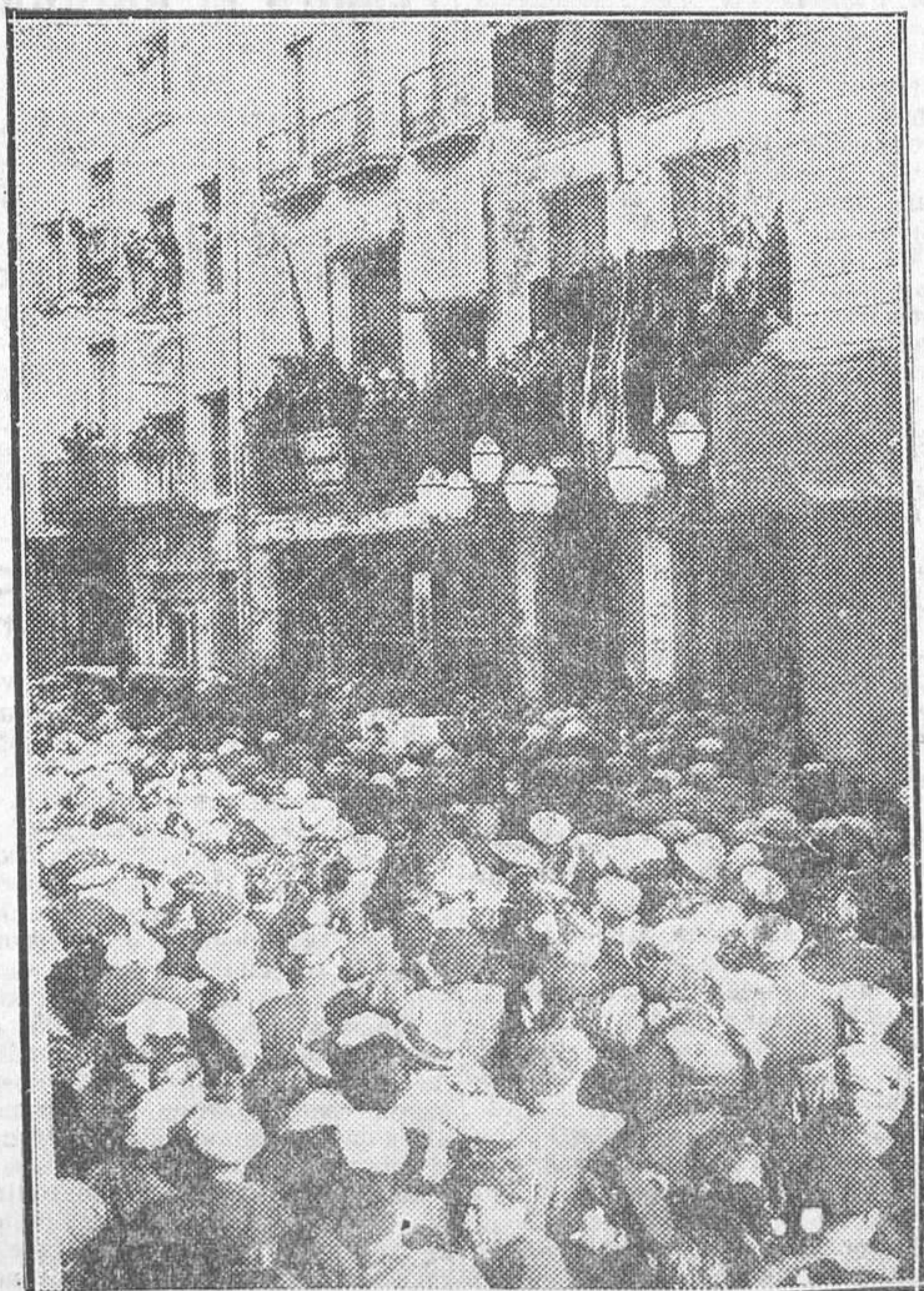
GERONA.—El jefe del Gobierno, Sr. Azaña, y el de la Generalidad, Sr. Maciá, dirigiendo la palabra al pueblo desde un balcón del Ayuntamiento, antes de hacer entrega de las murallas a la ciudad

Al salir del puerto el pesquero «Constancia» embistió a un bote que ocupaban tres tripulantes del «Manuel Calvo». El bote se fué a pique a consecuencia del fuerte encontronazo, y en auxilio de los