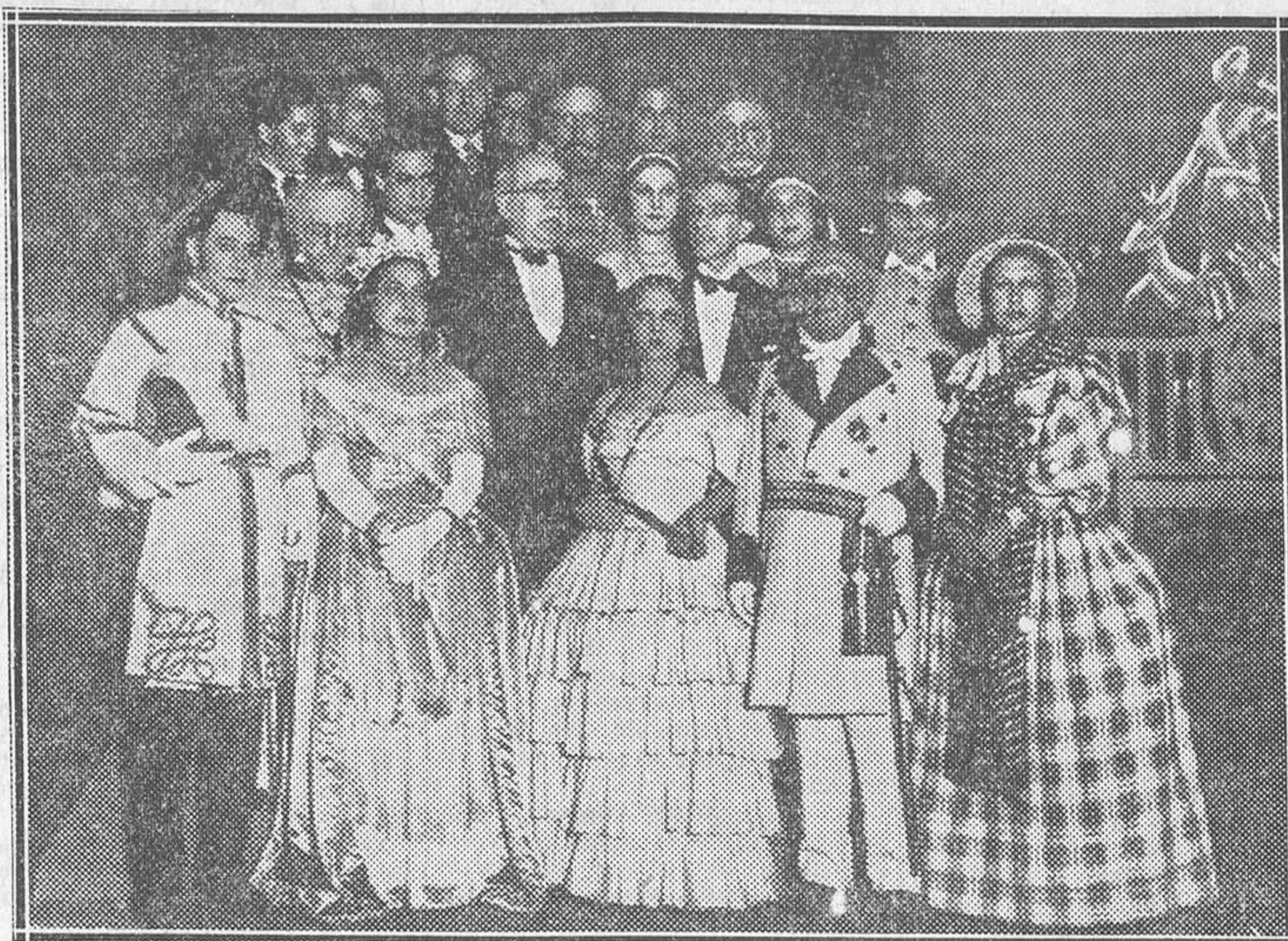
El jefe del Gobierno, Sr. Azaña, con Margarita Xirgu y los demás intérpretes de su obra teatral «La corona», estrenada en el teatro Goya, de Barcelona

ser una realidad dentro de la República, puesto que la monarquía era un obstáculo, y que se podrá dar cauce legar a la autonomía regional, que se desarrollará en beneficio del porvenir de España. Entiendo que los pueblos deben gobernarse a sí mismos, principalmente aquellos que por su cultura y por su preparación son más dignos de ello. Hoy han desaparecido los partidos tradicionales, enemigos del Estatuto de los catalanes. Yo creo que el Estatuto pasará sin dificultades, pues