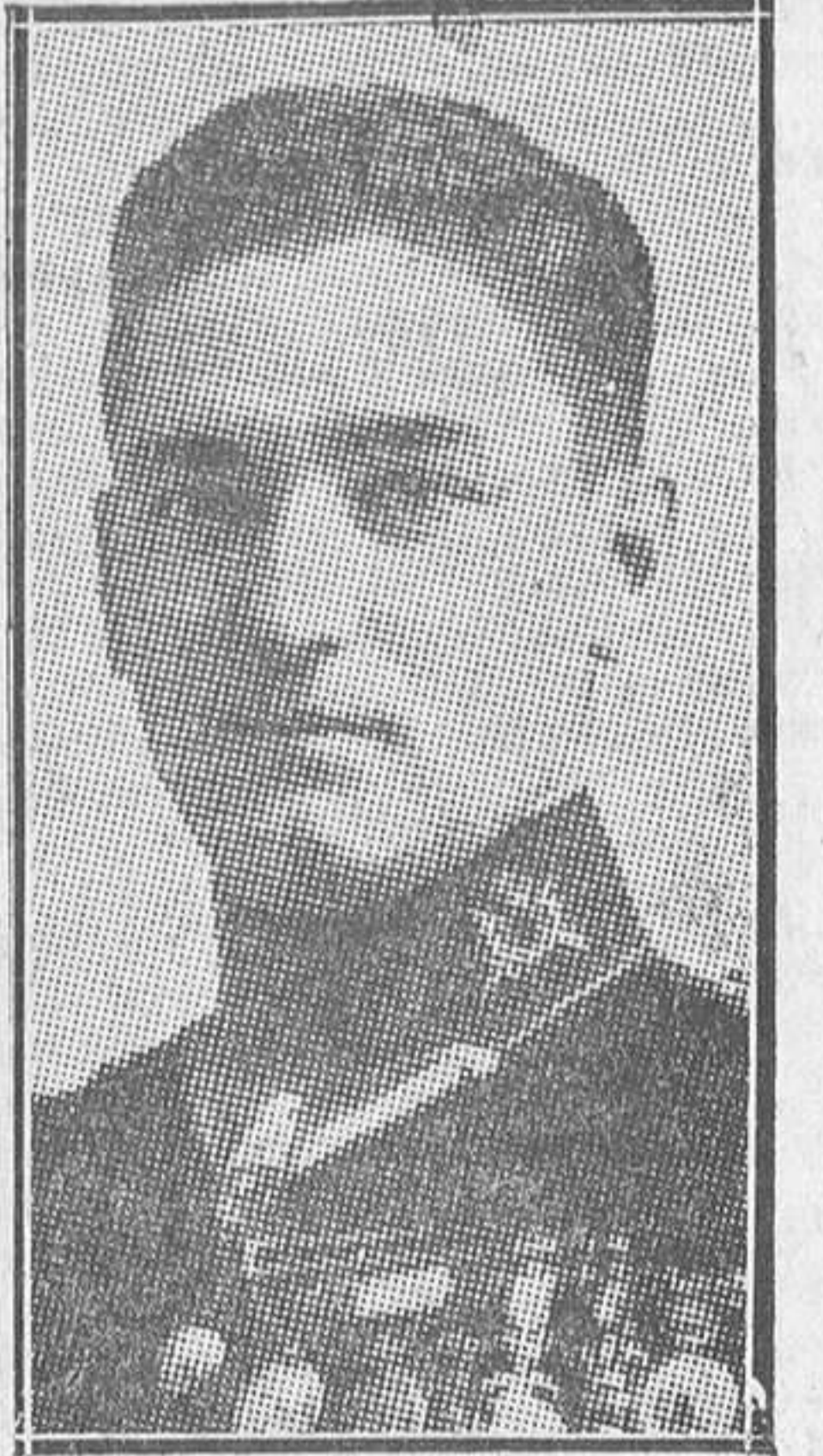
Angel García Hernández, capitán de Infantería, que secundó con entusiasmo el movimiento revolucionario de su compañero Galán y fue con él víctima de la tiranía borbónica, muriendo fusilado el día 14 de Diciembre de 1930...

Eran terremotos de eternidad, concluyen los biógrafos.