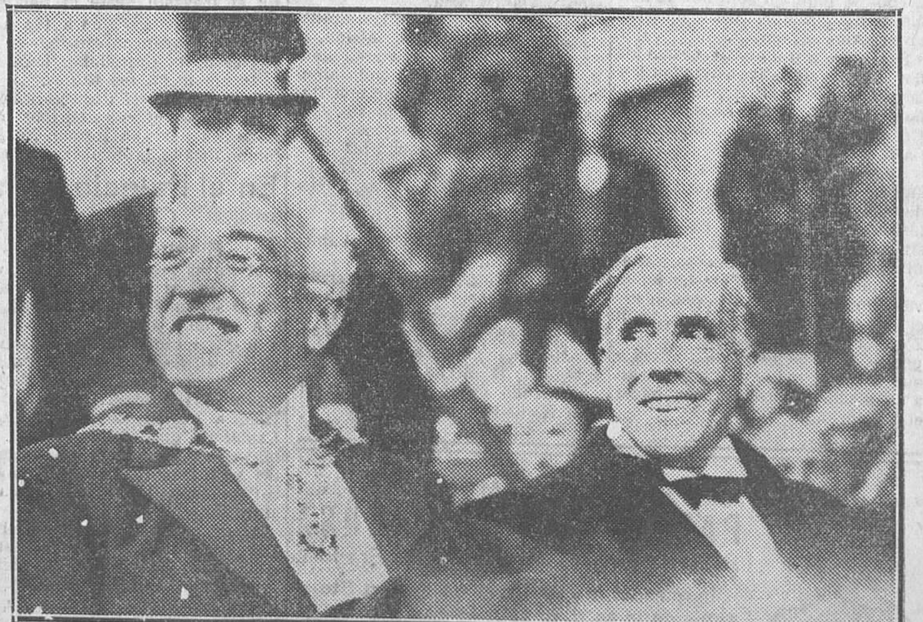
El presidente de la República, D. Niceto Alcalá Zamora, acompañado del presidente de las Cortes Constituyentes, D. Julián Besteiro, dirigiéndose al Alcázar, después de la promesa (Fot. Alfonso).