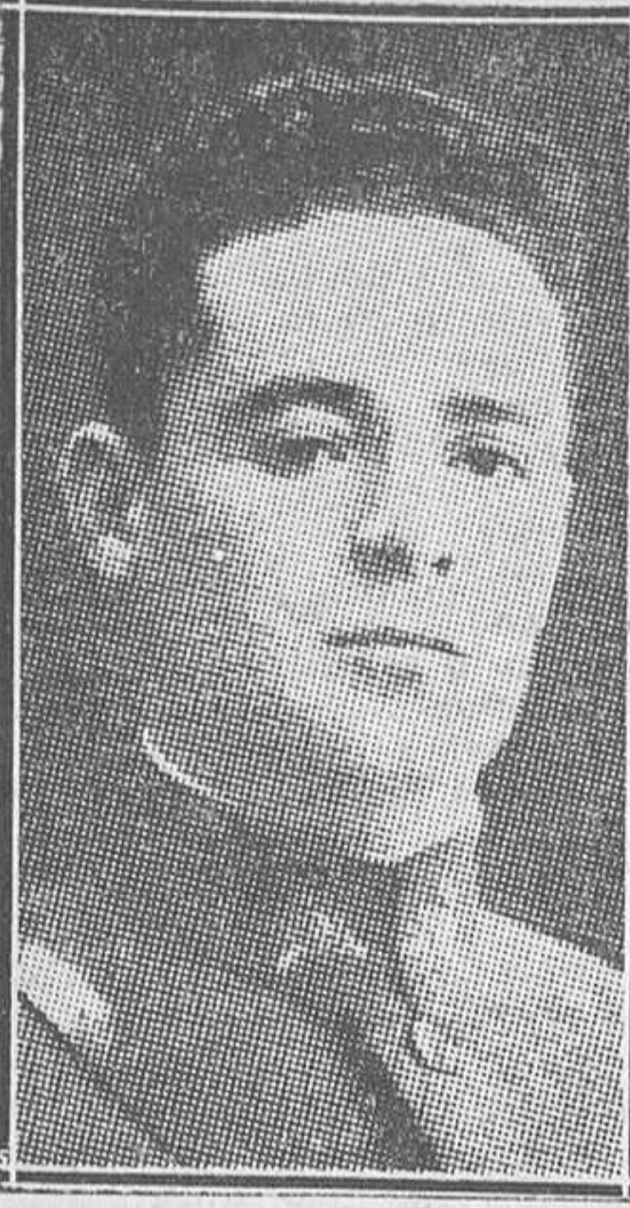
Fermín Galán, capitán de Infantería, jefe del movimiento revolucionario de Jaca el 12 de Diciembre de 1930...