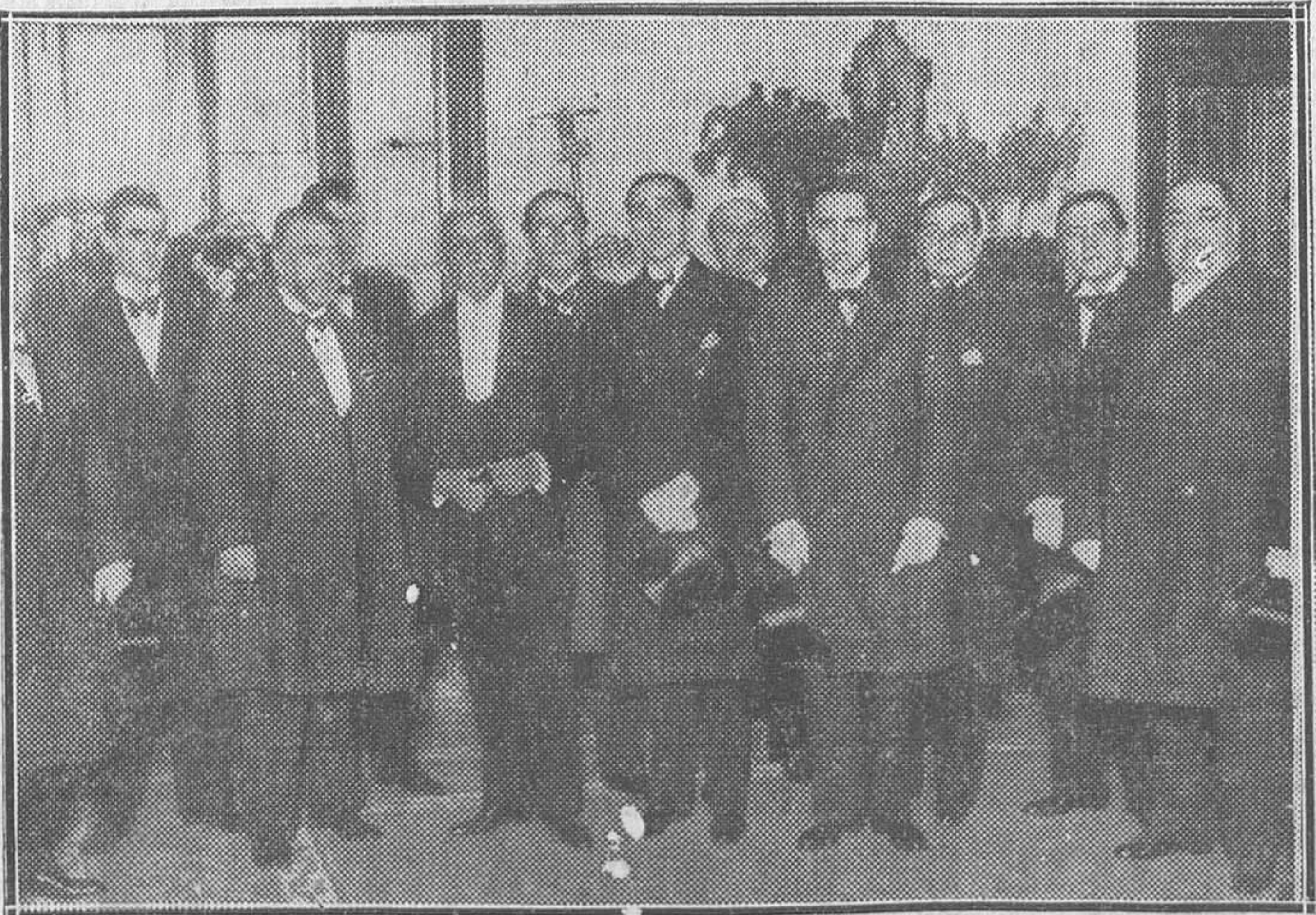
El presidente de la República, D. Niceto Alcalá Zamora, con la Comisión parlamentaria que fué a su casa para acompañarle al Congreso (Instantánea obtenida por Alfonso momentos antes de salir de su domicilio el presidente para prometer su cargo).