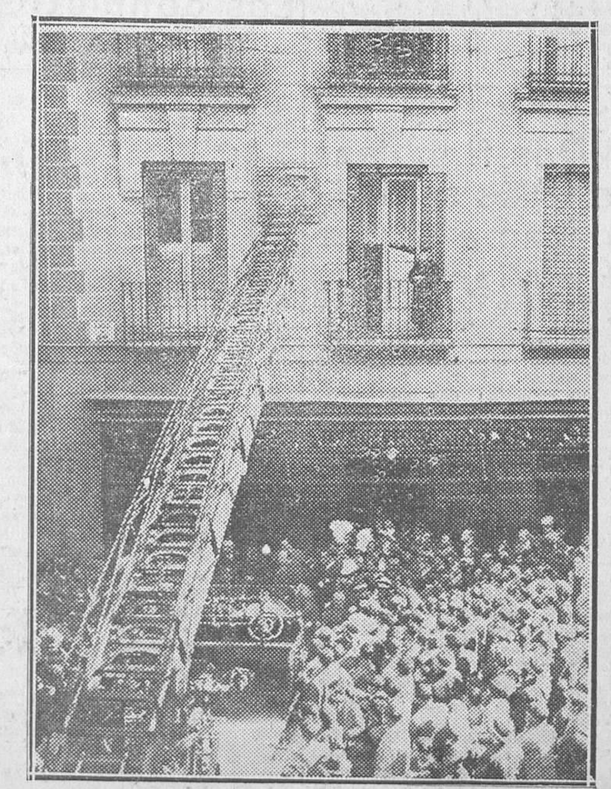
El alcalde de Madrid, D. Pedro Rico, y la representación del Ayuntamiento, en el momento de descubrir la lápida dedicada a Jaime Vera, en la calle de León, núm. 1, acto celebrado ayer ante numeroso público.