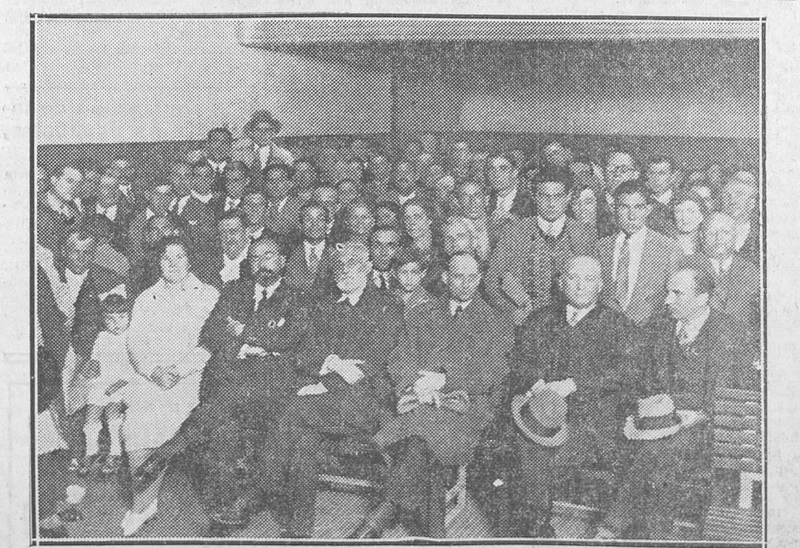
Los ministros de Trabajo, Justicia y Gobernación y D. Miguel de Unamuno en la inauguración del salón grande de la Casa del Pueblo de Madrid, decorado por el Sr. Quintanilla.