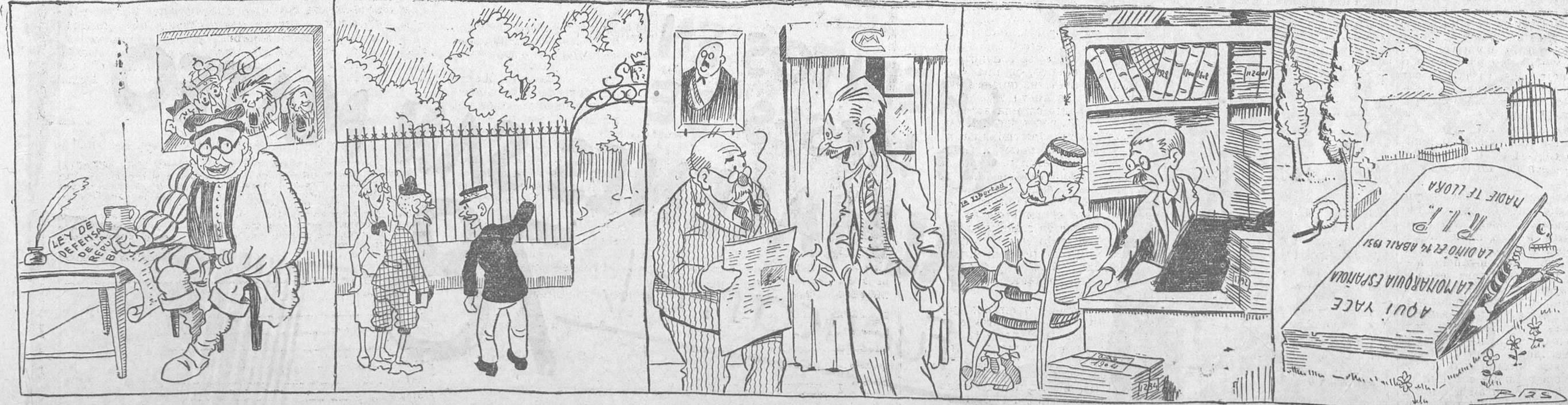
—¡Cuán gritan esos malditos, pero mal rayo me parta si en terminando esta carta no pagan caros sus gritos!