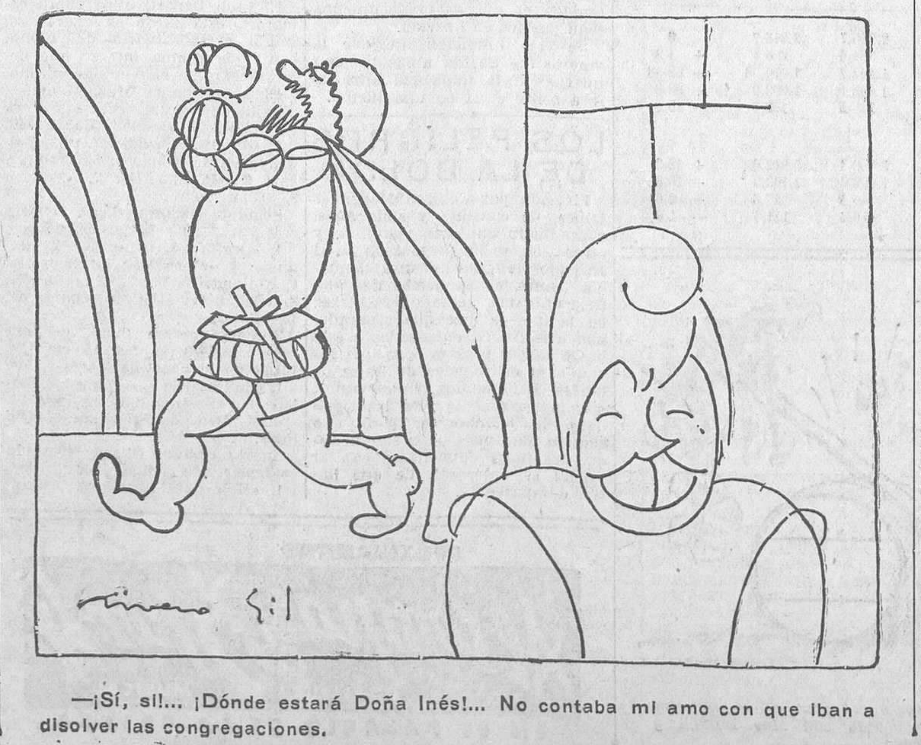
—¡Sí, sí!... ¡Dónde estará Doña Inés!... No contaba mi amo con que iban a disolver las congregaciones.

A los yanquis les parece bien que les paguen Nueva York, 31.—La noticia de que el Banco de Inglaterra había anunciado su propósito de reembolsar 20.000.000 de libras esterlinas a cuenta de los dos créditos a corto plazo de 25.000 libras cada uno concedidos al Banco por el Banco de Francia y el Banco Federal de la Reserva, de Nueva York, ha producido muy favorable impresión en los círculos bancarios y financieros de esta capital.