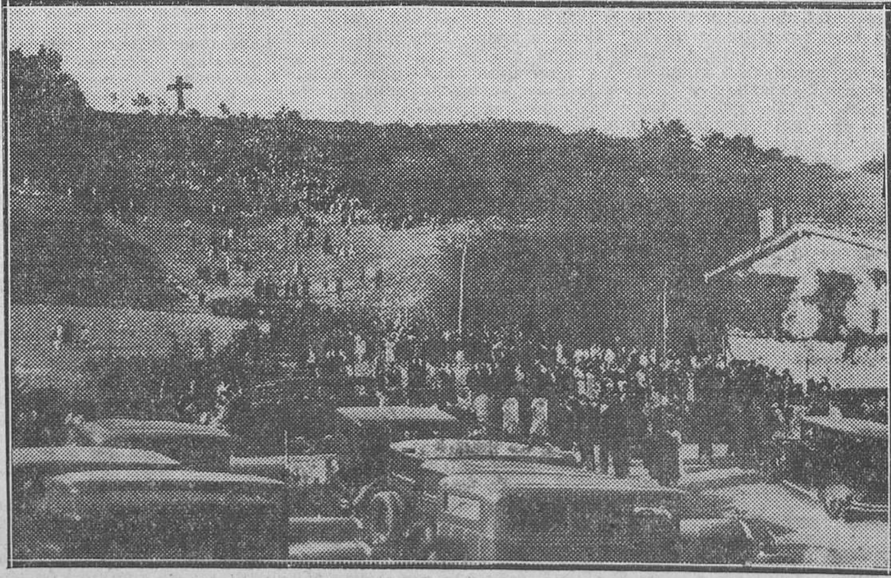
El magnífico lugar de Ezquilog a que se refiere nuestro compañero Sivral en otra parte de este número.