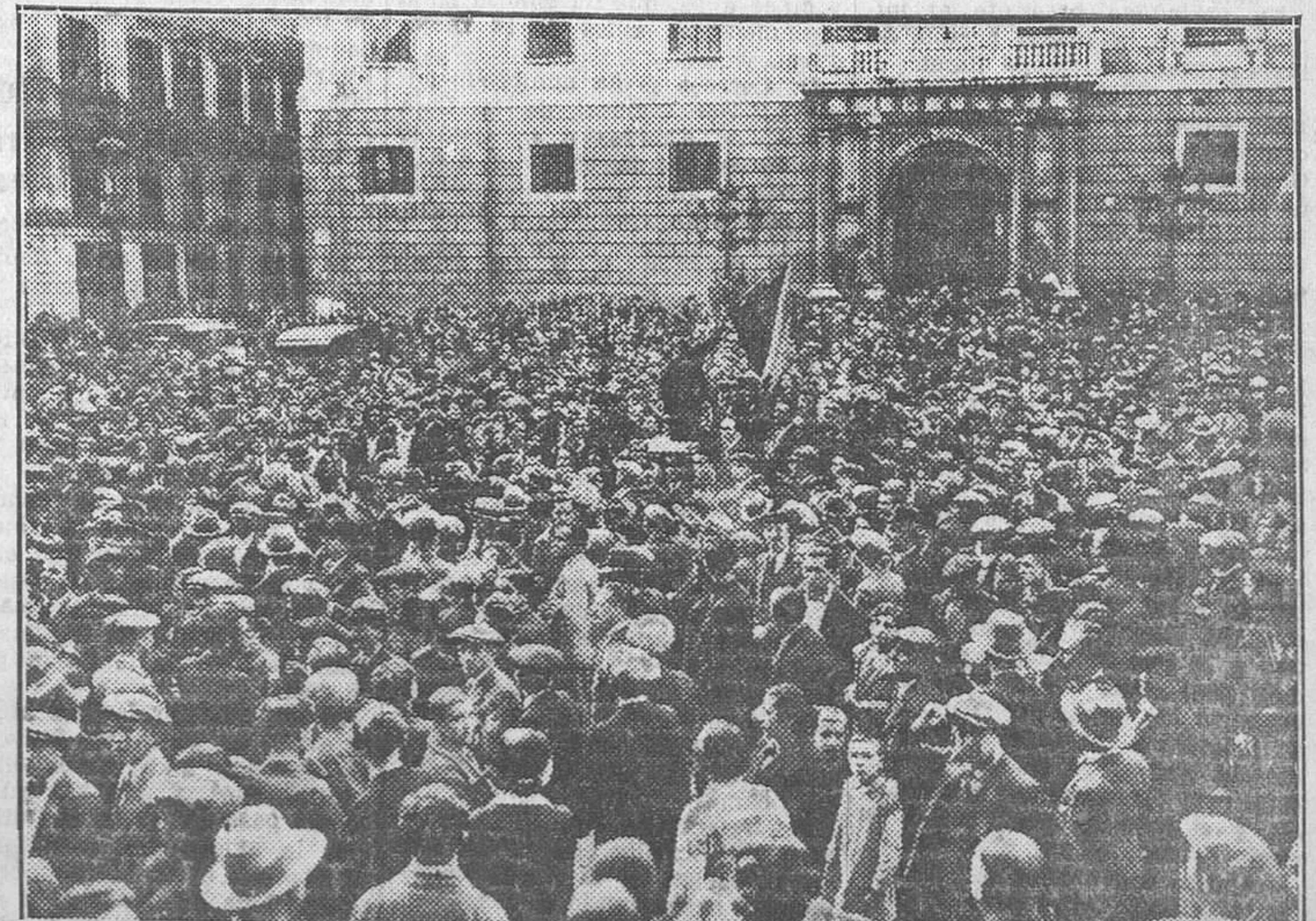
BARCELONA.—Imponente manifestación de entusiasmo popular con motivo de la proclamación de la República