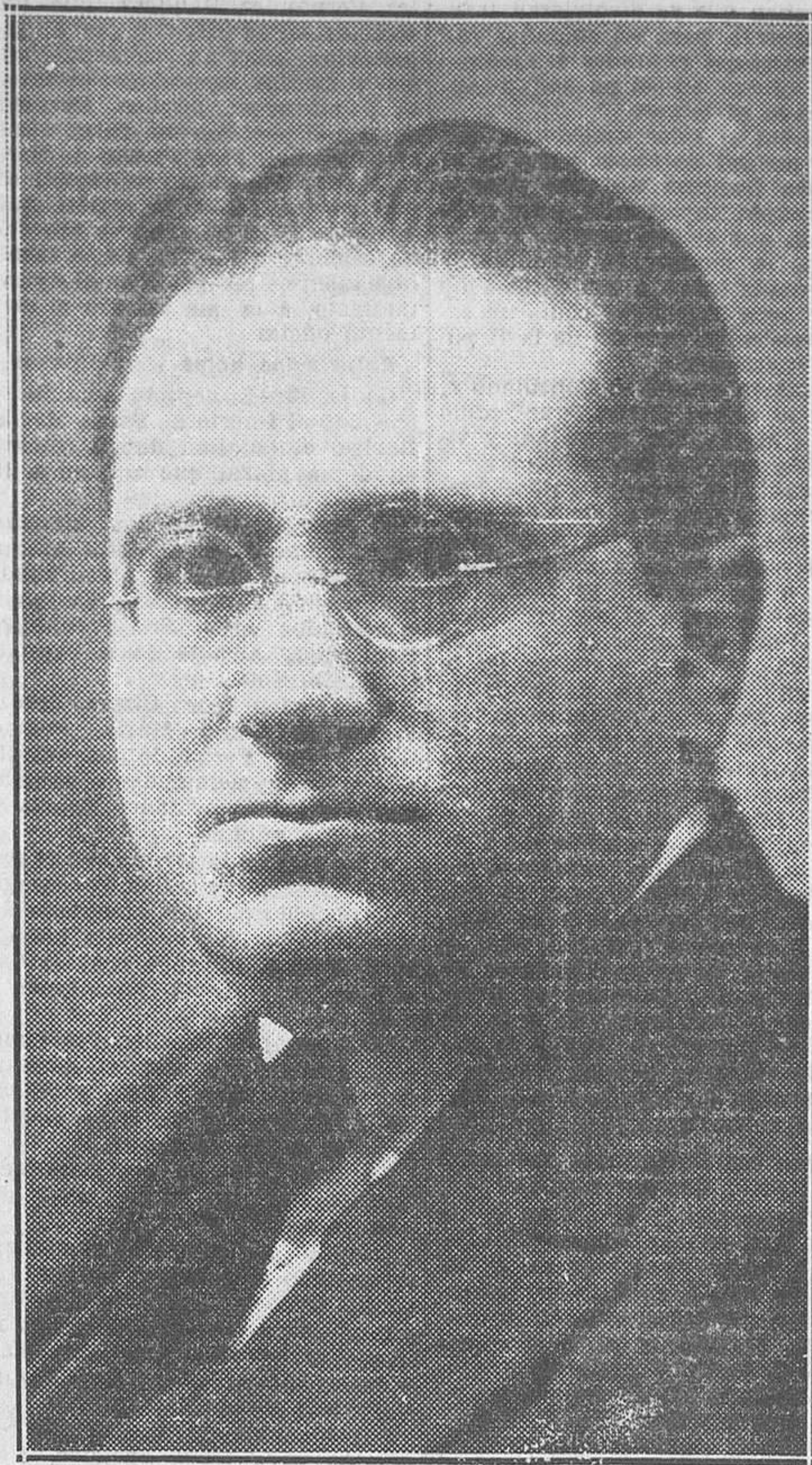
Don Luis Araquistain, subsecretario del ministerio de Trabajo

Ceuta, 23.—El jefe encargado del mando de las fuerzas militares de Marruecos ha dirigido un telegrama de adhesión de algunos jefes de los Cuerpos de este territorio, y como quiera que los demás jefes hicieron presente los mismos sentimientos generales de la circunscripción ya a él, como reiteradamente comunicó al ministro de la Guerra, manifiesta que los jefes de Cuerpo lo hacen en nombre de todos, por entender es el llamado a hacerlo, ya que hasta en detalles sin importancia quiera que este Ejército, de cuya adhe-