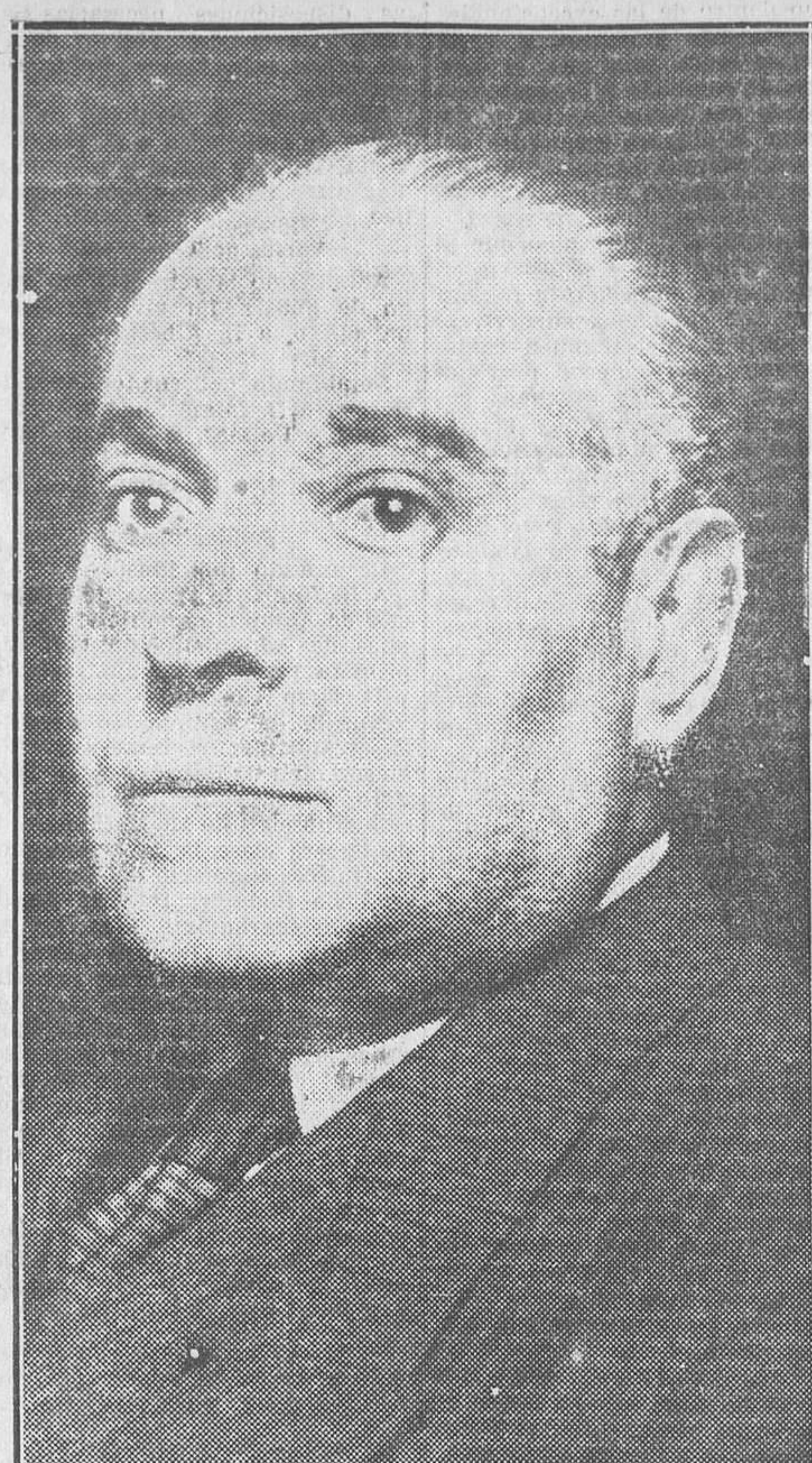
Don Isidoro Vergara, subsecretario del ministerio de Hacienda

El nuevo subsecretario de Hacienda será, ello es indudable, el colaborador más idóneo e indicado del ministro, porque se serenidad, inteligencia y competencia le dan medios para afrontar y resolver los más graves problemas y las más difíciles soluciones.