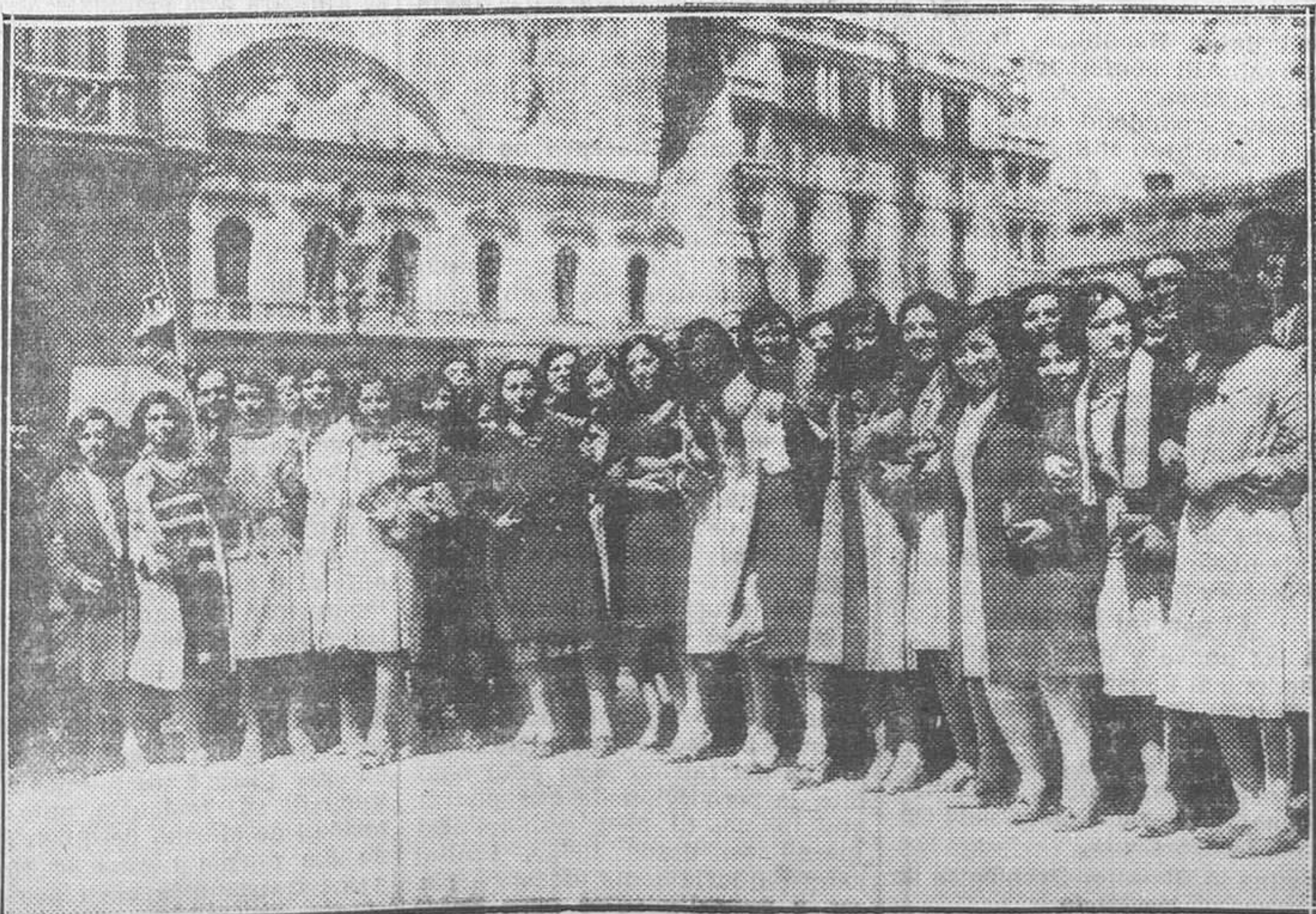
ZARAGOZA.—Grupo de encantadoras modistas celebrando la proclamación de la República

La unión de la Dirección del Instituto Geográfico y Catastral con la Dirección de Estadística es de toda lógica. Estuvieron unidas durante más de medio siglo para cumplir los fines de su fundación, que fueron realizar la estadística de las personas y de las cosas. Claro está que esta estadística, las de las cosas, lleva anejo el servicio geográfico, que por su importancia intrínseca da el nombre principal al Instituto. La estadística de las propiedades rústicas y