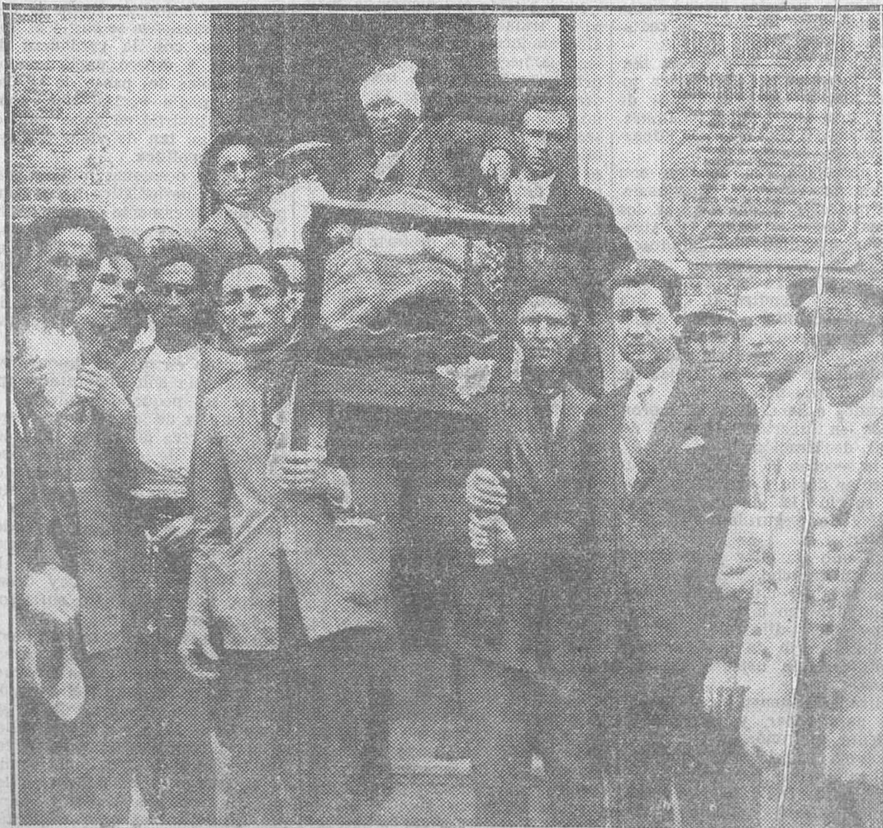
He aquí una verdadera procesión cívica. Un obrero, impedido de ir por su pie a votar, es llevado en andas por sus camaradas para que emita el sufragio en un colegio electoral del barrio de Entrevías, de Vallecas. Fué un espectáculo que llenó de emoción y de respeto a cuantos lo presenciaron, y que da una idea de fervor ciudadano con que ha resucitado el pueblo español.

A medida que se van conociendo los resultados de los escrutinios, la gente se recoge; el pueblo,