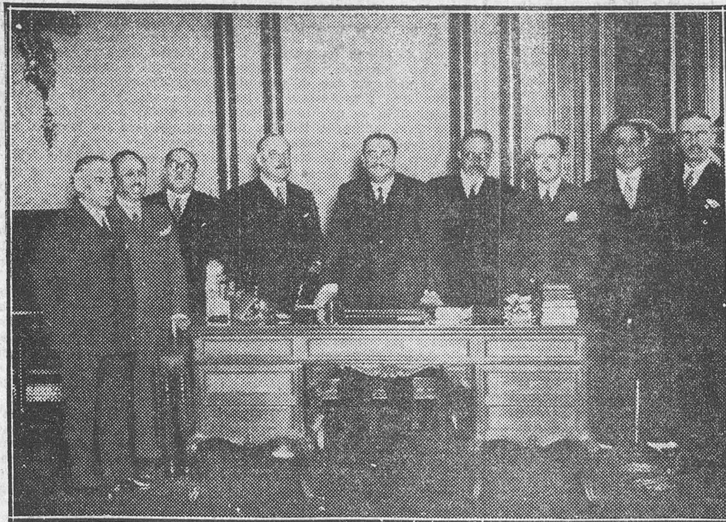
El general Berenguer y los ministros del Gobierno dimisionario, reunidos para cambiar las penúltimas impresiones

Las cosas se destacan; las distancias se acortan, y el conflicto político español quedará planteado, quíerase o no, con toda la concisión y claridad que impo-