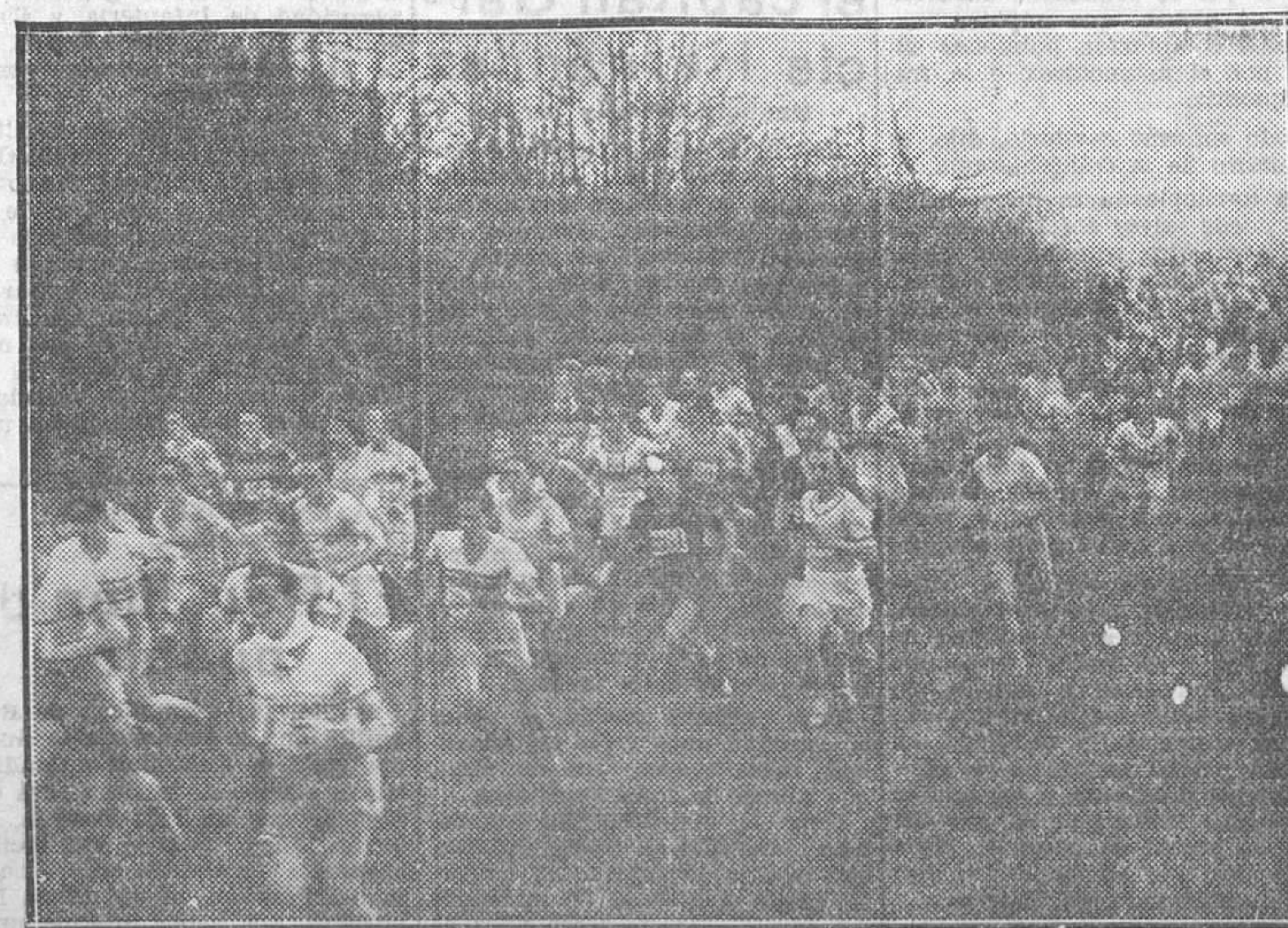
Salida de los participantes del campeonato de París de cross-country