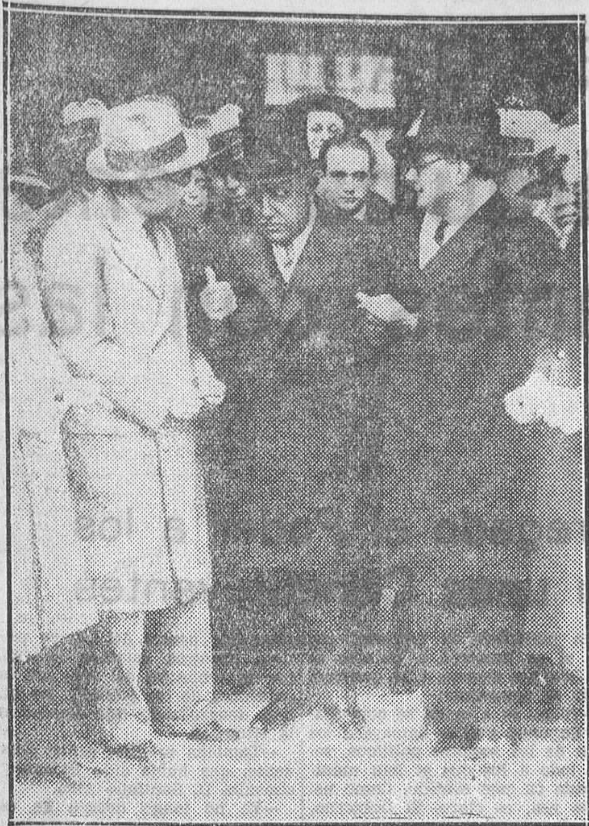
El duque de Maura conversando con los periodistas al abandonar el Alcázar (Fot. Alfonso.)

do de momento la convocatoria. No hay más noticias que les pueda comunicar. Las noticias no están ahora aquí, sino en otro lado. Estoy fastidiado por mi enfermedad, pues no me puedo mover de aquí.