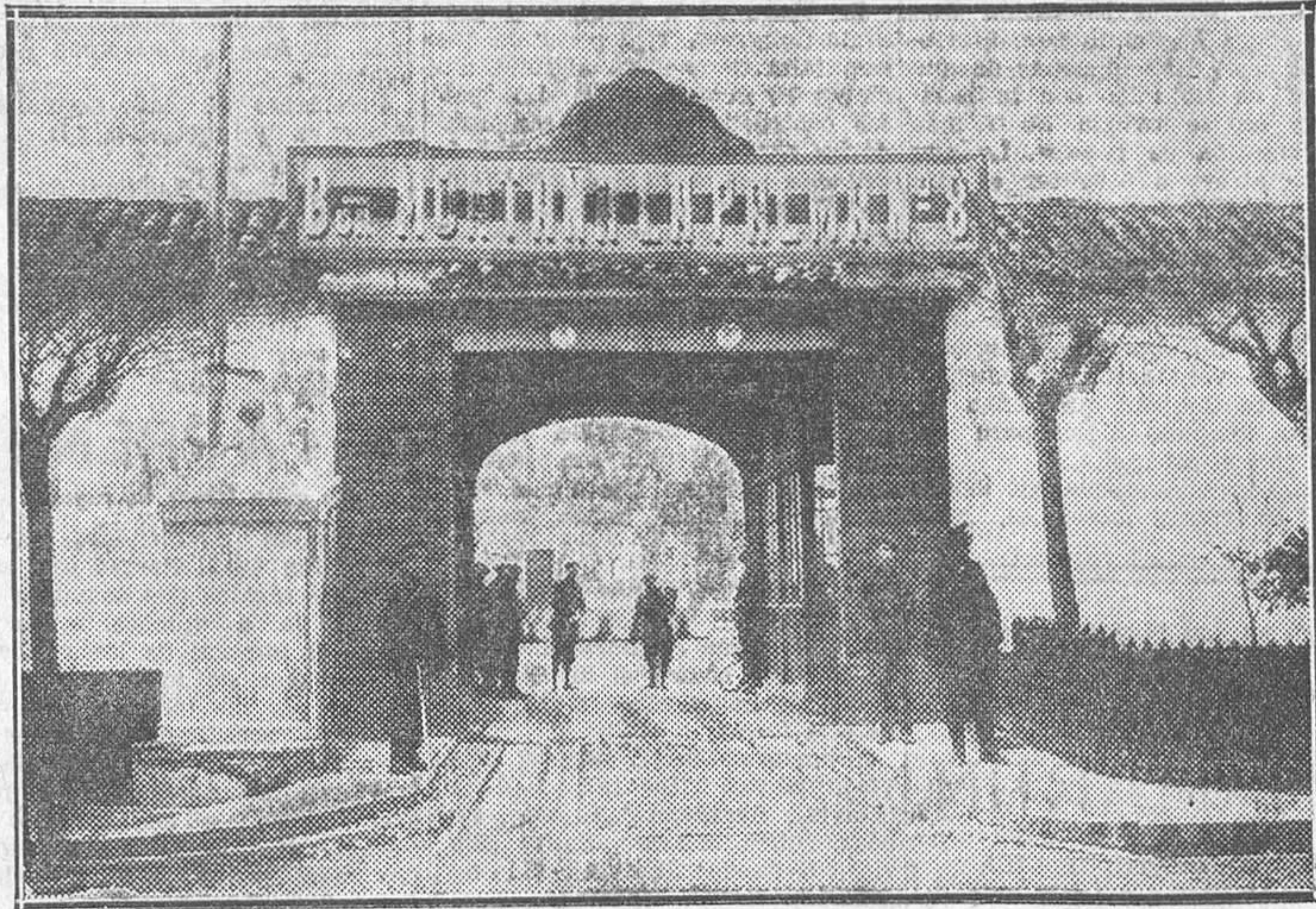
Cuartel del batallón de montaña de La Palma, en Jaca, asediado por los sublevados del regimiento de Galicia, y del que salieron las tropas que en él se alojaban para sumarse a la rebelión (Fot. Martín Chivite.)

causando dolor. MANUEL CASANOVA Aragón, Febrero, 1931. (Se continuará.)