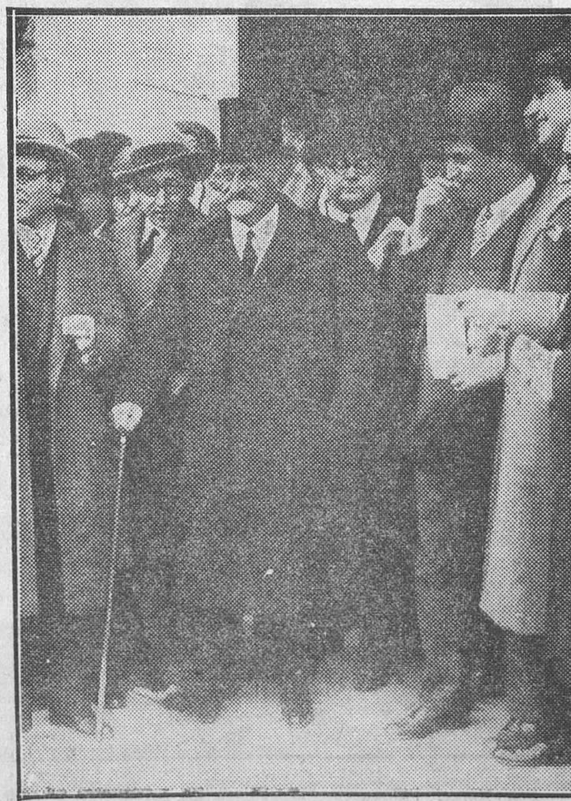
El conde de Romanones «posando» ante los fotógrafos, en la puerta de Palacio

—Sí, desde luego. Se ha enviado ya a Palacio un decreto aplazan-