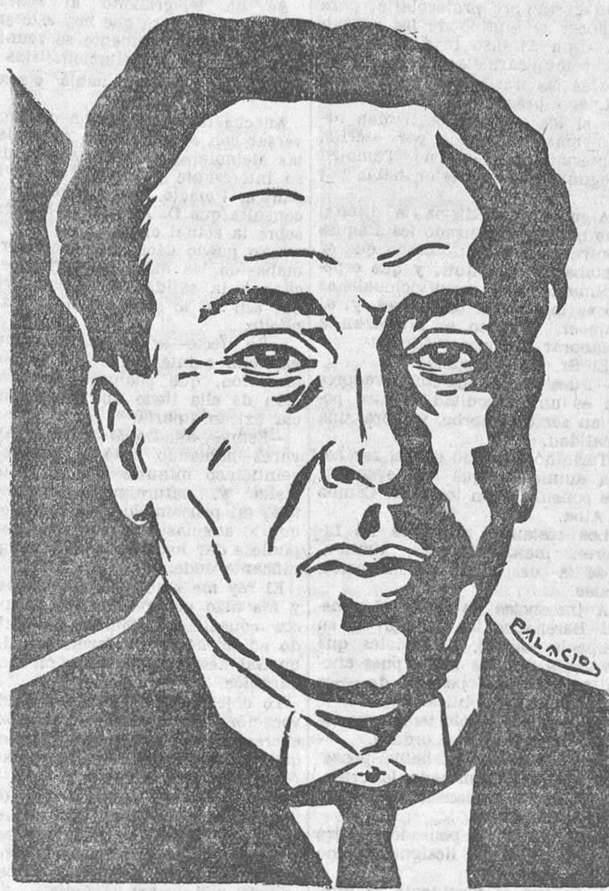
Don Antonio Machado (Dibujo de Palacios)

mación de sí mismo. «No quiero en ningún momento dejar de ser escritor. No quiero dejar de ser como soy. Creo que desde que el Mundo es Mundo todo esfuerzo humano se ha orientado hacia la libertad. Lo grave es ponerse de acuerdo acerca de qué es la libertad. Cuando se habla del amor, todos saben a qué atenerse. En cuanto a la libertad, las interpretaciones son múltiples.»