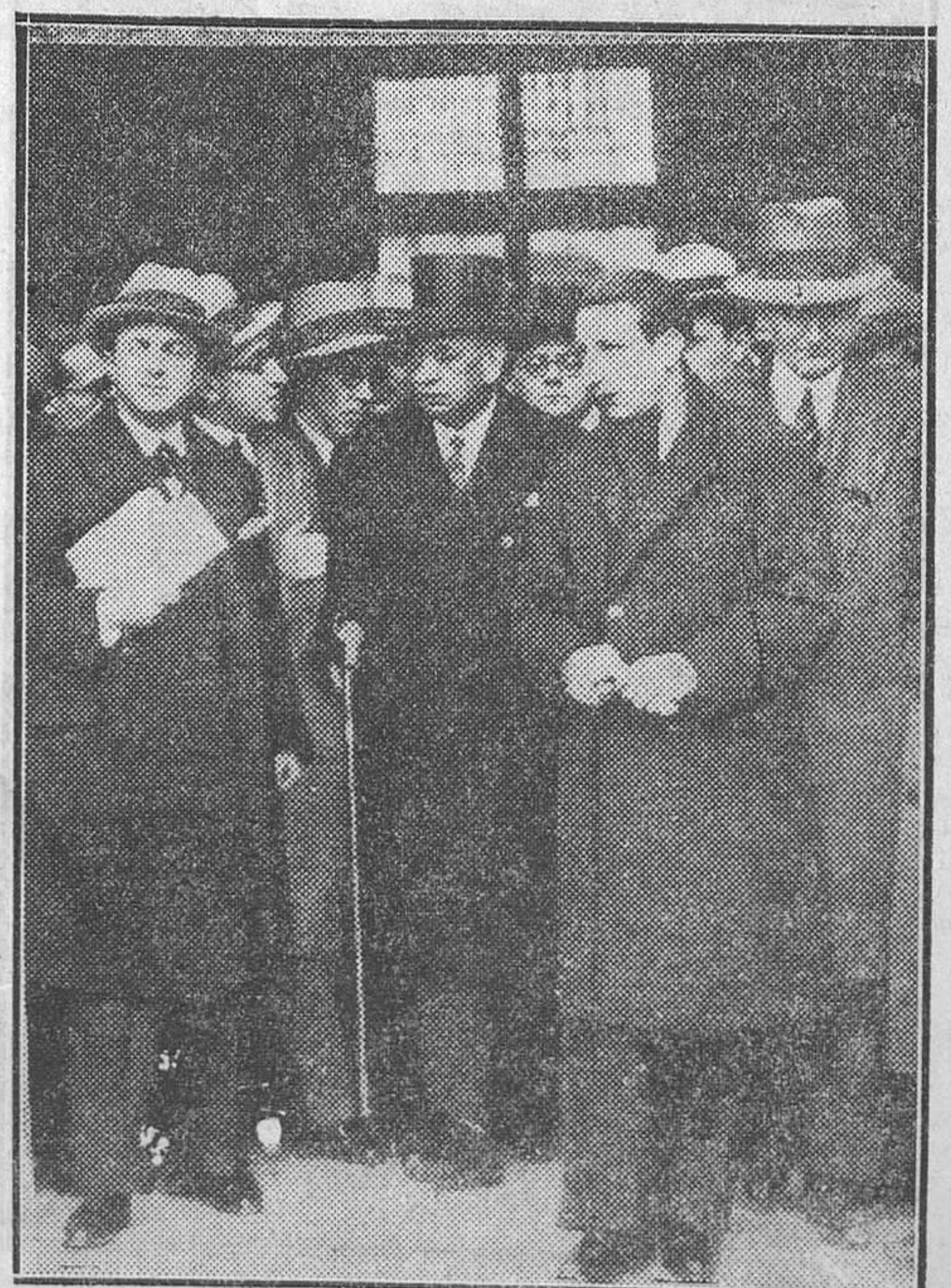
El marqués de Alhucemas hablando a los periodistas de su entrevista con D. Alfonso